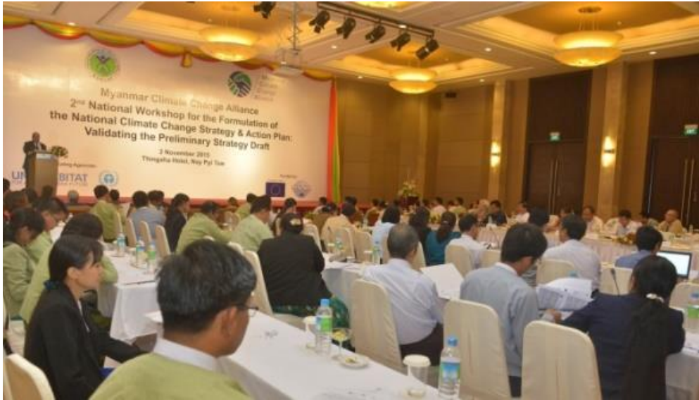
ပုံ - ၅ ။ ဒုတိယအကြိမ်အမျိုးသားအဆင့် အလုပ်ရုံဆွေးနွေးပွဲ (၂၀၁၅ ခုနှစ် နိုဝင်ဘာလ ၂ ရက်၊ နေပြည်တော်)