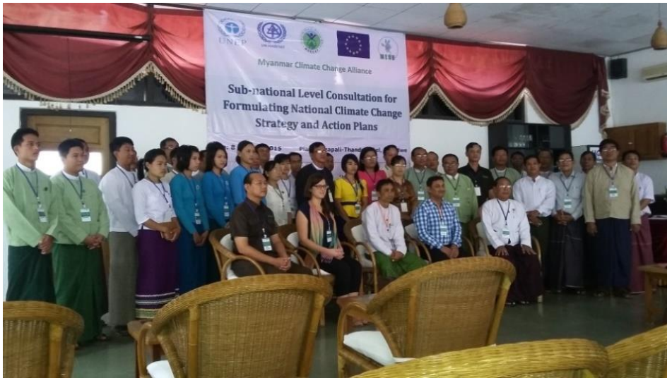
ပုံ - ၄ ။ ဒေသဆွေးနွေးပွဲတက်ရောက်သူများ (၂၀၁၅ ခုနှစ် အောက်တိုဘာလ၊ သံတွဲ)