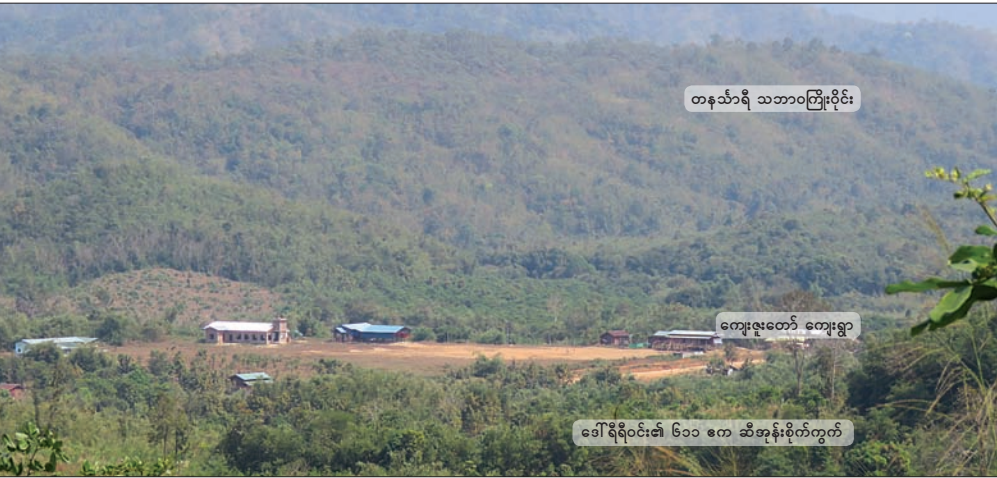
ပုံ - ၇ ဆီအုန်းစိုက်ခင်းမြေများနှင့် တနင်္သာရီ သဘာဝသစ်တောမြေအကြား ကြားညှပ်နေသော ကျေးဇူးတော်ရွာ

ယင်းအပြင် ၂၀၀၈ ဖွဲ့စည်းအုပ်ချုပ်ပုံ အခြေခံဥပဒေတွင် နိုင်ငံသားတိုင်း၏ ပစ္စည်းဥစ္စာပိုင်ဆိုင်ခွင့်ကို အကာအကွယ်ပေးထားသည်။ ၂၀၁၆ အမျိုးသားမြေယာဥပဒေတွင်လည်း ပြည်တွင်းစစ်ကြောင့် မြေယာနှင့် အရင်းအမြစ်များဆုံးရှုံးခဲ့ရသော တိုင်းရင်းသားလူမျိုးများသည် နိုင်ငံတကာ ဥပဒေနှင့် အညီ ၎င်းတို့၏ မြေယာနှင့် ပစ္စည်းဥစ္စာများကို ပြန်လည်ရရှိပိုင်ခွင့် ရှိကြောင်း ဖော်ပြထားသည်။ သို့သော် စစ်ဘေး ဒုက္ခသည် အဖြစ်မှ ပြန်လည်ရောက်လာကြသော ကျေးဇူးတော်ရွာသားများမှာ ယင်းအခွင့်အရေး ဆုံးရှုံးနစ်နာလျက်ရှိသည်။