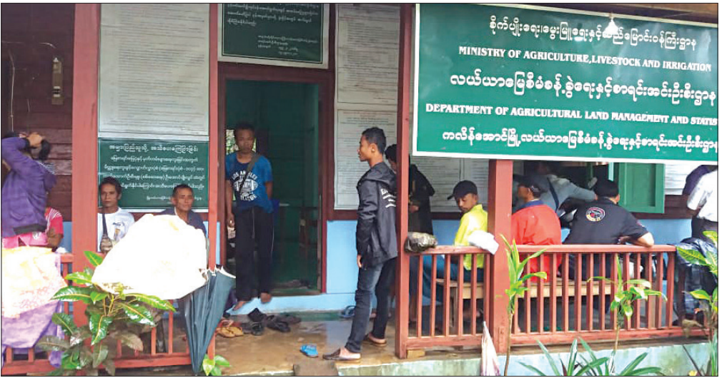
ပုံ-၅။ ကျေးဇူးတော်ရွာသားမြေ မြေစာရင်းရုံးတွင် စောင့်ဆိုင်းနေရပုံ