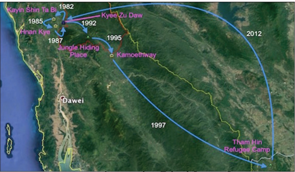
ပုံ - ၁။ ကျေးဇူးတော်ရွာသားများ ပဋိပက္ခကြောင့် ထွက်ပြေးခဲ့ရသော မြေပုံ

ရေဖြူမြို့နယ်ရှိ အခြားသော ကျေးရွာအများအပြားကဲ့သို့ပင် ကျေးဇူးတော်ရွာမှာ ပြည်တွင်းစစ်ဘေးဇုန်ကို ဆိုးရွားစွာခံစားခဲ့ရသည်။ ယင်းနေရာတွင် စစ်ပွဲ အရှိန်မြင့်တက်လာပြီးနောက် ကျေးရွာသူကျေးရွာသားများမှာ ၁၉၈၂ ခုနှစ်တွင် ကျေးရွာကို စတင် စွန့်ခွာခဲ့ရသည်။ ကျေးရွာမြေနှင့် ပတ်ဝန်းကျင်တောတောင်များအတွင်း လေးနှစ်တာမျှ ကျီးလန်စာစား နေခဲ့ရပြီးနောက် ၁၉၉၂ ခုနှစ်တွင် ကျေးရွာကို လုံးလုံးစွန့်ခွာထွက်ပြေးခဲ့ရသည်။ ပြောင်းရွှေ့စွန့်ခွာခဲ့ရသော ရွာသားများမှာ အစုလိုက် အစုလိုက် ကွဲသွားခဲ့ကြပြီး အချို့မှာ ဘန်းချောင်းနှင့် ကမိုသွေးတို့ အနီးတွင် မိသားစုဝင်များနှင့်အတူ နေထိုင်ခြင်း၊ အချို့မှာ ထိုင်း-မြန်မာ နယ်စပ်တို့ ဒုက္ခသည်အဖြစ် ထွက်ပြေးခြင်းတို့ ရှိခဲ့ကြသည်။