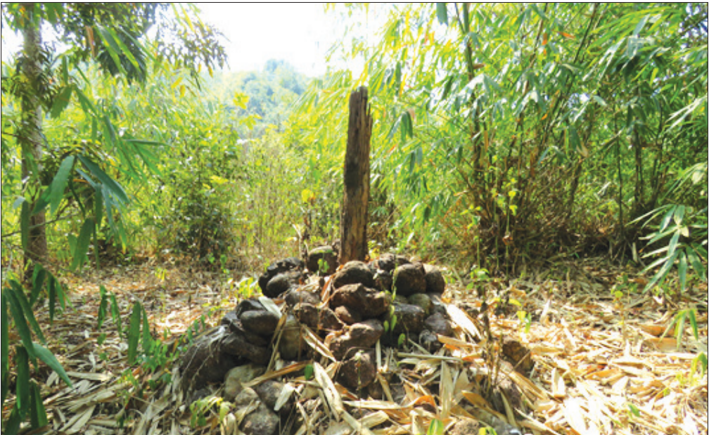
ပုံ -၃၊ ကျေးဇူးတော်ရွာအတွင်းရှိ TNRP မှတ်တိုင်

“အခု ကျွန်တော်တို့မှာ တောင်ယာမရှိ၊ ဆန်မရှိ နဲ့ အကြွေးကျနေပြီ” - ကျေးဇူးတော် ရွာသားတစ်ဦး