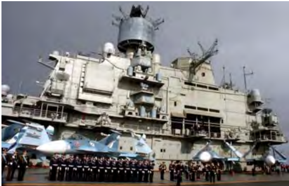
ဇန်နဝါရီလ ၈ ရက်နေ့က ဆီးရီးယားဆိပ်ကမ်းမြို့တာတစ်ခုသို့ ရောက်ရှိလာခဲ့သော ရုရှားလေယာဉ်တင်သင်္ဘော