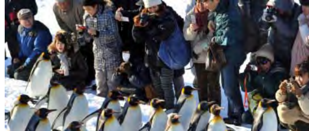
ဂျပန်မြောက်ပိုင်း ဟော့ကိုင်းဒိုးကျွန်းရှိ အဆာဟိကာဝမြို့ အဆာရှိယာဟတ်ရွာနံရံတွင် နှင်းဖုံးသောလမ်းပေါ်တွင် ပင်ပွင့်များလမ်းလျှောက်နေကြသည်ကို ကြည့်ရှုနေကြစဉ်

ဟုအတည်ပြုလိုက်ကြောင်း ဒေသခံ ရဲတပ်ဖွဲ့မှပြောခွင့်ရပုဂ္ဂိုလ်တစ်ဦးက ပြောကြားခဲ့သည်။ မြောက်ပိုင်းကျွန်းစုများဖြစ် သော ဟော့ကိုင်းဒိုးနှင့် ဟွန်ရှူးကျွန်း တို့တွင်နှင်းများထူထပ်စွာကျရောက် လျက်ရှိသည်။ Ref: AFP