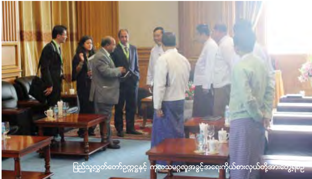
ပြည်သူ့လွှတ်တော်ဥက္ကဋ္ဌနှင့် ကုလသမဂ္ဂလူ့အခွင့်အရေးကိုယ်စားလှယ်တို့အားတွေ့ရပေ

ပြည်သူ့လွှတ်တော်ဥက္ကဋ္ဌ သူရဦးရွှေမန်းက “လူ့အခွင့်အရေးနဲ့ပတ်သက်လို့ သူက UN ကို လာမယ့်မတ်လမှာ အစီရင်ခံစာ တင်မယ်။ အဲလိုတင်နိုင်ဖို့အတွက် မြန်မာနိုင်ငံက သတင်းအချက်အလက်တွေကို လာလေ့လာတာ။ သူပြောတာက မြန်မာနိုင်ငံရဲ့ နိုင်ငံရေးပြုပြင်ပြောင်းလဲမှုတွေက အင်မတန်အားရစရာကောင်းပါတယ်။ ကျေနပ်စရာကောင်းပါတယ်။ ဒီအတွက်လည်း သူတို့ဘက်က ဆက်လက်ပြီးတော့ ဒီလိုတိုးတက်အောင်ဆောင်ရွက်ဖို့အတွက်မျှော်လင့်တယ်ဆိုတဲ့အကြောင်းပြောတယ်။ မိမိတို့ဘက်ကလည်း ကိုယ့်နိုင်ငံတိုးတက်ဖွံ့ဖြိုးရေးအတွက် ဒီလိုပြုပြင်ပြောင်းလဲမှုတွေ ဆက်ပြီး လုပ်မှာလို့ ပြန်ပြောလိုက်ပါတယ်။ အဲဒီတော့ သူကဘာထပ်ပြောလဲဆို