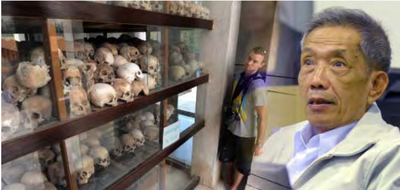
ဖန့်မင်းပင်ရှိ Choeung Ek လူသတ်ကွင်းတွင် ခမာနီတို့သတ်ဖြတ်ခဲ့မှုကြောင့် သေဆုံးခဲ့သူများ၏ အရိုးများပြသထားသောအောက်မေ့ဖွယ်ခန်းမ(ပုံပုံ) ခမာနီအကျဉ်းထောင်မှူး Duch တရားရင်ဆိုင်နေစဉ်(ယာပုံ)

ကမ္ဘောဒီးယား ခမာနီအစိုးရ လက်ထက်က စစ်ရာဇဝတ်မှု၊ လူ သတ်မှု၊ နှိပ်စက်ညှဉ်းပန်းမှုအပါ အဝင် စွဲချက်များစွာ စွဲဆိုခံရသော ထောင်မှူး Duch က ၎င်းအပေါ်ချ မှတ်ထားသည့် ထောင်ဒဏ် ၃၅ နှစ်