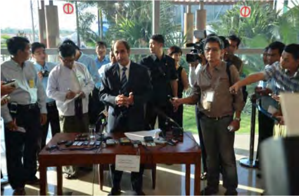
မြန်မာနိုင်ငံဆိုင်ရာကုလသမဂ္ဂလူ့အခွင့်အရေးကိုယ်စားလှယ် Tomás Ojea Quintana ရန်ကုန်အပြည်ပြည်ဆိုင်ရာလေဆိပ်၌သတင်းစာရှင်းလင်းပွဲပြုလုပ်စဉ်

မြန်မာနိုင်ငံဆိုင်ရာ ကုလသမဂ္ဂ လူ့အခွင့်အရေးကိုယ်စားလှယ် Tomás Ojea Quintana သည် ခြောက်ရက် ကြာ မြန်မာနိုင်ငံခရီးစဉ် အဆုံးတွင် ရန်ကုန်အပြည်ပြည်ဆိုင်ရာလေဆိပ်၌ ဖေဖော်ဝါရီလ ၅ ရက်နေ့က သတင်း စာရှင်းလင်းပွဲတစ်ရပ် ပြုလုပ်ခဲ့သည်။ ယင်း သတင်းစာရှင်းလင်းပွဲ တွင်ကြေညာချက်တစ်စောင်ထုတ်ပြန် ရာတွင် ခရီးစဉ်အတွင်းအဆင်ပြေ ချောမွေ့အောင်ပူးပေါင်းဆောင်ရွက် ခဲ့မှုများအတွက်မြန်မာအစိုးရကို ကျေး ဇူးတင်ကြောင်း၊ ခရီးစဉ်အတွင်း အစိုးရတာဝန်ရှိသူများနှင့် လည်းတွေ့ ဆုံခဲ့ကြောင်း၊ထို့ပြင်ဒေါ်အောင်ဆန်း စုကြည်နှင့် တွေ့ဆုံကာ အကျိုးရှိလှ သည့်အမြင်များကိုဖလှယ်ခဲ့ကြောင်း၊ မကြာမီကတည်းကထောင်ခဲ့သည့် မြန် မာနိုင်ငံအမျိုးသားလူ့အခွင့်အရေး ကော်မရှင်အဖွဲ့ဝင်များနှင့် လည်းတွေ့ ဆုံကာလူ့အခွင့်အရေး ကိစ္စရပ်များကို ကျယ်ကျယ်ပြန့်ပြန့်ဆွေးနွေးခဲ့ကြောင်း၊ ထို့ပြင် အင်းစိန်ဗဟိုအကျဉ်းထောင် တွင်ယုံကြည်ချက်ကြောင့်အကျဉ်းကျခံ နေရသူနှစ်ဦး၊ အချုပ်သားတစ်ဦးတို့ နှင့် လည်းတွေ့ဆုံခဲ့ကြောင်း၊ ၎င်းတို့ သုံးဦးမှာ ဖြိုးဝေအောင်၊ အောင်နိုင်၊ နိုင်ယကတို့ဖြစ်ကြောင်း၊ဂေမိချီးဆက် ကျောင်းသားများအဖွဲ့နှင့်လည်း တွေ့ ဆုံခဲ့ကြောင်း၎င်းကပြောကြားခဲ့သည်။ ထို့ပြင်ခရီးစဉ်အတွင်း ကရင်နှင့်