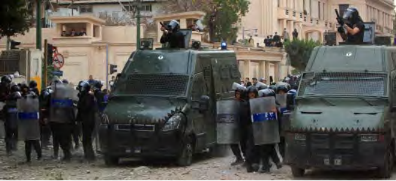
ဖေဖော်ဝါရီလ ၃ ရက်နေ့က ဘောလုံးပွဲပဋိပက္ခဖြစ်ခဲ့ပြီးနောက် ကိုင်ရိုမြို့လယ်ရှိ ပြည်ထဲရေးရုံးရှေ့တွင် စောင့်ကြပ်နေကြသော လုံထိန်းများ

အီဂျစ်တို့၏ အာဏာရှင် Hosni Mubarak အား ရာထူးမှဖယ်ရှား နိုင်ခဲ့သည့်တစ်နှစ်ပြည့်အထိမ်းအမှတ် ပြီးနောက်များမကြာမီ၌ ဤကဲ့သို့ အဓိကရုဏ်းများဖြစ်ပွားခဲ့ခြင်းဖြစ် သည်။ Cairo's Al Ahly ဘောလုံး အသင်းနှင့် Al-Masry ဘောလုံး အသင်းတို့အကြား၌ စတင်ဖြစ်ပွားခဲ့ သောအချင်းများမှုများသည်ပြီးဆုံး သွားသော်လည်း မရှင်းလင်းမှုများ ကျန်ရှိနေသေးသဖြင့် စုံစမ်းစစ်ဆေး ရေးကော်မတီမှ စုံစမ်းမှုများ ပြုလုပ် လျက်ရှိသည်။ နှစ်ဖက်ပရိသတ်များ ပဋိပက္ခဖြစ်ပွားစဉ် ရဲများက ဟန့် တားခဲ့ခြင်းမရှိဟု စွပ်စွဲမှုများရှိနေ သည်။ Ref: CNN