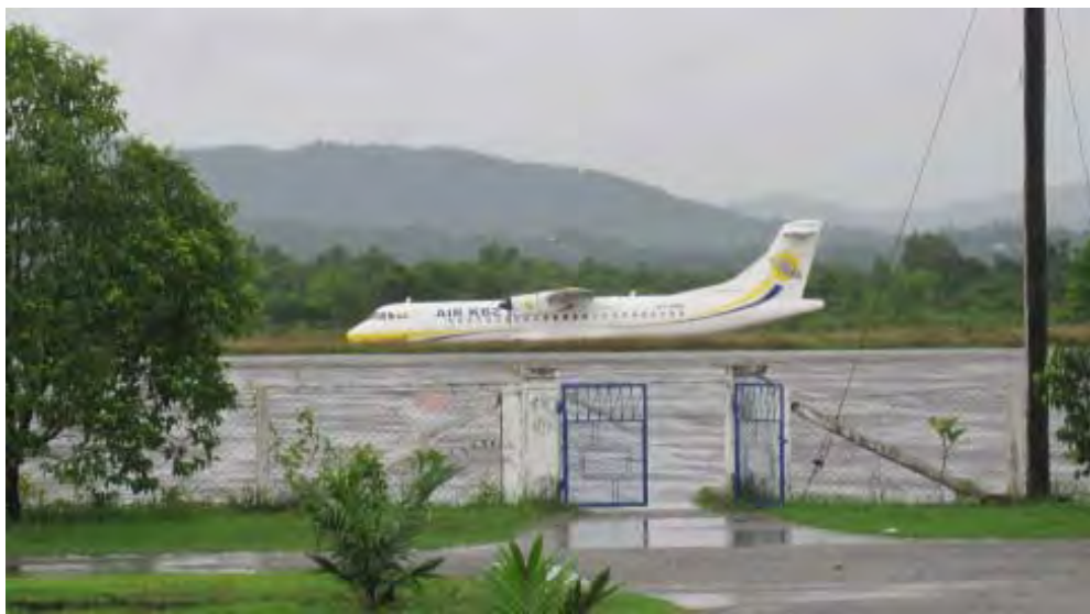
ထားဝယ်လေဆိပ်ကို တွေ့ရစဉ်

မြို့တွေကနေ ဘန်ကောက်၊ မဲဆောက်လိုမြို့တွေကို ကုန်သည်တွေ သွားလာမှုရှိ တယ်ဆိုတာ သိရတယ်။ တခြားကိစ္စနဲ့သွားတဲ့ ခရီးသည်တွေလည်းရှိတာကြောင့် တိုက်ရိုက်လေကြောင်းလိုင်း ပြေးဆွဲဖို့စီစဉ်နေပါတယ်။ လက်ရှိမှာတော့