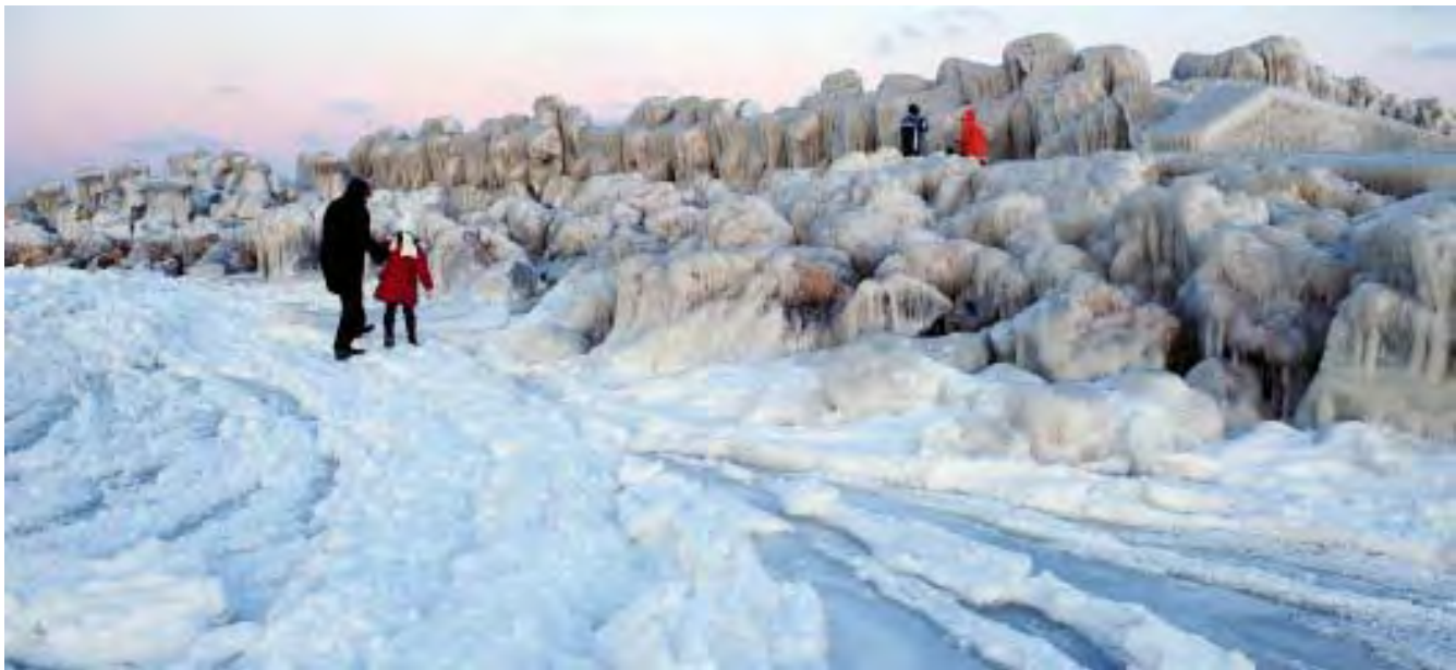
ဖေဖော်ဝါရီလ ၁ ရက်နေ့က ရိုမေးနီးယားနိုင်ငံ ဘူခါရက်စ်မြို့ အရှေ့ဘက် ကီလိုမီတာ ၂၃၀ အကွာရှိ ကွန်စတန်တာမြို့ ဘေးရှိ ပင်လယ်နက်ကမ်းခြေနှင့်ဆက်သွယ်သည့် ရေခဲနေစဉ်

ဥရောပအရှေ့ပိုင်းတွင် ယခုနှစ် ဆောင်းရာသီ၌ အပူချိန်ရေခဲမှတ် အောက်ကျဆင်းပြီး အအေးဆုံး အခြေအနေများကြောင့် ဇန်နဝါရီ ၃၁ ရက်နေ့တွင် ခိုက်ခိုက်တုန်အောင် အေးချမ်းမှုများ ဖြစ်ပေါ်ခဲ့သည်။ ပြင်းထန်သည့်နှင်းကျရောက်မှုများ ကြောင့် လူသေဆုံးမှုများ၊ နှင်းကိုက် မှုများနှင့် ခရီးသွားလာမှုများအဟန့် အတား ဖြစ်ခဲ့ရသည်။ ယူကရိန်းနှင့် ပိုလန်နိုင်ငံတို့ သည် အအေးဒဏ်ခံဆိုးရွားစွာ ခံစား ရသည့် နိုင်ငံများထဲတွင်ပါဝင်ပြီး ကီ ယက်စ်နှင့်ဝါဆောမြို့များတွင် အပူ ချိန်သည် အနုတ် ၁၇ နှင့် ၁၆ ဒီဂရီ