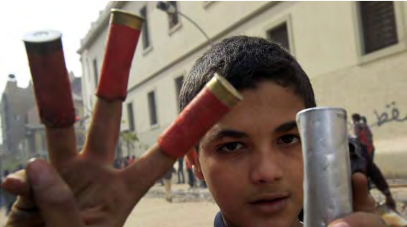
ဖေဖော်ဝါရီလ ၃ ရက်နေ့က ကိုင်ရှိမြို့လယ်ရှိ ပြည်ထဲရေးဝန်ကြီးဌာနရုံးချုပ်အနီးတွင် ဖြစ်ပေါ်ခဲ့သော ပဋိပက္ခများပစ်ခတ်မှုကြောင့် ကျန်ရှိခဲ့သည့် ကျည်ခွံများနှင့် မျက်ရည်ယိုမှဲ့ခွံတစ်ခုကို ပြသနေသော လူငယ်တစ်ဦး

ထိုပုဂ္ဂိုလ်၏အမည်က မိုဟာမက်အယ်တာဂီ။ အီဂျစ်တော်လှန်ရေး၏ထင်ရှားသည့်ခေါင်းဆောင်။ တက်ကြွသောနိုင်ငံရေးသမား။ မွတ်