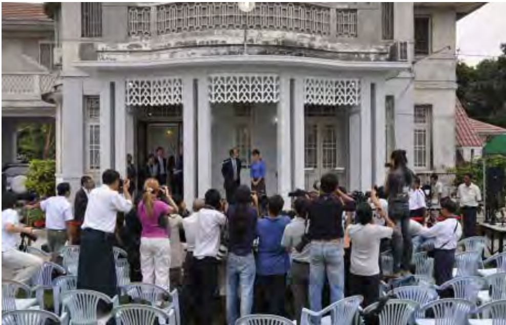
ဒေါ်အောင်ဆန်းစုကြည်နှင့် Tomás Ojea Quintana တို့အား ဖေဖော်ဝါရီလ ၃ ရက်နေ့က တွေ့ရစဉ်

အမျိုးသားဒီမိုကရေစီအဖွဲ့ချုပ်ဗဟိုအလုပ်အမှုဆောင်အဖွဲ့ဥက္ကဋ္ဌ ဒေါ်အောင်ဆန်းစုကြည်နှင့် မြန်မာနိုင်ငံဆိုင်ရာကုလသမဂ္ဂလူ့အခွင့်အရေးကိုယ်စားလှယ် Tomás Ojea Quintana တို့၏တွေ့ဆုံဆွေးနွေးမှု