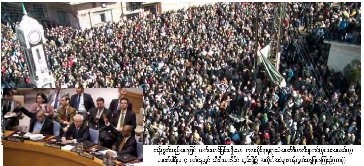
ကန့်ကွက်သည့်အနေဖြင့် လက်ထောင်ခြင်းမရှိသော ကုလဆိုင်ရာရုရှားသံအမတ်ပီတာလီချာကင်(ပုံသေးအလယ်လူ) ဖေဖော်ဝါရီလ ၄ ရက်နေ့တွင် ဆီးရီးယားနိုင်ငံ ဟွမ်မြို့၌ အတိုက်အခံများကန့်ကွက်သည့်နေ့ကြိုစဉ်(ယာပုံ)

မှုများရပ်တန့်ရန်နှင့် ၁၁ လကြာ နိုင်ငံရေးအကျပ်အတည်းအဆုံးသတ်ရန် တိုက်တွန်းသော လုံခြုံရေးကောင်စီကြေညာချက် မူကြမ်းမှာ လေးလအတွင်း ဒုတိယအကြိမ် အဖြစ် မီတိုသုံးခွင့်ရှိသောလုံခြုံရေး ကောင်စီအမြဲတမ်းအဖွဲ့ဝင် ရုရှား နှင့် တရုတ်တို့ က ထပ်မံပယ်ချခဲ့ခြင်းဖြစ်သည်။