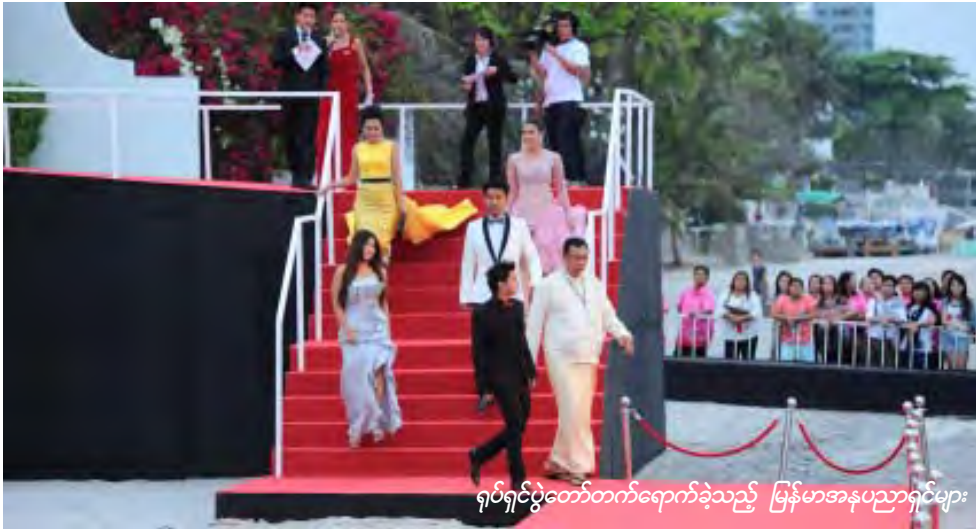
ရပ်ရှင်ပွဲတော်တက်ရောက်ခဲ့သည့် မြန်မာအနုပညာရှင်များ

ထိုင်းနိုင်ငံဘန်ကောက်မြို့တွင် ပြုလုပ်သည့်ဟွာဟင်းရပ်ရှင်ပွဲတော်တွင် ပန်းကြာဝတ်မှုန်ရပ်ရှင်ဇာတ်ကားပြသခဲ့ပြီး ဒါရိုက်တာစင်ရော်ကောင်း သိရသည်။