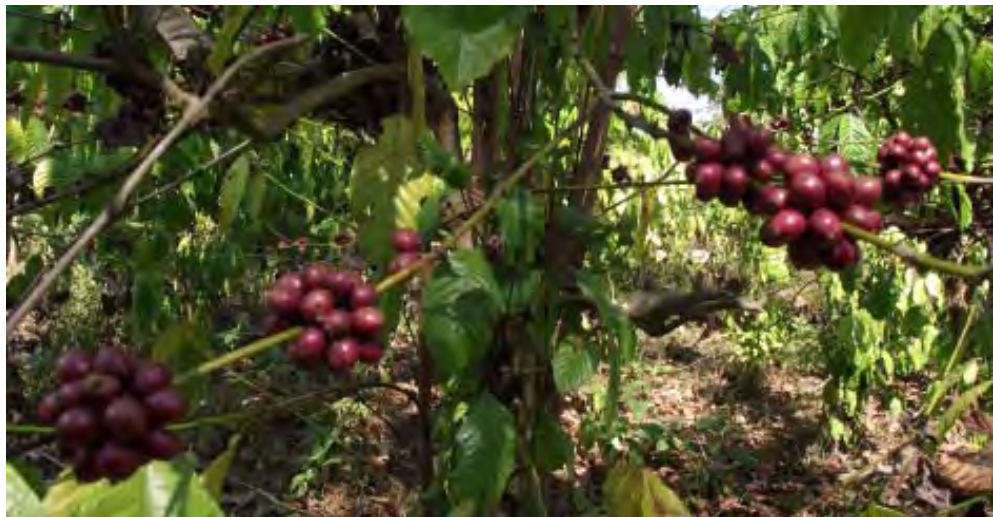
အသီးခူးရန် အကောင်းဆုံးအနေအထားတွင်ရှိသော ကော်ဖီသီးများအားတွေ့ရစဉ်

ကရင်ပြည်နယ် သံတောင်ကြီးဒေသနှင့် ပဲခူးတိုင်းဒေသကြီးအရှေ့ခြမ်းတို့မှကော်ဖီစေ့များထွက်ရှိရောင်းချလျက်ရှိပြီး ဈေးနှုန်းအတက်အကျတည်ငြိမ်မှုမရှိဘဲ လတ်တလောဒေသပေါက်ဈေး တစ်ပိဿာ ၂၀၀၀ ကျပ်ဝန်းကျင်ခန့်သာရရှိပြီး ယခင်နှစ်ဈေးနှုန်းများထက် ကျဆင်းလျက်ရှိကြောင်း သိရှိရသည်။ ကော်ဖီကို နိုဝင်ဘာနောက်ဆုံးအပတ်နှင့်ဒီဇင်ဘာလများတွင်အသီးစတင်ခူးရပြီး ဈေးကွက်ဝင်ကော်ဖီစေ့ရရှိသည်အထိ အသီးအခြောက်လှန်းခြင်း၊ အခွံမာချွတ်ခြင်းများကို အဆင့်ဆင့်လုပ်ဆောင်ရပြီး ကော်ဖီတစ်ပင်မှ ကော်ဖီစေ့ ၃၀ ကျပ်သားဝန်းကျင်ခန့်ထွက်ရှိကာ တစ်ဧကလျှင် ပိဿာ ၃၅၀ မှ ၄၀၀ ဝန်းကျင်ထွက်ရှိကြောင်း သိရှိရသည်။ ကော်ဖီတစ်ဧကလျှင် ကော်ဖီပင် ၁၃၀၀ ကျော်စိုက်ပျိုးနိုင်ပြီး တောင်စောင်းများတွင် ကွန်တိုနည်းဖြင့် စိုက်ပျိုးပါက အပင် ၁၀၀၀ ထိ စိုက်ပျိုးနိုင်ကြောင်း၊ ကော်ဖီပင်သည် သက်တမ်းနှစ် ၇၀ နီးပါးထိ အသီးခူးနိုင်သော နှစ်ရှည်ပင်မျိုးဖြစ်ပြီး