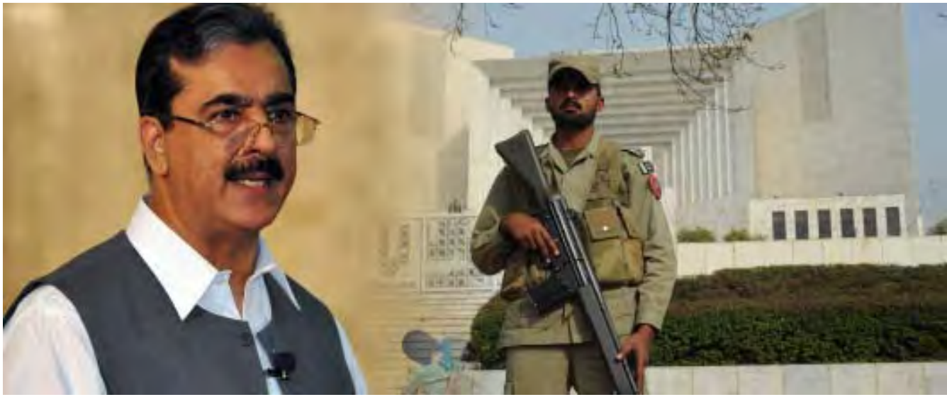
ပါကစ္စတန်ဝန်ကြီးချုပ်ဂီလာနီ(ဝဲ)၊ တရားရုံးချုပ်ရှေ့တွင် စောင့်ကြပ်နေသော အစောင့်စစ်သားတစ်ဦး

တရားရုံးအား မထိမဲ့မြင်ပြုမှု ဖြင့်တရားစွဲမှုခံယူရန် ဖေဖော်ဝါရီလ ၁၃ ရက်နေ့တွင် တရားရုံးသို့လာ ရောက်ရန် ဝန်ကြီးချုပ်ဂီလာနီအား ပါကစ္စတန်တရားရုံးချုပ်က ဆင့်ခေါ် ထားကြောင်း ၎င်း၏ရှေ့နေကဖေ ဖော်ဝါရီလ ၂ ရက်နေ့တွင်ပြောကြား ခဲ့သည်။ သံသယဖြစ်ဖွယ်ခြံစားမှုတွင် သမ္မတဇာ ဒါရီအပါအဝင်လူအချို့ကို ဝန်ကြီးချုပ်ဂီလာနီက စုံစမ်းစစ်ဆေး ပေးရန်တရားရုံးက တောင်းဆိုမှုတွင် ဇာဒါရီက ငြင်းဆန်ခဲ့ခြင်းကြောင့် ဂီလာနီကို ရုံးတော်မထိမဲ့မြင်ပြုမှုဖြင့် စွဲဆိုရန် စီစဉ်ခဲ့ခြင်းဖြစ်သည်။ နိုင်ငံ