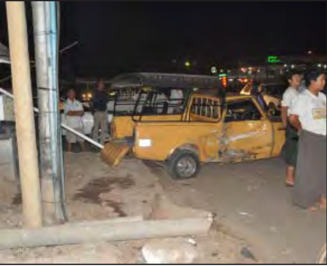
ယာဉ်တိုက်မှုဖြစ်ပွားရာ အမှားယာဉ်နှင့် ဟိုင်းလတ်အိမ်စီးကားကို တွေ့ရစဉ်

ပေဖော်ဝါရီလ ၂ ရက်နေ့ ည ၆ နာရီ ၃၅ အချိန်ခန့်က တာမွေမြို့နယ် အရှေ့မြင်းပြင်ကွင်းလမ်း မြတ်မေတ္တာဆီအရောင်းဆိုင် အနီးတွင်ယာဉ်တိုက်မှု တစ်ခုဖြစ်ပွားခဲ့ကြောင်း သိရသည်။