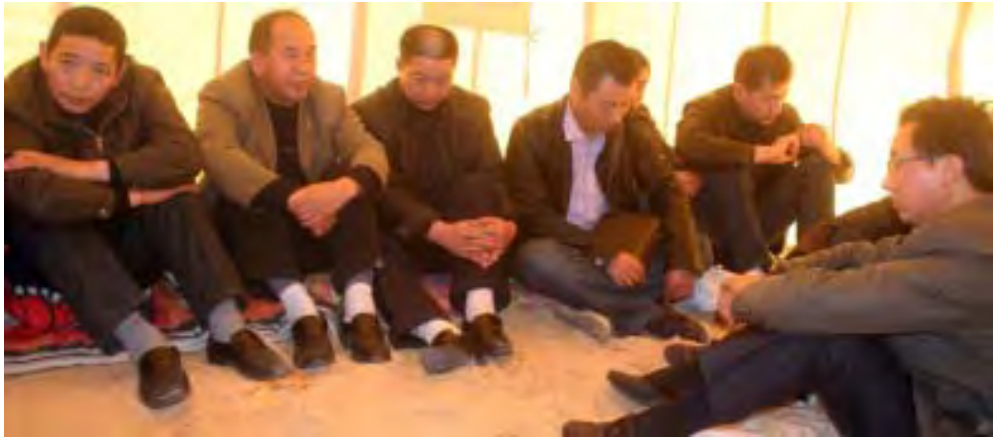
ဆိုင်နိုင်ငံတွင် ပြန်လွှတ်လာသည့် တရုတ်လုပ်သားများ

အကယ်၍ ယင်းအဆိုများကို အတည်ပြုလိုက်ပါက ဖေဖော်ဝါရီ လ ၂၁ ရက်ရွေးကောက်ပွဲတွင် ယီ မင်သို့ပြန်ဖွယ်ရှိသည့် ဆာလက်ဟ် ကို တရားရုံးသို့လာရောက်ရန် ဆင့် ခေါ်နိုင်ဖွယ်ရှိသည်။