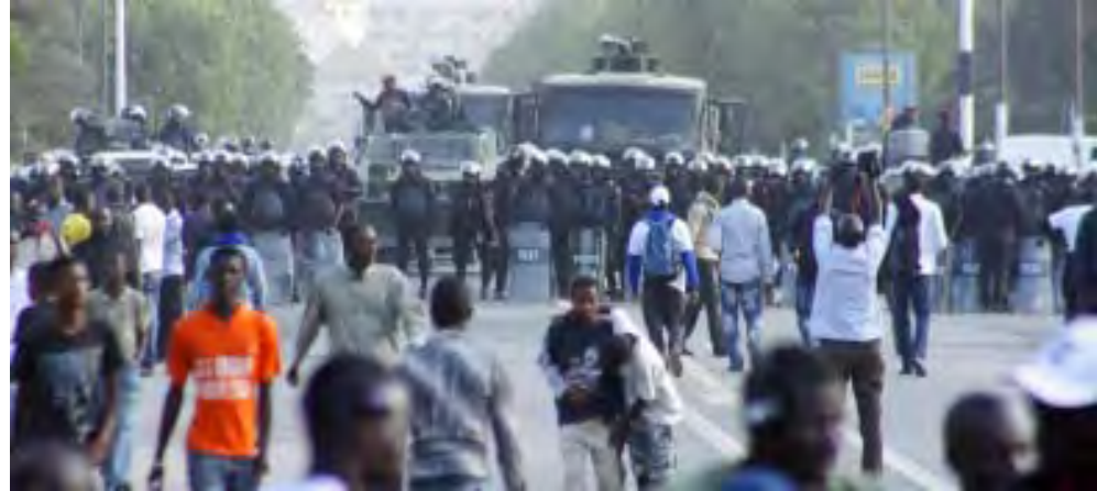
ဇန်နဝါရီလ ၃၁ ရက်နေ့က မြို့တော်ဒါကာတွင် ရဲများနှင့် ကန့်ကွက်သူများ ထိပ်တိုက်တိုင်းနေစဉ်

ပြန်လွှတ်ပေးရန် တောင်းဆိုခဲ့သည်။ Ref: CNN