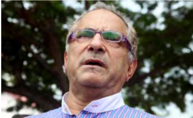
ရာမိုစ်ဟော်တာ

အဓိကကျသည့်ရွေးကောက်ပွဲ နှစ်တစ်နှစ်တွင် ထောက်ခံမှုတိုးမြှင့် စေရန် ကြိုးပမ်းသည့်အနေဖြင့်တောင်ကိုရီးယားကွန်ဆာဗေးတစ်အာဏာရပါတီသည် ဖေဖော်ဝါရီလ ၂ ရက်နေ့ကပါတီ၏အမည်ကိုပြောင်းလဲခဲ့သည်။ သို့သော် လည်းယင်းသို့အမည်ပြောင်းခြင်းမှာ အပေါ်ယံခြယ်သမှုတစ်ခုသာဖြစ်ပြီး မဲဆန္ဒရှင်များ၏အထင်ကြီးလေးစားမှုကိုရရှိနိုင်မည်မဟုတ်ကြောင်းဝေဖန် မှု များလည်းရှိနေသည်။အင်တာနက်မှရရှိသည့် အကြံပြုချက် ၁၀၀၀၀ ကိုအခြေပြု၍ Sae nuri (ကမ္ဘာသစ်)ဆိုသည့် အမည်သစ်ကိုရွေးချယ် လိုက်ကြောင်းGrand National Party ( GNP) ပါတီက ကြေညာခဲ့သည်။ ပါလီမန်တွင်အမတ်နေရာ ၂၉၉ နေရာရှိသည့်အနက် ၁၆၆ နေရာရ ရှိထား သည့် အာဏာပါတီသည် သမ္မတရာထူးကိုလည်းရယူထားသည်။မဲဆန္ဒရှင် များ၏ ယုံကြည်မှု သိသိသာသာကျဆင်းလာချိန် တွင် ဧပြီလ ၌ ကျင်းပမည့် အထွေထွေရွေးကောက်ပွဲနှင့်ဒီဇင်ဘာလ၌ကျင်းပမည့် သမ္မတ ရွေးကောက် ပွဲတို့တွင်ရုန်းကန်ရနိုင်သည်ဟုမျှော်လင့်ထားသည်။ Ref:AFP