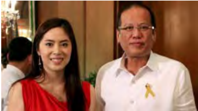
အကွီနိုနှင့် ဂရေစ်လီ

ဖိလစ်ပိုင်သမ္မတ လူပျိုကြီး ဘင်နစ်နိုအကွီနိုသည် သူ့ထက် အသက် ၂၀ ကျော်ငယ်သည့် တောင် ကိုရီးယားသျှနှင့်မေတ္တာမျှနေကြောင်း အတည်ပြုခဲ့သည်။ လာမည့် သီတင်းပတ် တွင် အသက် ၅၂ နှစ်ပြည့်မည့် သမ္မတ အကွီနိုက အစီအစဉ်တင်ဆက်သူ တောင်ကိုရီးယားသူဂရေစ်လီနှင့် မေတ္တာမျှနေသည်ဟု သတင်းများ ထွက်ပေါ်နေခြင်းနှင့်ပတ်သက်ပြီး “ကျွန်တော်တို့ နှစ်ယောက်ချိန်းဆို မှုတွေလုပ်ခဲ့ကြတယ်”ဟု အတည်ပြု ကြားခဲ့သည်။ အသက် ၂၉ နှစ်အရွယ်ရှိဂရေစ် လီသည် ကလေးဘဝကတည်းက ဖိလစ်ပိုင်သို့ ပြောင်းရွှေ့လာခဲ့သူဖြစ် ပြီး ယခုအခါတွင် မနီလာရှိ နာမည် ကျော် ဂီတရေဒီယိုအစီအစဉ်တစ်ခု တွင် ပူးတွဲအစီအစဉ်တင်ဆက်သူအ ဖြစ် လုပ်ကိုင်နေသည်။ ဂရေစ်သည် ရုပ်သံ ရှိပေါင်းများစွာတွင်လည်း အစီအစဉ်တင်ဆက်သူ ပြုလုပ်ခဲ့သူ ဖြစ်ပြီး ၎င်း၏ twitter စာ မျက်နှာ