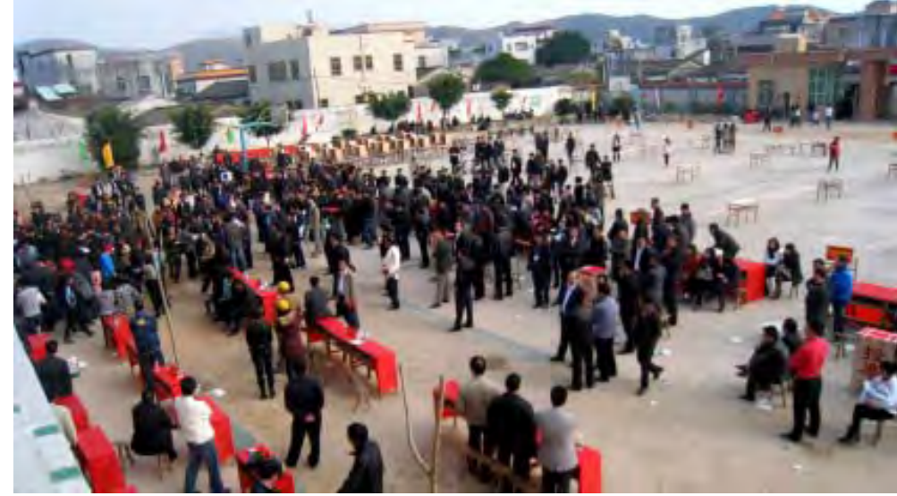
ဖေဖော်ဝါရီလ ၁ ရက်နေ့ ဂူကန်ကျေးရွာတွင် ကျေးရွာကော်မတီရွေးကောက်ပွဲပြုလုပ်နေစဉ်

တိုင် နောက်ဆုံးတွင် ရွာသားများ ကိုယ်စား ဝင်ရောက်ဖြေရှင်းပေးခဲ့ရ သည်။ ခြစားမှုများကို စုံစမ်းစစ်ဆေး ခဲ့ပြီးနောက်ရွာသားများ၏လုပ်ဆောင် ချက်မှာ လက်သင့်ခံစရာကောင်းပြီး ကြိုတင်ရွေးချယ်ထားသော ရွာကော် မတီခေါင်းဆောင်များမှာ တရားမ ဝင်ကြောင်း ပြည်နယ်အစိုးရကဆုံး ဖြတ်ချက်ချခဲ့သည်။ Ref: AFP