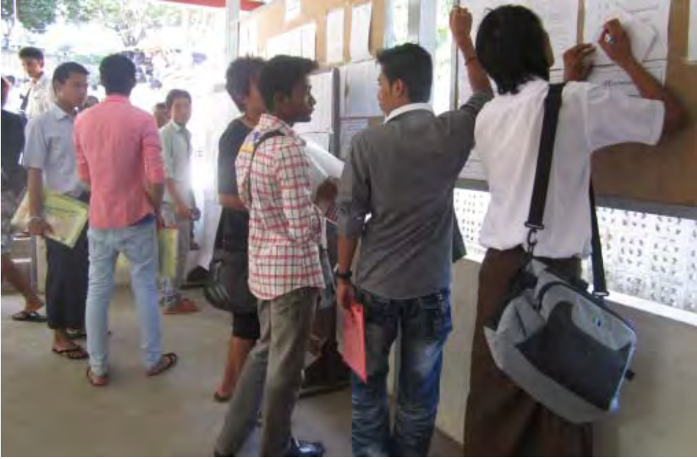
ခေါ်စာလက်ခံရရှိမှုစာရင်းသိရှိနိုင်ရန် အစိုးရပြည်ပအလုပ်အကိုင်အေဂျင်စီရှိ ကြော်ငြာသင်ပုန်းလာကြည့်သူများ

ပြည်တွင်းလုပ်သားခေါ်ယူမှုအားကိုရီးယားနိုင်ငံဘက်ကပြီးခဲ့သည့် ၂၀၁၁ ခုနှစ် နိုဝင်ဘာလနှောင်းပိုင်းမှ ၂၀၁၂ ခုနှစ် ဇန်နဝါရီလ ၁၂ ရက်နေ့အထိ အလုပ်ခေါ်စာချထားပေးမှုများရပ်နားခဲ့ပြီး ဇန်နဝါရီလ ၁၃ ရက်နေ့မှစတင်ကာ အလုပ်ခေါ်စာများပြန်လည်ချထားပေးခြင်းဖြစ်သည်။ ထိုသို့အလုပ်ခေါ်စာများ ချထားပေးရာတွင်လည်းဒုတိယအကြိမ်နှင့်တတိယအကြိမ်မြောက်ကိုရီးယားဘာသာအရည်အချင်းစစ်စာမေးပွဲကို ခွဲဖြေဆိုအောင်မြင်သည့်သူများအား အလုပ်ခေါ်စာများ ချထားပေးခြင်းဖြစ်ကာစာမေးပွဲအောင်မြင်ပြီးသူများမှာ ၈၀၀၆ ဦးရှိသည်။