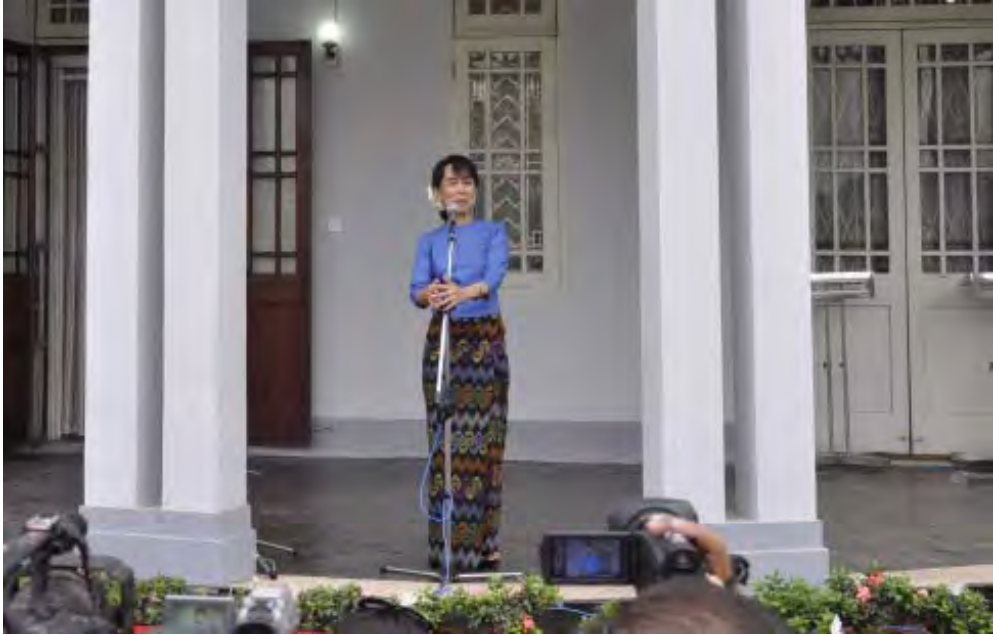
အမျိုးသားဒီမိုကရေစီအဖွဲ့ချုပ်ဥက္ကဋ္ဌ ဒေါ်အောင်ဆန်းစုကြည် မီဒီယာများ၏မေးမြန်းမှုများကိုပြန်လည်ဖြေကြားနေစဉ်

“ဖွဲ့စည်းပုံအခြေခံဥပဒေကိုရေးဆွဲတဲ့သူတွေကတော့ ပြင်ချင်တဲ့စိတ်နဲ့ ရေးတာမဟုတ်ဘူးလို့ ထင်ရမှာပေါ့နော်။ အစကတည်းက ပြင်ချင်လည်း ပြင်ထားမှာပေါ့။ ဒါပေမယ့် အန်တီတို့ကနေပြီးတော့ ပြည်သူတွေအတွက် အကျိုးမရှိတဲ့ အပိုင်းတွေကို ပြင်သင့်တယ်လို့ ဆိုတာက အန်တီတို့ယုံကြည်ချက်အရပြောတာ” ကရင်တိုင်းရင်းသားတွေနဲ့ ပိုပြီးနီးကပ်ကပ် “ကော့မှူးက ပြိုင်မယ်ဆိုတော့ အဲဒီမှာပဲ မဲထည့်ရမယ်။ မဲထည့်ရမယ်ဆိုတော့ အန်တီက အဓိကကတော့ အဲဒီရွာကို ရွေးတာကတော့ ကရင်တိုင်းရင်းသားတွေ ရွာမို့လို့ပါ။ အဲဒီတော့လည်းကရင်တိုင်းရင်းသားတွေနဲ့ ပိုပြီး နီးနီးကပ်ကပ် ဆက်ဆံနိုင်အောင်လို့ အဲဒီရွာမှာ မဲထည့်ဖို့