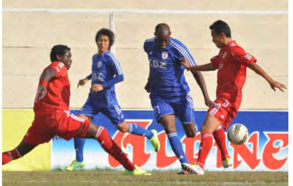
ရန်ကုန်မြို့ ပဒုမ္မာကွင်း၌ ဧရာဝတီယူနိုက်တက်အသင်းနှင့် ကမ္ဘောဇအသင်းတို့ယှဉ်ပြိုင်ပွဲစဉ်

ပဒုမ္မာကွင်းတွင် ယှဉ်ပြိုင်က စားခဲ့သော ဧရာဝတီယူနိုက်တက် အသင်းနှင့်ကမ္ဘောဇအသင်းတို့ပွဲစဉ် သည် အကြိတ်အနယ်ဖြင့် ပွဲကောင်း တစ်ပွဲဖြစ်ခဲ့ပြီး ကမ္ဘောဇအသင်းက (၁-၀)ဂိုးဖြင့် အနိုင်ရရှိခဲ့သည်။ ကမ္ဘောဇအသင်း၏ တစ်လုံးတည်း သော အနိုင်ဂိုးကို ပထမပိုင်း(၂၁) မိနစ်တွင်လစ်ပီလစ်ပီအား ဧရာဝတီ နောက်ခံလူ ဂျန်ဖျက်ထုတ်ခဲ့ရာမှ တစ်ဆင့်ရရှိခဲ့သော ပင်နယ်တီမှ တစ်ဆင့်လစ်ပီလစ်ပီက ကန်သွင်းခဲ့ ခြင်းဖြစ်သည်။ ကမ္ဘောဇအသင်း သည် ယခုပွဲအနိုင်ရလဒ်ကြောင့် ၂၀၁၂ခုနှစ် မြန်မာနေရှင်နယ်လိဂ် ပြိုင်ပွဲတွင်လေးပွဲကစား၊ လေးပွဲစလုံး အနိုင်၊ ပေးဂိုးမရှိဖြင့်အမှတ်ပေးဇယား