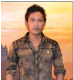
အဆိုတော်သစ် ခန့် အဆိုတော်သစ် ခန့်၏ ‘အချစ် နယ်လွန်’အမည်ရှိဗီစီဒီတေးစီးရီးမိတ် ဆက်ပွဲအခမ်းအနားကို ဇန်နဝါရီလ