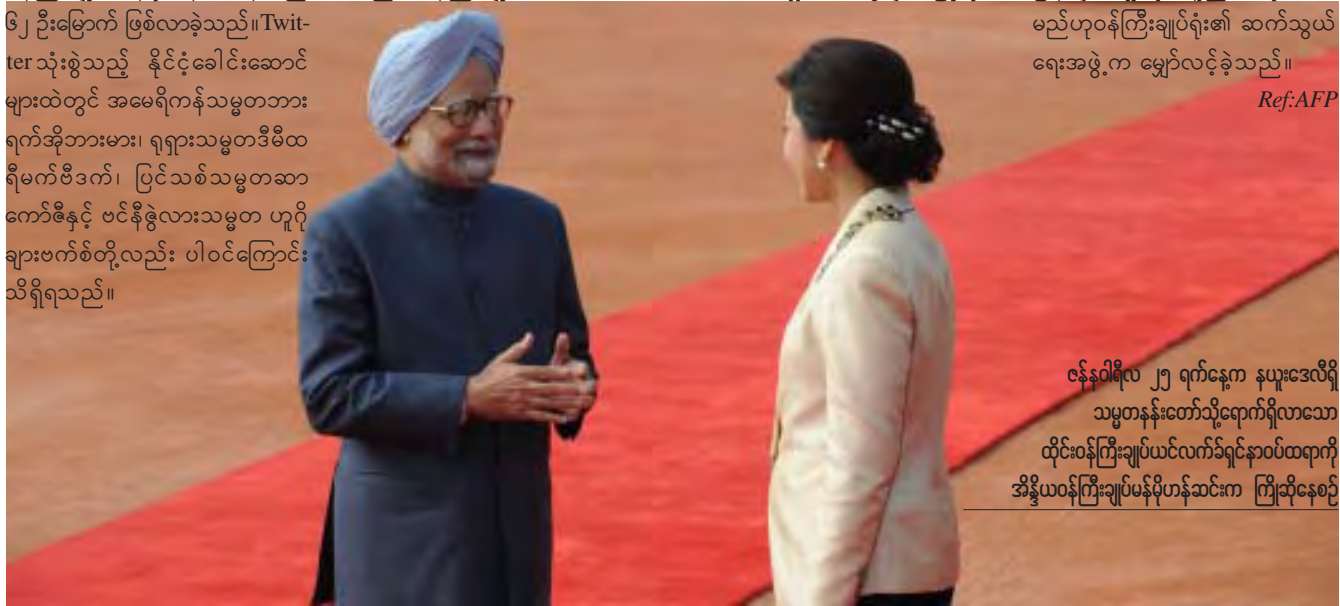
ဇန်နဝါရီလ ၂၅ ရက်နေ့က နယူးဒေလီရှိ သမ္မတနန်းတော်သို့ရောက်ရှိလာသော ထိုင်းဝန်ကြီးချုပ်ယင်လက်ဒ်ရှင်နာဝတ်ထရာကို အိန္ဒိယဝန်ကြီးချုပ်မန်မိုဟန်ဆင်းက ကြိုဆိုနေစဉ်