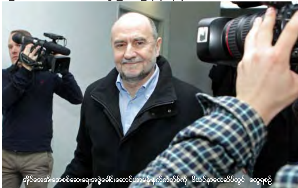
အိုင်အေအီးအေစစ်ဆေးရေးအဖွဲ့ခေါင်းဆောင်ဟာမန်းနက်ကတစ်ဖက်ကို ဗီယင်နာလေဆိပ်တွင် တွေ့ရစဉ်

လူထုလှုပ်ရှားမှုအပေါ် အကြမ်းဖက်နှိမ်နင်းမှုတွင် တာဝန်ရှိသည့် အာဏာရှင်ဆာလက်ဟ်ကိုခိုလှုံခွင့်ပေးရန် အမေရိကန်က ဆန္ဒမရှိကြောင်း အမည်မဖော်သော အမေရိကန်အစိုးရတာဝန်ရှိသူ ပြောကြားခဲ့သည်။ ဆာလက်ဟ်အနေဖြင့် ယီမင်တွင်မရှိပါက တင်းမာမှုလျော့ကျစေနိုင်ပြီး သမ္မတရွေးကောက်ပွဲအတွက်ပြင်ဆင်ရာတွင် အဆင်ပြေနိုင်စေရန်အတွက်ဖြစ်ကြောင်း ၎င်းက ပြောကြားခဲ့သည်။Ref: CNN