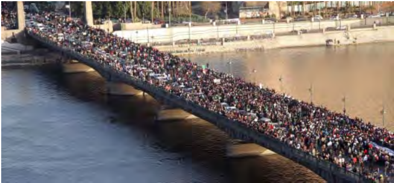
ကိုင်ရှိတွင်ပြုလုပ်မည့် လူထုစုဝေးပွဲတစ်ခုကို တက်ရောက်မည့် အီဂျစ်ဆန္ဒပြသူများ Kasr al-Nile တံတားတွင် စီတန်းလမ်းလျှောက်နေစဉ်

အီဂျစ်သမ္မတဟောင်းဟိုစနီမူဘာရက် ရာထူးဆင်းပေးခဲ့ရပြီးနောက် အာဏာကြားဖြတ်ရယူခဲ့သော စစ်ဘက်ကောင်စီသည် အရပ်ဘက်သို့ အာဏာလွှဲပေးသည်အထိ ကိုင်ရှိမြို့ရှိ တဟီရာရင်ပြင်တွင် ထိုင်ပြီးဆန္ဒပြသွားမည်ဟု လူငယ်များက ဇန်နဝါရီ ၂၆ ရက်တွင် ကတိပြုခဲ့သည်။