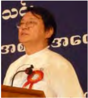
ဦးမောင်မောင်ဆွေ (ဥက္ကဋ္ဌ UMTA) မြန်မာနိုင်ငံ ခရီးသွားလုပ်ငန်း ရှင်များအသင်း(Union of Myanmar Travel Association-UMTA)