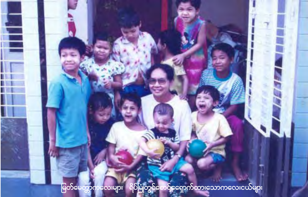
မြတ်မေတ္တာကလေးများ ရိပ်မြဲတွင်စောင့်ရှောက်ထားသောကလေးငယ်များ

စွန့်ပစ်ခံရသည့် ကလေးငယ်များနှင့် ခိုကိုးရာမဲ့ကလေးငယ်များ၊ လူ့ဘောင်အတွင်းမှ ထည့်သွင်းစဉ်းစားခြင်းမခံခဲ့ရသည့် ကလေးငယ်များ၊ ဆင်းရဲနွမ်းပါးသောကလေးငယ်များနှင့် တိုင်းရင်းသားကလေးငယ်များကို မြတ်မေတ္တာကလေးများရိပ်မြဲမှပညာသင်ကြားပေးပြီးအလုပ်အကိုင်ရရှိသည်အထိ စောင့်ရှောက်