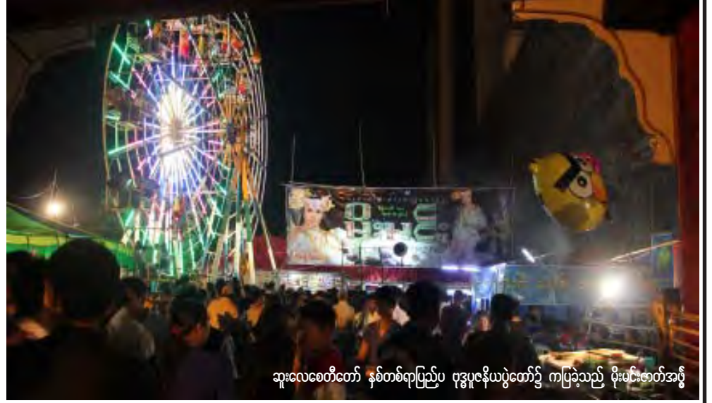
ဆူးလေဇော်တော် နှစ်တစ်ရာပြည့်ပ ဗုဒ္ဓပူဇော်ယဉ်ကျေးမှုပွဲတော်၌ ကပြခဲ့သည့် ဖိုးပင်းဇာတ်အဖွဲ့

သန်လျင်ကျိုက်ခေါက်ဘုရားပွဲကို ဖေဖော်ဝါရီလ ၁ ရက်နေ့မှ ဖေဖော်ဝါရီလ ၈ ရက်နေ့အထိ ၈ ရက်တိုင်တိုင် ကျင်းပသွားမည်ဟုသိရသည်။ ဘုရားပွဲတွင် ဟန်ဇာမိုးဝင်းဇာတ်အဖွဲ့၊ မိုးမင်းဇာတ်အဖွဲ့၊ မိုးချစ်ဇာတ်အဖွဲ့နှင့် စွမ်းဇာနည်ဇာတ်အဖွဲ့တို့ ပါဝင်ကပြကြမည်ဖြစ်ကြောင်း သိရသည်။ သို့သော် ဇာတ်အဖွဲ့များသည် ဖေဖော်ဝါရီလ ၃ ရက်နေ့မှ ၈ ရက်နေ့အထိ ၆ ညသာ ကပြကြမည်ဖြစ်သည်။ အဆိုပါဇာတ်အဖွဲ့