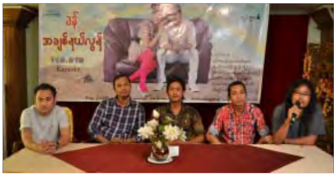
တက်ရောက်လာသော အနုပညာရှင်များ ၂၆ရက်နေ့ မွန်းလွဲ ၁ နာရီတွင် City Star Hotel၌ပြုလုပ်ခဲ့သည်။ အဆို ပါအခမ်းအနားတွင် ‘အချစ်နယ်လွန်’ ကြောင်း သတင်းရရှိသည်။