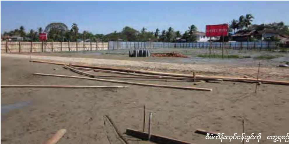
စီမံကိန်းလုပ်ငန်းခွင်ကို တွေ့ရစဉ်

ဧရိယာဧက ၂၆ ဒသမ ၉၆ ဧကရှိသည့် မြေကွက်ပေါ်တွင်သုံးထပ် အဆောက်အအုံကုတင်တစ်ရာဆုံပုဂ္ဂလိကဆေးရုံကြီးတစ်ခုကို ယခုနှစ်ဇန်နဝါရီလဆန်းပိုင်းမှစတင်၍ တည်ဆောက်လျက်ရှိကြောင်းသိရှိရသည်။ အဆိုပါဆေးရုံကြီးကို ဧရာဝတီယူနိုက်တက်စီမံကိန်းအဖွဲ့မှတာဝန်ယူတည်ဆောက်ခြင်းဖြစ်ပြီး ဆေးရုံအပါအဝင်ဧရာဝတီယူနိုက်တက်အဖွဲ့ချုပ်ရုံးတည်းခိုရိပ်သာ၊ လူနေဆိုင်ခန်းများ၊ စားသောက်ဆိုင်၊ ပန်းခြံနှင့်ပုဂ္ဂလိက ဘဏ်နှစ်ခုအပါအဝင်