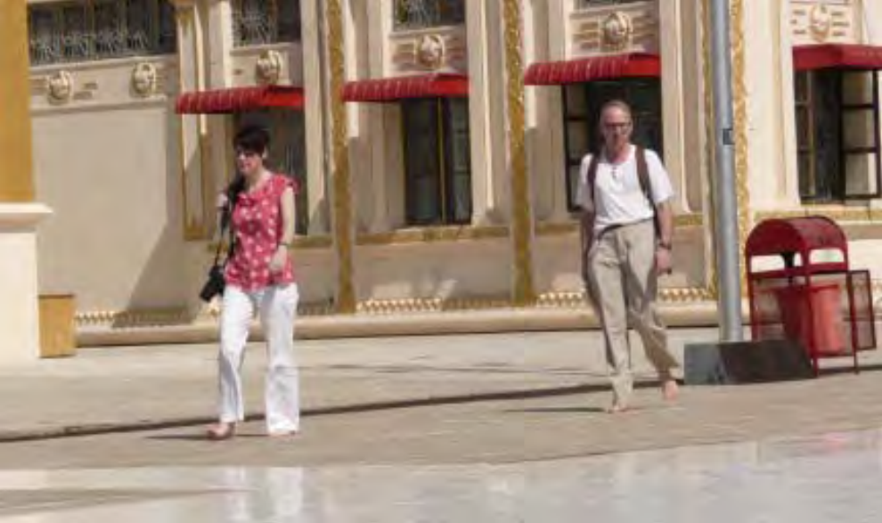
ရန်ကုန်မြို့ရောက် ခရီးသွားအချို့အား ဇန်နဝါရီလလယ်ပိုင်းက တွေ့ရစဉ်

မြန်မာနိုင်ငံသို့ နိုင်ငံခြားသားခရီးသွားဧည့်သည်များ ဝင်ရောက်မှု၊ လည်ပတ်သုံးစွဲမှုများမှ ရရှိသော ဝင်ငွေသည် ၂၀၁၁ ခုနှစ်တွင် သိသာစွာတိုးတက်မှုရှိခဲ့ပြီး စုစုပေါင်းဝင်ငွေအမေရိကန် ဒေါ်လာ ၃၁၉ သန်းရှိခဲ့ကြောင်း ဟိုတယ်နှင့်ခရီးသွားလာရေးလုပ်ငန်းဝန်ကြီးဌာနမှ ရရှိသော အချက်အလက်များအရ သတင်းရရှိပါသည်။