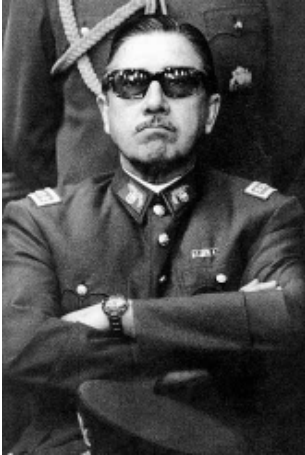
ပီနိုချေး

လက်ရှိအစိုးရအဖွဲ့က ပီနိုချေးအစိုးရအဖွဲ့ကို ‘အစိုးရ’ဟုသာ ခေါ်ဝေါ်သုံးနှုန်းနေသော်လည်းပညာရေးကောင်စီက အာဏာရှင်ဟု ခေါ်ဝေါ်ရန် ၆ မဲ ၁ မဲဖြင့် မဲခွဲဆုံးဖြတ်ခဲ့