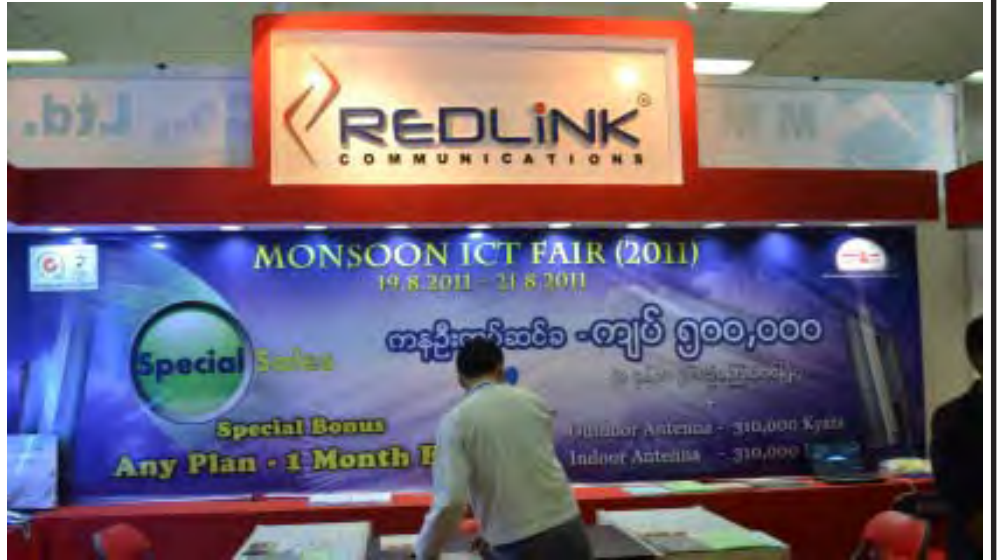
အိုင်တီပြပွဲတစ်ခုတွင်တွေ့ရသည့် WiMAX ပြခန်း

WiMAX Service Plan များကို ခြောက်မျိုးသတ်မှတ်ထားပြီး Silver, Gold, Gold+, Platinum, Platinum+, Diamond ဟူ၍ရှိကြောင်း၊လစဉ်ကြေးမှာ512 Kbps ကို ၃၀ ဒေါ်လာ၊ 1 Mbps ကို ၅၅ ဒေါ်လာ၊ 2 Mbps ကို ၉၀ ဒေါ်လာနှင့် 3 Mbps ကို ၁၅၅ ဒေါ်လာ သတ်မှတ်ထားကြောင်းသိရသည်။