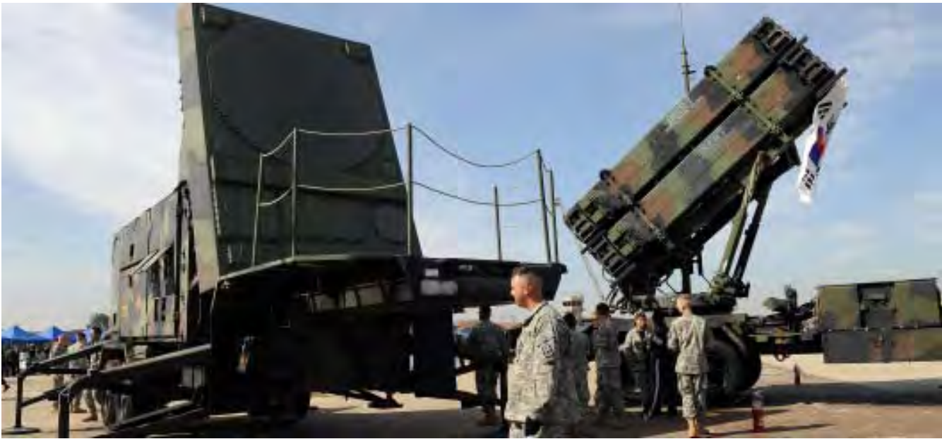
တောင်ကိုရီးယားနိုင်ငံ ဆိုးလ်တောင်ပိုင်း အူလ်ဆန်ရှိ အမေရိကန်ရေတပ်အခြေစိုက်စခန်းရှိ PAC-3 စနစ် Patriot ဒုံးကျည်ပစ်လွှတ်စင်

ဆယ်စုနှစ်တစ်ခုကျော်အတွင်း စစ်ပွဲနှစ်ခုဆင်နွှဲခဲ့ရသော အမေရိကန်သည် အမြဲတမ်းတပ်ဖွဲ့ဝင် တစ်သိန်း လျော့ချမည်ဖြစ်ကြောင်း ဇန်နဝါရီလ ၂၆ ရက်တွင် ပင်တဂွန်က အဆိုပြုခဲ့သည်။ သို့သော် အာရှနှင့် အရှေ့အလယ်ပိုင်း ဒေသတို့တွင်မူ စစ်အင်အားအတွက် ရင်းနှီးမြှုပ်နှံမှု အသစ်များပြုလုပ်သွားမည်ဟု ကြေညာခဲ့သည်။