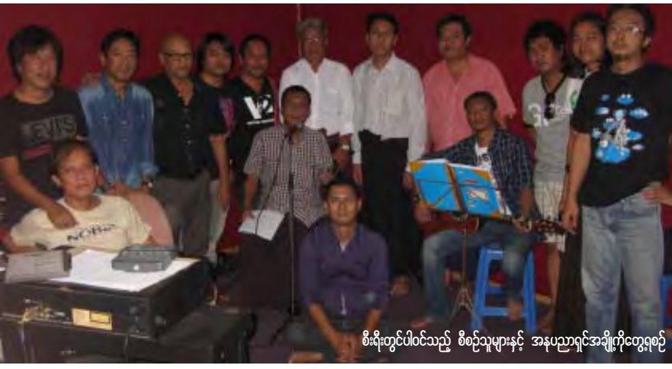
စီးရီးတွင်ပါဝင်သည့် စီစဉ်သူများနှင့် အနုပညာရှင်အချို့ကိုတွေ့ရစဉ်

အမျိုးသားဒီမိုကရေစီအဖွဲ့ချုပ်၊ ခေါင်းဆောင်ဒေါ်အောင်ဆန်းစုကြည်၏လမ်းညွှန်မှုဖြင့်စီစဉ်သည့်အဆိုပါ တေးအယ်လ်ဘမ်တွင်ငြိမ်းချမ်းရေး၊ ကလေးသူငယ်များနှင့် အနာဂတ်၊ သဘာဝပတ်ဝန်းကျင်စိမ်းလန်းရေးနှင့် ထိန်းသိမ်းရေး၊ စာရိတ္တပိုင်းဆိုင်ရာနှင့် အားမာန်၊ မျှော်လင့်ချက်များမွေးဖွားပေးနိုင်မည့်အကြောင်းအရာများပါဝင်မည်ဖြစ်ကြောင်းသိရသည်။ “ဒီတေးစီးရီးဖြစ်မြောက်ရေး