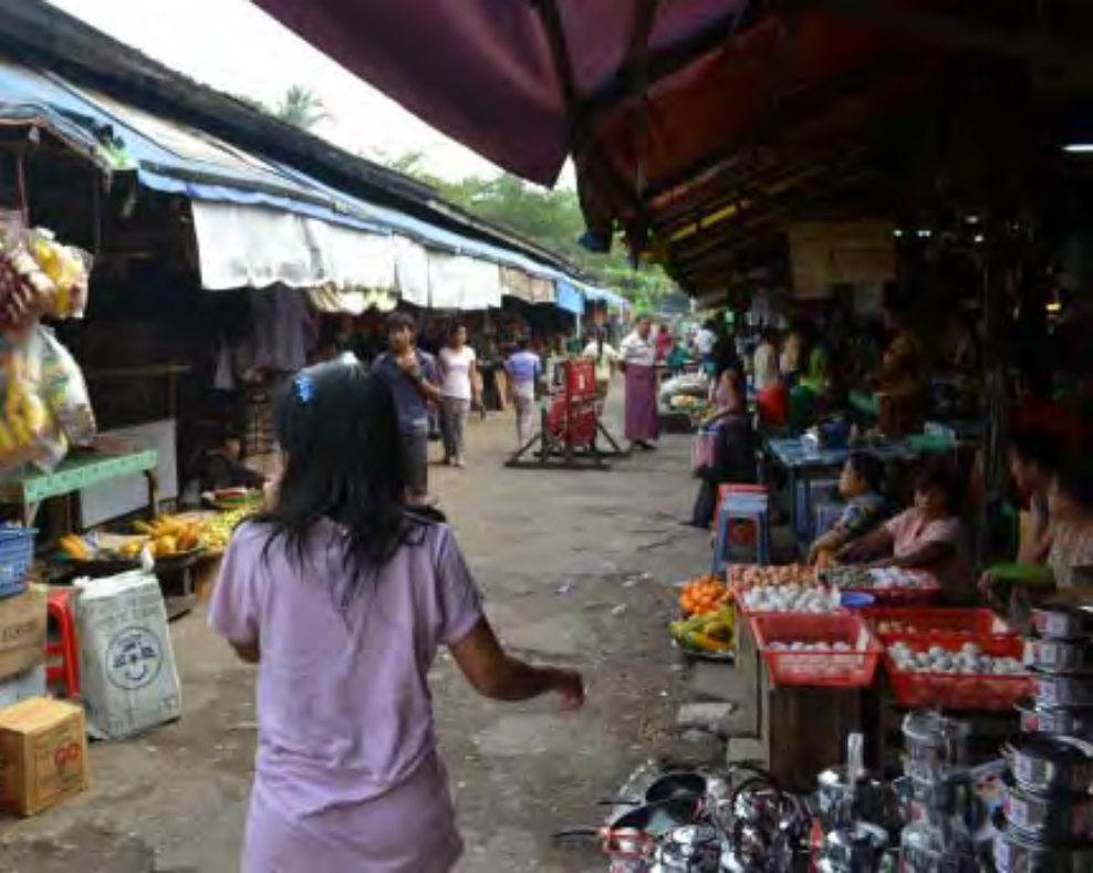
ဆင်မင်းဈေးအတွင်းပိုင်းအား တွေ့ရစဉ်

အလုံမြို့နယ်ရှိ သိပ္ပံဈေး(ဆင်မင်းဈေး)အား အဆင့်မြင့်ဈေးအဖြစ် ပြောင်းလဲဆောက်လုပ်ရန်အတွက် မြေတိုင်းတာခြင်းလုပ်ငန်းများ ပြုလုပ်ပြီးစီးခဲ့ပြီးဖြစ်ကြောင်း သိရှိရပါသည်။