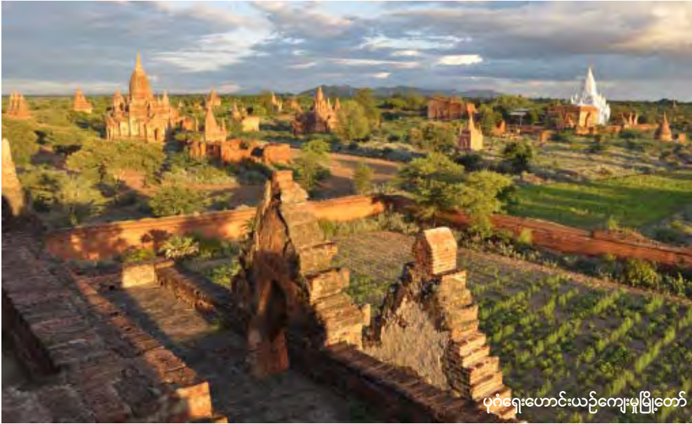
ပုဂံရှေးဟောင်းယဉ်ကျေးမှုမြို့တော်

မြန်မာနိုင်ငံ၌ ရှေးဟောင်းယဉ်ကျေးမှုအမွေအနှစ်များစွာရှိသော်လည်းကမ္ဘာ့ယဉ်ကျေးမှုအမွေအနှစ်စာရင်းဝင်အဖြစ် သတ်မှတ်ခံရခြင်းမရှိသေးကြောင်း၊ ယင်းကြောင့် ဗိဿနိး၊ သရေခေတ္တရာအပါအဝင် ရှေးဟောင်းမြို့တော်များအား ကမ္ဘာ့ယဉ်ကျေးမှုအမွေအနှစ်များအဖြစ်မှတ်တမ်းတင်ခံရရေး ဆောင်ရွက်လျက်ရှိကြောင်း ရှေးဟောင်းသုတေသန အမျိုးသားပြတိုက်နှင့်စာကြည့်တိုက်ဦးစီးဌာနမှ သိရှိရသည်။ “မြန်မာနိုင်ငံမှာ ရှေးဟောင်းယဉ်ကျေးမှုအမွေအနှစ်တွေအများကြီးရှိတယ်။ ပုဂံ၊ ပင်းယ၊ အင်းဝ