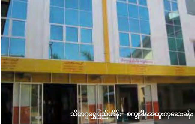
သီတဂူရွှေပြည်ဟိန်း စက္ခူဗိဇ္ဇာအထူးကုဆေးခန်း

၂၀၁၂ ခုနှစ် ဖေဖော်ဝါရီလ ၄ ရက်နှင့် ၅ ရက်နေ့တို့တွင် နဝမအကြိမ်မြောက်အဖြစ် မျက်စိဝေဒနာရှင်များအား အခမဲ့ခွဲစိတ်ပေးမည်ဖြစ်ကြောင်း ရွှေပြည်ဟိန်းကုသဖြစ်ဆေးခန်းမှ သိရှိရသည်။ အဆိုပါ မျက်စိခွဲစိတ်မှုကို ရွှေ