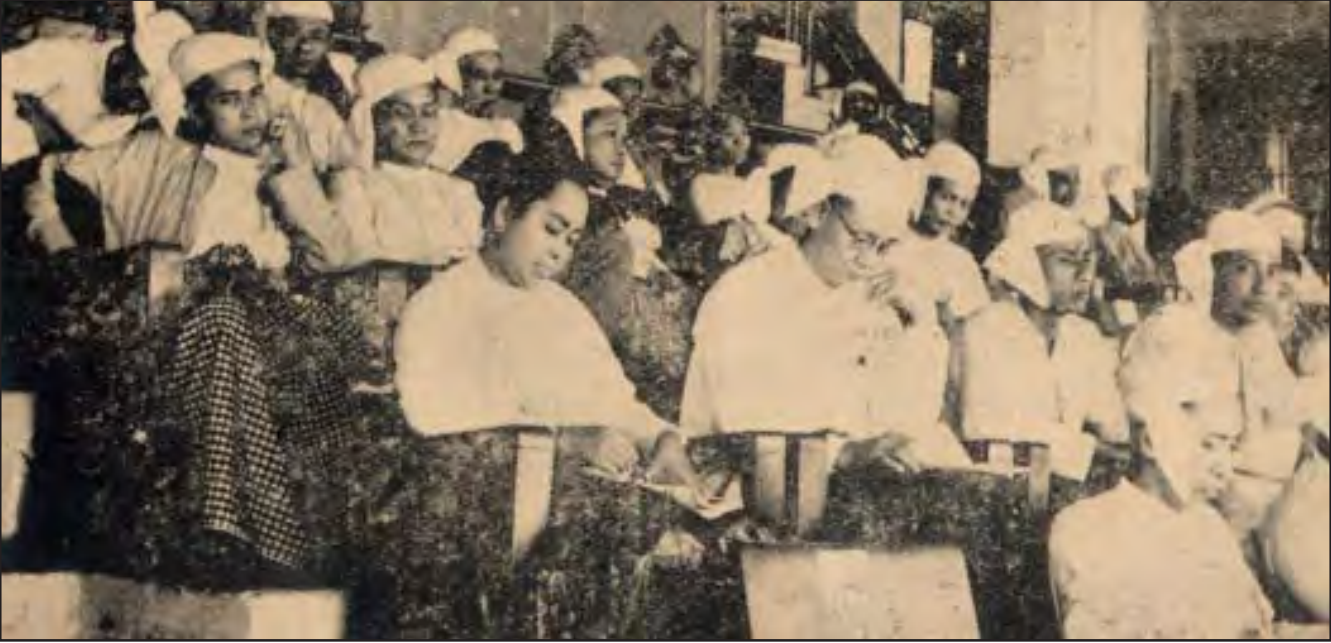
မဟာသီရိပုဗ္ဗဓမ္မဒေါ်ခင်ကြည် ပြည်တော်သာညီလာခံသို့ တက်ရောက်စဉ်

ပြည်တော်သာညီလာခံကို ၄ ဩဂုတ် ၁၉၅၂မှ ၁၇ဩဂုတ် ၁၉၅၂ အထိ ရန်ကုန်မြို့ကျိုက္ကစံကွင်း၌ ရက်သတ္တနှစ်ပတ်ကြာကျင်းပခဲ့ရာ ပါလီမန်ခေတ် သမိုင်းဝင်ညီလာခံကြီးဖြစ်ခဲ့ပါသည်။ညီလာခံမစမီတစ်ရက်အလို ၃ဩဂုတ်၁၉၅၂တွင် အဆိုစိစစ်ရေးဆပ်ကော်မတီများနှင့်လမ်းညွှန်ဆွေးနွေးပွဲကို ဦးစွာကျင်းပခဲ့သည်။