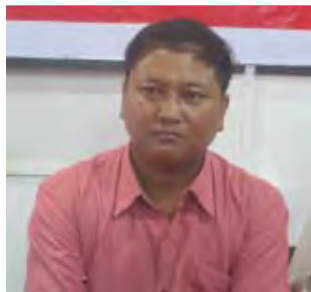
စာရေးဆရာမျိုးကိုမျိုး ကောင်းကင်’ စာအုပ်မိတ်ဆက်ပွဲ အခမ်းအနားကိုဇန်နဝါရီလ၂၇ ရက် နေ့က ပန်းဆိုးတန်းလမ်း (အပေါ်)