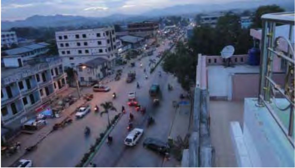
ထိုင်း-မြန်မာနယ်စပ် မြဝတီမြို့တစ်နေရာ

မြဝတီမြို့တွင် အခြေချနေထိုင်ပြီး တစ်နိုင်ငံတစ်ပိုင်းစီးပွားရေးလုပ်