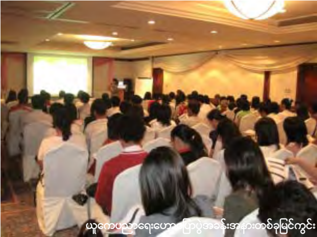
ယူကေပညာရေးဟော ပြောပွဲအခန်းအနားတစ်ခုမြင်ကွင်း

နဲ့ပတ်သက်ပြီးဒီလိုပုံစံမျိုးဆွေးနွေးပွဲတွေကိုပျမ်းမျှအားဖြင့်သုံးလကိုတစ်ကြိမ်နှုန်းကျင်းပပေးဖို့စီစဉ်ထားပါတယ်။ ကျောင်းတစ်ကျောင်းတည်းအတွက် ဦးတည်ဟောပြောသွားတာမဟုတ်ဘဲ ယူကေကမည်သည့်ကျောင်းကိုမဆိုတက်ရောက်ဖို့ စိတ်ဝင်စားတဲ့စီစဉ်နေကြတဲ့ ကျောင်းသားတွေအပြင် မိဘတွေကိုပါဟောပြောပေးမှာဖြစ်ပြီး အခမဲ့တက်ရောက်နိုင်ပါတယ်” ဟု ဗြိတိသျှကောင်စီ ယူကေပညာရေးဌာနမှတာဝန်ရှိသူက ဆိုသည်။ ဗြိတိသျှကောင်စီပညာရေးဌာနမှကြီးမှူးကျင်းပသည့်ယူကေဘွဲ့လွန်ပညာရေးဆိုင်ရာဟောပြောပွဲကိုရန်ကုန်မြို့ ကုန်သည်ကြီးများဟိုတယ်ကုန်းဘောင်-တကောင်းခန်းမတွင် ၂၀၁၂ ခုနှစ် ဇန်နဝါရီလ ၂၃ ရက်နေ့နံနက် ၁၀ နာရီအချိန်မှ မွန်းတည့်၁၂ နာရီအချိန်အထိ "Studying Postgraduate Qualifications in the UK" ခေါင်းစဉ်ဖြင့်ကျင်းပခဲ့သည်။