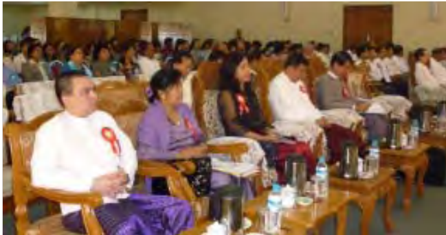
အသင်းအနားတက်ရောက်ကြသူများ ရန်ကုန်မြို့ရှိ ပြည်ထောင်စုသမ္မတ မြန်မာနိုင်ငံတော်နိုင်ငံများနှင့် စက်မှု လက်မှု လုပ်ငန်းရှင်များ အသင်းချုပ် (RUMFCCI)၌ကျင်းပခဲ့ရာအသင်း မှ တာဝန်ရှိသူများ၊ ဖိတ်ကြားထား သူများ တက်ရောက်ခဲ့ပါသည်။