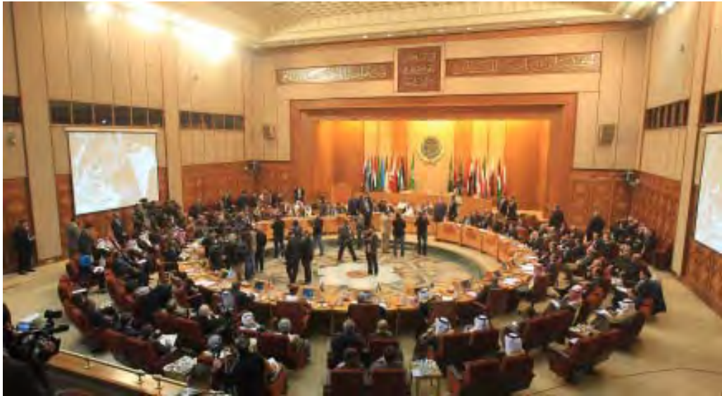
အာရပ်နိုင်ငံခြားရေးဝန်ကြီးများ ဇန်နဝါရီ ၂၂ ရက်က ကိုင်ရိုမြို့တွင် ဆီးရီးယားအရေးဆွေးနွေးစဉ်

အာရပ်အဖွဲ့ချုပ်အတွင်းရေးမှူးချုပ် Nabil el-Araby သည် အဖွဲ့ချုပ်နိုင်ငံများမှ နိုင်ငံခြားရေးဝန်ကြီးများနှင့်တွေ့ဆုံပြီးနောက် စောင့်ကြည့်အဖွဲ့လုပ်ငန်းစဉ် ရပ်ဆိုင်းရန် ဆုံးဖြတ်ချက်ချခဲ့ကြောင်း သိရသည်။ စောင့်ကြည့်အဖွဲ့ဝင်အားလုံး ဘေး