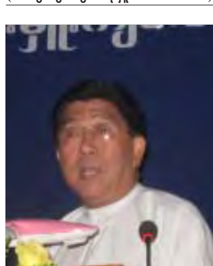
သမားတော်ကြီးပါမောက္ခဦးနေဝင်း