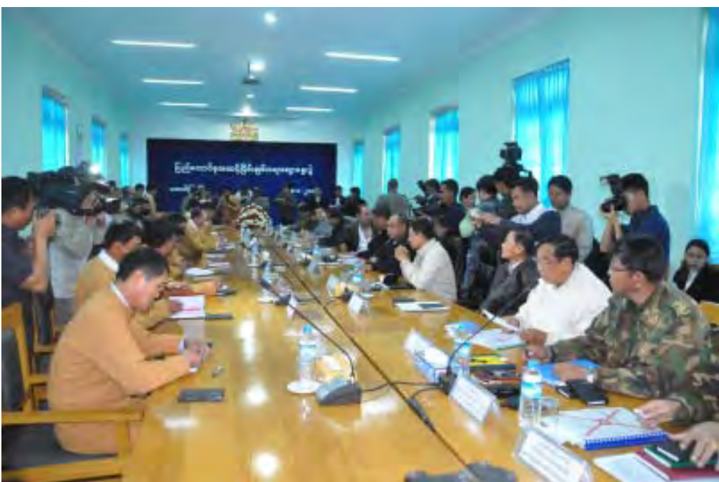
ပြည်ထောင်စုအဆင့် ငြိမ်းချမ်းရေးဆွေးနွေးရေးအဖွဲ့နှင့် ရှမ်းပြည်တိုးတက်ရေးပါတီ (SSPP) တို့ ငြိမ်းချမ်းရေးတွေ့ဆုံဆွေးနွေးကြစဉ်

ပြည်ထောင်စုအဆင့် ငြိမ်းချမ်းရေးဆွေးနွေးရေးအဖွဲ့နှင့် ရှမ်းပြည်တိုးတက်ရေးပါတီ (SSPP) တို့ ၂၀၁၂ ခုနှစ်၊ ဇန်နဝါရီလ ၂၈ ရက်နေ့က ရှမ်းပြည်နယ်၊ တောင်ကြီးမြို့နယ်၊ ပြည်နယ်အစိုးရအဖွဲ့ရုံးခန်းမတွင်ပြည်ထောင်စုအဆင့် ငြိမ်းချမ်းရေးဆွေးနွေးပွဲပြုလုပ်ခဲ့ပြီး အချက်ငါးချက်ပါဝင်သော သဘောတူညီချက်ကို လက်မှတ်ရေးထိုးခဲ့ကြောင်း သိရသည်။ အဆိုပါသဘောတူညီချက် ငါးချက်မှာ ၂၀၁၂ ခုနှစ်၊ ဇန်နဝါရီလ ၂၈ ရက်နေ့က တောင်ကြီးမြို့တွင် ရှမ်းပြည်နယ်ငြိမ်းချမ်းရေးဖော်ဆောင်ရေးအဖွဲ့နှင့် ရှမ်းပြည်တိုးတက်ရေးပါတီ (SSPP) တို့ သဘောတူလက်မှတ်ရေးထိုးခဲ့သောငြိမ်းချမ်းရေးတည်ဆောက်ရန် ပဏာမသဘောတူညီချက်ကို အတည်ပြုရန်သဘောတူခြင်း၊ ပင်လုံစိတ်ဓာတ်ကိုအခြေခံ၍ ပြည်ထောင်စုမပြိုကွဲအောင် ပူးပေါင်းတည်ဆောက်ရေး၊ တိုင်းရင်းသားစည်းလုံးညီညွတ်မှုမပြိုကွဲအောင်ပူးပေါင်းတည်ဆောက်ရေးနှင့်အချုပ်အခြာအာဏာတည်တံ့ခိုင်မြဲအောင်ပူးပေါင်းတည်ဆောက်ရေးတို့ကို ထာဝစဉ်ကြိုးပမ်းဆောင်ရွက်သွားရန်သဘောတူခြင်း၊နယ်မြေဒေသဖွံ့ဖြိုးတိုးတက်ရေးအတွက် ရှမ်းပြည်