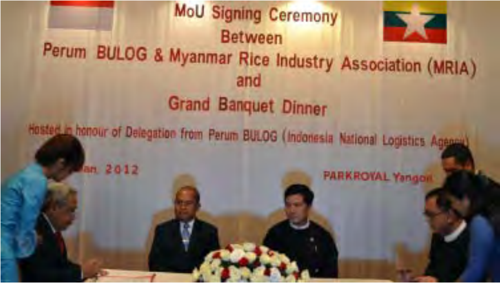
Parkroyal ဟိုတယ်တွင် MRIA နှင့်အင်ဒိုနီးရှားနိုင်ငံ၏ Perum BULOG တို့နားလည်မှုစာချွန်လွှာရေးထိုးစဉ်

အင်ဒိုနီးရှားနိုင်ငံ၏ နိုင်ငံပိုင် State owned enterprise တစ်ခုဖြစ်သော Perum Bulogကုမ္ပဏီက မြန်မာနိုင်ငံမှ အရန်ဆန်နှစ်သိန်းအားဝယ်ယူရန်အတွက် ဇန်နဝါရီလ ၂၈ ရက်နေ့တွင် ရန်ကုန်မြို့ Parkroyal ဟိုတယ်၌ လက်မှတ်ရေးထိုးခဲ့ကြောင်းသတင်းရရှိသည်။