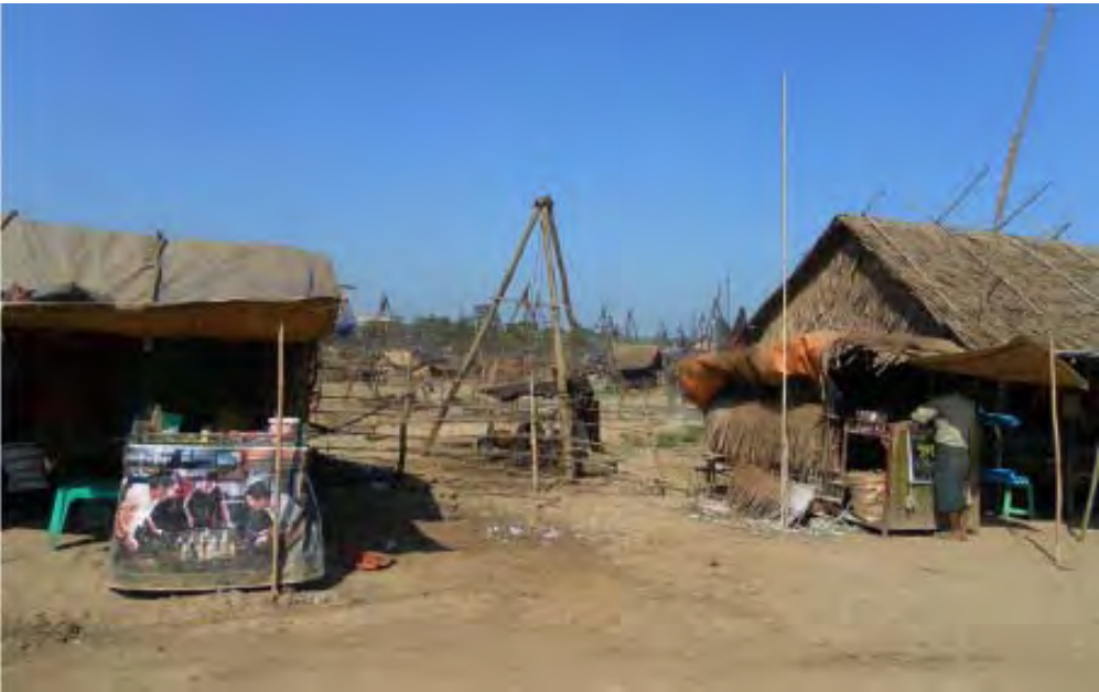
မကွေးတိုင်းဒေသကြီး၊ မင်းလှမြို့နယ်အတွင်းရှိ ရေနံမှော်လုပ်ကွက်တစ်နေရာ

“ကျွန်တော်တို့ဆိုင်မှာတော့ ဇန်နဝါရီလ ၁ ရက်နေ့ညက ဖောက်ထွင်းခံရတာပါ။ လူသံကြားလိုပိုင်းလိုက်ကြပေမယ့် မီးကမရှိတော့မခံခဲ့ပါဘူး။ ဆိုင်ကိုပြန်စစ်တဲ့အခါ စောင်တစ်ထည်၊ ဖိနပ်အရံ ၅၀၊ စည်းတစ်စည်းပုဆိုး ၆၀ စည်း၊ တစ်စည်းနဲ့ကျောပိုးအိတ် ၁၀ လုံး