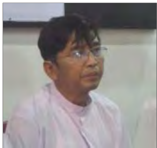
ကိုမင်းကိုနိုင် ရှိ စာပေလောက စာအုပ်ဆိုင်၌ ပြုလုပ်ခဲ့ရာ ဖိတ်ကြားထားသူများ၊ ၈၈ မျိုးဆက်ကျောင်းသားများ၊