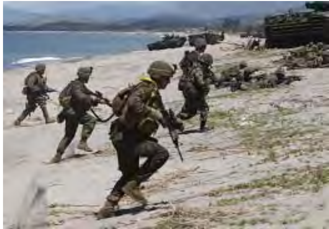
အမေရိကန်နှင့် ဖိလစ်ပိုင်ပရိမ်းတပ်သားများ ဖိလစ်ပိုင်နိုင်ငံကမ်းခြေတစ်ခုတွင် ပြီးခဲ့သည့်နှစ် အောက်တိုဘာလ ၂၃ ရက်နေ့က ပူးတွဲစစ်ရေးလေ့ကျင့်စဉ်

အိန္ဒိယဝန်ကြီးချုပ်မန်မိုဟန်ဆင်းနဲ့က ဝန်ကြီးချုပ်ရုံး၏ လုပ်ဆောင်ချက်များနှင့် ပတ်သက်ပြီး လူထုကို အသိပေးရန်အတွက် ဇန်နဝါရီ ၂၃ ရက်နေ့တွင် twitterစတင်သုံးစွဲခဲ့ကြောင်း သိရှိရသည်။ Twitterသုံးစွဲသည့် ကမ္ဘာတစ်ဝန်းရှိ နိုင်ငံခေါင်းဆောင်များတွင် ဝန်ကြီးချုပ် မန်မိုဟန်ဆင်းနဲ့သည် ၆၂ ဦးမြောက် ဖြစ်လာခဲ့သည်။Twitter သုံးစွဲသည့် နိုင်ငံခေါင်းဆောင်များထဲတွင် အမေရိကန်သမ္မတဘားရက်အိုဘားမား၊ ရုရှားသမ္မတဒီမီထရီမက်ဒိုဒက်၊ ပြင်သစ်သမ္မတဆာကော်ဇီနှင့် ဗင်နီဇွဲလားသမ္မတ ဟူဂိုချားဗက်စ်တို့လည်း ပါဝင်ကြောင်း သိရှိရသည်။