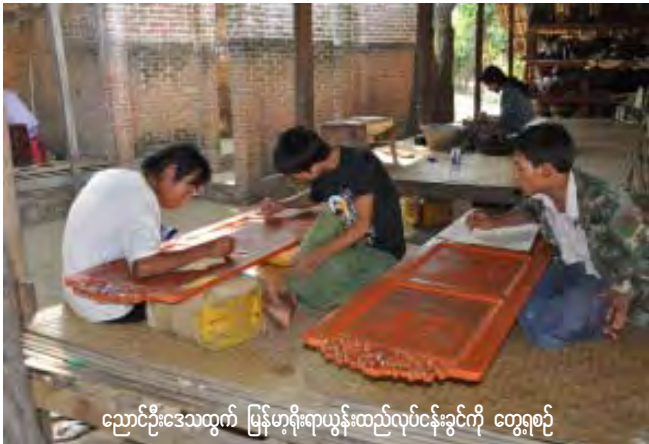
ညောင်ဦးဒေသထွက် မြန်မာ့ရိုးရာယွန်းထည်လုပ်ငန်းရှင်ကို တွေ့ရစဉ်

ချရမှု ပြန်လည်မြင့်တက်လာသည်။ “ယွန်းထည်ကို အစဉ်အလာအားဖြင့် ဥရောပခရီးသွားဧည့်သည်တွေပင် ဝယ်တာများတယ်။ ဒီနှစ်တော့ အာရှကဧည့်သည်တွေကပါ ဝယ်လာကြတယ်”ဟုပုဂံမြို့သစ်မှ ယွန်းလုပ်ငန်းရှင်တစ်ဦးကပြောပါသည်။ အာရှခရီးသွားဧည့်သည်များ ပုဂံညောင်ဦးဒေသထွက်ယွန်းထည်များဝယ်ယူကြရာ၌ ဆွမ်းအုပ်များ၊ လက်ဖက်အုပ်၊ ဗန်း၊ စီးကရက်ဘူး၊ ရွှေကပ်၊ ယွန်းပန်းချီကားစသည်တို့အများဆုံးဝယ်ယူအားပေးကြောင်းယွန်းထည်ကို အိန္ဒိယ၊ ဘင်္ဂလား၊ တရုတ်၊ ဗီယက်နမ်၊ ထိုင်း၊ ကိုရီးယား၊ ရုရှားမဟာမိတ်နိုင်ငံတို့တွင်လည်းလုပ်ကိုင်ကြသော်လည်း ရိုးရာလက်မှုပညာစစ်စစ်ဖြစ်သော Hand made ယွန်းထည်များကိုမူ မြန်မာတစ်နိုင်ငံတည်းမှာပင် ရရှိနိုင်ကြောင်း သိရသည်။ ကိုနော်(ပုဂံ)