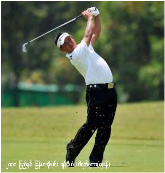
၂၀၁၀ ပြည့်နှစ် မြန်မာအိုးပင်း ချန်ပီယံ ဟိရက်စူကာ(ဂျပန်)