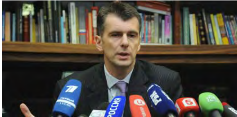
သမ္မတရွေးကောက်ပွဲအတွက် ဝင်ရောက်ယှဉ်ပြိုင်မည့် ရုရှားဘီလျံနာ မီခေးလ်ပရိုရော့ဗ်

အသက် ၄၆ နှစ်ရှိ စီးပွားရေးလုပ်ငန်းရှင်ပရိုဆိုရော့ဗ်သည် New Jersey Nets ဘက်စကက်ဘောအသင်းကို ပိုင်ဆိုင်ပြီး ဒေါ်လာ ၁၈ ဘီလျံမြှူကြွယ်ဝသည်။ ပရိုဆိုရော့ဗ်ကို ရွေးကောက်ပွဲတွင် ပူတင်နှင့်ယှဉ်ပြိုင်ခိုင်းခြင်းမှာ ရွေးကောက်ပွဲကို နိုင်ငံတကာက အသိအမှတ်ပြုရန်နှင့်