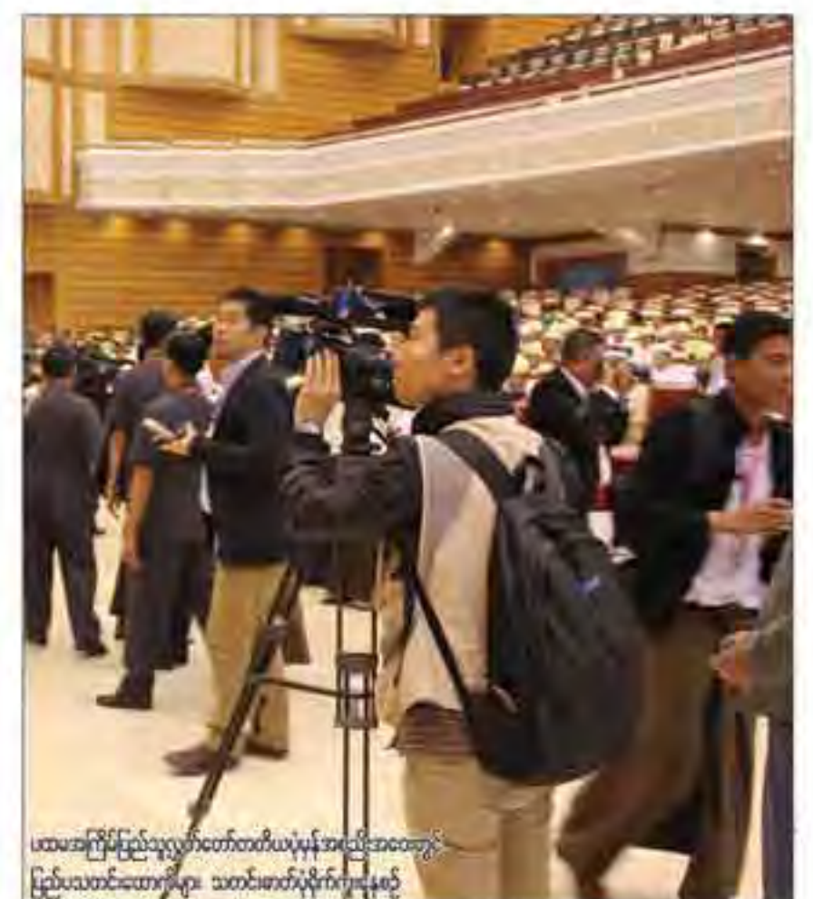
ပထမဆုံးပြည်သူ့လွှတ်တော်တတိယပုံမှန်အစည်းအဝေးတွင် ပြည်ပသတင်းထောက်များ သတင်းဖော်သုံးနိုင်မှုနှင့်

၂၀၁၁-၂၀၁၂ နောက်ထပ်ဘဏ္ဍာငွေခွဲဝေသုံးစွဲရေး ဥပဒေကြမ်းနှင့် ၂၀၁၂-၂၀၁၃ ပြည်ထောင်စုဘဏ္ဍာငွေခွဲဝေသုံးစွဲရေး ဥပဒေကြမ်းများကို ပြည်ထောင်စုလွှတ်တော်၌ ဆွေးနွေးသွားမည် စ ( ၂ ) သို့