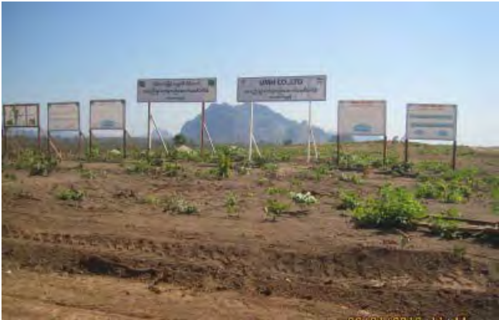
ဘားအံစက်မှုဇုန်စီမံကိန်းကို တွေ့ရစဉ်

“ကျွန်တော်တို့ လင်မယားက တော့ဘားအံစက်မှုဇုန်စကတည်းက နှစ်ပတ်တစ်ခါ၊ တစ်ပတ်တစ်ခါ စနေ၊ တနင်္ဂနွေနေ့ဆိုသွားလေ့လာကြပါတယ်။ ထိလုံရွာကနေ အောက်ဗိုလ်တဲကိုဖောက်နေတဲ့ လမ်းဘေးမြေကွက်တွေ ဝယ်ထားပါတယ်။ အခုတော့သုံးလေးဆလောက်တော့ မြင့်နေပါပြီ၊ မြဝတီကနေ ဘားအံစက်မှုဇုန်ကို လာမယ့် ကားတွေ အောက်ဗိုလ်တဲကနေ လမ်းခွဲကြမှာပါ။ ဘားအံတစ်လမ်း၊ ကော့ကရိတ်တစ်လမ်းပေါ့။ လမ်းသစ်က ၇၅ မိုင်ရှိပါတယ်။ လမ်းအူကြောင်း ဖောက်ထားပြီးမြေနှိခင်းထားပါတယ်၊မကြာများ နေ့စဉ်အသွားအပြန်ကူးကာ ကျောင်းတက်နေသော ကူးတို့ဖြစ်ကြောင်း သိရသည်။ သားရွှေဦး