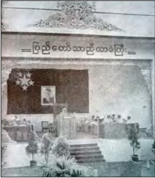
ပြည်တော်သာညီလာခံအခမ်းအနားကျင်းပနေစဉ်

၅ ဩဂုတ် ၁၉၅၂ တွင် စီမံကိန်းအလိုက်ဝန်ကြီးများက ရှင်းလင်း