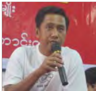
ကိုလှိုင်မိ ယုံကြည်ချက်ကြောင့် အကျဉ်းကျခံ နေရပြီး ပြန်လည်လွတ်မြောက်လာ သူများ တက်ရောက်ခဲ့ကြပါသည်။