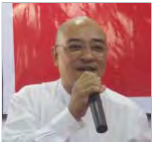
ဦးသူရ(၁)ဇာနည် ၈၈ နိုင်ငံရေးနောက်ခံလှုပ်ရှား မှုများဖြင့် ရေးဖွဲ့ထားသည့် စာရေး ဆရာ မျိုးကိုမျိုး၏ ‘လမ်းပြရဲ့