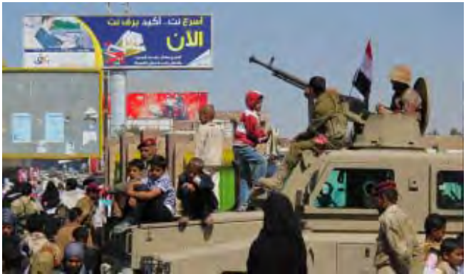
ဆာနာမြို့ရှိ စစ်ကားတစ်စီးပေါ်တွင် ကလေးများထိုင်နေပုံ

ပါဝင်သော ဆာလက်ဟ်ကို တရားစွဲဆိုမှုမှကင်းလွတ်ခွင့်ပေးသည့် အငြင်းပွားဖွယ်ဥပဒေတစ်ရပ်အား ယီမင်လွှတ်တော်က ပြီးခဲ့သောသီတင်းပတ်တွင် အတည်ပြုခဲ့သည်။ အပြန်အလှန်အနေဖြင့် အာဏာကို ၃၃ နှစ်ကျော်ကြာချုပ်ကိုင်ခဲ့သော ဆာလက်ဟ်သည် ဖေဖော်ဝါရီလတွင် ရာထူးမှ နုတ်ထွက်ရမည်ဖြစ်သည်။ GCC အဆိုပြုချက်ကို ဆာလက်ဟ်က လက်မှတ်ထိုးခဲ့မှုအား အတိုက်အခံပါတီများက လက်ခံခဲ့သည်။ Ref: CNN