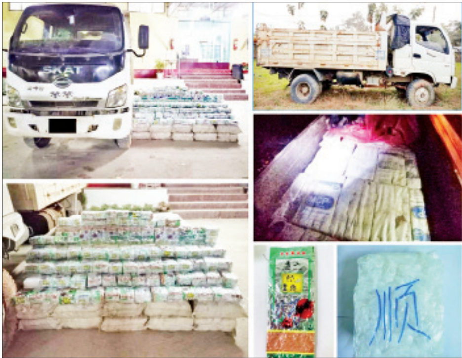
သိမ်းဆည်းရမိသည့် အိုက်စံ (မက်သ်အဖက်တမင်း)များကို တွေ့ရစဉ်။