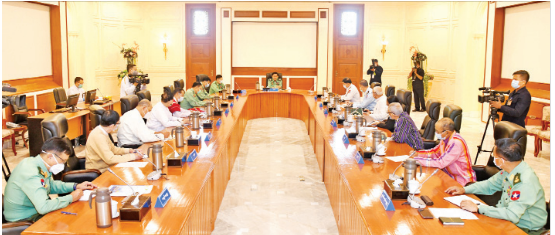
နိုင်ငံတော်စီမံအုပ်ချုပ်ရေးကောင်စီဥက္ကဋ္ဌ၊ တပ်မတော်ကာကွယ်ရေးဦးစီးချုပ် ဗိုလ်ချုပ်မှူးကြီးမင်းအောင်လှိုင် နိုင်ငံတော်စီမံအုပ်ချုပ်ရေးကောင်စီအဖွဲ့ဝင်များအားတွေ့ဆုံပြီး နိုင်ငံရေး၊ စီးပွားရေး၊ လူမှုရေး၊ အုပ်ချုပ်ရေး၊ ငြိမ်းချမ်းရေး၊ တရားဥပဒေစိုးမိုးရေးတို့နှင့်စပ်လျဉ်း၍ ရှင်းလင်းပြောကြားစဉ်။

နိုင်ငံရေး၊ စီးပွားရေး၊ လူမှုရေး၊ အုပ်ချုပ်ရေး၊ ငြိမ်းချမ်းရေး၊ တရားဥပဒေစိုးမိုးရေးတို့နှင့်စပ်လျဉ်း၍ ရှင်းလင်းပြောကြား