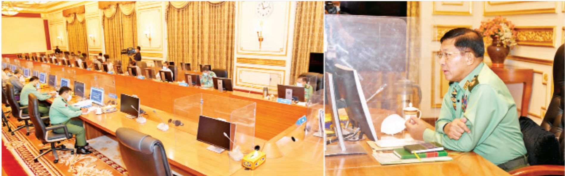
နိုင်ငံတော်စီမံအုပ်ချုပ်ရေးကောင်စီဥက္ကဋ္ဌ၊ တပ်မတော်ကာကွယ်ရေးဦးစီးချုပ် ဗိုလ်ချုပ်မှူးကြီးမင်းအောင်လှိုင် စီမံခန့်ခွဲရေးအစည်းအဝေးတွင် အမှာစကားပြောကြားစဉ်။