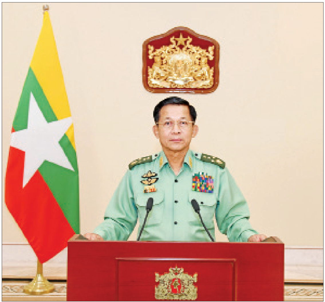
ပြည်ထောင်စုသမ္မတမြန်မာနိုင်ငံတော်၊ နိုင်ငံတော်စီမံအုပ်ချုပ်ရေးကောင်စီဥက္ကဋ္ဌ ဗိုလ်ချုပ်မှူးကြီးမင်းအောင်လှိုင် ပြည်သူလူထုသို့ မိန့်ခွန်းပြောကြားစဉ်။

မရှိဘူး၊ ရိုးသားတဲ့နိုင်ငံရေး၊ တရားမျှတတဲ့ နိုင်ငံရေးကိုသာ လိုချင်ပါတယ်” လို့ ပြောခဲ့ပါ တယ်။ ၂၀၂၀ ပြည့်နှစ်၊ ဩဂုတ်လ ၂၀ ရက်နေ့ မှာ ကျင်းပခဲ့တဲ့ ပြည်ထောင်စုငြိမ်းချမ်းရေး ညီလာခံ-(၂)ရာစုပင်လုံစတုတ္ထအစည်းအဝေး မှာလည်း ဒီမိုကရေစီစနစ်တည်ဆောက်ရာမှာ “ဥပဒေရဲ့အထက်မှာ မည်သူမျှမရှိ” ဆိုတဲ့ စကားရပ်ဟာ ဒီမိုကရေစီအုတ်မြစ် တည်တဲ့ ခိုင်မြဲစေဖို့ အခြေခံလိုက်နာရမယ့်အချက် ဖြစ်သလို နိုင်ငံတည်ဆောက်ရေး(State Building)၊ တိုင်းပြည်တည်ဆောက်ရေး (Nation Building) ဆောင်ရွက်ရာမှာလည်း “အမျိုးသားအကျိုးစီးပွား၏ အထက်မှာ မည်သည့်ပုဂ္ဂိုလ်၊ မည်သည့်အဖွဲ့အစည်းမျှမရှိ” ဆိုတာ ခံယူရမှာဖြစ်တယ်လို့ ပြောဆိုခဲ့ပါ တယ်။ ဒါတွေ ပြောဆိုရခြင်းဟာ တပ်မတော် အနေနဲ့ ပြည်သူတို့ လိုလားတောင်းဆိုပြီး အကောင်အထည်ဖော်ဆောင်ရွက်နေတဲ့ ပါတီစုံ ဒီမိုကရေစီစနစ် ပိုမိုခိုင်မာပြီး စနစ်တကျ ရေရှည်တည်တံ့စေဖို့အတွက်ပဲ ဖြစ်ပါတယ်။ စာမျက်နှာ ၃ ကော်လံ ၁ သို့ *