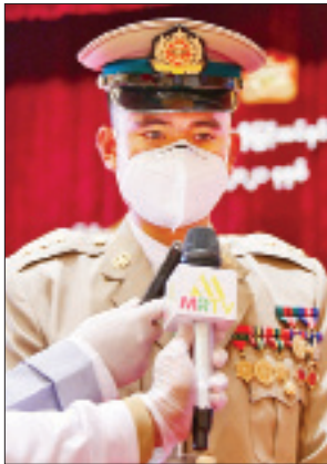
ဗိုလ်ကြီး သူရ ဇော်ဦးလွင်