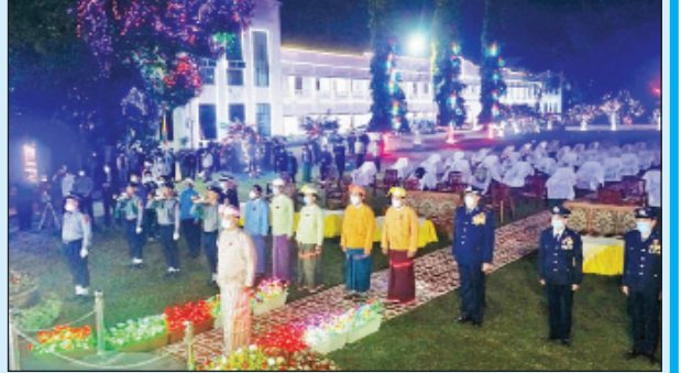
ဘားအံမြို့၌ ကျင်းပစဉ်။