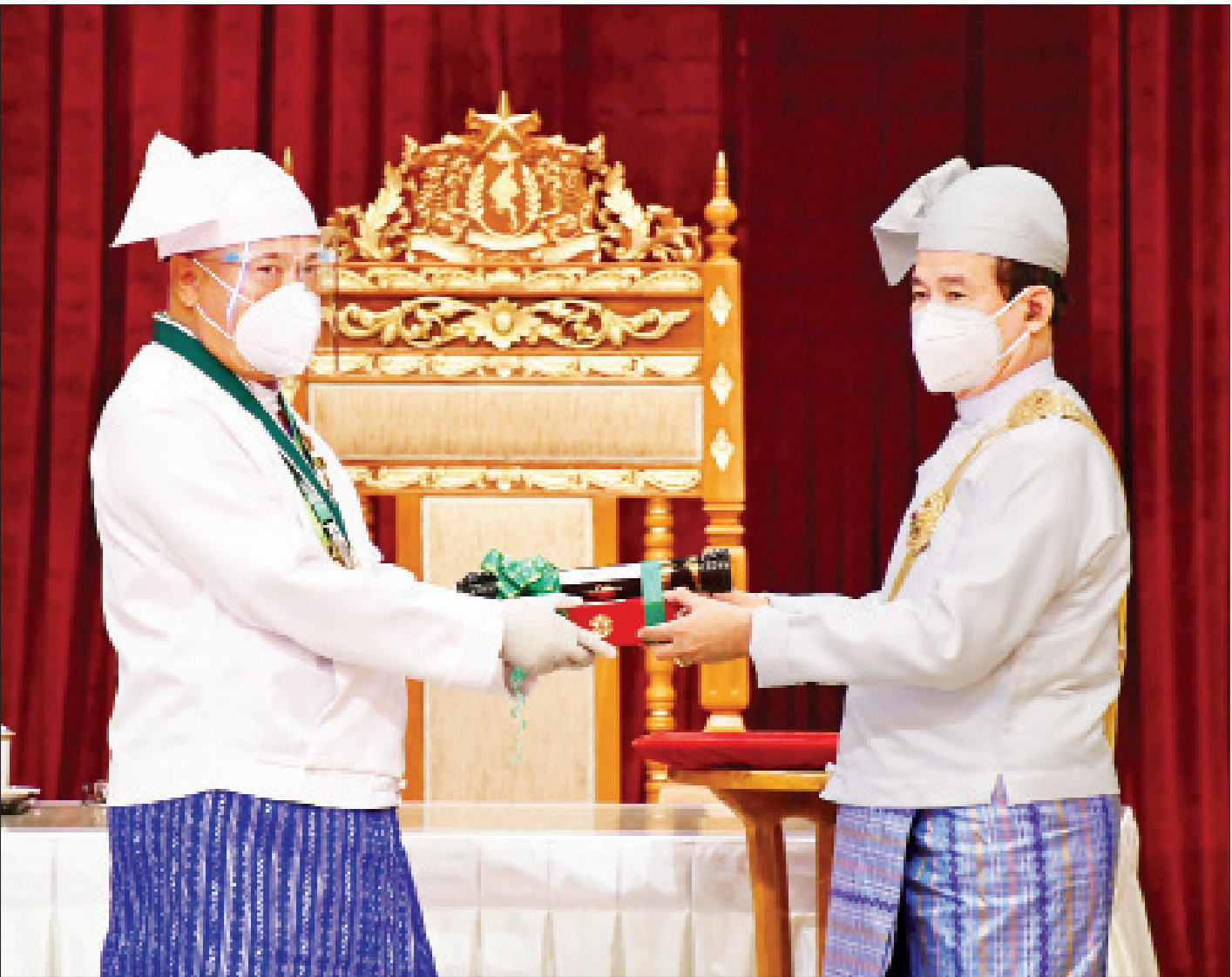
နိုင်ငံတော်သမ္မတ ဦးဝင်းမြင့် ကမ္ဘောဇဘဏ်လီမိတက် နာယက ဝဏ္ဏကျော်ထင်၊ စည်သူဦးအောင်ကိုဝင်းအား ၂၀၂၀ ပြည့်နှစ်တွင် ချီးမြှင့်အပ်နှင်းခဲ့သော ပြည်ထောင်စု စည်သူသင်္ဂဟဘွဲ့ဖြစ်သည့် သရေစည်သူဘွဲ့ ပေးအပ်ချီးမြှင့်စဉ်။