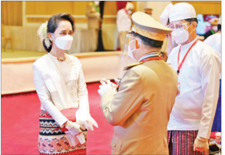
ဂုဏ်ထူးဆောင်ဘွဲ့များ ချီးမြှင့်အပ်နှင်းခြင်းအခမ်းအနားသို့ တက်ရောက်လာသော နိုင်ငံတော်၏ အတိုင်ပင်ခံပုဂ္ဂိုလ် ဒေါ်အောင်ဆန်းစုကြည်က တပ်မတော်ကာကွယ်ရေးဦးစီးချုပ် ဗိုလ်ချုပ်မှူးကြီးမင်းအောင်လှိုင် အား ရင်းရင်းနှီးနှီး တွေ့ဆုံနှုတ်ဆက်စဉ်။ (သတင်း - ရှေ့ဖိုး)