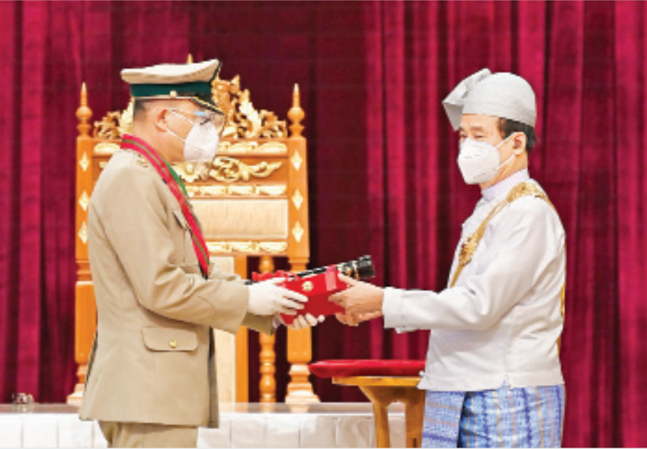
နိုင်ငံတော်သမ္မတ ဦးဝင်းမြင့် အမှတ် (၅၆၄) ခြေမြန်တပ်ရင်းမှ ဒုတိယဗိုလ်မှူးကြီးအေးမင်းအောင်အား ၂၀၂၀ ပြည့်နှစ်တွင် ချီးမြှင့်အပ်နှင်းခဲ့သော တပ်မတော်ဆိုင်ရာ စွမ်းရည်သတ္တိဘွဲ့ဖြစ်သည့် သိပ္ပံကျော်စွာဘွဲ့ ပေးအပ်ချီးမြှင့်စဉ်။

သူများ၊ ၎င်းတို့၏ မိသားစုဝင်များနှင့်အတူ မှတ်တမ်းတင်ဓာတ်ပုံရိုက်သည်။ အခမ်းအနားအပြီးတွင် နိုင်ငံတော်သမ္မတနှင့် နိုင်ငံတော်၏အတိုင်ပင်ခံပုဂ္ဂိုလ်တို့သည် တက်ရောက်လာကြသူများ၊ ဂုဏ်ထူးဆောင်ဘွဲ့ရရှိကြသူများနှင့် ၎င်းတို့၏မိသားစုဝင်များကို ရင်းရင်းနှီးနှီးနှုတ်ဆက်သည်။ သတင်းစဉ်