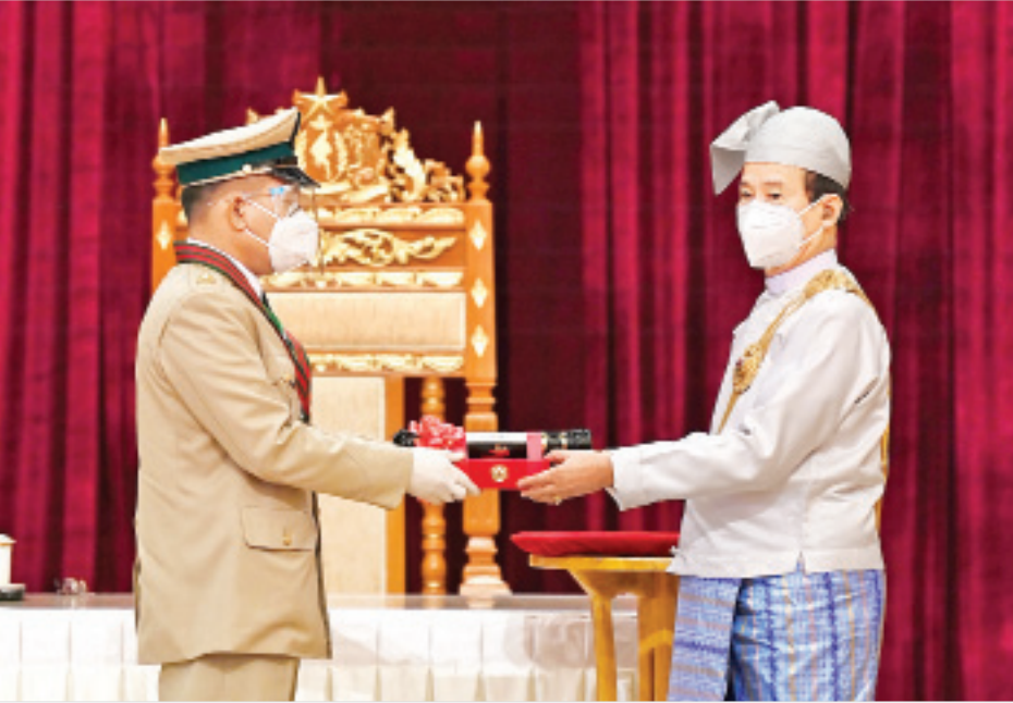
နိုင်ငံတော်သမ္မတ ဦးဝင်းမြင့် အမှတ် (၅၆၄) ခြေမြန်တပ်ရင်းမှ ဗိုလ်မှူးရန်နိုင်ဦးအား ၂၀၂၀ ပြည့်နှစ်တွင် ချီးမြှင့်အပ်နှင်းခဲ့သော တပ်မတော်ဆိုင်ရာ စွမ်းရည်သတ္တိဘွဲ့ဖြစ်သည့် သူရဘွဲ့ ပေးအပ်ချီးမြှင့်စဉ်။