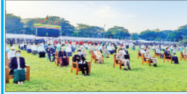
ပုသိမ်မြို့၌ ကျင်းပစဉ်။ ဓာတ်ပုံ-ပုသိမ်လှကြည်