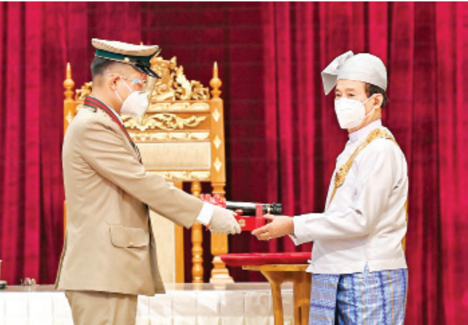
နိုင်ငံတော်သမ္မတ ဦးဝင်းမြင့် စစ်တက္ကသိုလ်မှ ဗိုလ်ကြီးဇော်ဦးလွင်အား ၂၀၂၀ ပြည့်နှစ်တွင် ချီးမြှင့်အပ်နှင်းခဲ့သော တပ်မတော်ဆိုင်ရာ စွမ်းရည်သတ္တိဘွဲ့ဖြစ်သည့် သူရဘွဲ့ ပေးအပ်ချီးမြှင့်စဉ်။