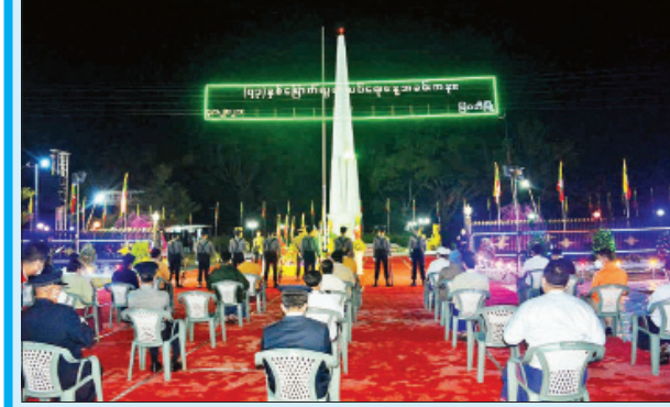
မြဝတီမြို့၌ ကျင်းပစဉ်။