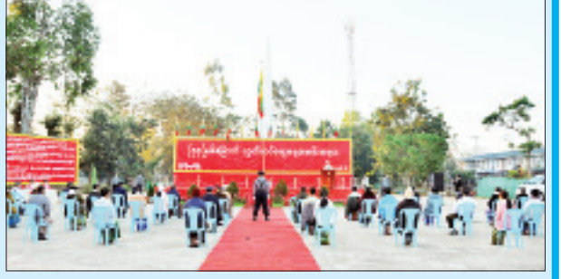
ပြင်ဦးလွင်မြို့၌ ကျင်းပစဉ်။