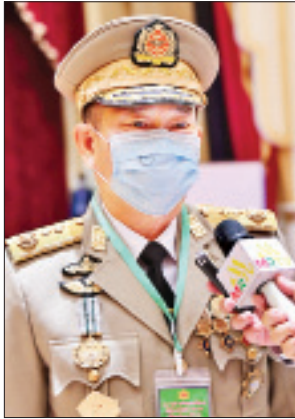
ဒုတိယဗိုလ်ချုပ်ကြီး ဇေယျကျော်ထင် သက်ပုံ