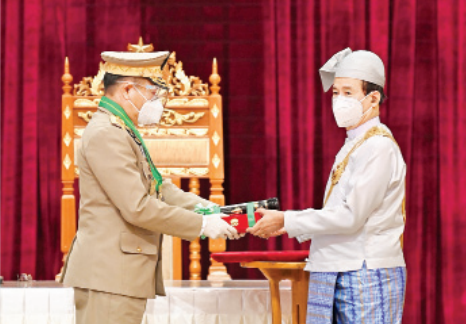
နိုင်ငံတော်သမ္မတ ဦးဝင်းမြင့် ဒုတိယဗိုလ်ချုပ်ကြီးသက်ပုံအား ၂၀၂၀ ပြည့်နှစ်တွင် ချီးမြှင့်အပ်နှင်းခဲ့သော စွမ်းဆောင်မှုဆိုင်ရာ ဂုဏ်ထူးဆောင်ဘွဲ့ဖြစ်သည့် ဇေယျကျော်ထင်ဘွဲ့ ပေးအပ်ချီးမြှင့်စဉ်။