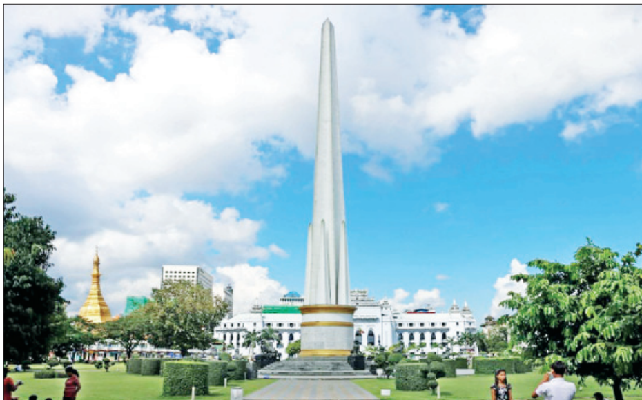
ရန်ကုန်မြို့၊ မဟာဗန္ဓုလပန်းခြံအတွင်းရှိ လွတ်လပ်ရေးကျောက်တိုင်အား တွေ့ရစဉ်။