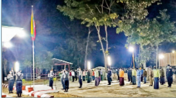
ပူတာအိုမြို့၌ ကျင်းပစဉ်။ ဓာတ်ပုံ-ဗိုလ်ကန်(ပူတာအို)