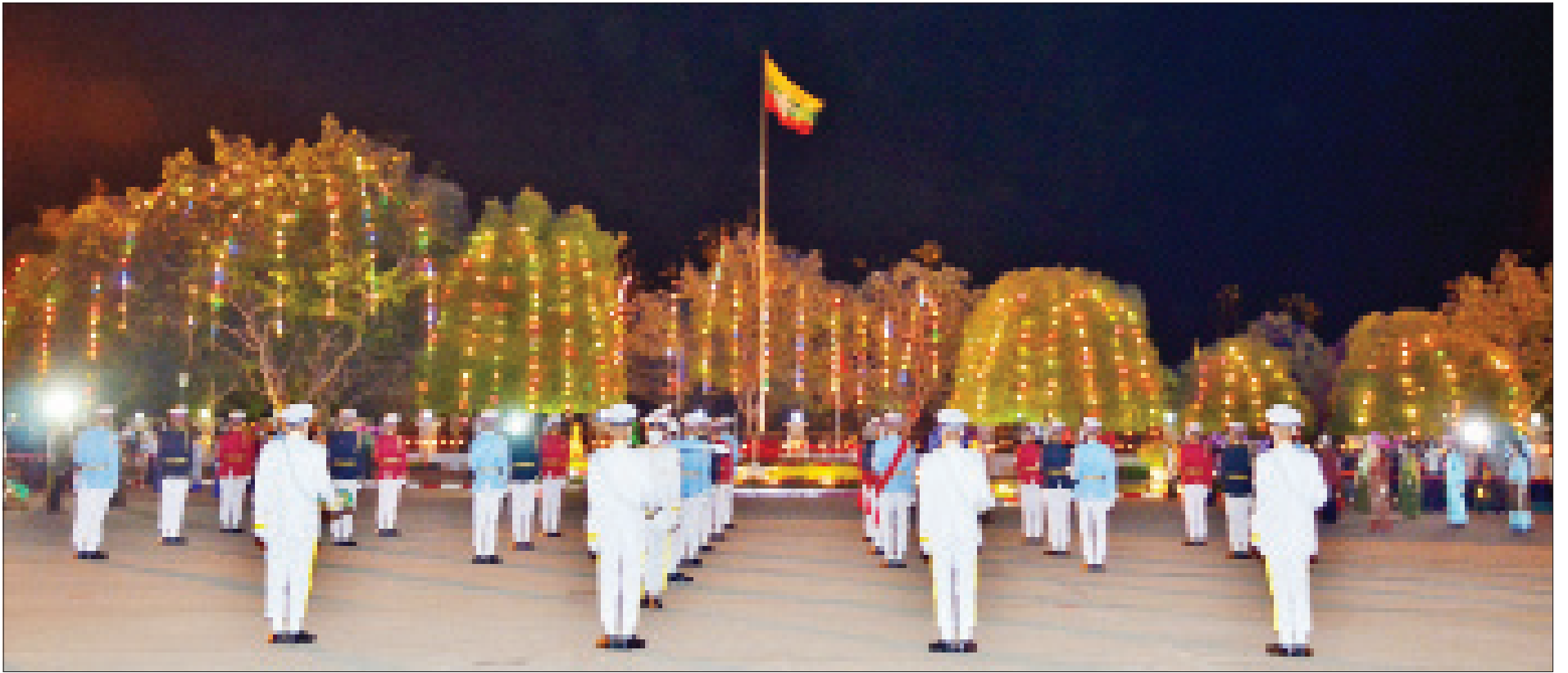
(၇၃)နှစ်မြောက် လွတ်လပ်ရေးနေ့ အလံတင်အခမ်းအနား ကျင်းပစဉ်။

ထို့နောက် နံနက် ၆ နာရီတွင် ပြည်သူ့လွှတ်တော် ဒုတိယဥက္ကဋ္ဌ ဦးထွန်းထွန်းဟိန်၊ အမျိုးသားလွှတ်တော် ဒုတိယဥက္ကဋ္ဌ ဦးအေးသာအောင်၊ ပြည်ထောင်စုဝန်ကြီးများ၊ ပြည်ထောင်စုရှေ့နေချုပ်၊ ပြည်ထောင်စုစာရင်းစစ်ချုပ်၊ ပြည်ထောင်စုရာထူးဝန်အဖွဲ့ ဥက္ကဋ္ဌ၊ နေပြည်တော်ကောင်စီဥက္ကဋ္ဌ၊ မြန်မာနိုင်ငံ တော်ဗဟိုဘဏ်ဥက္ကဋ္ဌ၊ အဂတိလိုက်စားမှုတိုက်ဖျက်ရေးကော်မရှင် ခေတ္တဥက္ကဋ္ဌ၊ မြန်မာနိုင်ငံ အမျိုးသားလူ့အခွင့်အရေးကော်မရှင်ဥက္ကဋ္ဌ၊ တပ်မတော်အရာရှိကြီး များ၊ ပြည်ထောင်စုတရားလွှတ်တော်ချုပ်တရားသူကြီးများ၊ နိုင်ငံတော်ဖွဲ့စည်းပုံ အခြေခံဥပဒေဆိုင်ရာခုံရုံး အဖွဲ့ဝင်များ၊ ပြည်ထောင်စုရွေးကောက်ပွဲကော်မရှင် အဖွဲ့ဝင်များ၊ နေပြည်တော်တိုင်းစစ်ဌာနချုပ် တိုင်းမှူး၊ ဒုတိယဝန်ကြီးများ၊ ဒုတိယရှေ့နေချုပ်၊ ပြည်ထောင်စုရာထူးဝန်အဖွဲ့ အဖွဲ့ဝင်များ၊ နေပြည်တော်