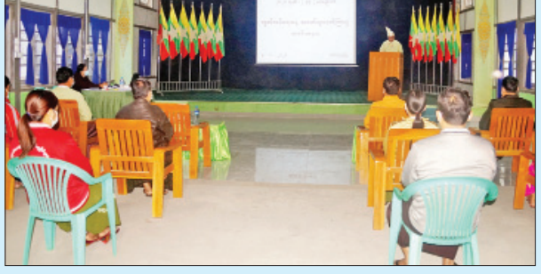
တပ်ကုန်းမြို့၌ ကျင်းပစဉ်။