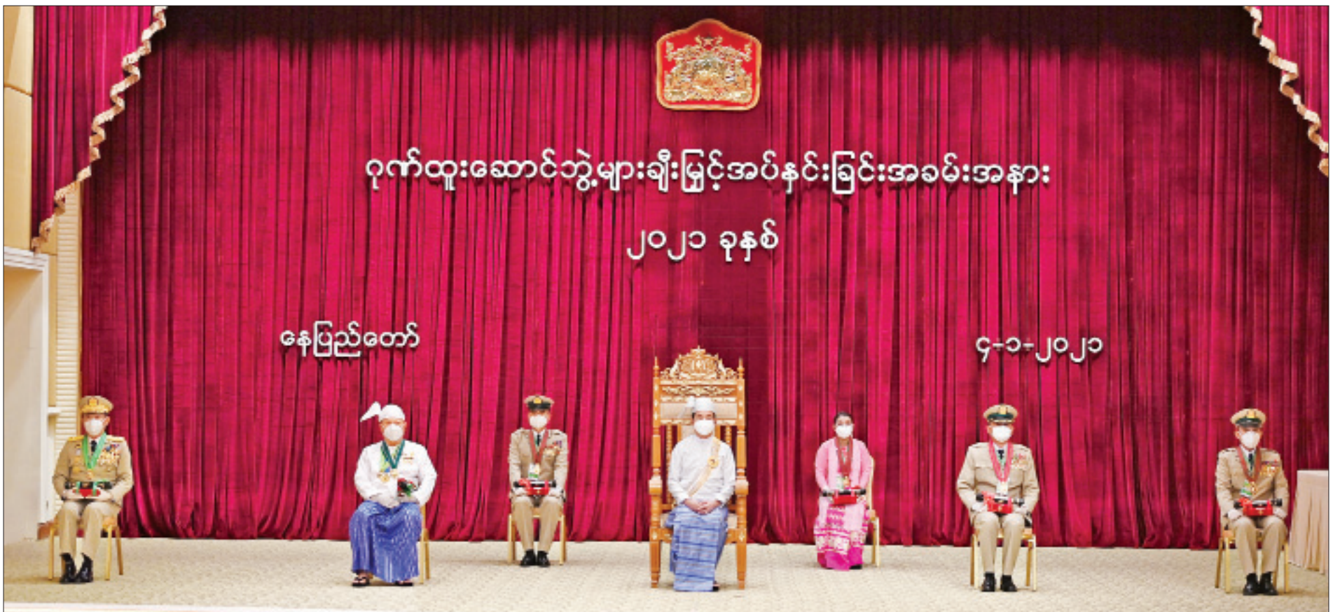
နိုင်ငံတော်သမ္မတ ဦးဝင်းမြင့် ဂုဏ်ထူးဆောင်ဘွဲ့များ ချီးမြှင့်အပ်နှင်းခြင်းအခမ်းအနားတွင် ဂုဏ်ထူးဆောင်ဘွဲ့များ ရရှိကြသူများနှင့်အတူ မှတ်တမ်းတင်ဓာတ်ပုံရိုက်စဉ်။ (သတင်း - ရှေ့ဖိုး)