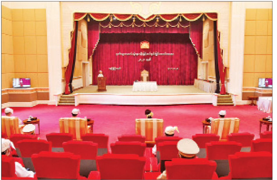
ဂုဏ်ထူးဆောင်ဘွဲ့များ ချီးမြှင့်အပ်နှင်းခြင်းအခမ်းအနား ကျင်းပစဉ်။ (သတင်း - ရှေ့ဖိုး)