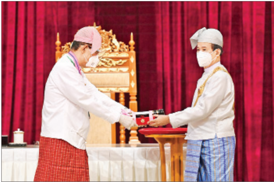
နိုင်ငံတော်သမ္မတ ဦးဝင်းမြင့် ဘာသာရပ်ဆိုင်ရာပညာရှင် ဦးကျော်ဝင်းအား ၂၀၂၀ ပြည့်နှစ်တွင် ချီးမြှင့်အပ်နှင်း ခဲ့သော သိပ္ပံကျော်စွာဘွဲ့ ပေးအပ်ချီးမြှင့်စဉ်။ (သတင်း - ရှေ့ဖိုး)