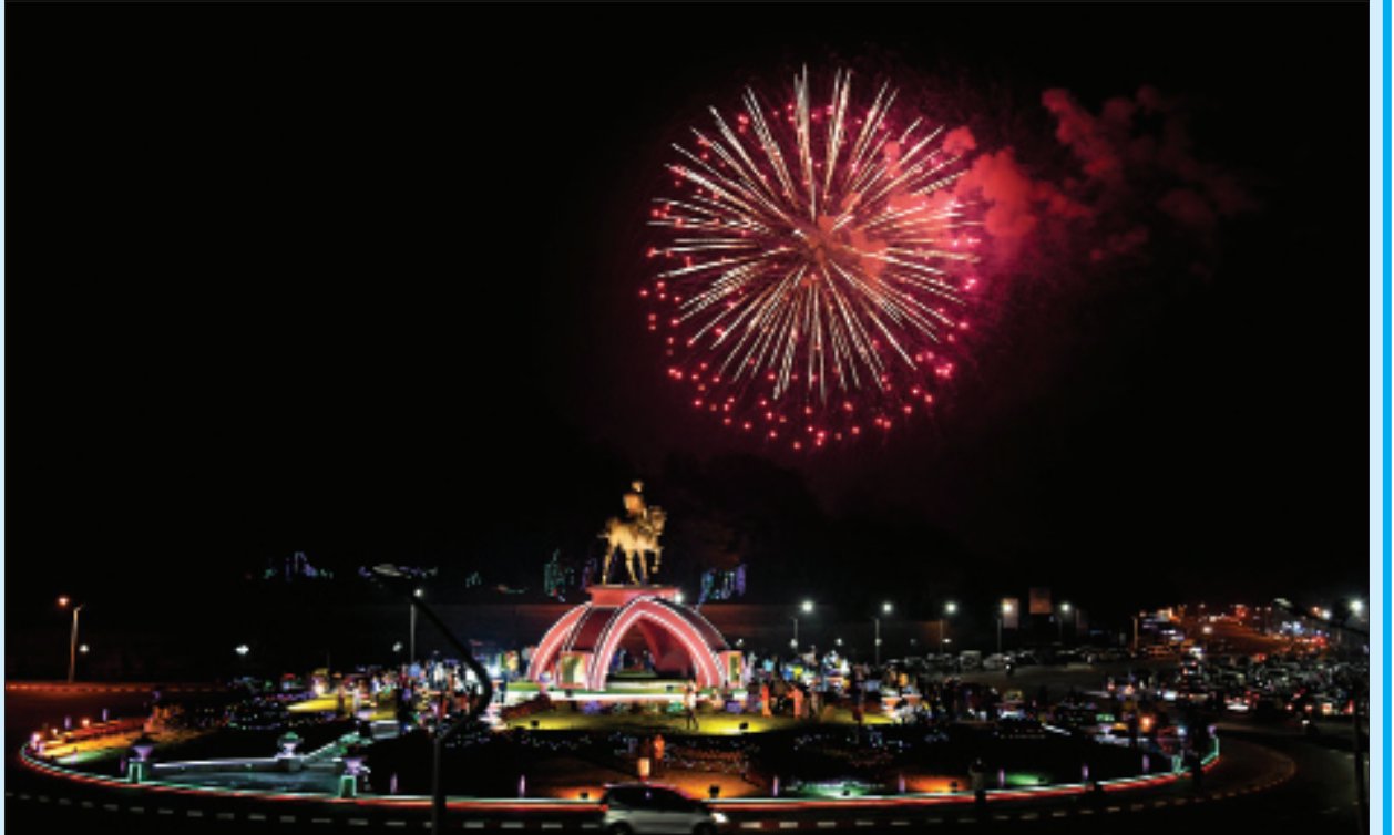
နေပြည်တော်၌ မီးရှူးမီးပန်းများ ပစ်ဖောက်စဉ်။