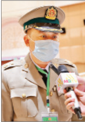
ဒုတိယဗိုလ်မှူးကြီး သီဟသူရ အေးမင်းအောင်