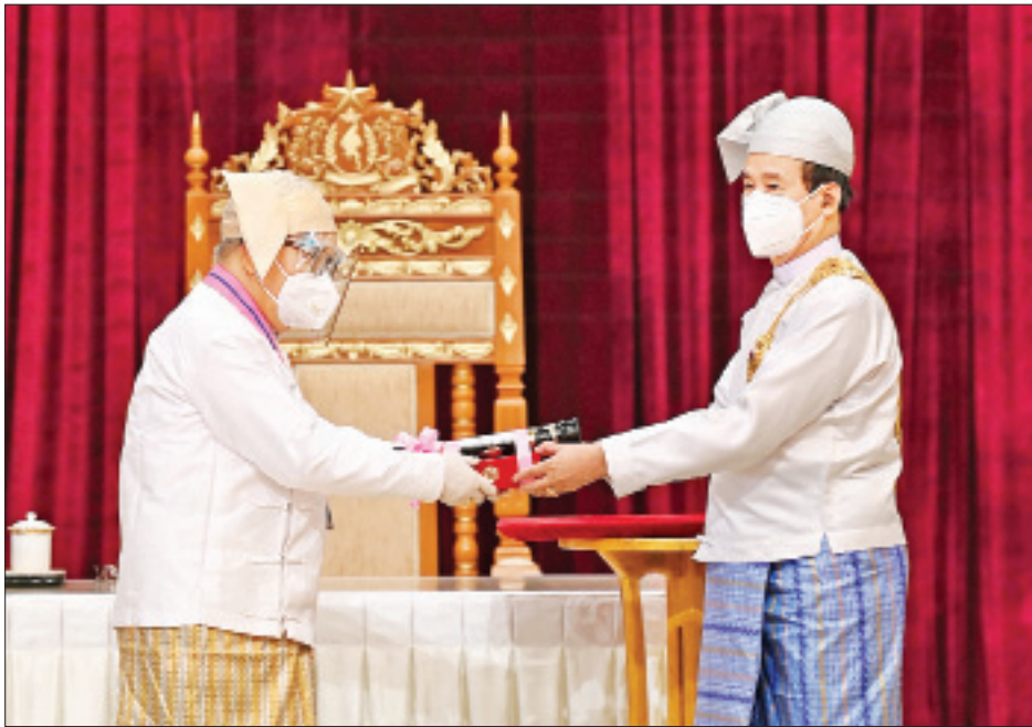
နိုင်ငံတော်သမ္မတ ဦးဝင်းမြင့် ဘာသာရပ်ဆိုင်ရာပညာရှင် ဒေါက်တာတိုးလှအား ၂၀၂၀ ပြည့်နှစ်တွင် ချီးမြှင့် အပ်နှင်းခဲ့သော သိပ္ပံကျော်စွာဘွဲ့ ပေးအပ်ချီးမြှင့်စဉ်။ (သတင်း - ရှေ့ဖိုး)