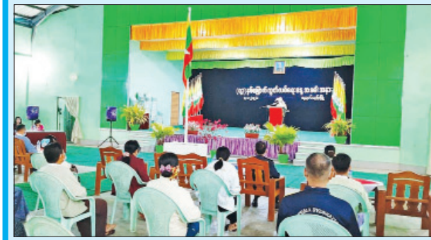
ညောင်တုန်းမြို့၌ ကျင်းပစဉ်။