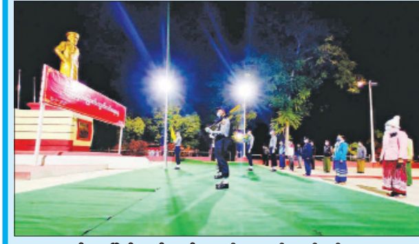
မင်းဘူးမြို့၌ ကျင်းပစဉ်။

နေပြည်တော် ဇန်နဝါရီ ၄ (၇၃)နှစ်မြောက် လွတ်လပ်ရေးနေ့ အခမ်းအနားကို ယနေ့နံနက်ပိုင်းတွင် နိုင်ငံတစ်ဝန်း၌ ကျင်းပလျက်ရှိရာ အဆိုပါအခမ်းအနားသို့ တက်ရောက်လာကြသူများက ပြည်ထောင်စုသမ္မတမြန်မာနိုင်ငံတော်အလံအား လွှင့်တင်ပြီး အလေးပြုကြခြင်း၊ နိုင်ငံတော်သမ္မတတံဆိပ် ပေးပို့သော (၇၃)နှစ်မြောက် လွတ်လပ်ရေးနေ့ သဝဏ်လွှာအား ဖတ်ကြားခြင်းနှင့် ညပိုင်းတွင် နေပြည်တော်၌ မီးရှူးမီးပန်းများ ပစ်ဖောက်ခြင်းတို့ ဆောင်ရွက်ခဲ့ကြသည်။