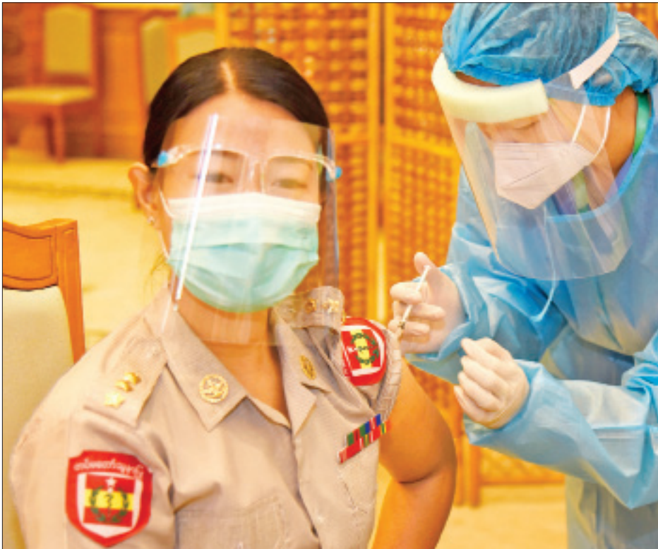
တပ်မတော်သားလွှတ်တော်ကိုယ်စားလှယ်တစ်ဦး ကိုဗစ်-၁၉ ကာကွယ်ဆေး ထိုးနှံမှုခံယူစဉ်။