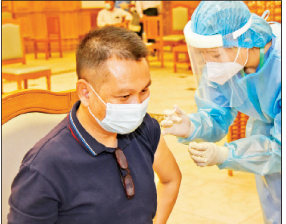
အမျိုးသားလွှတ်တော်ကိုယ်စားလှယ်တစ်ဦး ကိုဗစ်-၁၉ ကာကွယ်ဆေး ထိုးနှံမှုခံယူစဉ်။