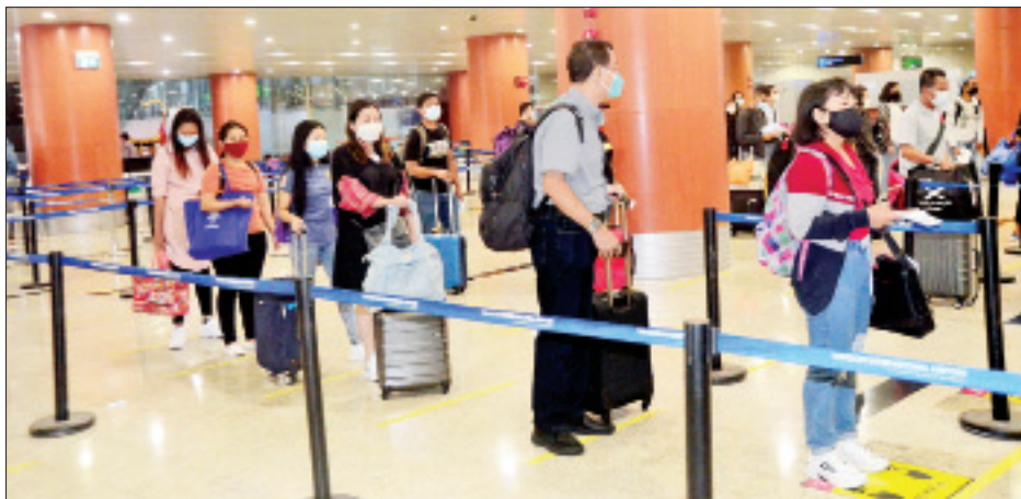
စင်ကာပူနိုင်ငံမှ ပြန်လည်ရောက်ရှိလာသည့် မြန်မာနိုင်ငံသားများအား ရန်ကုန်အပြည်ပြည်ဆိုင်ရာလေဆိပ်၌ တွေ့ရစဉ်။

ထို့ပြင် စင်ကာပူနိုင်ငံတွင် အခက်အခဲကြုံတွေ့နေရသည့် မြန်မာနိုင်ငံသား ၁၂၂ ဦးကို မြန်မာသံရုံး စင်ကာပူမြို့မှ