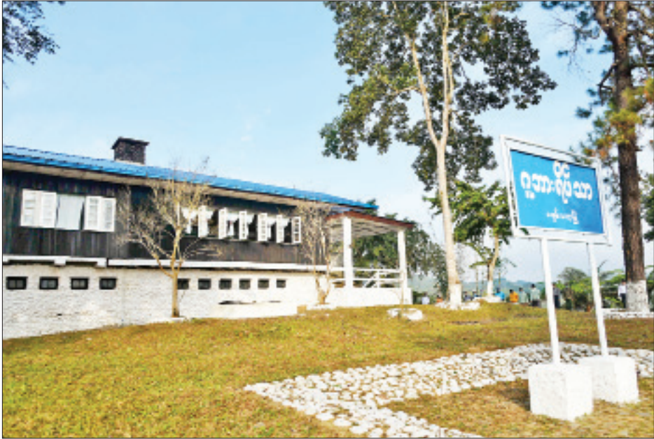
မချမ်းဘောမြို့ရှိ လူသားရိပ်သာ ထိန်းသိမ်းထားရှိမှုကို တွေ့ရစဉ်။