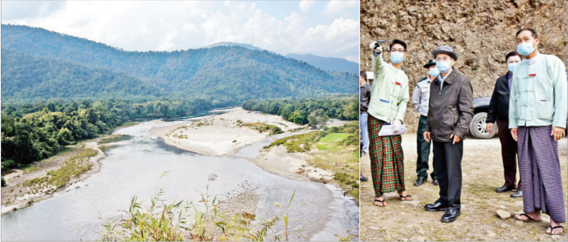
ဒုတိယသမ္မတ ဦးမြင့်ဆွေ နောင်မွန်မြို့ ဖွံ့ဖြိုးတိုးတက်မှုအခြေအနေများ ကြည့်ရှုစစ်ဆေးစဉ်။

ပူတာအို ဇန်နဝါရီ ၃၀ ကချင်ပြည်နယ် ပူတာအိုမြို့၌ ရောက်ရှိနေသည့် ဒုတိယသမ္မတ ဦးမြင့်ဆွေသည် ပြည်ထောင်စုဝန်ကြီး ဒုတိယဗိုလ်ချုပ်ကြီးရဲအောင်၊ ပြည်နယ်ဝန်ကြီးချုပ် ဒေါက်တာခက်အောင်၊ ဒုတိယဝန်ကြီး ဗိုလ်ချုပ်စိုးတင်နိုင်နှင့် ဒေါက်တာရဲမြင့်ဆွေ၊ မြောက်ပိုင်းတိုင်းစစ်ဌာနချုပ် ဒုတိယတိုင်းမှူး ဗိုလ်မှူးချုပ်အောင်မျိုးဦး၊ ပြည်နယ်အစိုးရအဖွဲ့ လုံခြုံရေးနှင့်နယ်စပ်ရေးရာဝန်ကြီး ဗိုလ်မှူးကြီး ကျော်လင်းအောင်၊ အမြဲတမ်းအတွင်းဝန်များ၊ ညွှန်ကြားရေးမှူးချုပ်များ၊ တာဝန်ရှိသူများနှင့်အတူ ယနေ့နံနက်ပိုင်းတွင် မော်တော်ယာဉ်များဖြင့် မချမ်းဘောမြို့ရှိ ဂူဘားရိပ်သာသို့ ရောက်ရှိခဲ့ရာ ပူတာအိုခရိုင် အုပ်ချုပ်ရေးမှူး ဦးသန့်ဇင်က ဂူဘားရိပ်သာ၏သမိုင်းကြောင်းနှင့် ထိန်းသိမ်းရေးလုပ်ငန်းများ ဆောင်ရွက်ထားရှိမှုအခြေအနေများအား လိုက်လံရှင်းလင်းတင်ပြသည်။ ရှင်းလင်းတင်ပြချက်များနှင့်စပ်လျဉ်း၍ ဒုတိယသမ္မတက သမိုင်းဝင်အဆောက်အအုံဖြစ်သဖြင့် ရေရှည်တည်တံ့စေရေးအတွက် စနစ်တကျ ထိန်းသိမ်းဆောင်ရွက်သွားရန် လမ်းညွှန်မှာကြားသည်။ စာမျက်နှာ ၄ ကော်လံ ၁ သို့ ▢