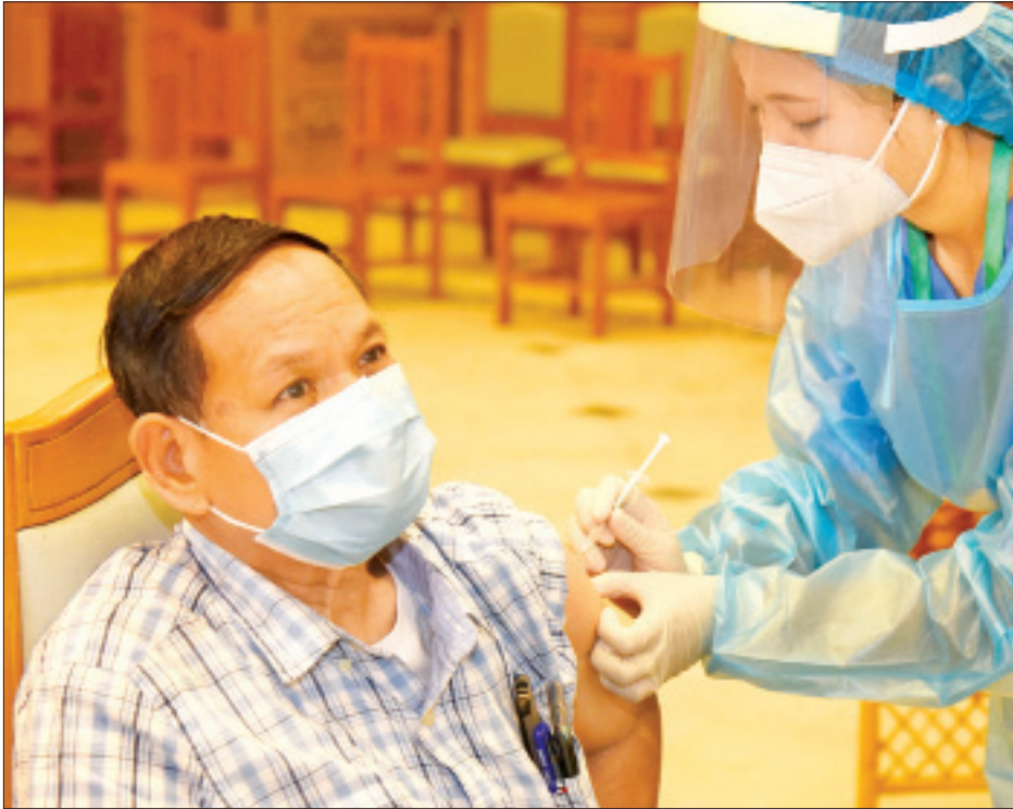
အမျိုးသားလွှတ်တော်ကိုယ်စားလှယ်တစ်ဦး ကိုဗစ်-၁၉ ကာကွယ်ဆေး ထိုးနှံမှုခံယူစဉ်။

သတင်း-မျိုးမင်းနိုင် ဓာတ်ပုံ- ကိုကြီးထိန်(MNA)