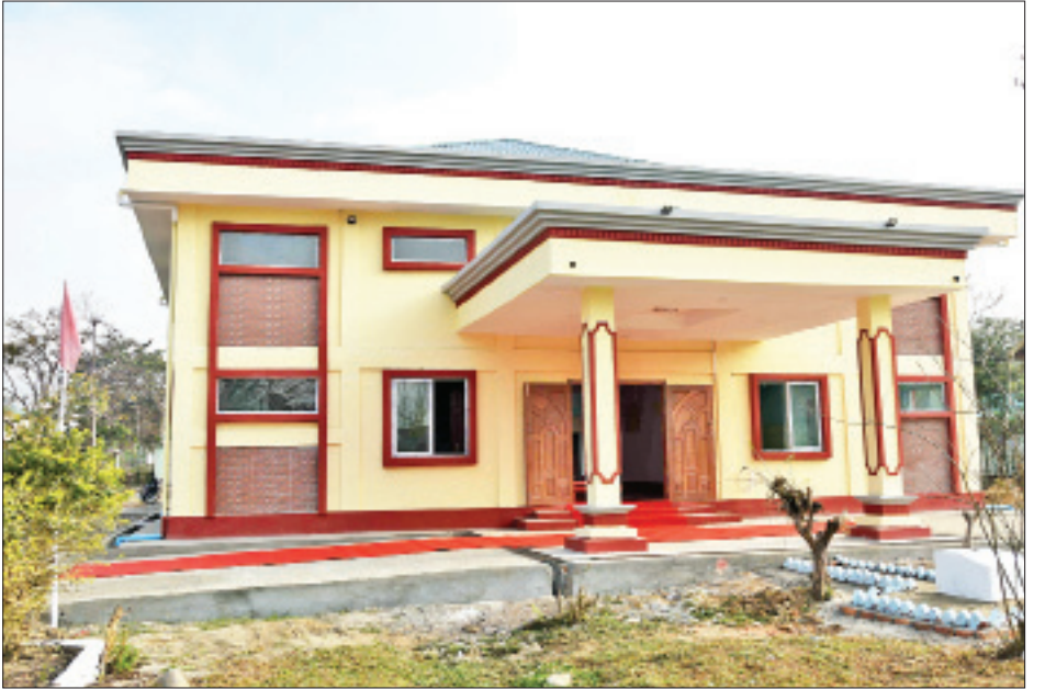
မချမ်းဘောမြို့ရှိ မြို့နယ်ခန့်မတည်ဆောက်ပြီးစီးမှုကို တွေ့ရစဉ်။