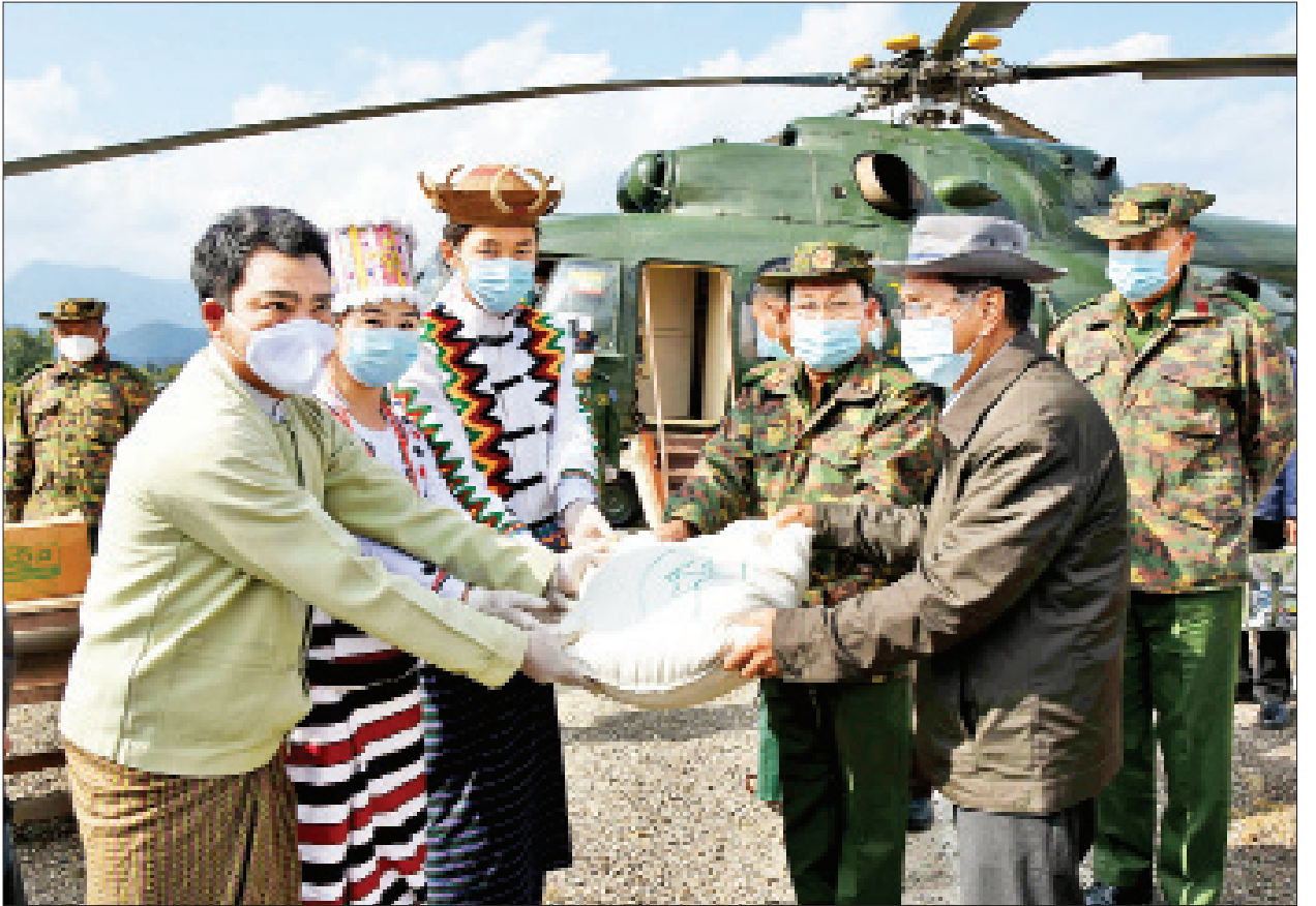
ဒုတိယသမ္မတ ဦးမြင့်ဆွေ ပန်နန်းဒင်မြို့ ဒေသခံပြည်သူများအတွက် ဆန်များ ထောက်ပံ့ပေးအပ်စဉ်။

ထို့နောက် ဒုတိယသမ္မတသည် လမ်းပန်းဆက်သွယ်ရေးခက်ခဲသည့်