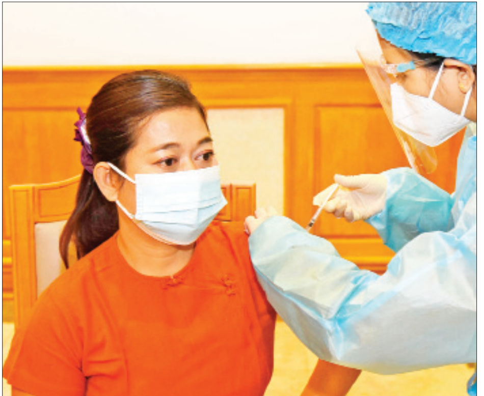
အမျိုးသားလွှတ်တော်ကိုယ်စားလှယ်တစ်ဦး ကိုဗစ်-၁၉ ကာကွယ်ဆေး ထိုးနှံမှုခံယူစဉ်။