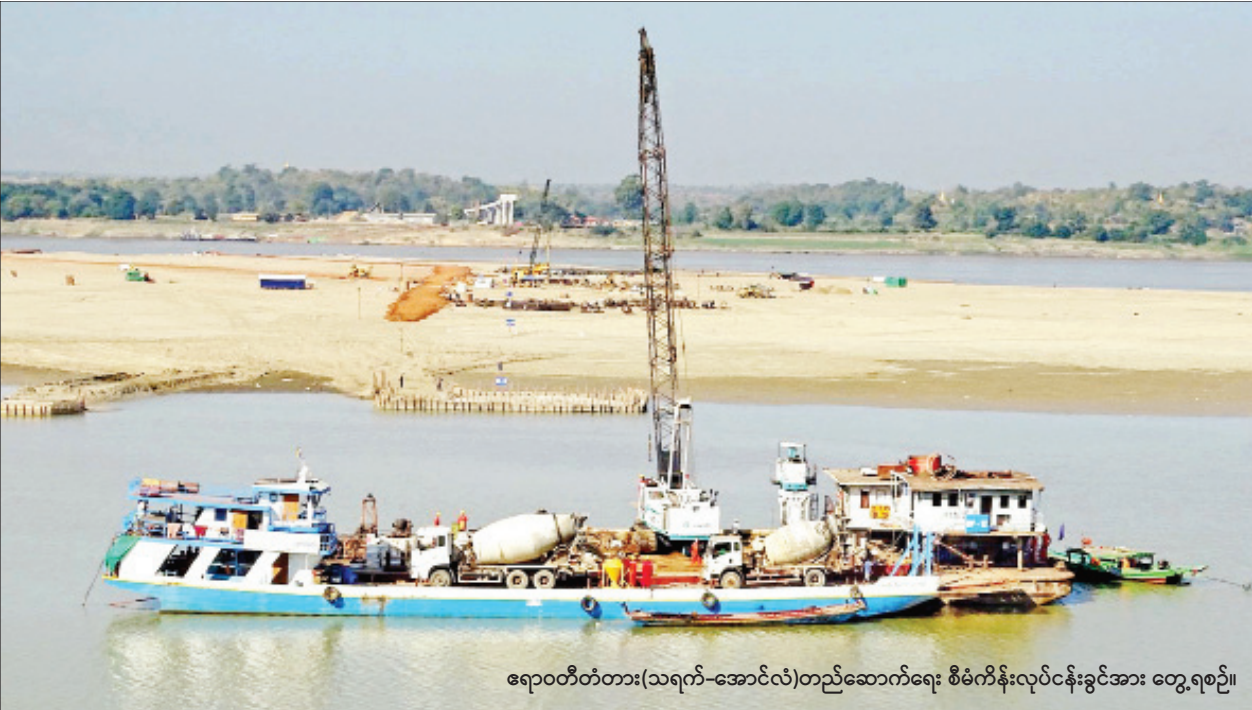
ဧရာဝတီတံတား(သရက်-အောင်လံ)တည်ဆောက်ရေး စီမံကိန်းလုပ်ငန်းခွင်အား တွေ့ရစဉ်။

သရက် ဇန်နဝါရီ ၃၀ မကွေးတိုင်းဒေသကြီး သရက်မြို့နှင့် အောင်လံမြို့သို့ ဆက်သွယ်ပေးမည့် ဧရာဝတီတံတား (သရက်- အောင်လံ)ကို ဆောက်လုပ်ရေးဝန်ကြီးဌာန တံတား ဦးစီးဌာန တည်ဆောက်ရေးအဖွဲ့(၃)က တာဝန်ယူ