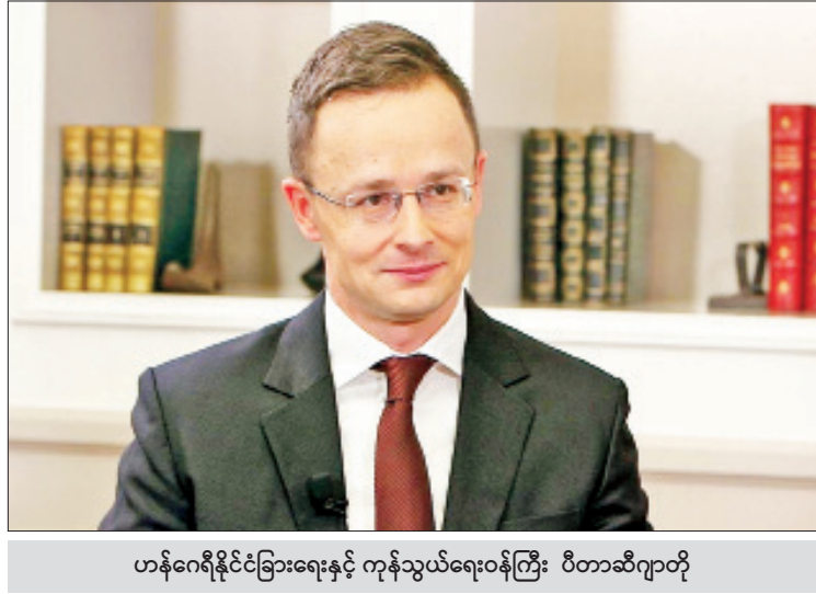
ဟန်ဂေရီနိုင်ငံခြားရေးနှင့် ကုန်သွယ်ရေးဝန်ကြီး ပီတာဆီဂျာတို