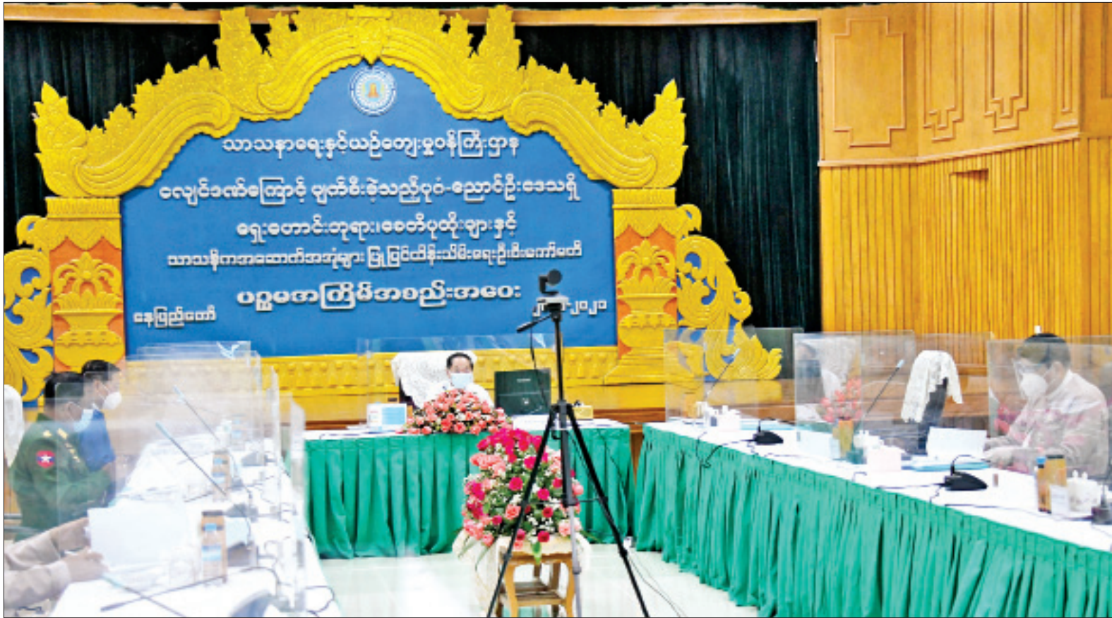
ဒုတိယသမ္မတ ဦးမြင့်ဆွေ ငလျင်ဒဏ်ကြောင့် ပျက်စီးခဲ့သည့် ပုဂံ-ညောင်ဦးဒေသရှိ ရှေးဟောင်းဘုရား၊ စေတီပုထိုးများနှင့် သာသနိက အဆောက်အအုံများ ပြုပြင်ထိန်းသိမ်းရေး ဦးစီးဌာန၏ ပဉ္စမအကြိမ် အစည်းအဝေးတွင် အမှာစကား ပြောကြားစဉ်။

နေပြည်တော် ဇန်နဝါရီ ၂၆ ငလျင်ဒဏ်ကြောင့် ပျက်စီးခဲ့သည့် ပုဂံ-ညောင်ဦးဒေသရှိ ရှေးဟောင်းဘုရား၊ စေတီပုထိုးများနှင့် သာသနိက အဆောက်အအုံများ ပြုပြင်ထိန်းသိမ်းရေးဦးစီးဌာန၏ ပဉ္စမအကြိမ် ညှိနှိုင်းအစည်းအဝေးကို ဗီဒီယိုကွန်ဖရင့်စနစ်ဖြင့် ယနေ့နံနက် ၉ နာရီခွဲတွင် သာသနာရေးနှင့် ယဉ်ကျေးမှုဝန်ကြီးဌာန ယဉ်ကျေးမှုဓနခန်းမ၌ ကျင်းပရာ ငလျင်ဒဏ်ကြောင့် ပျက်စီးခဲ့သည့် ပုဂံ-ညောင်ဦးဒေသရှိ ရှေးဟောင်းဘုရား၊ စေတီပုထိုးများနှင့် သာသနိက အဆောက်အအုံများ ပြုပြင်ထိန်းသိမ်းရေး ဦးစီးဌာန၏ ဒုတိယသမ္မတ ဦးမြင့်ဆွေ တက်ရောက်အမှာစကား ပြောကြားသည်။ တက်ရောက်ဆွေးနွေး အစည်းအဝေးသို့ နယ်စပ်ရေးရာ ဝန်ကြီးဌာန ပြည်ထောင်စုဝန်ကြီး ဒုတိယဗိုလ်ချုပ်ကြီး ရဲအောင်၊ ပြန်ကြားရေးဝန်ကြီးဌာန ပြည်ထောင်စုဝန်ကြီး ဒေါက်တာဖေမြင့်၊ သာသနာရေးနှင့် ယဉ်ကျေးမှုဝန်ကြီးဌာန ပြည်ထောင်စုဝန်ကြီးသူရဦးအောင်ကို၊ ဆောက်လုပ်ရေး ဝန်ကြီးဌာန ပြည်ထောင်စုဝန်ကြီး ဦးဟန်ဇော်၊ စာမျက်နှာ ၃ ကော်လံ ၁ သို့ ။