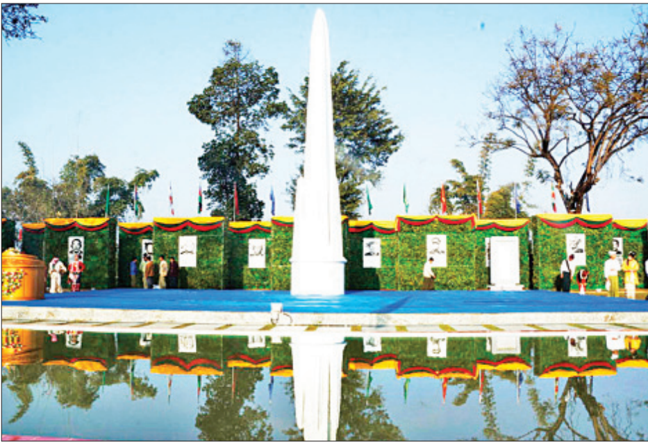
စစ်မှန်သော ညီညွတ်ရေးဟူသည်

ထိုခေတ်ကာလ အမျိုးသားခေါင်းဆောင်ကြီးက အမှားကို ထောက်ပြခဲ့သော်လည်း လက်မခံဘဲ တဖွတ်ထိုးလုပ်ခဲ့ကြသည့် ပါတီစွဲ၊ ပုဂ္ဂိုလ်စွဲ၊ ဂိုဏ်းဂဏစွဲ၊ အစွဲကြီးစွဲသူများအတွက် အမှားများရှိခဲ့ပုံကို သတိရမိစေသည်။ လူနာရှင်က သတိပေးနေသည့်ကြားမှ လူနာယောက်ျားကို မီးယပ်ရောဂါသည်အဖြစ် ဇွတ်ကုနေသည့် ဆေးဆရာကဲ့သို့ “ကျားကျားမီးယပ်” မဖြစ်ကြစေရန် သတိပေးထားပုံသည် အမှန်အတုယူထိုက်သည့် စကားပင်ဖြစ်သည်။