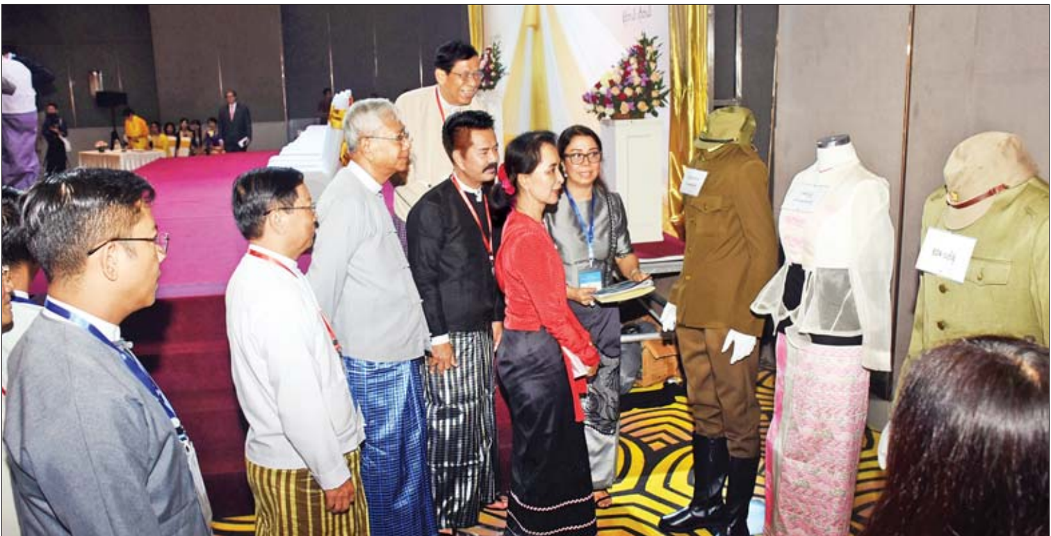
နိုင်ငံတော်၏အတိုင်ပင်ခံပုဂ္ဂိုလ် ဒေါ်အောင်ဆန်းစုကြည်၊ နိုင်ငံတော်သမ္မတဟောင်း ဦးထင်ကျော်နှင့် အခမ်းအနားသို့ တက်ရောက်လာသူများ “အောင်ဆန်း” ရုပ်ရှင်တွင် ပါဝင်သရုပ်ဆောင်ကြမည့် သရုပ်ဆောင်များအသုံးပြုမည့် ခေတ်အလိုက် အဝတ်အထည်အသုံးအဆောင်ပစ္စည်းများ ခင်းကျင်းပြသထားမှုကို လှည့်လည်ကြည့်ရှုကြစဉ်။

ရုပ်ရှင်တစ်ကားမျှသာဖြစ် ဆက်လက်၍ “အောင်ဆန်း” ရုပ်ရှင်ဒါရိုက်တာ ဦးလူမင်းက “အောင်ဆန်း” ရုပ်ရှင်ရိုက်ကူးမည့် အစီအစဉ်များကို ရှင်းလင်းတင်ပြရာတွင် ဗိုလ်ချုပ်အောင်ဆန်းအကြောင်း ရိုက်ကူးရန် လေ့လာလေ့လာ၊ ဗိုလ်ချုပ်၏ စိတ်နှလုံးတိုင်းမြင်မြတ်မှုကို သိလာလေ့လာ ဖြစ်ရပါကြောင်း၊ ကြိုတင်ပန်ကြားထားချင်သည်မှာ ၎င်းရုပ်ရှင်သည် သမိုင်းမှတ်တမ်း၊ စစ်ကားနှင့် အတ္ထုပ္ပတ္တိရုပ်ရှင်ကား မဟုတ်ပါကြောင်း၊ ရုပ်ရှင်တစ်ကားမျှသာဖြစ်ပါကြောင်း၊ ၎င်းရုပ်ရှင်သည် မိမိတို့နိုင်ငံ၏ လွတ်လပ်ရေးအကြောင်းကို ပြောပြမည်ဖြစ်ပါကြောင်း၊ ဤရုပ်ရှင်သည် မိမိတို့ မြန်မာ