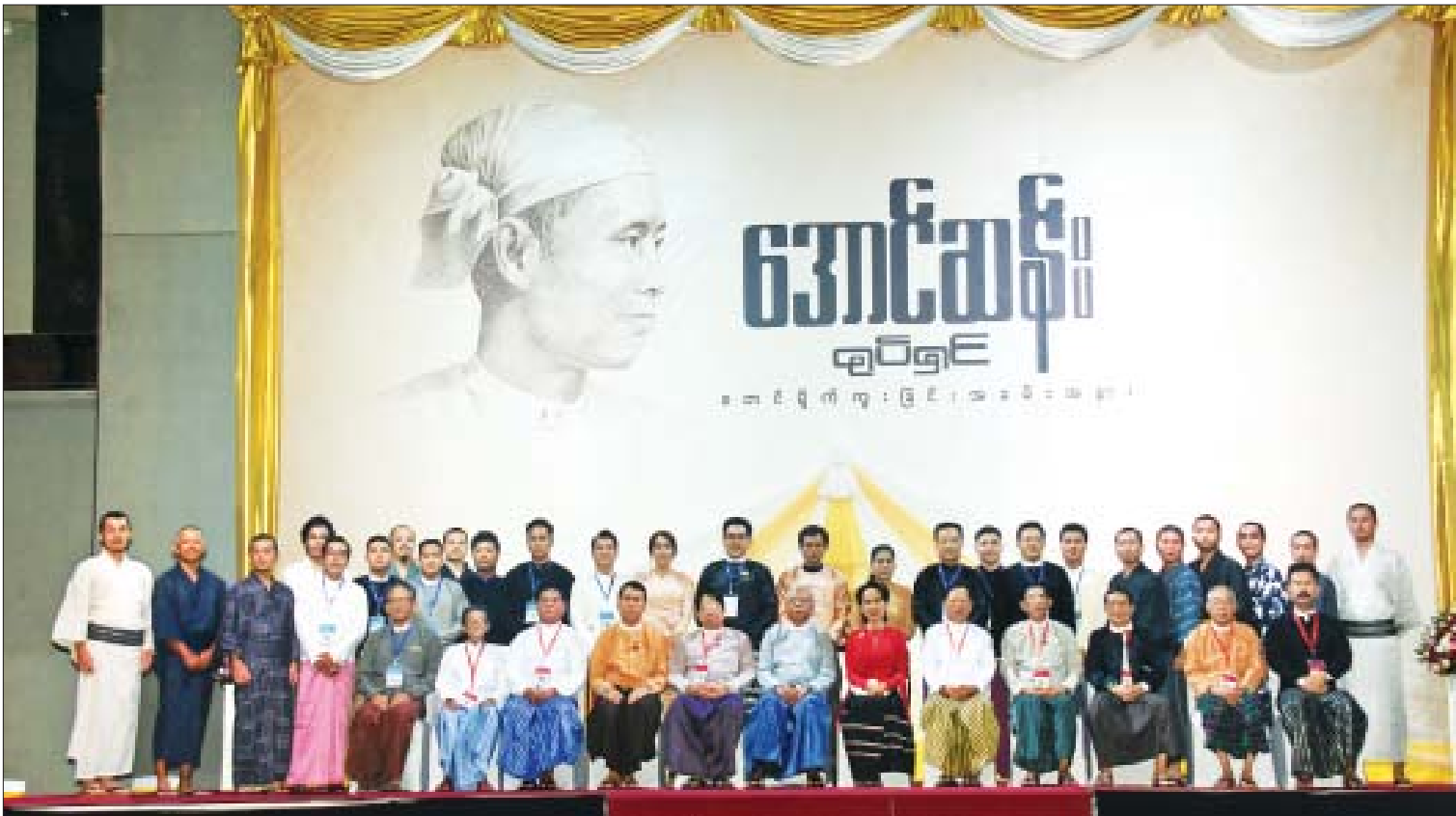
နိုင်ငံတော်၏အတိုင်ပင်ခံပုဂ္ဂိုလ် ဒေါ်အောင်ဆန်းစုကြည်၊ နိုင်ငံတော်သမ္မတဟောင်း ဦးထင်ကျော်၊ ပြည်ထောင်စုဝန်ကြီးများနှင့် တာဝန်ရှိသူများ “အောင်ဆန်း” ရုပ်ရှင်တွင် ပါဝင်သရုပ်ဆောင်ကြမည့် သရုပ်ဆောင်များနှင့်အတူ စုပေါင်းမှတ်တမ်းတင်ဓာတ်ပုံရိုက်စဉ်။

တပ်မတော်ဘယ်ကစသလဲဆိုသည်ကို ပြောပြမည်ဖြစ်ပါကြောင်း၊ ယင်းရုပ်ရှင်မှ အောင်ဆန်းဆိုသည့်လူငယ်လေးတစ်ယောက် အောင်ဆန်းဆိုသည့်တက္ကသိုလ်ကျောင်းသားတစ်ယောက်၊ တက္ကသိုလ်ကျောင်းသား ခေါင်းဆောင်တစ်ယောက်၊ နိုင်ငံရေးသမားတစ်ယောက်၊ ယင်းမှ စစ်သေနာပတိချုပ်တစ်ယောက်၊ ထိုမှ အမျိုးသားခေါင်းဆောင်၊ နိုင်ငံခေါင်းဆောင်၊ နောက်ဆုံး မြန်မာနိုင်ငံကြီး၏ လွတ်လပ်ရေး ဗိသုကာအဖြစ် မည်သို့ကြိုးစားအားထုတ်ခဲ့သည်ကို ပြောပြမည်ဖြစ်ပါကြောင်း။