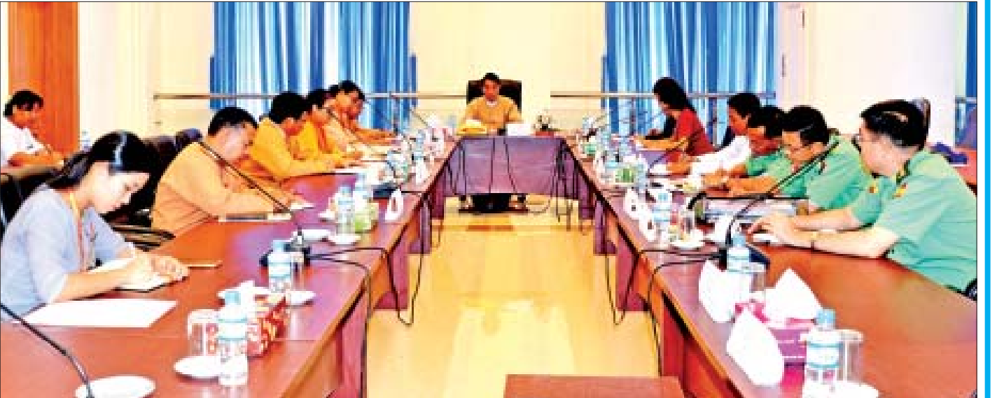
ပြည်သူ့လွှတ်တော်ကျန်းမာရေးနှင့် အားကစားဖွံ့ဖြိုးတိုးတက်ရေးကော်မတီ နယ်စည်းမခြား ဆရာဝန်များအဖွဲ့အား လက်ခံတွေ့ဆုံစဉ်။

ကျွန်တော်အနေနဲ့ ကျန်းမာရေး၊ အားကစားနဲ့ပတ်သက်တဲ့ အဆိုတွေနဲ့ အခြားအဆို ၂၆ ခု ထောက်ခံဆွေးနွေးခဲ့ပြီး မေးခွန်းပေါင်း ၃၀ ဝန်းကျင် မေးမြန်းခဲ့ပါတယ်။ အစိုးရကို over sight လုပ်တဲ့သဘောတွေဖြစ်ပါတယ်။ ကျန်းမာရေး၊ အားကစားနဲ့ဆိုင်တာကတော့ ဒေသဖွံ့ဖြိုးရေး၊ ပြည်ထောင်စုနိုင်ငံရေးနဲ့ဆိုင်တာတွေ ဖြစ်ပါတယ်။ ကော်မတီအစည်းအဝေး အကြိမ်ရေ ၄၀ ခန့် တက်ရောက်ခဲ့ပြီး လာရောက်ဆွေးနွေးတင်ပြတဲ့ ပြည်တွင်း၊ ပြည်ပအဖွဲ့အစည်းတွေနဲ့ တွေ့ဆုံဆွေးနွေးခဲ့ပါတယ်။ ကျန်းမာရေးနဲ့ အားကစားဖွံ့ဖြိုးတိုးတက်ရေး အတွက် အား/ကာသီပွဲရန်ကုန်နဲ့ မြောက်ဥက္ကလာပ