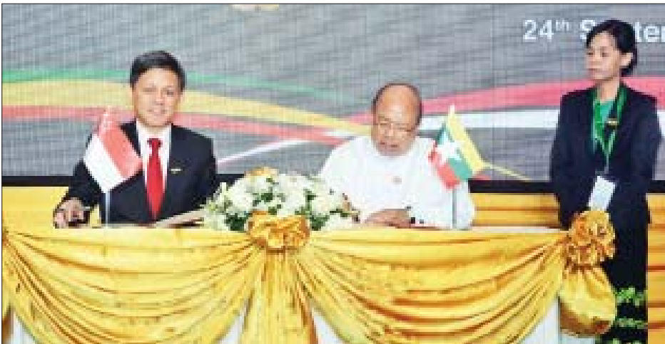
ပြည်ထောင်စုဝန်ကြီး ဦးသောင်းထွန်းနှင့် စင်ကာပူကုန်သွယ်မှုနှင့် စက်မှုဝန်ကြီးဌာန ဝန်ကြီး Mr. Chan Chun Sing တို့ မြန်မာ-စင်ကာပူ ရင်းနှီးမြှုပ်နှံမှုမြှင့်တင်ရေးနှင့် အကာအကွယ်ပေးရေးသဘောတူစာချုပ်ကို လက်မှတ်ရေးထိုးစဉ်။

များအတွက် ပိုမိုကောင်းမွန်သည့် ရင်းနှီးမြှုပ်နှံမှု ဝန်းကျင် ကောင်းတစ်ရပ် ဖန်တီးပေးနိုင်မည်ဖြစ်၍ နှစ်နိုင်ငံ ကုန်သွယ်မှုနှင့် ရင်းနှီးမြှုပ်နှံမှုများကိုလည်း ပိုမိုမြှင့်တင်ပေး နိုင်မည်ဖြစ်သည်။ အဓိကကုန်သွယ်မှုမိတ်ဖက်နိုင်ငံ မြန်မာနိုင်ငံသို့ ဝင်ရောက်လာသည့် နိုင်ငံခြား တိုက်ရိုက်ရင်းနှီးမြှုပ်နှံမှုများအနက် လေးပုံတစ်ပုံကျော် သည် စင်ကာပူနိုင်ငံ၏ ရင်းနှီးမြှုပ်နှံမှုဖြစ်ပြီး ၂၀၁၇-၂၀၁၈ ဘဏ္ဍာနှစ်အတွင်း နှစ်နိုင်ငံကုန်သွယ်မှုပမာဏမှာ အမေရိ ကန်ဒေါ်လာ ၃ ဒသမ ၉ ဘီလီယံခန့်ရှိသည်။ စင်ကာပူ နိုင်ငံသည် ယခုအချိန်အထိ မြန်မာနိုင်ငံ၏ အဓိက ကုန်သွယ်မှုမိတ်ဖက်နိုင်ငံ တစ်နိုင်ငံအဖြစ် နှစ်ပေါင်းများစွာ ရပ်တည်လျက်ရှိသည်။ အစည်းအဝေးသို့ သက်ဆိုင်ရာဌာနအသီးသီးမှ တာဝန်ရှိသူများနှင့် မြန်မာနိုင်ငံနှင့် စင်ကာပူနိုင်ငံတို့မှ ကိုယ်စားလှယ်များ တက်ရောက်ခဲ့ကြသည်။ သတင်းစဉ်