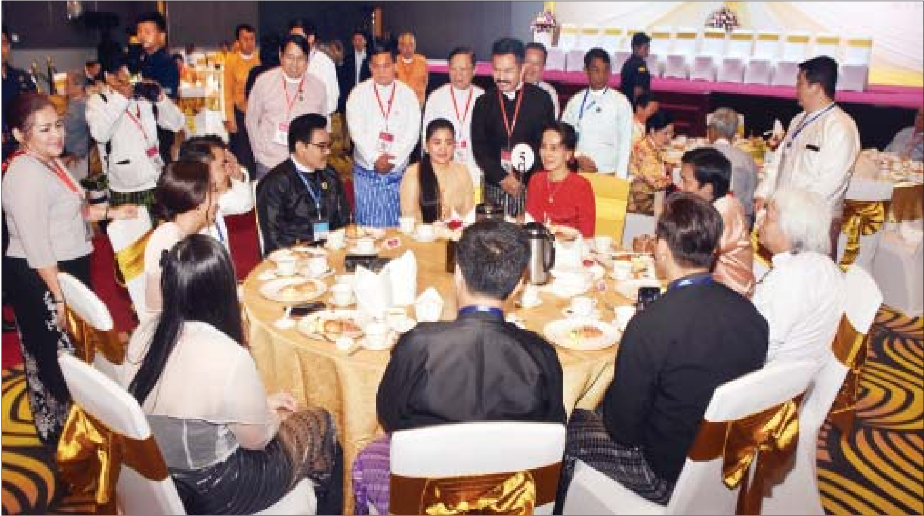
နိုင်ငံတော်၏အတိုင်ပင်ခံပုဂ္ဂိုလ် ဒေါ်အောင်ဆန်းစုကြည် “အောင်ဆန်း”ရုပ်ရှင်တွင် ပါဝင်သရုပ်ဆောင်ကြမည့် သရုပ်ဆောင်များအား ရင်းရင်းနှီးနှီးနှုတ်ဆက်စဉ်။

ရန်ကုန် စက်တင်ဘာ ၂၄ “အောင်ဆန်း” ရုပ်ရှင် စတင်ရိုက်ကူးသည့်အခမ်းအနားကို ယနေ့နံနက် ၁၀ နာရီက ရန်ကုန်မြို့၊ ပြည်လမ်းရှိ Novotel Hotel ၌ ကျင်းပရာ နိုင်ငံတော်၏အတိုင်ပင်ခံပုဂ္ဂိုလ် ဒေါ်အောင်ဆန်းစုကြည် တက်ရောက်အားပေးချီးမြှင့်သည်။