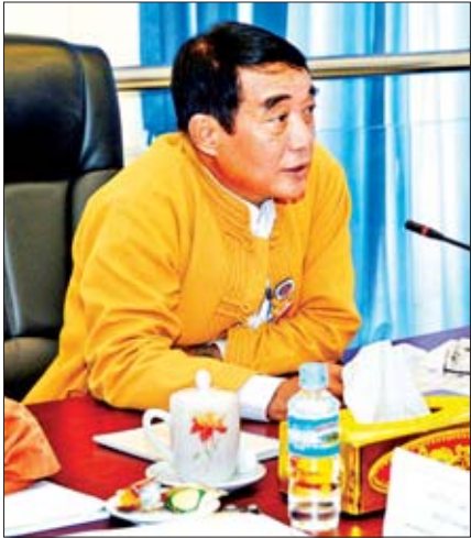
ဒေါက်တာစံရွှေဝင်း ပြည်သူ့လွှတ်တော်ကိုယ်စားလှယ်

ပြည်သူ့လွှတ်တော် ကျန်းမာရေးနှင့် အားကစားဖွံ့ဖြိုးတိုးတက်ရေးကော်မတီသည် နိုင်ငံတော်၏ ကျန်းမာရေးမြှင့်တင်မှုလုပ်ငန်းများနှင့် အားကစားဖွံ့ဖြိုးတိုးတက်ရေးလုပ်ငန်းများ၊ ပြည်သူတို့၏ ကျန်းမာရေးတိုးတက်ရေးနှင့် ပြည်သူများ၏ ကျန်းမာရေးကဏ္ဍတွင် တိုင်းရင်းသားပြည်သူများ ပါဝင်နိုင်ရေး ဥပဒေများပြဋ္ဌာန်းပေးရန် လွှတ်တော်သို့ တင်ပြဆောင်ရွက်ပေးသော ကော်မတီတစ်ခုဖြစ်ပြီး ကော်မတီ၏ဆောင်ရွက်ချက်များကို ယခုတစ်ပတ် လွှတ်တော်နေရာကဏ္ဍတွင် ဖော်ပြလိုက်ရပါသည်။