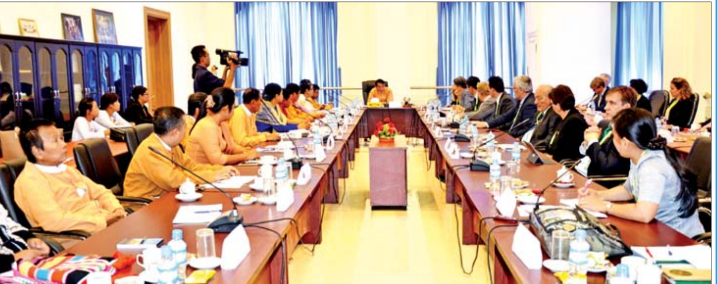
ပြည်သူ့လွှတ်တော် ကျန်းမာရေးနှင့် အားကစားဖွံ့ဖြိုးတိုးတက်ရေးကော်မတီ ဩစတြေးလျပါလီမန်အမတ်များအဖွဲ့အား လက်ခံတွေ့ဆုံစဉ်။

ခုနှင့် ကျန်းမာရေးနှင့် အားကစားဝန်ကြီးဌာနနှင့် သက်ဆိုင်သည့် ဥပဒေ ၂၂ ခု စုစုပေါင်းဥပဒေ ၄၆ ခုကို လေ့လာစိစစ်သုံးသပ်လျက်ရှိရာ ကော်မတီ၏ လုပ်ငန်းဆောင်ရွက်ချက်များနှင့်ပတ်သက်၍ တွေ့ဆုံမေးမြန်းခဲ့သည်များကို ဖော်ပြလိုက်ပါသည်။