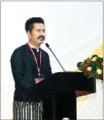
ရုပ်ရှင်ဒါရိုက်တာ “အောင်ဆန်း” ရုပ်ရှင် ဦးလူမင်း ရိုက်ကူးမည့် အစီအစဉ်များကို ပြောကြားစဉ်။

Costume Designer အဖွဲ့ကလည်း ဇာတ်ကားရိုက်ကူးရေးအတွက် ဇာတ်ဝင်ခန်းအလိုက် လိုအပ်သော အဝတ်အစားများကို