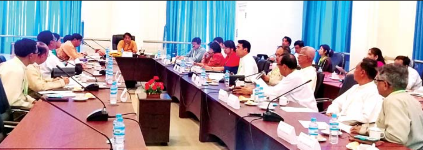
ပြည်သူ့လွှတ်တော် ကျန်းမာရေးနှင့် အားကစားဖွံ့ဖြိုးတိုးတက်ရေးကော်မတီ မြန်မာနိုင်ငံ သွားနှင့် ခံတွင်းဆိုင်ရာ ဆေးကောင်စီဥပဒေကြမ်းအစည်းအဝေးကျင်းပစဉ်။