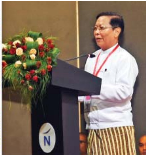
နိုင်ငံတော်၏အတိုင်ပင်ခံပုဂ္ဂိုလ် ဒေါ်အောင်ဆန်းစုကြည်၊ နိုင်ငံတော်သမ္မတဟောင်း ဦးထင်ကျော်၊ ပြည်ထောင်စုဝန်ကြီးများ၊ တာဝန်ရှိသူများနှင့် အနုပညာရှင်များ “အောင်ဆန်း” ရုပ်ရှင် စတင်ရိုက်ကူးခြင်းအခမ်းအနားသို့ တက်ရောက်စဉ်နှင့် ပြည်ထောင်စုဝန်ကြီး သူရဦးအောင်ကို “အောင်ဆန်း” ရုပ်ရှင် ရိုက်ကူးနိုင်ရေးအတွက် ကြိုတင်ဆောင်ရွက်ခဲ့မှုများကို ရှင်းလင်းတင်ပြစဉ်။

* ရှေ့မှ ရိုက်ကူးနိုင်ရေးအတွက် ကြိုတင်ဆောင်ရွက်ခဲ့မှုများကို ရှင်းလင်းတင်ပြရာတွင် ဗိုလ်ချုပ်အောင်ဆန်းအတ္ထုပ္ပတ္တိရုပ်ရှင် ရိုက်ကူးထုတ်လုပ်ရေးလုပ်ငန်းကော်မတီကို အဖွဲ့ဝင် ၁၇ ဦးဖြင့် ပြည်ထောင်စုအစိုးရအဖွဲ့ရုံးက ၂၄-၁၁-၂၀၁၇ ရက်နေ့တွင် စတင်ဖွဲ့စည်းပေးခဲ့ပါကြောင်း၊ လုပ်ငန်းကော်မတီအနေဖြင့် ၈-၁၂-၂၀၁၇ ရက်နေ့မှစတင်ကာ ဆက်ကော်မတီ ၇ ခုကို ထပ်မံဖွဲ့စည်းပြီး ဗိုလ်ချုပ်အောင်ဆန်းရုပ်ရှင်ရိုက်ကူးနိုင်ရေး ဆောင်ရွက်ခဲ့ပါကြောင်း၊ ယင်းဆက်ကော်မတီများမှာ အုပ်ချုပ်ထောက်ပံ့မှုဆက်ကော်မတီ၊ ဇာတ်လမ်း၊ ဇာတ်ညွှန်းပြုစုရေးနှင့် ရိုက်ကူးတည်းဖြတ်ရေးဆက်ကော်မတီ၊ အနုပညာဖန်တီးရေးဆက်ကော်မတီ၊ သမိုင်းအထောက်အထားစိစစ်ရေးဆက်ကော်မတီ၊ မှတ်တမ်းပြုစုရေးနှင့် သတင်းပြန်ကြားရေးဆက်ကော်မတီ၊ ဘဏ္ဍာရေးနှင့် လုပ်ငန်းစစ်ဆေးရေးဆက်ကော်မတီ၊ လုံခြုံရေးနှင့် စည်းကမ်းထိန်းသိမ်းရေးဆက်ကော်မတီတို့ ဖြစ်ကြပါကြောင်း၊ ယင်းဆက်ကော်မတီများအပြင် ရိုက်ကူးထုတ်လုပ်ရေးအတွက် အထောက်အကူပြုလုပ်ငန်းအဖွဲ့ငယ်များဖြစ်သည့် Properties