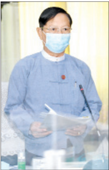
ပြည်ထောင်စုဝန်ကြီး သူရဦးအောင်ကို

မိမိတို့၏ ယဉ်ကျေးမှုအမွေအနှစ်များကို ထိန်းသိမ်းကာကွယ် စောင့်ရှောက်ရာတွင် လိုအပ်သည့် ဥပဒေ၊ နည်းဥပဒေများကိုလည်း ရေးဆွဲထုတ်ပြန်ခဲ့ပြီး ဖြစ်ပါကြောင်း၊ အများပြည်သူ အသိပညာ၊ ဗဟုသုတပွားများစေရန် အကြောင်းအရာစုံ၊ ကဏ္ဍစုံပြသနိုင်မည့် ပုဂ္ဂလိကပြတိုက်များ စနစ်တကျပေါ်ထွက်လာစေရန်နှင့် မြန်မာ့ရှေးဟောင်းဝတ္ထုပစ္စည်းများကို ထိန်းသိမ်းစောင့်ရှောက်ရန် လိုအပ်သည့် မြန်မာနိုင်ငံပြတိုက်များဥပဒေကိုလည်း ရေးဆွဲပြီးဖြစ်ပါကြောင်း၊ ခြပ်မဲ့ယဉ်ကျေးမှုအမွေအနှစ်များကို သုတေသနပြု ထိန်းသိမ်းစောင့်ရှောက် မြှင့်တင်ရေးအတွက် ဥပဒေမူကြမ်းတစ်ရပ်ကို