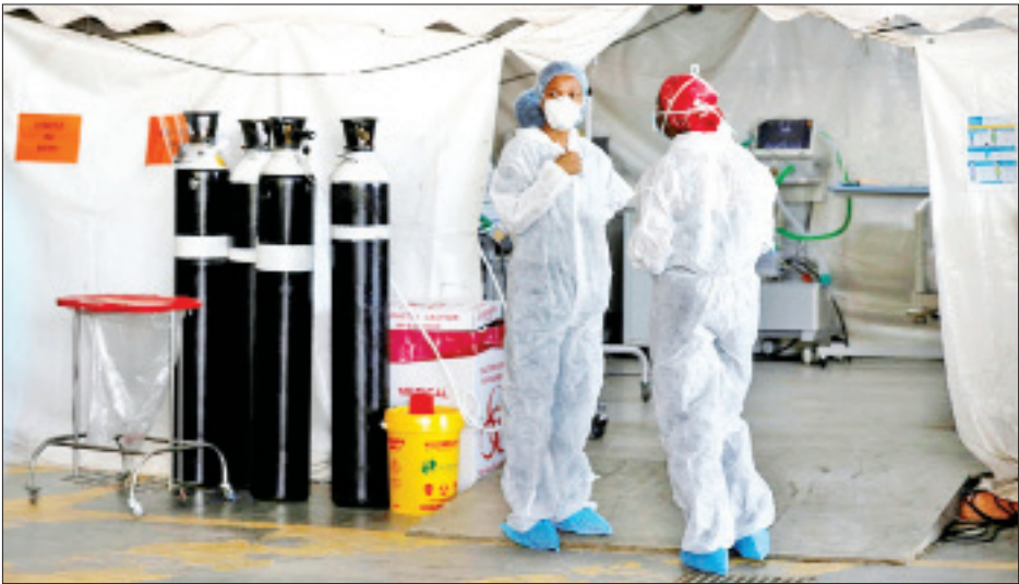
တွင် ကိုဗစ်-၁၉ ရောဂါ ကာကွယ်ဆေးကို အဆင်သင့်ထိုးနှံ ပြောကြားသည်။ နိုင်ငံလုံးမည်ဟု မျှော်လင့်ရကြောင်း ၎င်းက ထပ်လောင်း

အာဖရိကနိုင်ငံများသည် ကိုဗစ်-၁၉ ရောဂါ ကာကွယ်ဆေးရရှိရေးအတွက် နည်းလမ်းအမျိုးမျိုးဖြင့် ကြိုးပမ်းလုပ်ဆောင်လျက်ရှိသောကြောင့် မကြာမီကာလ