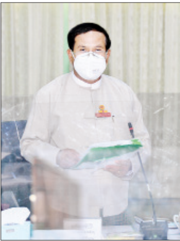
ဒုတိယဝန်ကြီး ဦးတင်မြင့်

ထို့နောက် ဗဟိုကော်မတီ တွဲဖက်အတွင်းရေးမှူး ရှေးဟောင်းသုတေသနနှင့် အမျိုးသားပြတိုက်ဦးစီးဌာန ညွှန်ကြားရေးမှူးချုပ် ဦးကျော်ဦးလွင်က ပုဂံယဉ်ကျေးမှုအမွေအနှစ်ဒေသရှိ ငလျင်ဒဏ်ခံ ရှေးဟောင်းအဆောက်အအုံများထိန်းသိမ်းရေးလုပ်ငန်းများ ဆောင်ရွက်ပြီးစီးမှုအခြေအနေ၊ နိုင်ငံတကာအထိမ်းအမှတ်နှင့် နေရာဒေသများကောင်စီ၏ “Nomination of the Bagan” အစီရင်ခံစာပါ အကြံပြုချက်များအား ဆောင်ရွက်ပြီးစီးမှု၊ မြောက်ဦး ယဉ်ကျေးမှုအမွေအနှစ်ဒေသကို ကမ္ဘာ့အမွေအနှစ်စာရင်းဝင်ဖြစ်ရေး ဆောင်ရွက်နေမှု၊ ကမ္ဘာ့အမွေအနှစ် ပျူရှေးမြို့ဟောင်း