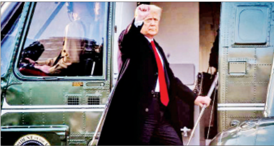
ဆက်လက်ဆုံးဖြတ်မည် အဆိုပါစွပ်စွဲချက်ကို အထက်လွှတ်တော်တွင် မှသာ ၎င်းအနေဖြင့် ပြစ်ဒဏ်ချမှတ်ခံရမည်ဖြစ်သည်။ ဆက်လက်ဆုံးဖြတ်မည်ဖြစ်ကာ အထက်လွှတ်တော် လတ်တလောအနေအထားတွင် အထက်လွှတ်တော်ကို

ထရမ်သည် ဇန်နဝါရီ ၂၀ ရက်တွင် သမ္မတတာဝန် ပြီးဆုံးပြီးနောက် ဖလော်ရီဒါရှိ ၎င်း၏ကိုယ်ပိုင်အပန်းဖြေ စခန်းတွင် သွားရောက်နေထိုင်လျက်ရှိသည်။ ဇန်နဝါရီ ၆ ရက် တွင် ဖြစ်ပွားခဲ့သည့် လွှတ်တော်အဆောက်အအုံ ဝင်ရောက်စီးနင်းမှုအတွက် သမ္မတထရမ်တွင် တာဝန်ရှိ သည်ဟု ဒီမိုကရက်တို့ကဆိုကာ စွပ်စွဲပြစ်တင်ရေး လုပ်ငန်းစဉ်ကို ဆောင်ရွက်ခဲ့ကြခြင်းဖြစ်သည်။ ဇန်နဝါရီ ၁၄ရက်တွင် အောက်လွှတ်တော်ရှိ ဒီမိုကရက်အားလုံးနှင့် ရီပတ်ဘလီကန်အမတ် ၁၀ ဦးတို့က ထရမ်အား စွပ်စွဲ ပြစ်တင်မှုအပေါ် ထောက်ခံပေးခဲ့ကြသည်။