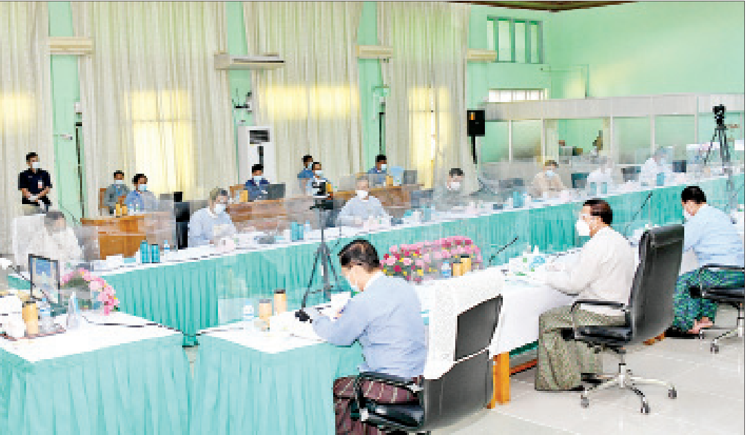
ဒုတိယသမ္မတ ဦးဟင်နရီဗန်ထီးယူ မြန်မာနိုင်ငံအမျိုးသားယဉ်ကျေးမှု ဗဟိုကော်မတီ၏ ပဋိပဒေသကြိမ်အစည်းအဝေးတွင် အမှာစကားပြောကြားစဉ်။

ရှေးမှုမပျက် ပြုပြင်ထိန်းသိမ်း အစည်းအဝေးတွင် ဒုတိယသမ္မတ က ၂၀၁၆ ခုနှစ် ဩဂုတ် ၂၄ ရက်က လုပ်ခတ်ခဲ့သည့် ငလျင်ဒဏ်ကြောင့် ထိခိုက်ပျက်စီးသွားသော ရှေးဟောင်း အဆောက်အအုံများ ပြုပြင်ထိန်းသိမ်း ရာတွင် ရှေးဟောင်းသုတေသနနှင့် အမျိုးသားပြတိုက်ဦးစီးဌာနအနေဖြင့် ပုဂံဒေသရှိ ငလျင်ဒဏ်ခံဘုရားစေတီ ၃၈၈ ဆူကို ထိန်းသိမ်းမှုများ ဆောင်ရွက်ပြီး ဖြစ်ပါကြောင်း၊ ပြုပြင်ထိန်းသိမ်းရန် ကျန်ရှိသည့် ဘုရားအမှတ်(၁၅၉၇) သဗ္ဗညုဘုရားကို မြန်မာနိုင်ငံနှင့် တရုတ်ပြည်သူ့သမ္မတနိုင်ငံ၊ နိုင်ငံ ယဉ်ကျေးမှုအမွေအနှစ်များ စီမံခန့်ခွဲ ရေးဌာနတို့အကြား “ငလျင်အလွန်