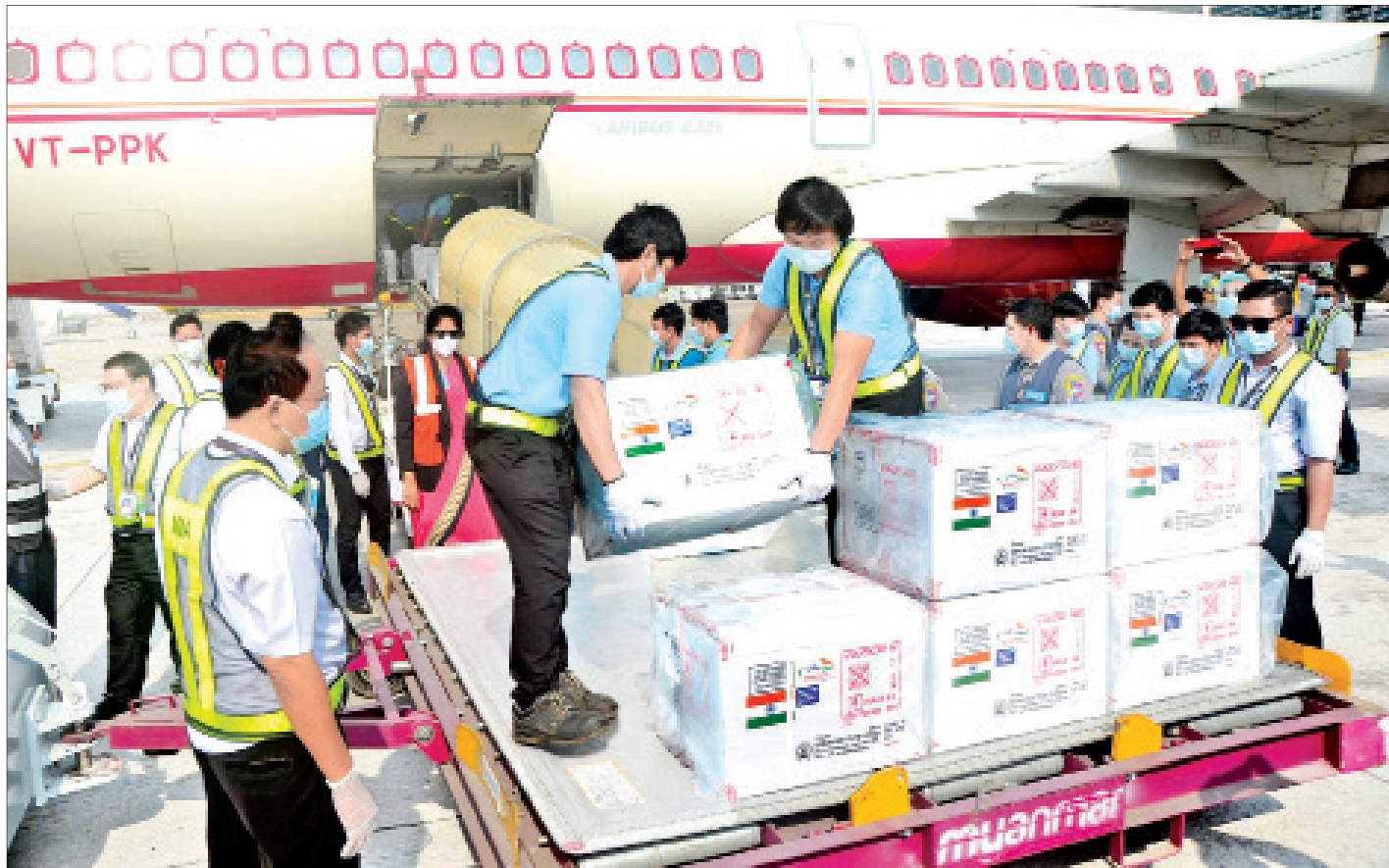
အိန္ဒိယနိုင်ငံမှ ကိုဗစ်-၁၉ ကာကွယ်ဆေးများ ရန်ကုန်အပြည်ပြည်ဆိုင်ရာလေဆိပ်သို့ ရောက်ရှိလာစဉ်။

နေပြည်တော် ဇန်နဝါရီ ၂၂ မြန်မာနိုင်ငံက ဆောင်ရွက်လျက်ရှိသည့် ကိုဗစ်-၁၉ ကာကွယ်၊ ထိန်းချုပ်၊ ကုသရေး အစီအမံများအား အထောက်အကူပြုစေရန် ရည်ရွယ်ပြီး အိန္ဒိယအစိုးရက မြန်မာအစိုးရသို့ အိန္ဒိယနိုင်ငံအခြေစိုက် Serum Institute of India (SII) ထုတ် ကာကွယ်ဆေး COVISHIELD ၁ ဒသမ ၅ သန်းကို ပထမအသုတ်အဖြစ် လှူဒါန်းခဲ့ရာ ယနေ့မှန်းလွဲ ၂ နာရီခွဲတွင် Air India လေယာဉ်ဖြင့် ရန်ကုန်အပြည်ပြည်ဆိုင်ရာ လေဆိပ်သို့ ချောမောစွာ ရောက်ရှိသည်။