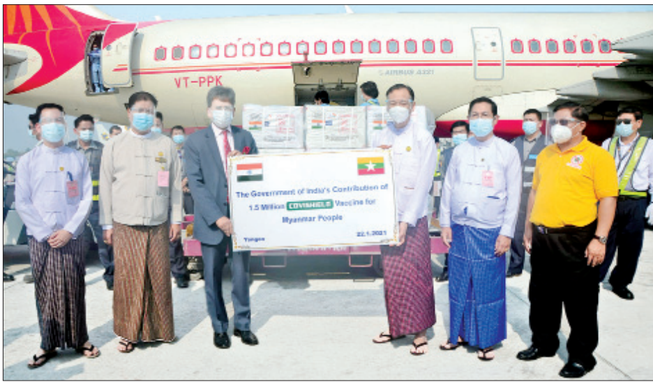
မြန်မာနိုင်ငံဆိုင်ရာ အိန္ဒိယသံအမတ်ကြီး မစ္စတာဆော်ရက်(ဘိ)ကူးမားက COVISHIELD ကာကွယ်ဆေးများကို ပါမောက္ခ ဒေါက်တာဇော်သန်းထွန်းထံ လွှဲပြောင်းပေးစဉ်။

အအေးခန်းတွေမှာ ထားသုံးရတဲ့ဆေးမျိုးတွေရှိနေတော့ ယခု ကိုဗစ်ကာကွယ်ဆေးအတွက် အထွေထွေ ပြဿနာ မရှိပါဘူး။ ယခင်ပုံမှန်ကာကွယ်ဆေးတွေကိုလည်း တစ်နိုင်ငံ လုံးကို အအေးလမ်းကြောင်းမပျက်တဲ့စနစ်တွေနဲ့ စနစ် တကျ ဖြန့်ဖြူးတဲ့အတွေ့အကြုံလည်း ရှိပြီးသားဖြစ်တဲ့ အတွက် အချိန်မီရောက်ရှိသွားအောင် Central Cold Change ကနေ ဖြန့်ဝေသွားမှာပါ” ဟု ပြောသည်။ အိန္ဒိယအစိုးရအနေဖြင့် မြန်မာ-အိန္ဒိယ နှစ်နိုင်ငံ ရှိရင်းစွဲချစ်ကြည်ရင်းနှီးမှုကို ပိုမိုခိုင်မာလာစေရန်နှင့် မြန်မာနိုင်ငံမှ ဆောင်ရွက်လျက်ရှိသည့် ကိုဗစ်-၁၉ ရောဂါ ကာကွယ်၊ ထိန်းချုပ်ရေးဆိုင်ရာလုပ်ငန်းများကို အထောက် အကူပြုစေပြီး မြန်မာပြည်သူပြည်သားများ၏ ကျန်းမာရေး ကာကွယ်စောင့်ရှောက်မှုကဏ္ဍ မြှင့်တင်ရန်အတွက် ရှေးရှု၍ ကာကွယ်ဆေး ၁ ဒသမ ၅ သန်းကို ပထမအသုတ်အဖြစ် လှူဒါန်းခြင်းဖြစ်ပြီး ထပ်မံ၍ ဒုတိယအကြိမ် ဆက်လက် လှူဒါန်းရန်ရှိကြောင်း သိရသည်။ သတင်းစဉ် ဓာတ်ပုံ - ဖေဇစ်