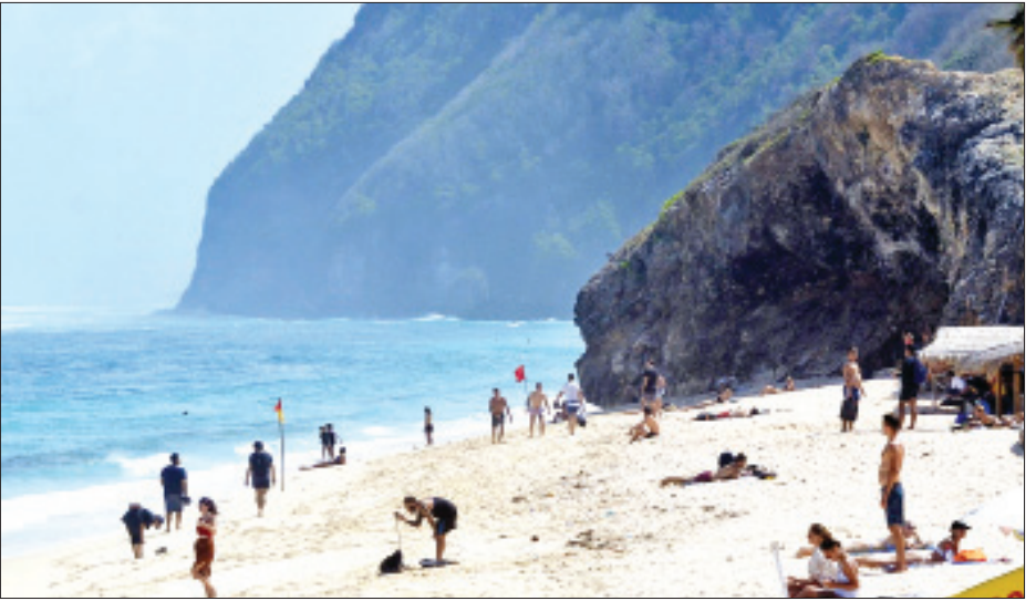
၂၀၂၀ ပြည့်နှစ် ဇွန်လ ၂၄ ရက်က အင်ဒိုနီးရှားနိုင်ငံ ဘာလီကျွန်းသို့ လာရောက်ခဲ့သည့် နိုင်ငံခြားသားခရီးသွားများအား တွေ့ရစဉ်။

ယန်တို့က ပြောကြားခဲ့သည်။ သိသိသာသာလျော့ကျပြီးခဲ့သည့်နှစ် ဒီဇင်ဘာလအတွင်းက အင်ဒိုနီးရှားနိုင်ငံသို့ လာရောက်ခဲ့သည့် နိုင်ငံခြားသားခရီးသွား ၁၆၄၀၈၈ ဦးရှိခဲ့ခြင်းကြောင့် ပြီးခဲ့သည့်နှစ် နိုဝင်ဘာလနှင့် နှိုင်းယှဉ်ပါက ၁၃ ဒသမ ၅၈ ရာခိုင်နှုန်းတိုးလာခဲ့သော်လည်း ဒီဇင်ဘာလနှင့် နှိုင်းယှဉ်ပါက ၈၈ ဒသမ ၀၈ ရာခိုင်နှုန်းအထိ သိသိသာသာ လျော့ကျခဲ့ခြင်းဖြစ်ကြောင်း အင်ဒိုနီးရှားနိုင်ငံ ဗဟိုစာရင်းအင်း အေဂျင်စီက ပြောကြားခဲ့သည်။ ကိုးကား-ဆင်ဟွာ ဘာသာပြန်-အလင်းသစ်