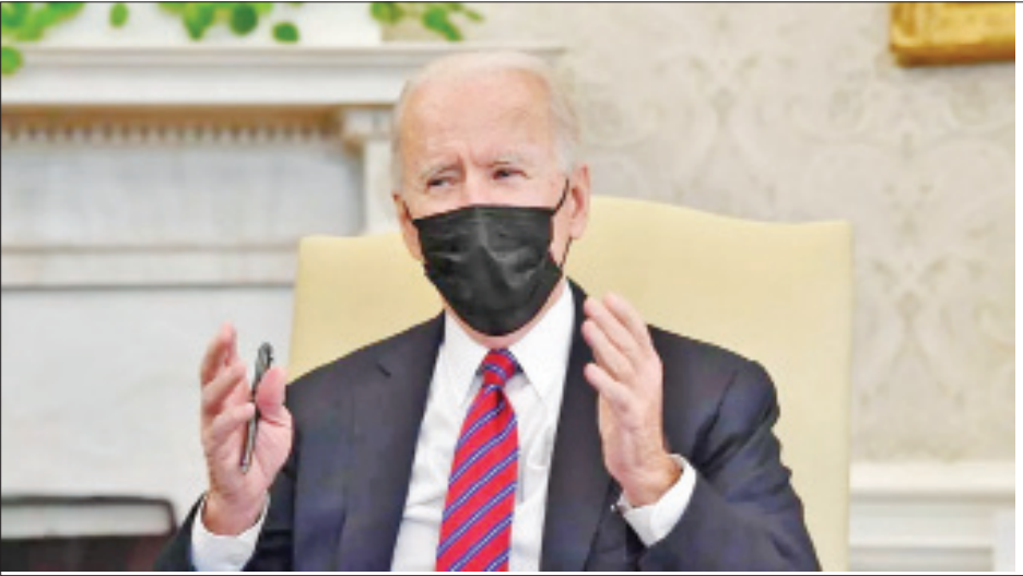
ပြည်နယ် ၂၉ ခုတွင် အနိမ့်ဆုံးလုပ်ခလစာ သတ်မှတ်ပေးရေး တစ်နာရီလျှင် ၇ ဒသမ ၂၅ ဒေါ်လာဖြစ်ကြောင်း သိရသည်။ ဥပဒေရုံးနှင့်ပြီးဖြစ်သော်လည်း လက်ရှိသတ်မှတ်နှုန်းထားမှာ ကိုးကား- အေအက်ဖ်ပီ၊ ဘာသာပြန်-မေလွဲသင်း

သမ္မတဘိုင်ဒင်က အချိန်ပြည့်အလုပ် လုပ်ကိုင်နေသူ တစ်ဦးအနေဖြင့် ဝင်ငွေ နည်းပါးစွာဖြင့် ရပ်တည်နေရခြင်းမှာ မသင့်လျော်ကြောင်း၊ ၎င်း၏ ဆန္ဒအရဆိုလျှင် တစ်နာရီလျှင် ကန်ဒေါလာ ၂၀ အထိ ရပိုင်ခွင့်ရရှိစေရန် လိုလားကြောင်း ပြောကြားခဲ့သည်။ ဒီမိုကရက်ပါတီဝင်များအပြင် ရီပတ်ဘလီကန်အမတ်အများစုက အနည်းဆုံးလုပ်ခလစာကို တစ်နာရီလျှင် ကန်ဒေါလာ ၁၅ ဒေါ်လာ သတ်မှတ်ပေးရေးကို လိုလားသော်လည်း ယင်းသို့ သတ်မှတ်ပေးရေးသည် ကိုဗစ်-၁၉ ကြောင့် စီးပွားရေးထိခိုက်မှုကြီးမားနေသည့် လုပ်ငန်းရှင်များအား ပိုမိုအကျပ်အတည်းဆိုက်စေမည်ဖြစ်ကြောင်း သုံးသပ်မှုများလည်း ရှိနေသည်။ ထို့ကြောင့် အနည်းဆုံး လုပ်ခလစာ ၁၅ ဒေါ်လာပေးချေရေးကို အတည်ပြုမည်ဆိုပါက အမေရိကန်ပြည်သူ ၁၀ သန်းမှာ အကျိုးခံစားခွင့် ရရှိမည်ဖြစ်သော်လည်း လုပ်သား ၁ ဒသမ ၃ သန်းတို့မှာ အလုပ်အကိုင်ဆုံးရှုံးနိုင်ကြောင်း ဥပဒေပြုလွှတ်တော်ဘဏ္ဍာရေးရုံး၏ ခန့်မှန်းချက်အရ သိရသည်။ အမေရိကန်နိုင်ငံ၏ မြို့တော်ဝါရှင်တန်အပြင်