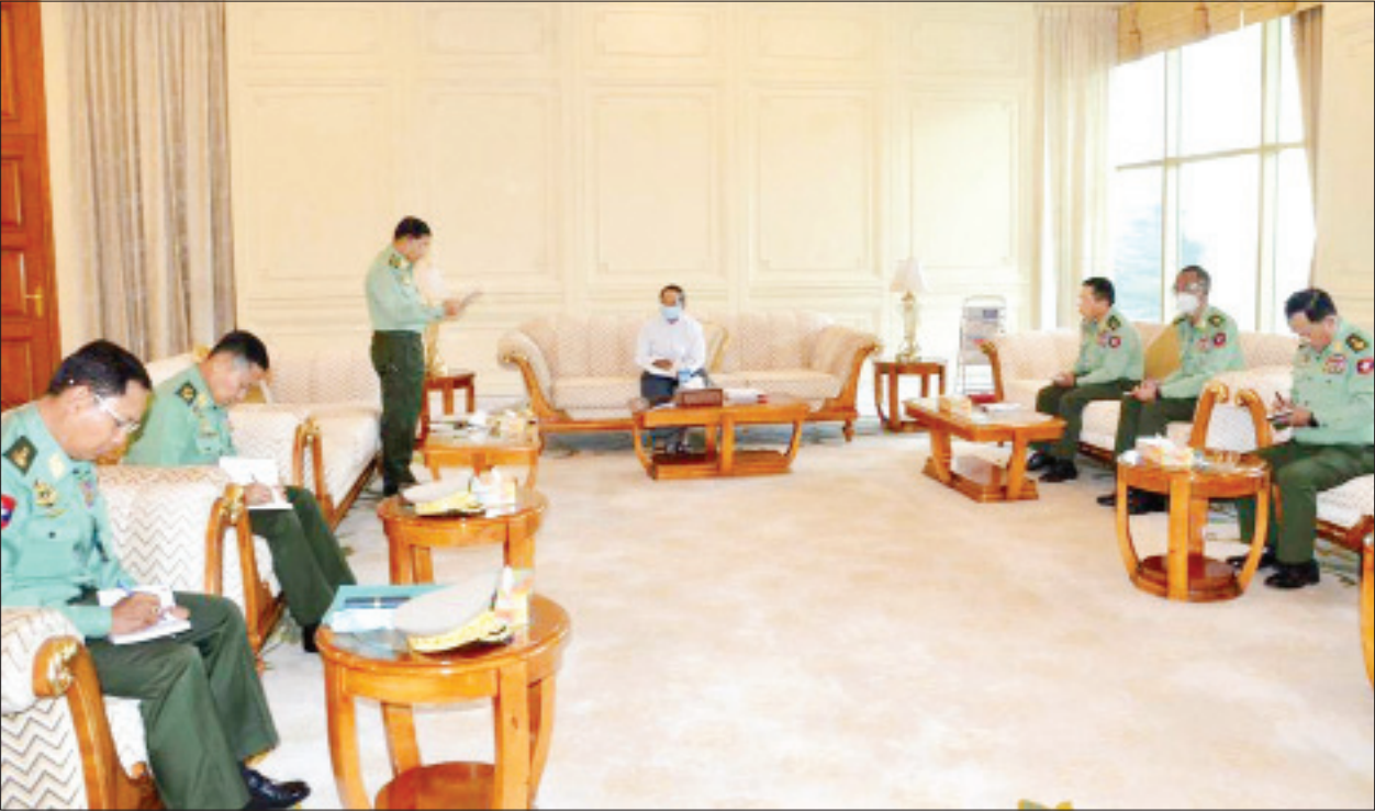
ပြည်ထောင်စုသမ္မတမြန်မာနိုင်ငံတော် “အမျိုးသားကာကွယ်ရေးနှင့် လုံခြုံရေးကောင်စီ” အစည်းအဝေး ကျင်းပပြုလုပ်စဉ်။

တပ်မတော်အနေဖြင့်လည်း ဖွဲ့စည်းပုံအခြေခံဥပဒေ (၂၀၀၈ ခုနှစ်)နှင့် တည်ဆဲဥပဒေများကို လေးစားလိုက်နာလျက် “လွတ်လပ်၍ တရားမျှတသော ရွေးကောက်ပွဲ” ဖြစ်စေရေး ဥပဒေပြဋ္ဌာန်းချက်များကို မကျော်လွန်စေဘဲ ၂-၁၁-၂၀၂၀ ရက်နေ့တွင် ပါတီစုံဒီမိုကရေစီအထွေထွေရွေးကောက်ပွဲ အကြိုကာလ၌ ဖြစ်ပေါ်နေသည့် အခြေအနေများ၊ ပြည်ထောင်စုရွေးကောက်ပွဲကော်မရှင်က တည်ဆဲဥပဒေများကို ကျော်လွန်၍ ညွှန်ကြားချက်အမျိုးမျိုး