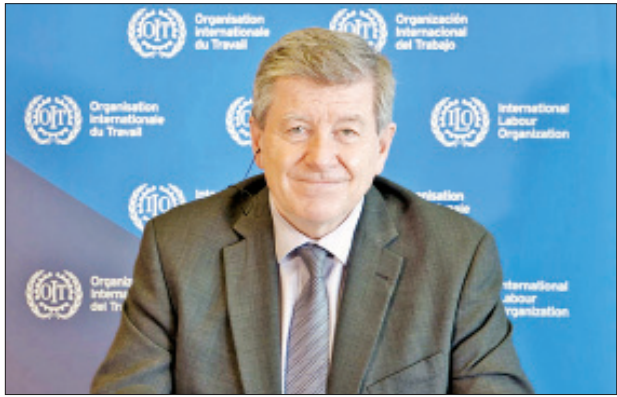
နိုင်ငံတကာအလုပ်သမားအဖွဲ့ ညွှန်ကြားရေးမှူးချုပ် ဂိုင်းရိုင်ဒါ