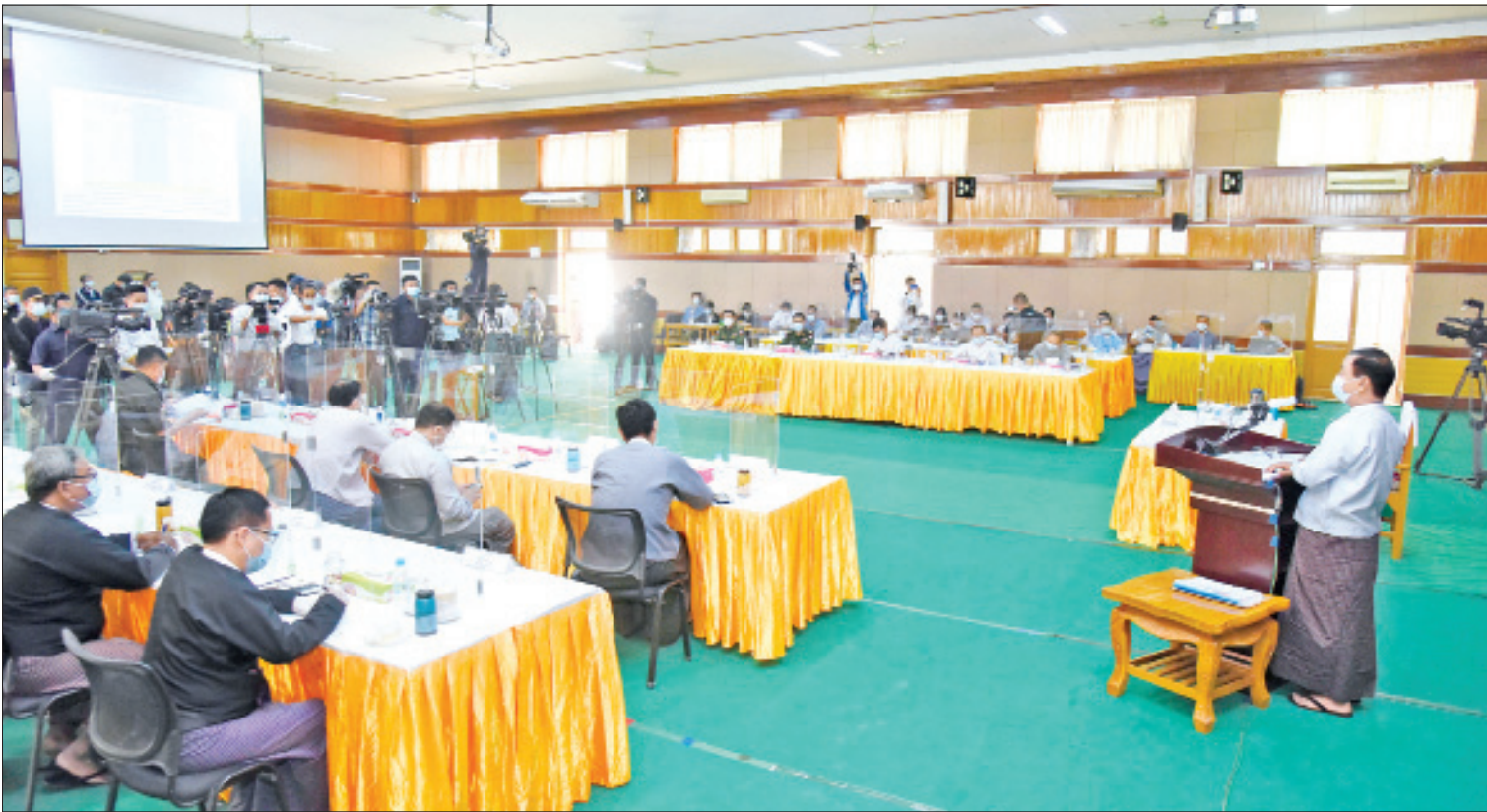
နိုင်ငံတော်စီမံအုပ်ချုပ်ရေးကောင်စီ၊ သတင်းထုတ်ပြန်ရေးအဖွဲ့က သတင်းမီဒီယာများနှင့်တွေ့ဆုံ၍ သတင်းစာရှင်းလင်းပွဲပြုလုပ်စဉ်။

ရှင်းလင်းပြောကြားထိုနေ့က နိုင်ငံတော်စီမံအုပ်ချုပ်ရေးကောင်စီ၊ သတင်းထုတ်ပြန်ရေးအဖွဲ့၊ ခေါင်းဆောင် ဗိုလ်မှူးချုပ်ဇော်မင်းထွန်းက ရှင်းလင်းပြောကြားရာတွင် တပ်မတော်အနေဖြင့် ၂၀၂၀ ပြည့်နှစ် ရွေးကောက်ပွဲအပေါ် စိစစ်တွေ့ရှိချက်များ ထုတ်ပြန်၍ တာဝန်ရှိသူအဆင့်ဆင့် ဖြေရှင်းပေးနိုင်ရေး လုပ်ထုံး၊ လုပ်နည်း၊ ဥပဒေများနှင့်အညီ ဆောင်ရွက်ခဲ့သည့်အခြေအနေများ၊ ဖေဖော်ဝါရီ ၁ ရက်နေ့တွင် စာမျက်နှာ ၇ ကော်လံ ၁ သို့ □