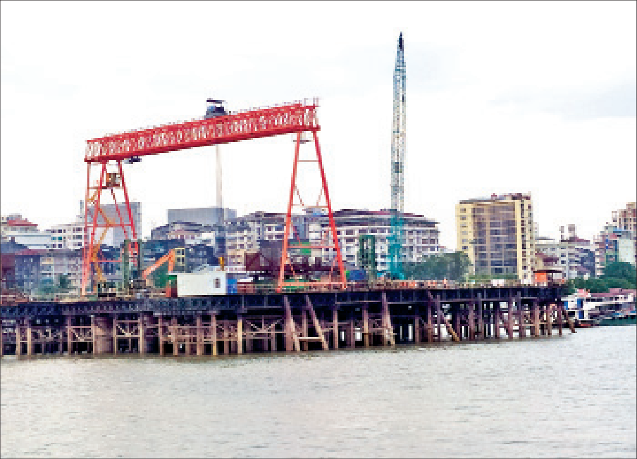
မြန်မာ- ကိုရီးယားချစ်ကြည်ရေး( ဒလ) တံတား တည်ဆောက်ရေးစီမံကိန်းလုပ်ငန်းခွင်အား တွေ့ရစဉ်။

ရန်ကုန်တိုင်းဒေသကြီး သန်လျင်မြို့နယ်နှင့် သာကေတမြို့နယ်တို့သို့ ပဲခူးမြစ်ကို ဖြတ်သန်းကာ ဆက်သွယ်တည်ဆောက်နေသော ပဲခူးမြစ်ကူးတံတား (သန်လျင်တံတားအမှတ် - ၃)စီမံကိန်းသည် ယခုအခါတွင် သာကေတဘက်အခြမ်းရှိ စီမံကိန်းအပိုင်း(၃)မှာ ၈၃ ရာခိုင်နှုန်းခန့်ပြီးစီးနေပြီး ကျန်စီမံကိန်း