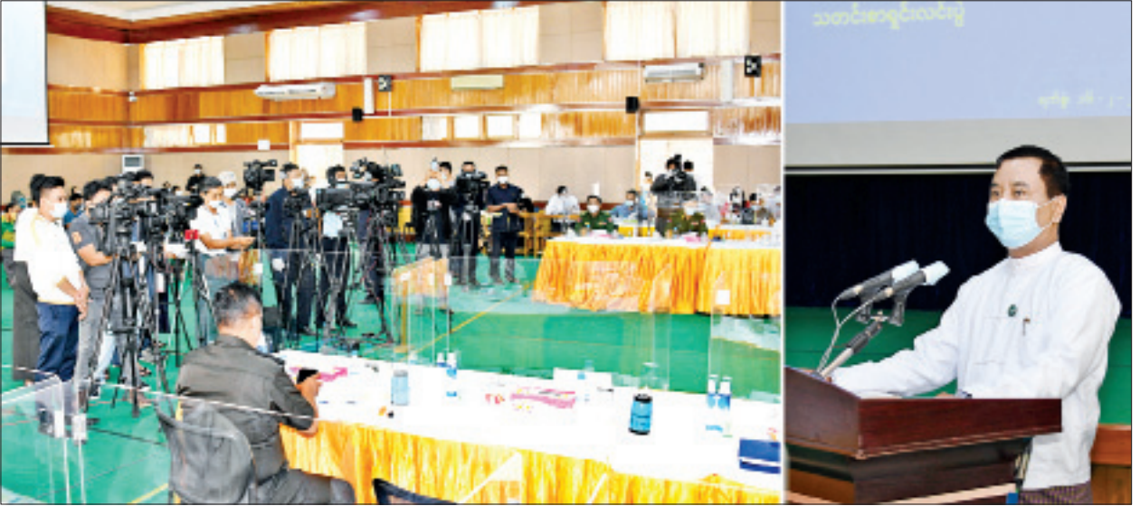
နိုင်ငံတော်စီမံအုပ်ချုပ်ရေးကောင်စီ၊ သတင်းထုတ်ပြန်ရေးအဖွဲ့က သတင်းမီဒီယာများနှင့်တွေ့ဆုံ၍ သတင်းစာရှင်းလင်းပွဲပြုလုပ်စဉ်။

နိုင်ငံတော်စီမံအုပ်ချုပ်ရေးကောင်စီဥက္ကဋ္ဌက လွတ်ငြိမ်းချမ်းသာခွင့်နှင့် ပြစ်ဒဏ်လွတ်ငြိမ်းခွင့်အမိန့်များထုတ်ပြန်၍ ပြစ်ဒဏ်လွတ်ငြိမ်းချမ်းသာခွင့်ပြု ပေးခဲ့သည့်အခြေအနေများ၊ COVID-19 ရောဂါကာကွယ်ဆေးရောက်ရှိမှုနှင့် ကာကွယ်ဆေးထိုးနှံဆောင်ရွက်ပေးနေမှု အခြေအနေများနှင့် ဆေးဝါးတင်သွင်း ခွင့်များကိုလည်း သတ်မှတ်ချက်များနှင့်အညီ ခွင့်ပြုပေးထားသည့်အခြေအနေ များ၊ ကျန်းမာရေးနှင့်အားကစားဝန်ကြီးဌာနမှ လွှဲပြောင်းပေးအပ်သည့် တိုင်းရင်းသားပြည်သူများအား တပ်မတော်ဆေးရုံများတွင် ဆေးဝါးကုသပေး ထားမှု အခြေအနေများ၊ COVID-19 ရောဂါဖြစ်ပွားမှုအခြေအနေများကြောင့် ဖူးမြော်ခွင့်ယာယီရပ်ဆိုင်းထားသည့် နိုင်ငံတစ်ဝန်းမှ ဘုရားစေတီပုထိုးများအား ဘုရားဖူးပြည်သူများ စိတ်အေးချမ်းသာစွာ ဖူးမြော်ကြည်ညိုနိုင်ရေး တပ်မတော် သားများက ပတ်ဝန်းကျင်သန့်ရှင်းသာယာလှပရေးလုပ်ငန်းများ ဆောင်ရွက် ပေးခဲ့သည့်အခြေအနေများနှင့် မိဘပြည်သူများအနေဖြင့် မိမိတို့ကိုးကွယ် ယုံကြည်ရာ ဘာသာတရားအလိုက် ဘုရားဝတ်ပြုခြင်း၊ ကောင်းမှုကုသိုလ်