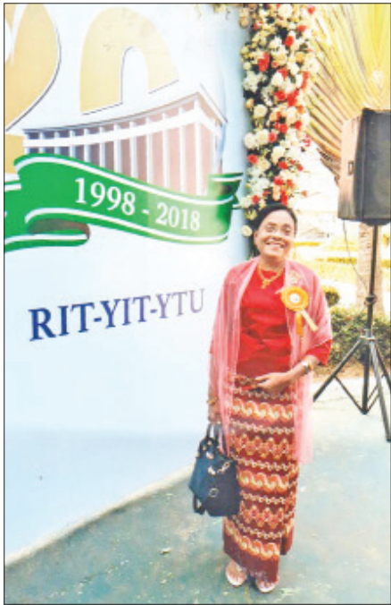
စာရေးသူ ရန်ကုန်စက်မှုတက္ကသိုလ် ဘွဲ့နှင်းသဘင်အခမ်းအနား တက်ရောက်စဉ်။

မြန်မာစာသမားအားလုံးရဲ့ ဘူမိနက်သန် မြန်မာစာဌာနကတော့ မြန်မာစာ ဆရာ ဆရာမ တွေရဲ့ မိခင်ရင်ခွင်ပါပဲ။ မိမိဌာနပါ။ တောင်ငူဆိုတာနဲ့ စာပေခေတ် (၇) ခေတ်မှာ “ပျံ၊ ပင်း၊ အင်း၊ တောင်၊ ညောင် ရမ်းနောင် ကုန်းဘောင်နှစ်ခေတ်ခွဲ”ဆိုပြီး စာပေ ခုနစ် ခေတ်ထဲမှာ တောင်ငူပါနေတာပါ။ ပုဂံခေတ်-ပုဂံမင်း၊ ပင်းယခေတ်- ပင်းယမင်း၊ အင်းဝခေတ် - အင်းဝမင်း၊ တောင်ငူခေတ် - တောင်ငူမင်းဆိုပြီး တွေးလိုက်တာနဲ့ တောင်ငူဘုရင် နတ်သျှင်နောင်ကို တွဲပြီး မှတ်မိကြတာ ပေါ့။ “တောင်ငူဘုရင် နတ်သျှင်နောင်၊ ဖူးမြော်ခဲ့တဲ့ဘုရား ရှင်မွေးလွန်း မင်းနန္ဒာ”ဆိုတဲ့ ဂီတသံပါ ပြန်ကြားရင်းနဲ့ နတ်သျှင်နောင်ရဲ့ နောက်ဆုံးခရီးကို တွေးထင်မိပါတယ်။ နောက်ပြီး ၂၀၀၁ ခုနှစ်တုန်းက ရန်ကုန်တက္ကသိုလ် မြန်မာစာဌာန နှစ်(၆၀)ပြည့် (၁၉၄၁- ၂၀၀၁) အထိမ်း အမှတ်ပွဲ မိတ်ဆုံညစာစားပွဲကို ခြိမ်းခြိမ့်သံ ကျင်းပခဲ့တာ၊ ပါဝင်ဆင်နွှဲခဲ့တာကလည်း အမှတ်တရပါ။ ဆရာကြီး ဦးဖေမောင်တင် ရုပ်တုဖွင့်ပွဲတွေ၊ ဆရာဦးခင်အေးရဲ့ မွေးနေ့ပွဲ ကျွေးမွေးပွဲတွေ၊ မြန်မာစာပေနဲ့ ပတ်သက်တဲ့ စာတမ်းဖတ်ပွဲတွေ ပွဲပေါင်းများစွာ နှံ့ခွင့်ကြုံရတာရော လွဲခဲ့တာတွေ များစွာများစွာပါ။ မိခင်ဌာန ရန်ကုန် တက္ကသိုလ် မြန်မာစာဌာန တောင်ငူဆောင်ကတော့ မြန်မာစာသမားအားလုံးရဲ့ ဘူမိနက်သန်၊ အောင်မြေ မှန်ပါ။ ရန်ကုန်တက္ကသိုလ်မှာ နှစ်နှစ်ကျော်ကျော် တာဝန် ထမ်းဆောင်လည်းပြီးရော RIT ကို ရောက်ခဲ့ရပါတယ်။ ပင်စင်ယူတဲ့အချိန်အထိ (၁၂) နှစ်တာကာလကြာခဲ့တာပါ။ ရန်ကုန်စက်မှုတက္ကသိုလ်ကနေ သိပ္ပံနှင့် နည်းပညာ