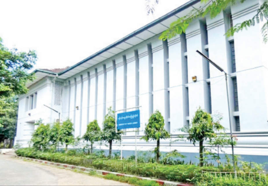
ရန်ကုန်တက္ကသိုလ် စာကြည့်တိုက်။