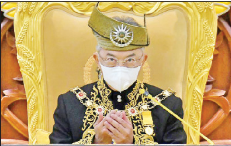
မလေးရှားဘုရင် ဆူလ်တန် အဗ္ဗူလ္လာ ဆူလ်တန် အာမက်ရှား

ကိုးကား - ဘလွန်းဘွက် ဘာသာပြန် - မေလွဲသင်း