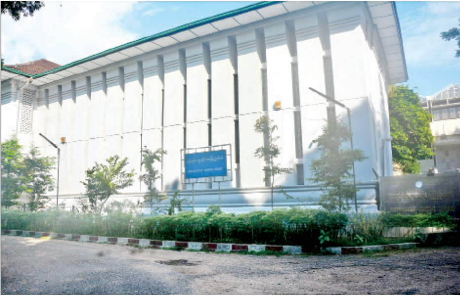
ရန်ကုန်တက္ကသိုလ် စာကြည့်တိုက်။