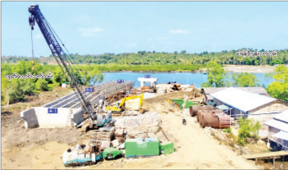
ငရုတ်ကောင်း-ဂေါ်ရန်ဂျီကျွန်းလမ်းပါ၌ တည်ရှိသည့် ချောင်းဝတံတားတည်ဆောက်ရေးစီမံကိန်းလုပ်ငန်းခွင် ကို တွေ့ရစဉ်။