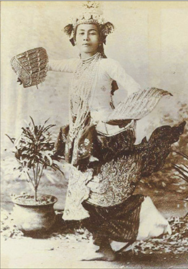
မထွေးလေး

သဘင်မှုမှာလည်း အငြိမ့်သဘင်က အထူး ခြားဆုံး တိုးတက်ဖြစ်ထွန်းခဲ့တယ်။ မငွေမြိုင်၊ ဩဘာသောင်း၊ လေဘာတီမမြရင်၊ ဥက္ကလာ အေးကြည်စသည်ဖြင့် အခုထိ နှစ် ၁၀၀ ချဉ်းလှတိုင်တသသဖြစ်နေကြတဲ့ ကာလတွေ ပါပဲ။ တီထွင်ဆန်းသစ်တဲ့ အနုပညာမှန်သမျှကို ကိုယ်ခံ အားကောင်းခဲ့တဲ့ မြန်မာသန္ဓေမပျက် မမေ့မလျော့ နားလည်သဘောပေါက်