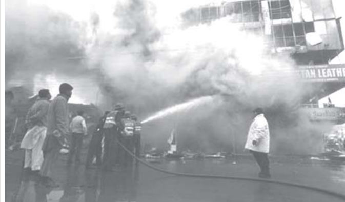
ပါကစ္စတန်နိုင်ငံ ရုပ်ပင်ဒီမြို့တွင် ကုန်တိုက်တစ်ခု မီးလောင်ပြိုကျမှုဖြစ်ပွားရာ မီးသတ်တပ်ဖွဲ့များ မီးငြိမ်းသတ်နေသည့်တိုင်း ဒီဇင်ဘာ ၂၀ ရက်က တွေ့ရစဉ်။