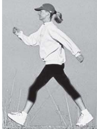
အမျိုးသမီးများအနေဖြင့် ပုံမှန်လမ်း လျှောက် လေ့ကျင့်ခန်းများကို တစ်နေ့လျှင် တစ်နာရီမျှ ပြုလုပ်ပေးသင့်။

လူပုဂ္ဂိုလ် နာရီယာမြို့ တက္ကသိုလ်မှ ဆရာဝန်များက လွန်ခဲ့သော ၁၂ နှစ်တာ ကာလအတွင်း ရင်သားကင်ဆာ ဖြစ်ပွားခဲ့သည့် အမျိုးသမီးများ၏ ရောဂါမှတ်တမ်း ရာဇဝင်များကို