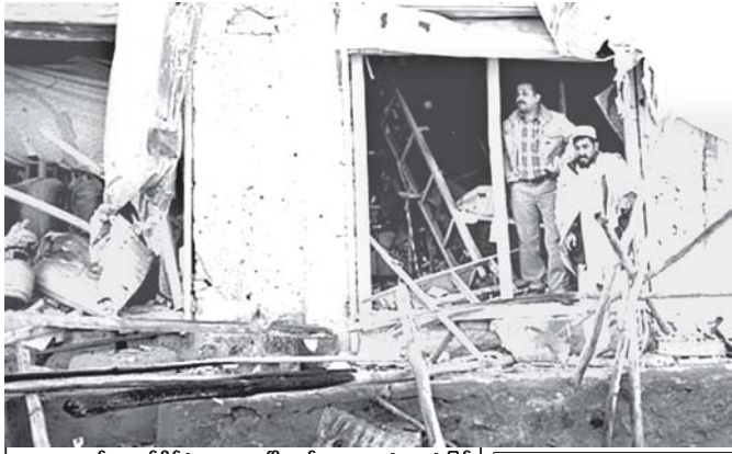
အာဖဂန်နစ္စတန်နိုင်ငံ ကဘူးမြို့တွင် အသေခံထားပုံဖြင့် တိုက်ခိုက်ခံရခြင်းကြောင့် ဖျက်စီးနေသော အဆောက်အအုံတို့ တွေ့ရစဉ်။ (ဓာတ်ပုံ-အင်တာနက်)

အီရတ်နိုင်ငံ တရုတ်နိုင်ငံ မြောက်ဘက် ၁၅၅ မိုင်အကွာရှိ ကယ်ကွတ်မြို့၌ ခုံးပေါက်ကွဲမှုကြောင့် ဖျက်စီးခဲ့သည့်ယာဉ်ကို တွေ့ရစဉ် (ဓာတ်ပုံ-အင်တာနက်)