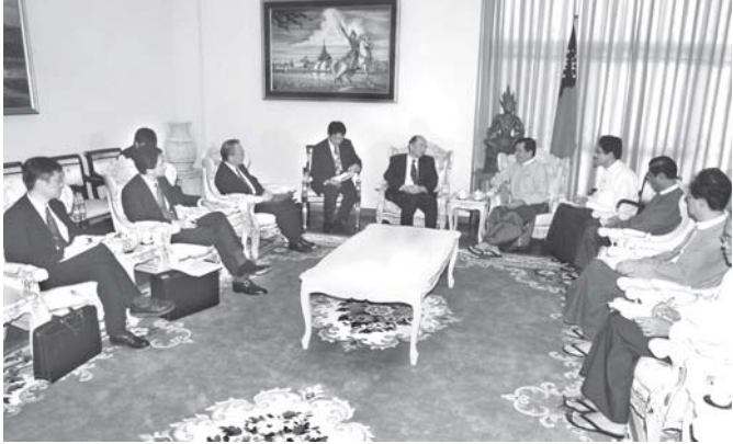
နိုင်ငံခြားရေးဝန်ကြီးဌာန ဝန်ကြီး ဦးညွန့်ဝင်းအား ဂျပန်နိုင်ငံ နိုင်ငံခြားရေးဝန်ကြီးဌာန ဒုတိယဝန်ကြီး မစ္စတာ ကင်အိချိရှိစေအံ့ ခေါင်းဆောင်သော ကိုယ်စားလှယ်အဖွဲ့လာရောက်တွေ့ဆုံစဉ်။ (သတင်းစဉ်)

တိုက်သည့် ဧည့်သည်တော် ဂျပန်နိုင်ငံ နိုင်ငံခြားရေးဝန်ကြီးဌာန ဒုတိယဝန်ကြီး မစ္စတာကင်အိချိရှိစေအံ့