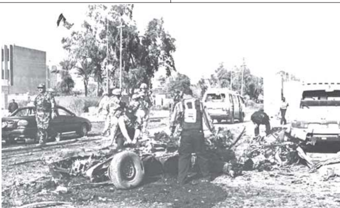
အီရတ်နိုင်ငံ တာကူဘာမြို့တွင် အသေခံပုံတိုက်ခိုက်မှုဖြစ်ပွားရာနေရာ၌ ရဲတပ်ပွဲဝင်များ စစ်ဆေးနေစဉ်။