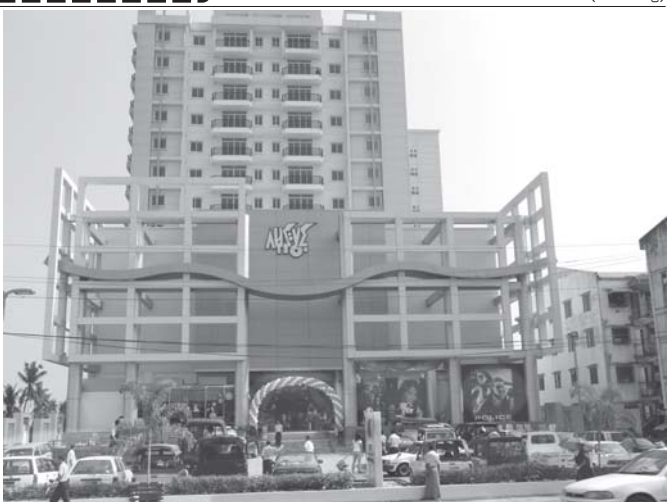
အတည်ပြုချိန်-၁၁း၄၅

ရန်ကုန်မြို့ မရမ်းကုန်းမြို့နယ်၌ ဖွင့်လှစ်ထားသော ဂမုန်းပွင့် Shopping Mall ကို တွေ့ရစဉ်။ (သတင်းစဉ်)