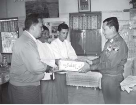
ပို့ဆောင်ရေးဝန်ကြီးဌာန ဝန်ကြီး ဗိုလ်ချုပ်သိန်းဆွေ၊ နေပြည်တော် ယဉ်းမနားမြို့နယ် ပညာပိုင်သင်တန်းစွာ လျှပ်စစ်မီးရရှိရေးအတွက် အလှူငွေကျပ်သိန်း ၂၀၀ ကို ယေးအပ်လှူဒါန်းစဉ်။ (သတင်းစဉ်)