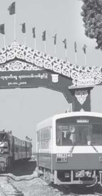
ပျော်ဘွယ် - ဘုရားငါးဆူ အထူးရထား ဘုရားငါးဆူ ဘူတာသို့ ခုတ်မောင်းဝင်ရောက်လာစဉ်။

လှိုင်စင်ကုန်း၊ ဘုရားငါးဆူ၊ ယင်းမာပင်၊ မြင်းခိုက်၊ ကလေး၊ အောင်ပန်း၊ တီကုန်း၊ နောင်တရား၊ ပင်လောင်းတို့၌ ရပ်နားကာ လှိုင်စင်ကုန်းဘူတာ၌ ခရီးဆုံးမည်ဖြစ်သည်။ ပျော်ဘွယ်-ဘုရားငါးဆူ ရထားလမ်းသစ်ကို ၂၀၀၇ ခုနှစ် ဇန်နဝါရီလအတွင်း ဖောက်လုပ်နိုင်ခဲ့ပြီး နေပြည်တော်ပျဉ်းမနားဘူတာမှ စတင်ထွက်ခွာ၍ ရွှေတော်၊ နေပြည်တော်၊ နေပြည်တော် တပ်ကုန်း၊ ရမည်းသင်း၊ ပျော်ဘွယ်၊