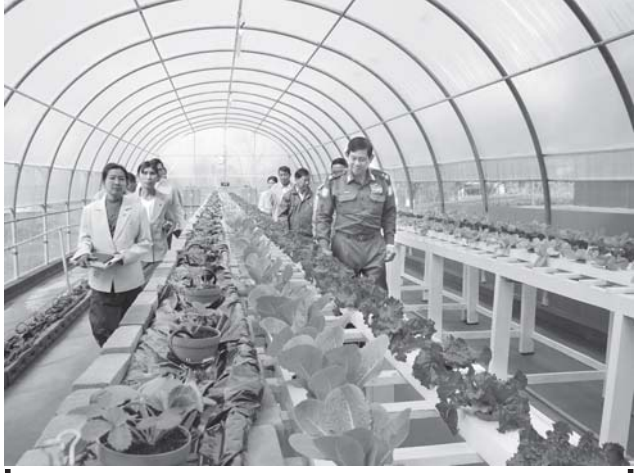
လယ်ယာစိုက်ပျိုးရေးနှင့် ဆည်မြောင်းဝန်ကြီးဌာန ဝန်ကြီး ဗိုလ်ချုပ်ဌေးဦး ပြင်ဦးလွင်မြို့နယ် မြန်မာ့စိုက်ပျိုးရေးလုပ်ငန်း ဒိုးကွင်စိုက်ပျိုးရေးခြံအတွင်း ဆေးဖက်ဝင်သစ်ခွများ စိုက်စနစ်အမျိုးမျိုးဖြင့် စီးပွားဖြစ် စိုက်ပျိုးထားမှုများကို ကြည့်ရှုစစ်ဆေးစဉ်။ (သတင်းစဉ်)

သည် ယနေ့နံနက်ပိုင်းတွင် ကမာရွတ်မြို့နယ် တံသာတော် အခွန်လွှတ်စာ၊ လွိုင်သာယာမြို့နယ် အမှတ်(၈)ရပ်ကွက်ရှိ အခွန်လွှတ်စာ၊ ရွှေပြည်သာမြို့နယ် သီရိမင်္ဂလာပတ်လမ်းရှိ အခွန်လွှတ်စာများသို့ သွားရောက်၍ တည်ငြိမ်ရေး၊ စီးပွားရေးနှင့် ဆေးကုသရေးဆိုင်ရာ၊ ဝင်းသုဇာအရေးဆိုင်ရာ၊ ကုန်ခြောက်ဆိုင်၊ ဟင်းသီးဟင်းရွက်၊ ကြက်၊ ငါးမွေးမြူရေး အထူးရန်အရေးဆိုင်ရာ၊ ဟင်းသီးဟင်းရွက်သား၊ ငါး အရေးဆိုင်ရာ၊ ပင်လယ်ငါးအရေးဆိုင်ရာ၊ ရေချိုး ရေငန်ငါးအရေးဆိုင်ရာ၊ လူသုံးကုန်ပစ္စည်းအရေးဆိုင်ရာ၊ ကုန်ခြောက်ပစ္စည်းအရေးဆိုင်ရာ၊ သစ်သီးဝလံပန်းမန်အရေးဆိုင်ရာများကို လှည့်လည် ကြည့်ရှုစစ်ဆေးပြီး တာဝန်ရှိသူများအား အခွန်လွှတ်စာရေး၏ စည်းကမ်းချက်များဖြစ်သည့် သန့်ရှင်း လတ်ဆတ်စေရေး၊ ဈေးနှုန်းသက်သာစေရေး၊ အလေးချိန်နှင့် မှန်ကန်မှုရှိစေရေး၊ စည်းကမ်းတကျရှိစေရေး၊ ဈေးဝယ်သူများ စိတ်ချမ်းသာစေရေး စသည့် စည်းကမ်းနှင့်အညီ ဆောင်ရွက်ရေးအတွက်အလေးပေး မှာကြားခဲ့ကြောင်း သိရှိရသည်။ (သတင်းစဉ်)