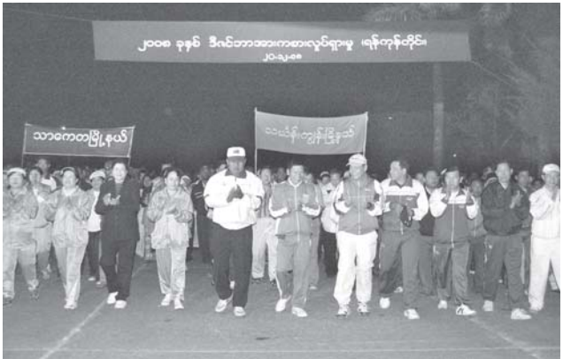
ရန်ကုန်တိုင်း အေးချမ်းသာယာရေးနှင့် ဖွံ့ဖြိုးရေးကောင်စီ ဥက္ကဋ္ဌ၊ ရန်ကုန်တိုင်းစစ်ဌာနချုပ် တိုင်းမှူး ဗိုလ်မှူးချုပ်ဝင်းမြင့်၊ ဒီဇင်ဘာလူထုအားကစားလ စုပေါင်းလမ်းလျှောက်ပွဲတွင် ပြည်သူများနှင့်အတူ ပါဝင်ဆင်နွှဲစဉ်။ (သတင်းစဉ်)

ယင်းနောက် တိုင်းမှူးနှင့် အဖွဲ့ဝင်များသည် မင်္ဂလာတောင်ညွန့်မြို့နယ်အတွင်း သွေးလွန်တပ်ကွေးနှင့် ဝမ်းပျက်ဝမ်းလျှော့ရောဂါ ကြိုတင်ကာကွယ်ရေးပတ်ဝန်းကျင် သန့်ရှင်းရေး ဆောင်ရွက်နေမှုများကို ကြည့်ရှုစစ်ဆေးသည်။ ထို့နောက် တိုင်းမှူးနှင့် အဖွဲ့ဝင်များသည် ကြည့်မြင်တိုင်မြို့နယ် အတွင်းရှိ စက်ဆန်းနှင့် အလယ်