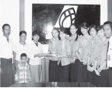
အဲပုဂံလီမိတက် ပျံသန်းရေးဌာန အပတ်စဉ် (၃) မှ လေယာဉ်မောင်/မယ်များက မြတ်ပွင့်ဖြူအောင်အား ကူညီထောက်ပံ့ကြေးပေးအပ်စဉ်။ (အဲပုဂံ)