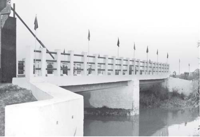
တွံတေးမြို့နယ်ရှိ တမာတကော ချောင်းကူးတံတားကို တွေ့ရစဉ်။