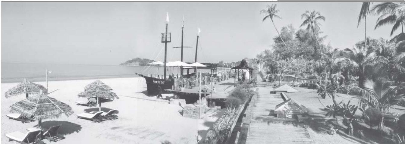
ငပလီကမ်းခြေတွင် တည်ရှိသည့် Aureum Palace Resort အား ကမ်းခြေ၏အလှနှင့် လှည့်တွဲ၍ တွေ့ရစေပါ။

သတင်းဆောင်းပါး - အိဝါ