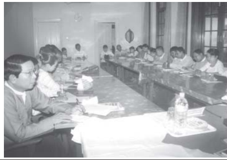
ပုဏ္ဏားမြို့ အထက(၃) ငွေရတသဘင်နှင့် ဆရာတော်တို့အား ဖိတ်ကြားသောပွဲ

ပုဏ္ဏားမြို့ အထက(၃)၏ (၂၅)နှစ်ပြည့် ငွေရတသဘင်နှင့် ကျောင်းသားကျောင်းသူဟောင်းများ၏ (၁၀)ကြိမ်မြောက် သက်ပြည့်အဖြစ်အား ဆရာမကြီးများအား ပုဏ္ဏားတန်တော့ အခမ်းအနားကို ဒီဇင်ဘာ ၂၃ ရက် (အင်္ဂါနေ့) နံနက် ၉နာရီတွင် အထက(၃)ကျောင်းခန်းမ၌ ကျင်းပမည်ဖြစ်ရာ ကန်တော့ခံဆရာကြီး ဆရာမကြီးများနှင့် ရပ်ဝေးရပ်နီးမှကျောင်းသားကျောင်းသူဟောင်းများ တက်ရောက်ကြပါရန် မိတ်ကြားထားသည်။ အလှူငွေနှင့် လှူဖွယ်ပစ္စည်းများ လှူဒါန်းလိုပါက ပုဏ္ဏားမြို့ ကိုကျော့ရမ်း ဖုန်း-၀၉-၂၃၀၁၂၀၄၊ ကိုကျော့ခိုင် ဖုန်း-၀၉-၂၃၀၀၄၇၆၊ ကိုစောဝင်းဇော် ဖုန်း-၀၉-၂၃၀၁၄၇၇၊ ကိုမြတ်မင်းဆွေ ဖုန်း-၀၉-၂၃၀၀၅၇၁ တို့နှင့် ရန်ကုန်မြို့ ကိုခိုင်ဝင်းကြည် ဖုန်း-၀၉-၅၀၂၂၀၆ နှင့် ကိုစိုးလွင်မြင့် ဖုန်း-၀၁-၆၄၀၀၁၇ တို့သို့ ဆက်သွယ်လျှောက်ကြားနိုင်ကြောင်း သိရသည်။ (ကြေးမုံ)