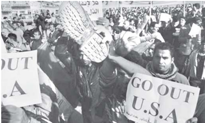
အတည်ပြုချိန် ၁၂:၁၅