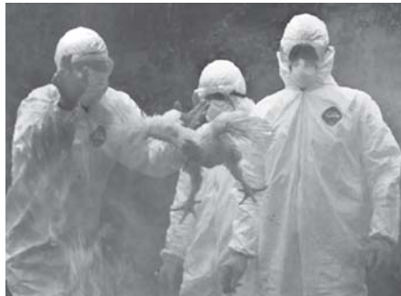
အင်ဒိုနီးရှားနိုင်ငံတွင် ကြတ်ငှက်တုပ်ကွေးရောဂါ နှိမ်နင်းရေး လေ့ကျင့်နေသည့်ကို ဒီဇင်ဘာ ၁၆ ရက်က တွေ့ရစဉ်။