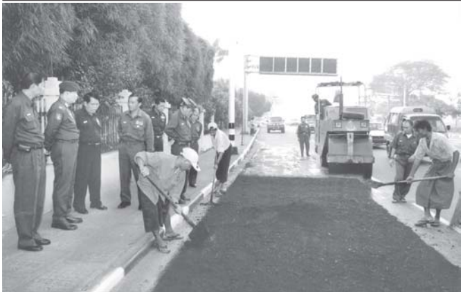
ရန်ကုန်မြို့တော် စည်ပင်သာယာရေး ကော်မတီဥက္ကဋ္ဌ၊ မြို့တော်ဝန် ဗိုလ်မှူးချုပ် အောင်သိန်းလင်း၊ ကမ္ဘာ့အေးစေတီလမ်းအား အကြီးစားပြုပြင်နေမှုကို ကြည့်ရှုစစ်ဆေးစဉ်။ (၁၉)

ဝန်ကြီးသည် ဒီဇင်ဘာ ၁၄ ရက်တွင် မိုးကောင်းမြို့ရှိ မြန်မာ့စီးပွားရေးဘဏ်၊ ပြည်တွင်းအခွန်များဦးစီးဌာန မြို့နယ်ဦးစီးဌာနများ၊ ဒီဇင်ဘာ ၁၅ ရက်တွင် မိုးညှင်းမြို့နယ် အခွန်ဦးစီးဌာနများနှင့် မြန်မာ့စီးပွားရေးဘဏ်တို့ကို ကြည့်ရှုစစ်ဆေးခဲ့ကြောင်း သတင်းရရှိသည်။ (သတင်းစဉ်)