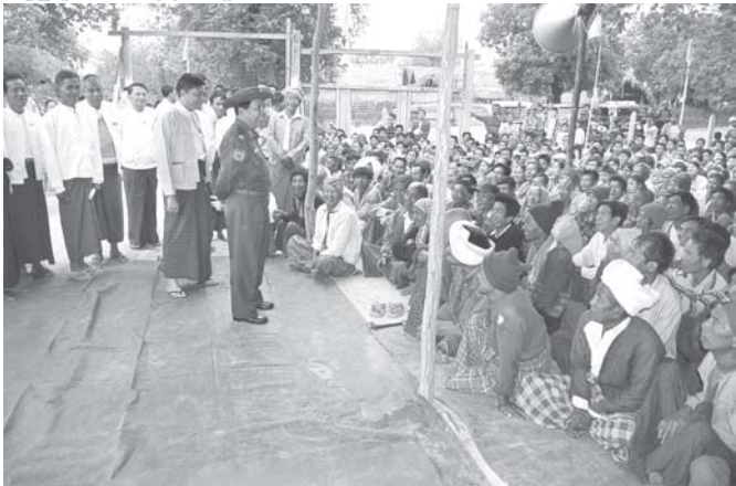
ပြန်ကြားရေးဝန်ကြီးဌာန ဝန်ကြီး ဗိုလ်မှူးချုပ်ကျော်ဆန်း ပုလဲမြို့နယ် အင်မထီးကျေးရွာသို့ ကျေးရွာ ခုနစ်ရွာတို့မှ ဒေသခံပြည်သူများအား ရင်းရင်းနှီးနှီး နှုတ်ဆက်စဉ်။ (သတင်းစဉ်)

ကိုင်းတွင်းကျေးရွာ စာကြည့်တိုက်တို့အတွက်လည်းကောင်း ပေးအပ်လျှပ်စီးကြရာ ဒေသခံတာဝန်ရှိသူများကလက်ခံရယူကြပြီး ဝန်ကြီးသည် ဒေသခံပြည်သူများအား ရင်းရင်းနှီးနှီး နှုတ်ဆက်သည်။ ထို့နောက် ဝန်ကြီးသည် မင်းတိုင်ပင်ကျေးရွာ ကျေးလက်ကျန်းမာရေးဌာနသို့ သွားရောက်ပြီး ဆေးပေးခန်း ငွေပဒေသာပင် စိုက်ထူထားရှိမှုနှင့် လူနာများအား ဆေးကုသဆောင်ရွက်ပေးနေမှုအခြေအနေများကိုကြည့်ရှု၍ ကျန်းမာရေးဝန်ထမ်းများအား အားပေးစကားပြောကြားကာ လိုအပ်ချက်များကိုဖြည့်ဆည်းဆောင်ရွက်ပေးစေကြောင်း သတင်းရရှိသည်။ (သတင်းစဉ်)