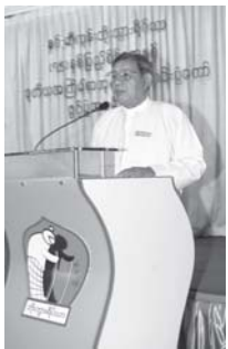
ဦးချစ်ဆွေ စာအုပ်ဈေးရောင်းပွဲတော် ကျင်းပရခြင်း အကြောင်းရှင်းလင်းပြောကြား။

ဘွားဦးမွန်သည် မင်းကွန်း၊ သထုံပေါင်းတည်၊ ပခုက္ကူနှင့် ရန်ကုန်တို့တွင် ဘိုးဘွားရိပ်သာများကို တည်ထောင်ခဲ့သူဖြစ်ပြီး ဘွားဦးမွန်စာအုပ်ဖြင့် ရွှေ့ချယ်ဆုရခဲ့သည့်အတွက် ဂုဏ်ယူဝမ်းမြောက်ကြောင်း ပြောကြားသည်။