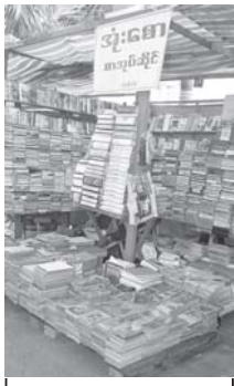
အရောင်း စာအုပ်ဆိုင်များမှ စာအုပ်မျိုးစုံကို တွေ့မြင်ရစဉ်။

ပိုင်ရှင်များသည် မိမိတို့၏ အကျိုးအမြတ်ထက် လူမှုရေး၌ ကုသိုလ်ပြု