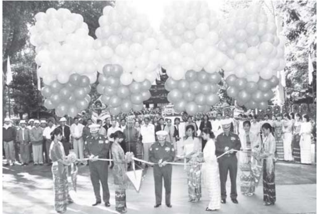
လယ်ယာစိုက်ပျိုးရေးနှင့် ဆည်မြောင်းဝန်ကြီးဌာန ဝန်ကြီး ဗိုလ်ချုပ်ဌေးဦး၊ အမှတ်(၁) လျှပ်စစ်ဓွမ်းအားဝန်ကြီးဌာန ဝန်ကြီး ဗိုလ်မှူးကြီးဇော်မင်းနှင့် သစ်တောရေးရာဝန်ကြီးဌာန ဝန်ကြီး ဗိုလ်မှူးချုပ် သိန်းအောင်တို့ ပြင်ဦးလွင်မြို့ အမျိုးသားကန်တော်ကြီးဥယျာဉ်အတွင်းရှိ တတိယအကြိမ်မြောက် ပန်းပွဲတော်ကို ဖဲကြိုးဖြတ်၍ ဖွင့်လှစ်ပေးကြစဉ်။ (သတင်း-ကျော့ဖုံး) (သစ်တော)

အဆိုပြုပွဲတွင် ဆုရရှိသူများအား လည်းကောင်း ဆုများကို ပေးအပ်ချီးမြှင့်ကြသည်။ ဆက်လက်၍ တိုင်းမှူးနှင့် စည်သူများသည် ပြည်တွင်းနှင့် နိုင်ငံတကာ လူမှုရေးအသင်းအဖွဲ့များက ပူးပေါင်းတင်ဆက်သော ခုခံအားကျဆင်းမှု ကူးစက်ရောဂါကာကွယ်တားဆီးရေးနှင့် တိုက်ဖျက်ရေးဆိုင်ရာ ဘေးသိချင်းနှင့် ပညာပေး တစ်ခန်းရပ်ပြဇာတ်တို့ဖြင့် ဖျော်ဖြေတင်ဆက်မှုကို ကြည့်ရှုအားပေးကြသည်။ (ခံရ) ယင်းနောက် တိုင်းမှူးနှင့်အဖွဲ့ဝင်များသည် ပြည်နယ်ကျန်းမာရေးဦးစီးဌာနနှင့် လူမှုရေးအသင်းအဖွဲ့များကပြသထားသည့် ကမ္ဘာ့ခုခံအားကျဆင်းမှု ကူးစက်ရောဂါတိုက်ဖျက်ရေးနေ့ အထိမ်းအမှတ် ပညာပေး ပြခန်းများကို ကြည့်ရှုအားပေးကြကြောင်းသတင်းရရှိသည်။ (သတင်းစဉ်)