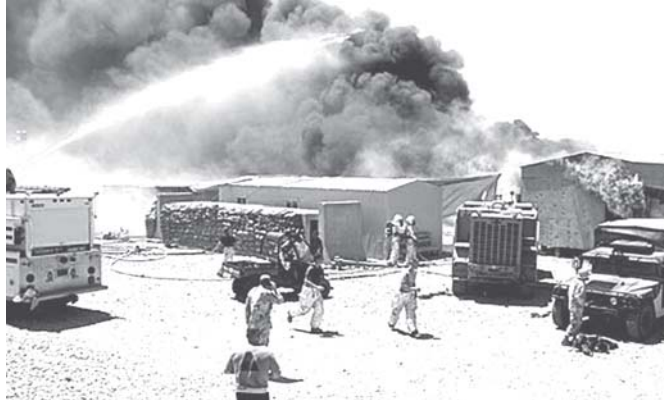
အီရတ်နိုင်ငံမြောက်ပိုင်း နှင်နားထားသော တပ်ဖွဲ့ဝင်များ၏ တိုက်ခိုက်မှု ခံရပြီးနောက် မီးလောင်ကျွမ်းနေသည့် နေရာအား တွေ့ရပုံ။