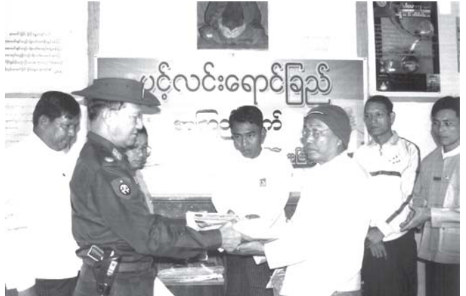
အားကစား ဝန်ကြီးဌာန ဝန်ကြီး ဗိုလ်မှူးချုပ်သူရအေးမြင့် မြင်းမူမြို့နယ် ညောင်ရင်း ကျေးရွာ ဖွင့်လင်းရောင်ခြည် ကိုယ့်အားကိုယ်ကိုး စာကြည့် တိုက်အတွက် ဂျာနယ်မျိုးစုံနှင့် စာစောင်များ၊ စာအုပ်များ ပေး အပ်လှူဒါန်းစဉ်။ (သတင်းစဉ်)

ထို့နောက် ဝန်ကြီးက အမှာစကား ပြောကြားပြီး ကျောင်းအတွက် ကူညီပံ့ပိုးမှုများလည်း ဗလာစာအုပ် များနှင့်အားကစားပစ္စည်းများကိုတာဝန် ရှိသူများထံ ပေးအပ်လှူဒါန်းသည်။ ဒီဇင်ဘာ ၁၀ ရက်တွင် ဖွင့်လှစ် သော ဝိတုသလရာဇာကျောင်းဆောင် သစ်သည် အလျားပေ ၁၄၀၊ အနံပေ ၃၀၊ အမြင့် ၂၃ ပေရှိ နှစ်ထပ် အုတ်ညှပ် သွပ်မီးအဆောက်အအုံ အခြေခံဖြစ်ပြီး ငွေကျပ်သိန်း ၃၀၀ အကုန်အကျခံ တည်ဆောက်ထား ဖြစ်ပါသည်။ သတင်းရရှိသည်။ (သတင်းစဉ်)