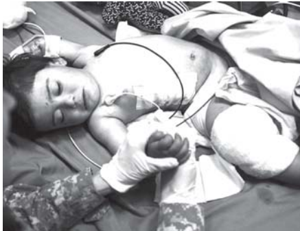
အီရတ်နိုင်ငံ ဘဂ္ဂဒတ်မြို့တွင် ပုံးပေါက်ကွဲပြီးနောက် ဒဏ်ရာရ သွားရသူသော ကလေးငယ်ကို ဆေးရုံ၌ တွေ့ရပုံ။ (ဓာတ်ပုံ-အင်တာနက်)

တရုတ်နိုင်ငံ၏ဆောင်းကာလတွင် မဟာတိုင်းကြီးပေါ်၌ ဆီးနှင်းများ ထူထပ်စွာ ကျဆင်းနေသည်ကို ဒီဇင်ဘာ ၁၀ ရက်က တွေ့ရပုံ။ (ဓာတ်ပုံ-အင်တာနက်)