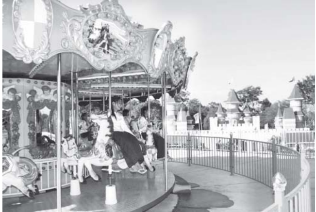
ပြင်ဦးလွင်မြို့ အမျိုးသားကန်တော်ကြီးဥယျာဉ်အတွင်းရှိ ခေတ်မီကလေးကစားကွင်းတွင် ပြည်သူများ လာရောက်အပန်းဖြေနေကြသည်ကို တွေ့ရစဉ်။ (သတင်း-ကျော့ဖုံး) (သစ်တော)