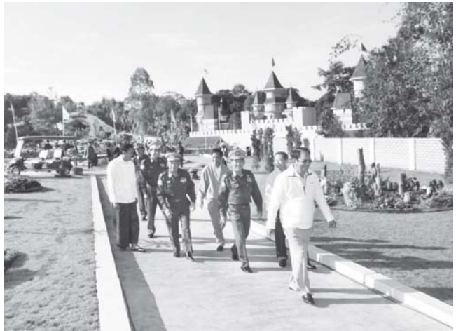
လယ်ယာစိုက်ပျိုးရေးနှင့် ဆည်မြောင်းဝန်ကြီးဌာန ဝန်ကြီး ဗိုလ်ချုပ်ဌေးဦးနှင့် ဝန်ကြီးများ ပြင်ဦးလွင်မြို့အမျိုးသားကန်တော်ကြီး ဥယျာဉ်အတွင်းရှိ ခေတ်မီကလေးကစားကွင်းတွင် ကြည့်ရှုစဉ်။ (သတင်း-ကျော့ဖုံး) (သစ်တော)