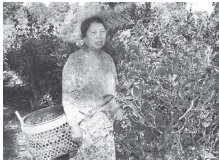
လက်ဖက်ခင်းရဲ့ပဲ ဝမ်းကျောင်းခဲ့တာပါ။ ကလေးတွေ ကျောင်းထားနိုင်တာလည်း လက်ဖက်ခင်း ဝင်ငွေရဲ့ပါပဲ။

ဟုမ္မလင်းမြို့နယ်အား စစ်ကိုင်းတိုင်း၏ လက်ဖက်အထူးရန်အဖြစ် ၂၀၀၀-၂၀၀၁ ခုနှစ်တွင် သတ်မှတ်ခဲ့ရာ မြန်မာ့စိုက်ပျိုးရေးလုပ်ငန်းအနေဖြင့် လက်ဖက်စိုက်ပျိုးထုတ်လုပ်မှု တိုးတက်ရေးအတွက် လက်ဖက်စိုက်