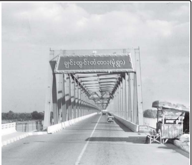
သတင်းဆောင်းပါးနှင့် ဓာတ်ပုံ - ကလေးဝ-ဝင်းသူ

ကျွန်တော်သည် မုံရွာ-ယာကြီး-မြို့မ-ကလေးဝ လမ်းသစ်ကြီး ဖောက်လုပ်ပြီးနောက် ထိုလမ်းမသစ်ကြီးပေါ်မှ မှန်လုံအမြန်ယာဉ်စီးပြီး ခရီးသုံးခေါက် သွားခဲ့ဖူးသည်။ အဆိုပါလမ်းသစ်ကြီး ဖြတ်သန်းရာ ဒေသကား မင်းကင်းမြို့နယ်မှ တောင်တွင်းချောင်ဒေသဖြစ်သည်။