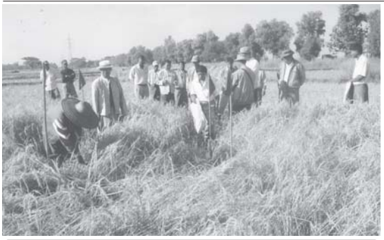
ကန်ကြီးထောင့်မြို့နယ် မိုးစပါးစံပြကွက်ရိတ်သိမ်းမှု ကြည့်ရှုစစ်ဆေး

အခကြေးငွေ ရယူသော သန့်စင်ခန်းတစ်ခုသည် အခြေခံပစ္စည်းများ ပြည့်စုံစေရန်နှင့် ပြည့်ဆည်းထားရမည့်ပစ္စည်းများကို ပြည့်စုံအောင်ထားရှိရန် လိုအပ်။ အခကြေးငွေဖြင့် အသုံးပြုရသည့် သန့်စင်ခန်းများသည် သန့်ရှင်းသပ်ရပ်၍ ဝန်ဆောင်မှု ပြည့်စုံရမည့်အပြင် လုံခြုံစိတ်ချရမှုရှိရန်လည်း လိုအပ်။