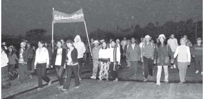
၂၀၀၈ ခုနှစ် ဒီဇင်ဘာ လူထုအားကစားလ စုပေါင်းလမ်းလျှောက်ပွဲကို နေပြည်တော်မြို့မဈေးရွှေ၌ ကျင်းပရာ ဝန်ကြီးဌာနအသီးသီးတို့မှ ဝန်ထမ်းများနှင့် မိသားစုဝင်များ၊ ပြည်သူများ တယှက်တည်း ပါဝင်ဆင်နွှဲ ကြစဉ်။ (သတင်းစဉ်)

နေပြည်တော် ဒီဇင်ဘာ ၆ မြန်မာနိုင်ငံ အိုလံပစ်ကော်မတီဥက္ကဋ္ဌ၊ အားကစားဝန်ကြီးဌာန ဝန်ကြီး ဒိုလ်မျှအောင် သုရအေးမြင့်သည် ယနေ့နံနက် ၆နာရီတွင် နေပြည်တော်မြို့မဈေးရွှေ၌ ကျင်းပသော ၂၀၀၈ခုနှစ် ဒီဇင်ဘာ လူထုအားကစားလ စုပေါင်းလမ်းလျှောက်ပွဲသို့ ပါဝင်ဆင်နွှဲသည်။ အဆိုပါ စုပေါင်းလမ်းလျှောက်ပွဲသို့ မြန်မာနိုင်ငံ အိုလံပစ်ကော်မတီဝင် ဟိုတယ်နှင့် ခရီးသွားလာရေးလုပ်ငန်း ဝန်ကြီးဌာန ဒုတိယဝန်ကြီးဒိုလ်မျှအောင် အေးမြင့်ကြနှင့် ဝန်ကြီးဌာနအသီး သီးတို့မှ တာဝန်ရှိသူများ၊ ဝန်ထမ်း များနှင့် မိသားစုဝင်များ၊ ပြည်သူ လူထုများ စုပေါင်းအင်အား ၇၀၀၀ ကျော်တို့တယှက်တည်း ပါဝင်ဆင်နွှဲ ကြသည်။ နေ့ဦးစွာ နံနက် ၅ နာရီခွဲမှစတင် ၍ ဝန်ကြီးဌာနအသီးသီးတို့မှ ဝန်ထမ်း များနှင့် မိသားစုဝင်များသည် စုရပ် တွင်နေရာယူကြပြီး ဝန်ကြီး ဒိုလ်မျှအောင် သုရအေးမြင့်၊ ဒုတိယဝန်ကြီးနှင့် တာဝန်ရှိသူများက ဦးဆောင်၍ နံနက် ၆နာရီတွင် စတင်တာကွယ် လမ်းလျှောက်ကြရာ သပြေကုန်း