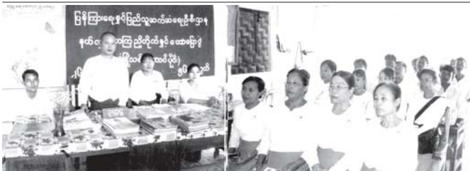
စာကြည့်တိုက်များ ရေရှည်တည်တံ့ခိုင်မာရေး ကွင်းဆင်းဆောင်ရွက်

သို့ဖြင့် ကျိုးတောင်းရေတံခွန်သည် အပူကြည့်သက်သက်သာမဟုတ် တော့ဘဲ ရေတံခွန်မှ အလင်းသွန်းသောအလား လျှပ်စစ်စွမ်းအားများ ပေါ်ထွန်း လာပြီးဖြစ်ရကား ဒေသသားတို့၏ လူမှုဘဝ၊ လူမှုဗီဇပွားဘဝ ဘဝစွမ်းအား အလင်းများလည်း ထင်ရှားတောက်ပလာမူပြီ ဖြစ်ပါသည်။ ။ ။