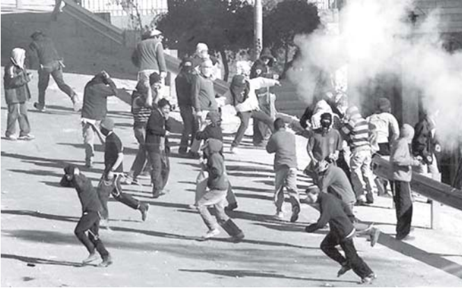
ဂါဇာတစ်မြောင်းဒေသတွင် အစုရေအစု ပါလက်စတိုင်းများ တစ်စုတစ်ဖက် ဝဋ်ပုတ်ဖြစ်နေကြသည်ကို ဒီဇင်ဘာ ၂ ရက် က တွေ့ရစဉ်။