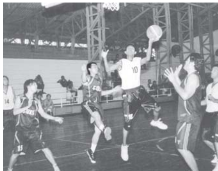
အမျိုးသားအလွတ်တန်းပြိုင်ပွဲ၌ Shadows အသင်းနှင့် Fox အသင်းတို့ ယှဉ်ပြိုင်နေစဉ်။

ယနေ့ ပွဲစဉ်များတွင် အလွတ်တန်း အမျိုးသားပြိုင်ပွဲ၌ M.B.F အသင်းက သံလွင်အသင်းကို (၆၉-၆၈)မှတ်၊