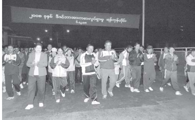
ရန်ကုန်တိုင်း အေးချမ်းသာယာရေးနှင့် ဖွံ့ဖြိုးရေးကောင်စီဥက္ကဋ္ဌ၊ ရန်ကုန်တိုင်းစစ်ဌာနချုပ် တိုင်းမှူး ဗိုလ်မှူးချုပ်ဝင်းမြင့် ၂၀၀၈ခုနှစ် ဒီဇင်ဘာ ပထမပတ် လူထုစုပေါင်းလမ်းလျှောက်ပွဲတွင် ပြည်သူလူထုနှင့်အတူ စုပေါင်းပါဝင် လမ်းလျှောက်စဉ်။

ရန်ကုန်တိုင်း ယာဉ်စဉ်းတမ်း ထိန်းသိမ်းရေးဦးစီးဌာနမှတစ်ဆင့်