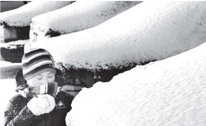
တရုတ်နိုင်ငံအရှေ့မြောက်ပိုင်း လျော့နည်းပြည်နယ် မြို့တော်ရှန်ယန်တွင် ဆောင်းရာသီအစား လွန်ကဲပြီး ဆီးနှင်းများ ထူထပ်စွာ ကျဆင်းနေသည်ကို ဒီဇင်ဘာ ၄ ရက်က တွေ့ရစဉ်။