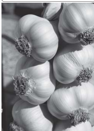
ကြက်သွန်ဖြူတွင် ဆေးဖက်ဝင် အာနိသင် များစွာ ပါဝင်သည်။