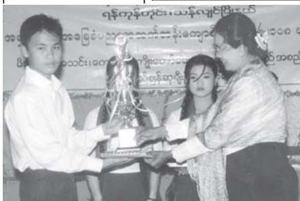
ရန်ကုန်တိုင်း သက်တမ်းအလိုက် ဘတ်စကက်ဘော အဖွဲ့ချုပ်ဥက္ကဋ္ဌ ဖလား အလွတ်တန်းနှင့် သက်တမ်းအလိုက် ဘတ်စကက်ဘောပြိုင်ပွဲ ဒုတိယနေ့ ပွဲစဉ်များကို ယနေ့နံနက် ၈နာရီမှစ၍ အောင်ဆန်းအားကစား မြိုင်ကွင်း မိုးလုံလေလုံခန်းမ၌ ဆက်လက်ကျင်းပသည်။

လွန်ခဲ့သော ၂၄နာရီအတွင်းက ကချင်ပြည်နယ်၊ စစ်ကိုင်းတိုင်း အထက်ပိုင်းနှင့် တနင်္သာရီတိုင်းတို့တွင် တိမ်အသင့်အတင့်ဖြစ်ထွန်းခဲ့ပြီး ကျန်ဒေသများတွင် အများအားဖြင့်သာယာခဲ့သည်။ ညအပူချိန်များမှာ တနင်္သာရီတိုင်းတွင် ဒီဇင်ဘာလ၏ ပျမ်းမျှအပူချိန်တို့အောက် ၃ ဒီဂရီ စင်တီဂရိတ် လျော့နည်းခဲ့ပြီး ကချင်ပြည်နယ်နှင့် စစ်ကိုင်းတိုင်းအထက်ပိုင်း တို့တွင် ဒီဇင်ဘာလ၏ပျမ်းမျှအပူချိန်တို့ထက် ၃ ဒီဂရီစင်တီဂရိတ်မှ ၄ ဒီဂရီ စင်တီဂရိတ်ထိမြင့်ကာ ကျန်ဒေသများတွင် ဒီဇင်ဘာလ၏ ပျမ်းမျှအပူချိန် ခန့်သာ ရှိခဲ့သည်။ ထူးခြားသည့်ညအပူချိန်မှာ ဝဇ္ဇိုင်လင်မြို့တွင် ၂ ဒီဂရီ စင်တီဂရိတ်ဖြစ်သည်။