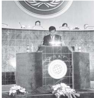
ဘဏ္ဍာရေးနှင့် အခွန်ဝန်ကြီးဌာန ဝန်ကြီး ပိုလ်ချုပ်လှထွန်း ကာတာနိုင်ငံ ဒီဟာမြို့တွင် ကျင်းပသည့် ဖွံ့ဖြိုးတိုးတက်မှုအတွက် ဘဏ္ဍာငွေ ထောက်ပံ့ရေးဆိုင်ရာ ဒုတိယအကြိမ်ညီလာခံ တွင် မိန့်ခွန်းပြောကြားစဉ်။ (ဘဏ္ဍာ/ အခွန်)

ဆက်လက်၍ နိုင်ငံအလိုက် ကိုယ်စားလှယ်အဖွဲ့ ခေါင်းဆောင်များက မွန်တရေသဘောတူညီချက်ဆိုင်ရာ ဆောင်ရွက်ချက်များတင်ပြကြပြီး ဒီဇင်ဘာ ၂ ရက် ညနေ