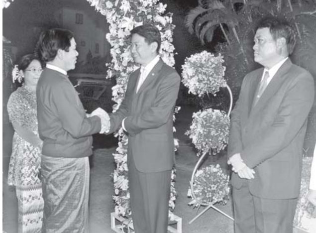
တိုင်းနိုင်ငံဘုရင်မင်းမြတ် ဘုမိဘော အလှူပေးကံရုံ၏ မွေးနေ့အထိမ်းအမှတ် စည်ပုံအခမ်းအနားသို့ တက်ရောက်လာသော နိုင်ငံခြားရေးဝန်ကြီးဌာန ဝန်ကြီး ဦးညွှတ်ဝင်းနှင့် ဇနီးတို့အား ပြည်ထောင်စု မြန်မာနိုင်ငံတော်ဆိုင်ရာ တိုင်းနိုင်ငံသံအမတ်ကြီး H.E. Mr. Bansarn Bunnag ကြိုဆိုနှုတ်ဆက်စဉ်။ (သတင်းစဉ်)