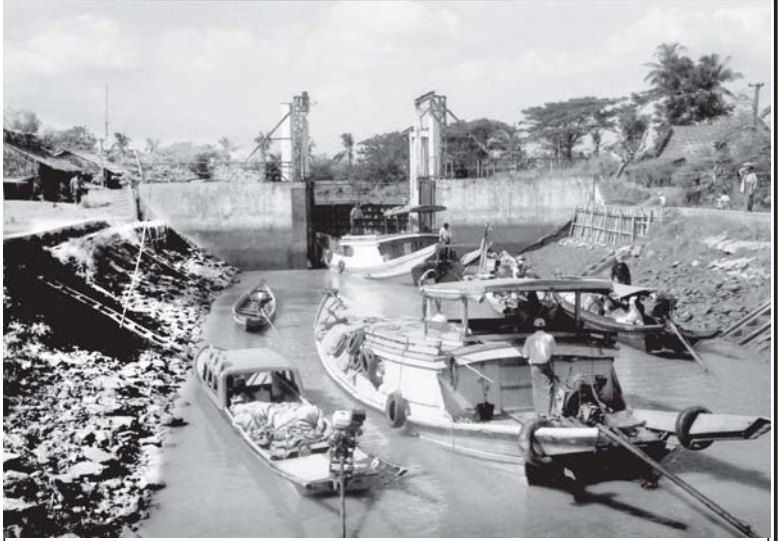
ဗီယက်မား ရေထိန်းတံခံ ရေယာဉ်ဝင်ထွက်ပေါက်ကို တွေ့ရစဉ်။

နိုင်ငံတော်အစိုးရသည် စိုက်ပျိုးရေးကိုအခြေခံ၍ အခြားစီးပွားရေးကဏ္ဍများကိုလည်း ဘက်စုံဖွံ့ဖြိုးတိုးတက်အောင် တည်ဆောက်ရေး ဟူသည့် စီးပွားရေးဦးစည်ချက်နှင့်အညီ လယ်ယာစီးပွားကဏ္ဍ တိုးတက်မြှင့်တင်ရေးအတွက် လိုအပ်သည့် ရေအရင်းအမြစ်များကို ဖော်ထုတ်၍ ဆည်တံခံများ တည်ဆောက်ပေးလျက်ရှိသည့်အပြင် စိုက်ပျိုးရန်ခက်ခဲသော ရေကန်ကွင်းဒေသများတွင်လည်း ရေထိန်းတံခံများ တည်ဆောက်ပေးခဲ့သည်။ ရန်ကုန်တောင်ပိုင်းခရိုင် တွဲတေးမြို့နယ် ဗီယက်မားကျေးရွာအနီး ဗီယက်မားရေထိန်းတံခံကြီးကို ၃-၇-၉၉ နေ့က အောင်မြင်စွာ တည်ဆောက်ပေးခဲ့သော ရေထိန်းတံခံကြီး၏ သက်တမ်းကိုးနှစ်ကျော် ဆယ်နှစ်အတွင်း ရောက်ရှိပြုပြင်ပြီး ယင်းရေထိန်းတံခံ၏ အကျိုးကျေးဇူးကြောင့် ပတ်ဝန်းကျင်ကျေးရွာနေ ပြည်သူလူထု၏ လူမှုရေး၊ စီးပွားရေး၊ ကျန်းမာရေးတို့ ဖွံ့ဖြိုးတိုးတက်ကောင်းမွန်လာခဲ့သည်ကို ကြေးမုံသတင်းအဖွဲ့က ကွင်းဆင်းလေ့လာ သတင်းရယူခဲ့သည်။ စာမျက်နှာ ၉ ကော်လံ ၁ သို့ *