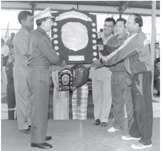
နိုင်ငံတော်ဝန်ကြီးချုပ် ဗိုလ်ချုပ်ကြီးသိန်းစိန် ၂၀၀၈ ခုနှစ် ဒုတိယအကြိမ် ဝန်ကြီးဌာနပေါင်းစုံ ဘော်လီဘောပြိုင်ပွဲတွင် ပထမဆုရရှိသော နယ်စပ်ဒေသနှင့် တိုင်းရင်းသားလူမျိုးများ ဖွံ့ဖြိုးတိုးတက်ရေးနှင့် စည်ပင်သာယာရေးဝန်ကြီးဌာနအသင်းအား ပင်မဒိုင်းဆုကြီး ပေးအပ်ချီးမြှင့်စဉ်။ (သတင်းစဉ်)

အဆိုပါ ၂၀၀၈ ခုနှစ် ဒုတိယအကြိမ် ဝန်ကြီးဌာနပေါင်းစုံ ဘော်လီဘောပြိုင်ပွဲကို နိုင်ငံဘာ ၇ ရက်မှ စတင်၍ ကျင်းပခဲ့ပြီး ပြိုင်ပွဲတွင် ဝန်ကြီးဌာနများမှ ဘော်လီဘောအသင်း ၂၉ သင်းတို့ ပါဝင်ယှဉ်ပြိုင်ခဲ့ကြကြောင်း သိရှိရသည်။ (သတင်းစဉ်)