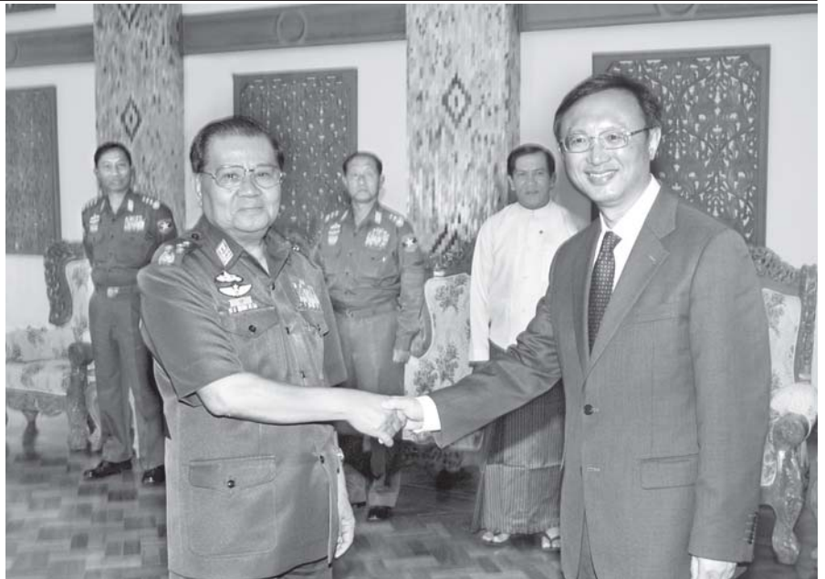
နိုင်ငံတော် အေးချမ်းသာယာရေးနှင့် ဖွံ့ဖြိုးရေးကောင်စီ ဥက္ကဋ္ဌ ဗိုလ်ချုပ်မှူးကြီးသန်းရွှေ တရုတ်ပြည်သူ့သမ္မတနိုင်ငံ နိုင်ငံခြားရေးဝန်ကြီး ဌာန ဝန်ကြီး မစ္စတာ ရန်ကျဲချီအား နေပြည်တော်ရှိ ဘုရင့်နောင်ရိပ်သာ၌ ရင်းရင်းနှီးနှီး နှုတ်ဆက်စဉ်။ (သတင်းစဉ်)

ဧည့်သည်တော် တရုတ်ပြည်သူ့သမ္မတနိုင်ငံ နိုင်ငံခြားရေးဝန်ကြီးဌာန ဝန်ကြီး မစ္စတာရန်ကျဲချီ ခေါင်းဆောင်သည့် ကိုယ်စားလှယ်အဖွဲ့အား နိုင်ငံခြားရေးဝန်ကြီးဌာန ဝန်ကြီး ဦးညွှတ်ဝင်း၊ နိုင်ငံခြားရေးဝန်ကြီးဌာနမှ တာဝန်ရှိသူများ၊ ပြည်ထောင်စု မြန်မာနိုင်ငံတော်ဆိုင်ရာ တရုတ်ပြည်သူ့ သမ္မတနိုင်ငံ သံအမတ်ကြီး မစ္စတာကွမ်မူနှင့် သံရုံးအဖွဲ့ဝင်များက နေပြည် တော်လေဆိပ်တွင် ပို့ဆောင်ခွက်ဆက်ကြသည်။ (သတင်းစဉ်)