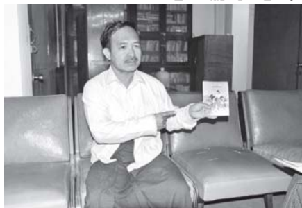
“ကလေးတွေ စိတ်ပျော်ရွှင်ကြည့်နဲ့စေရန်၊ အသိပညာဗဟုသုတ များ တိုးပွားစေရန်နဲ့ တိုင်းချစ်ပြည်ချစ်စိတ်ဓာတ် ထက်သန်စေရန် ရည်ရွယ်ပြီး ရေးခဲ့ပါတယ်”

အမျိုးသားစာပေ(ကလေးစာပေ)ဆုရ မောင်မြင့်ထွန်း