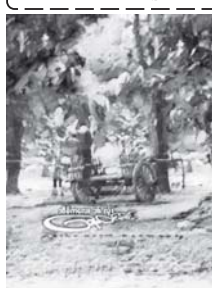
ဆရာနေဝင်းမြင့်၏ အမျိုးသား စာပေဆုရ အိမ်ကလေး ဝင်းလုံး (ဝတ္ထုတိုပေါင်းချုပ်) စာအုပ် မျက်နှာပုံ။

အမျိုးသားစာပေ(ကလေးစာပေ)ဆုရ မောင်မြင့်ထွန်း