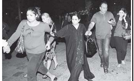
လုံခြုံရေးတပ်ဖွဲ့များက စနေနေ့နံနက်ပိုင်းတွင် နောက်ဆုံးအပြစ်တင်ချီမဟာဟိုတယ်ကို ဝင်ရောက်စီးနင်းစဉ် မီးခိုးလွှဲများ မီးတောက်များက ဟိုတယ်ကြီးအား ဖြူဖွယ်နေသည့်တိုက် တွေ့ရစဉ်။ စစ်သွေးကြွများက တစ်ခန်းပြီးတစ်ခန်း နိုင်ငံခြားသားများကို ရှာဖွေသည့်အတွက် ၎င်းတို့သည် မှောင်ထဲတွင် ပုန်းအောင်းနေရကြောင်း ထွက်ပြေးလွတ်မြောက်လာသူများက ပြောသည်။ အင်တာနက်။