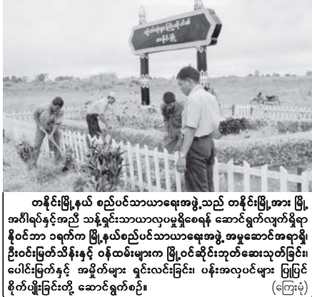
တရုတ်ပြည်နယ် စည်ပင်သာယာရေးအဖွဲ့သည် တရုတ်ပြည်နယ် အာရှဒီမိုကရေစီနှင့် အာရှဒီမိုကရေစီအဖွဲ့အစည်းတို့၏ အသင်းများကို ဖွဲ့စည်းပေးခဲ့သည်။