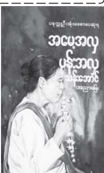
ဆရာ သန်းအောင် (အညာ မြေ)၏ အမျိုးသားစာပေဆုရ အမေ့အလွှာ ပန်းအလှ (ကဗျာ ပေါင်းချုပ်) စာအုပ်မျက်နှာပုံ။