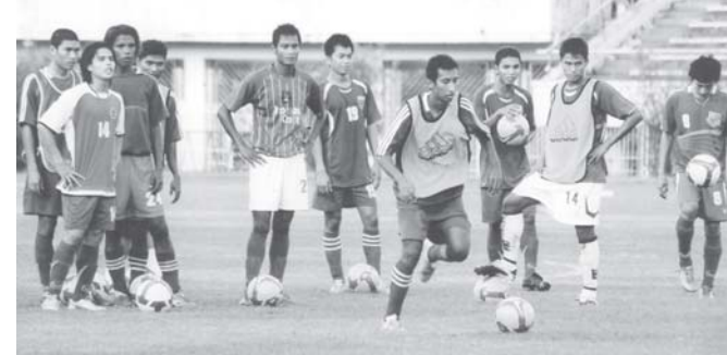
အောင်မြင်မှုရရှိရန် လေ့ကျင့်နေသည့် ပဏာမလက်ရွေးစင်အသင်း။

ဘာ ၂၄၊ ၂၈ ရက်တို့တွင် ကျင်းပ သွားမည် ဖြစ်သည်။ မြန်မာအသင်း သည် ဒီဇင်ဘာ ၅ ရက်တွင် အင်ဒို နီးရှားအသင်း၊ ဒီဇင်ဘာ ၇ ရက်တွင် စင်ကာပူအသင်း၊ ဒီဇင်ဘာ ၉ ရက် တွင် ကမ္ဘောဒီးယားအသင်းတို့နှင့် ယှဉ်ပြိုင်ကစားရမည်ဖြစ်သည်။ အာဆီယံ ဆုငွေကီးဖလားဘောလုံး ပြိုင်ပွဲမှာ မြန်မာ့လက်ရွေးစင်အသင်း ယခုနှစ်အတွင်း ယှဉ်ပြိုင်ရန်ရှိသည့် နိုင်ငံတကာပြိုင်ပွဲများ အနက်မှ ဆဌမမြောက်ပြိုင်ပွဲ(နောက်ဆုံးပြိုင်ပွဲ) ဖြစ်သည်။ မြန်မာအသင်းသည် ယခု နှစ်အတွင်း ပြည်ပပြိုင်ပွဲ ငါးခုကို