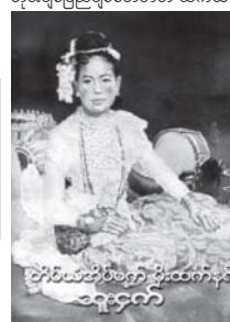
တိမ်ယံအိမ်မက် မိုးထက်နုရီ စာအုပ်မျက်နှာပုံ။

မောင်မယ်ရုပ်စုံ၊ ပန်းမျိုးတစ်ထောင် မရုဇင်း၊ အလင်္ကာဝတ်ရည်ဂျာနယ် နှင့် ကလေးသုတစာစာစောင်များတွင် ရေးသားဖော်ပြခဲ့သော ကဗျာများ နှင့် အသစ်ရေးသားသော ကဗျာ များ ပေါင်းစပ်၍ ယခုစာအုပ်ကို ထုတ်ဝေခဲ့ခြင်း ဖြစ်သည်။ ဆက် လက်၍လည်း ကံကောင်းပွင့်သစ် စာစုံ စာကုံးစာအုပ်၊ ကလေးပုဒ်ဝင် စာမျက်နှာ ၄ ကော်လံ ၁ သို့ ●