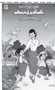
မင်္ဂလာနံနက်ခင်း ကလေးကဗျာ များစာအုပ် မျက်နှာပုံကို တွေ့ ရရင်။

“လူ ငယ် ဆရာဝန်များ အ နေ ဖြင့် စိတ်ထား မွန် မြတ်ဖို့ဖုလုံးလှ ဆရာဝန် ဖြစ် ဖို့ ရန် ရည် ရွယ်”