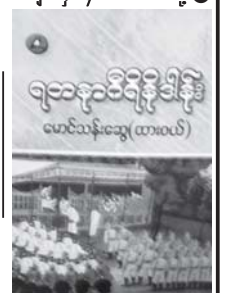
ရတနာရီရီခါနီး စာအုပ် မျက်နှာပုံကို တွေ့ရရင်။