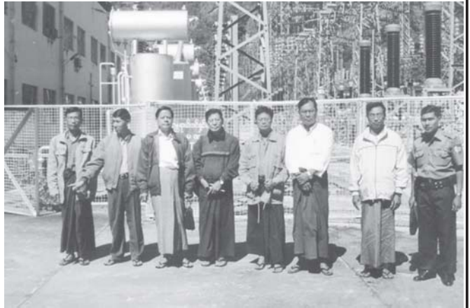
လောပီတ ရေးအားလျှပ်စစ်စက်ရုံမှူးနှင့် ကယားသခင် စာပေခရီးသို့ ရောက်ရှိသူများ မှတ်တမ်းတင်ဓာတ်ပုံရိုက်ကြစဉ်။

လနတ်တော် စာဆိုတော်ပွဲမတိုင်မီ ကျွန်တော် တို့သည် ကယားပြည်နယ်၏ ရင်ခွင်သို့ ခိုဝင်ခဲ့ရသည်။ ပြည်နယ်နှင့် တိုင်း ၁၄ ခုတွင် မရောက်ဖြစ်ဖူးသေးဘဲ တစ်ခုသာကျန်သော ပြည်နယ်ကို ရောက်ရသည်မို့ လက်ခံအားပေးမှု၊ လေ့လာခွင့်ရမှုတို့ကြောင့်လည်း ကယားသခင်ဒေသကို အမှတ်ရစရာဖြစ်ခဲ့ပါသည်။