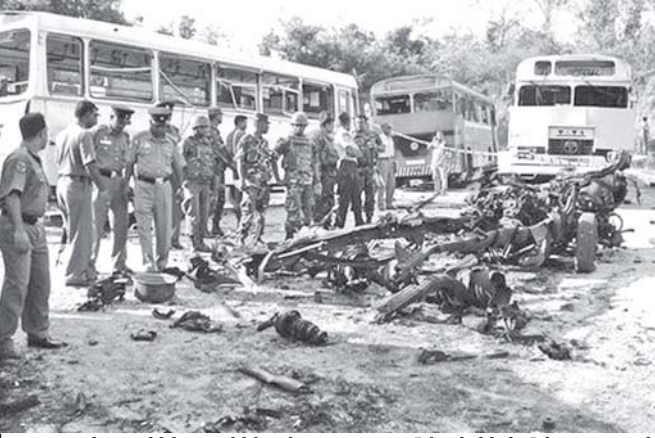
အာဖဂန် နစ္စတန်နိုင်ငံတောင်ပိုင်းတွင် အသေခံကားပုံးဖြင့် တိုက်ခိုက်မှုဖြစ်ပွားရာ နေရာ၌ တာဝန်ရှိသူများက စစ်ဆေးနေသည့်တိုက် တွေ့ရစဉ်။