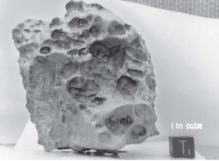
ကမ္ဘာမြေပြင်ပေါ်သို့ ကျဆင်းလာခဲ့သော သံသတ္တု၊ ရိုင်းဓာတ်များ ပါဝင်သည့် ဥက္ကဓ်တစ်ခုကို တွေ့ရ ဝေ့။

မွန်တရီယယ် နိုဝင်ဘာ ၂၈ ကနေဒါနိုင်ငံ အနောက်ပိုင်းသို့ ကျရောက်ခဲ့သည့် မြေခ ဥက္ကဓ်ကို သိပ္ပံပညာရှင်များနှင့် အပျော်တမ်း နက္ခတ်တာရာ လေ့လာသူများက ပိုက်စိတ်တိုက် ရွာဖွေလျက်ရှိကြောင်း၊ ကြေကျခဲ့သော ဥက္ကဓ်၏ မူလအလေးချိန်မှာ ၁၀ တန်အထိ ရှိနိုင်ကြောင်း ယနေ့ အင်တာနက်သတင်းတွင် ဖော်ပြသည်။ ကနေဒါနိုင်ငံအနောက်ပိုင်း ပရိနစ်မြတ်ခင်းဒေသသို့ ကျရောက် ခဲ့သော မြေခ ဥက္ကဓ်သည် နိုဝင်ဘာ ၂၀ ရက်က ကြေကျခဲ့ရာတွင် တီအင်နိုတီ ယမ်းဘီလူးတန်ချိန် ၃၀၀ ခန့် ပြင်းအားနှင့် ညီမျှသော ပြင်းအားအထိ ပေါက်ကွဲခဲ့ကြောင်း ကနေဒါ အာကာသအေဂျင်စီမှ ကျွမ်းကျင်သူပညာရှင်များက ပြောကြားသည်။ အဆိုပါ ဥက္ကဓ် ကြေကျမှုကို အယ်လ်ဘားတာပြည်နယ်ရှိ ၄၃၅ မိုင်ပတ်လည် အကွာအဝေးအတွင်းရှိ ပြည်သူထောင်ပေါင်း များစွာက တွေ့မြင်ခဲ့ကြရကြောင်း၊ အယ်လ်ဘားတာနှင့် ဆပ်ကက် ချီဝန်ပြည်နယ်တို့၏ နယ်စပ်ဒေသရှိ အယ်လိုင်မင်စတာမြို့၏ အရှေ့တောင်ဘက်သို့ ယင်းဥက္ကဓ် ကျရောက်ခဲ့ကြောင်း နက္ခတ္တ