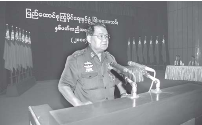
နေပြည်တော် နိုဝင်ဘာ ၂၈

ပြည်ထောင်စုကြံ့ခိုင်ရေးနှင့် ဖွံ့ဖြိုးရေးအသင်း နှစ်ပတ်လည် သင်းလုံးကျွတ်အစည်းအဝေး (၂၀၀၈) စတင်စုနေ့(ယနေ့)တွင် ပြည်ထောင်စုကြံ့ခိုင်ရေးနှင့် ဖွံ့ဖြိုးရေးအသင်းနာယက၊ နိုင်ငံတော် အေးချမ်းသာယာရေးနှင့် ဖွံ့ဖြိုးရေးကောင်စီ ဥက္ကဋ္ဌ၊ တပ်မတော်ကာကွယ်ရေးဦးစီးချုပ် ဗိုလ်ချုပ်မှူးကြီးသန်းရွှေ မြွက်ကြားသော ဩဝါဒစကားအပြည့်အစုံမှာ အောက်ပါအတိုင်းဖြစ်ပါသည်။