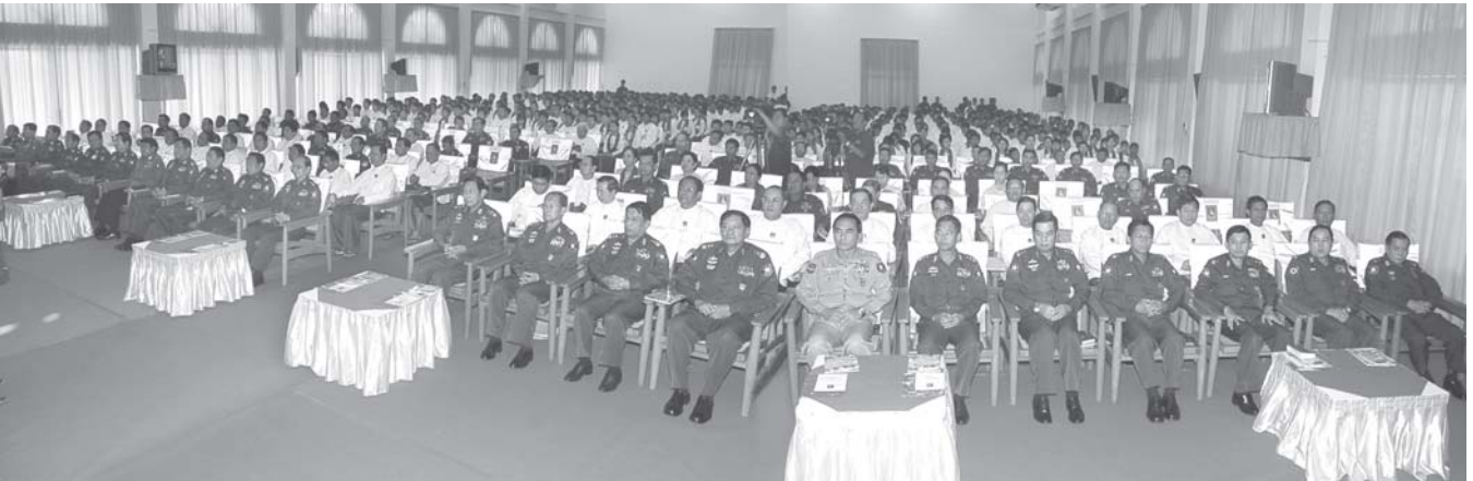
နေပြည်တော် နိုဝင်ဘာ ၂၈

ပြည်ထောင်စုကြံ့ခိုင်ရေးနှင့် ဖွံ့ဖြိုးရေးအသင်းနာယက၊ နိုင်ငံတော် အေးချမ်းသာယာရေးနှင့် ဖွံ့ဖြိုးရေးကောင်စီဥက္ကဋ္ဌ၊ တပ်မတော်ကာကွယ်ရေးဦးစီးချုပ် ဗိုလ်ချုပ်မှူးကြီးသန်းရွှေ၊ ပြည်ထောင်စုကြံ့ခိုင်ရေးနှင့် ဖွံ့ဖြိုးရေးအသင်း နှစ်ပတ်လည်သင်းလုံးကျွတ်အစည်းအဝေး(၂၀၀၈)၊ စတင်စုနေ့တွင် ဩဝါဒစကားမြွက်ကြားစဉ်။ (သတင်းစဉ်)