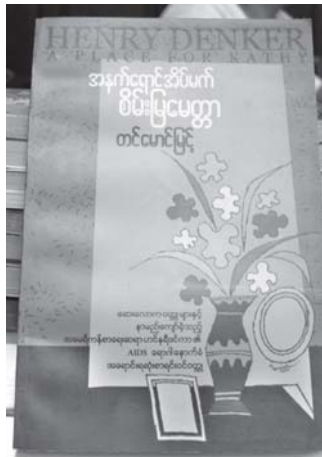
ဘာသာပြန်-ရသ တင်မောင်မြင့်၏ အမျိုးသားစာပေ (ဘာသာပြန်-ရသ) ဆုရ အနက်ရောင်အိပ်မက် စိမ်းမြေမေတ္တာ စာအုပ်မျက်နှာပုံ။