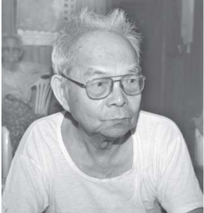
“ကိုယ့်ဘဝ တစ်သက်တာလုံးမှာ ရေးခဲ့သမျှ စာပေတွေကို ဂုဏ်ပြုတဲ့အနေနဲ့ နိုင်ငံတော်က အိုးမြှင့်တဲ့ဆုဆိုတော့ ဂုဏ်ယူတာပေါ့” အမျိုးသားစာပေတစ်သက်တာဆုရ စာရေးဆရာ ဆင်ဖြူကျွန်းအောင်သိန်း

ဆရာတက္ကသိုလ်စိန်တင်သည် ၁၉၉၃ ခုနှစ်အတွက် ပခုက္ကူဦးအုံးဖေ ဘဝခရီးနှင့် အောင်မြင်နည်းအတူအကြံများ စာအုပ်ဖြင့် ပထမအကြိမ် အမျိုးသားစာပေဆုရရှိခဲ့ပြီး ဘွားဦးဇွန်း၏ အတ္ထုပ္ပတ္တိစာအုပ်မှာ ဒုတိယ အကြိမ် ဆုရရှိခြင်း ဖြစ်သည်။ ယနေ့အချိန်အထိ လုံးချင်းစာအုပ်ပေါင်း