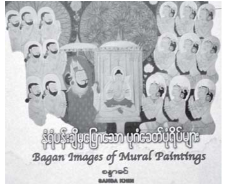
စန္ဒာဝင် (ရှေးဟောင်းသုတေသန)၏ အမျိုးသားစာပေ (မြန်မာ့ယဉ်ကျေးမှုနှင့် အနုပညာဆိုင်ရာစာပေ)ဆုရ နံရံပန်းချီမှ ပြောသော ပုဂံခေတ် ပုံရိပ်များ စာအုပ်မျက်နှာပုံ။