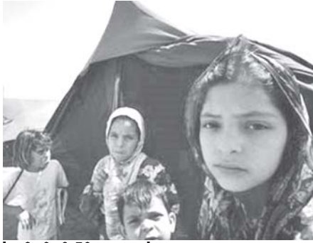
အီရတ်တွင် ဖြစ်ပွားနေသော လက်နက်ကိုင် တိုက်ခိုက်မှုများကြောင့် အိုးအိမ်မဲ့ဖြစ်ကာ ခုတုသည်ဘဝ ကျရောက်ရသော သားတစ်စုကို တွေ့ရစဉ်။