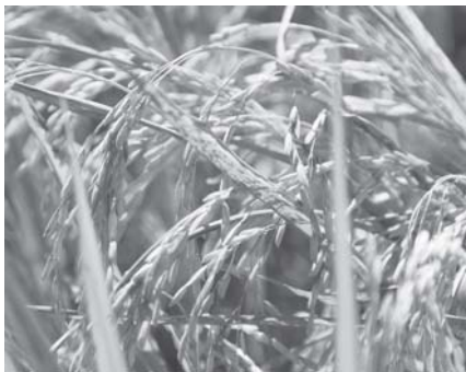
ရိတ်သိမ်းရန်အသင့်ဖြစ်နေသော မိုးစပါးခင်းများကလည်း သီးနှံ များ ပြီးအက်စွာ ဤသို့တွေ့ရစဉ်။

ဧက ၅၀၀၀ စိုက်ခင်းအတွင်းမှ နွေစပါးစိုက်ပျိုးနေမှု၊ ပျိုးထောင် နေမှုများကို လယ်သမားများက တက်တက်ကြွကြွနှင့် လုပ်ကိုင်နေ ကြသည်ကို တွေ့ရသည်။ လယ်ထွန် နေသူများက ဘေးသီချင်းတကြော် ကြော်အော်ဆိုကာ လယ်ယာလုပ်ငန်း ခွင် ဝင်နေမှုသည် စပါးစိုက် တောင်သုတို့၏ စိတ်ချမ်းမြေ့လွတ်လပ် မှုမှာ ရင်းသို့ ကူးစက်ခံစားရလေသည်။