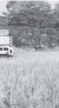
ညောင်လေးပင်မြို့နယ်အဝင် စပါးစိုက်ခင်း၌ ခေတ်မီရိတ်သိမ်းမြေလှေ့စက်ဖြင့် ရိတ်သိမ်းနေမှုကို ဤသို့ တွေ့ရသည်။

မျိုးတွေစိုက်ပါတယ်။ အခု မိုးစပါး တွေရောင်းဖို့ စီစဉ်နေပါတယ်။ လက်ရှိစပါးတင်း ၁၄၀၀ ရောင်းဖို့ အတွက် ဝယ်သူတွေ ရောက်နေပြီ။ ဒေသပေါက်ဈေးနဲ့ ရောင်းဖြစ်သွား မှာပါ။ အများအားဖြင့်တော့ ပဲခူးက ကုန်သည်တွေ လာဝယ်ကြတယ်။