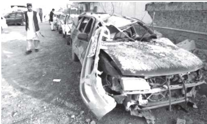
အတည်ပြုချက် ၁၂၄၅