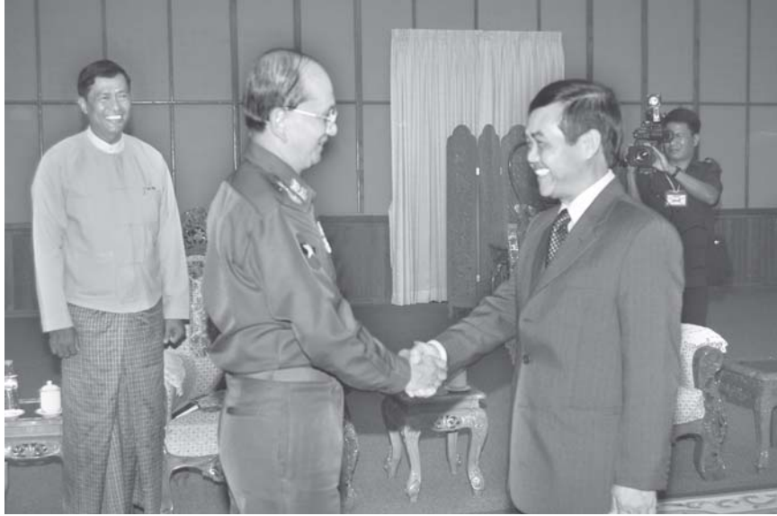
နိုင်ငံတော်ဝန်ကြီးချုပ် ဗိုလ်ချုပ်ကြီးသိန်းစိန် တာဝန်ထမ်းဆောင်ခြင်းပြီးဆုံး၍ ပြန်လည် ထွက်ခွာတော့မည့် ပြည်ထောင်စုမြန်မာနိုင်ငံတော်ဆိုင်ရာ သံတမန်အဖွဲ့နာယက ဗီယက်နမ် ဆိုရှယ်လစ်သမ္မတနိုင်ငံ သံအမတ်ကြီး H.E. Mr. Tran Van Tung အား နေပြည်တော်ရှိ အစိုးရအဖွဲ့မှ ဧည့်ခန်းမ၌ ရင်းရင်းနှီးနှီးဆက်စဉ်။ (သတင်း-ရှေ့ဖုံး) (သတင်းစဉ်)

ဆက်လက်၍ နယ်စပ်ဒေသနှင့် တိုင်းရင်းသားလူမျိုးများ ဖွံ့ဖြိုးတိုးတက်ရေးနှင့်စည်ပင်သာယာရေး ဝန်ကြီးဌာန ခုတိယဝန်ကြီး ဗိုလ်မှူးကြီးတင်ငွေထံသို့ အေးရွှားဝေါလ်ကုမ္ပဏီလီမိတက် မန်နေဂျင်း ဒါရိုက်တာ ဦးထွန်းမြင့်နိုင်က ဆောက်လုပ်လျှောက်ပေးသော မြို့မဈေးနှင့်ပတ်သက်သည့် စာရွက်စာတမ်းများအား လွှဲပြောင်းပေးအပ်ပြီး ခုတိယဝန်ကြီး ဗိုလ်မှူးကြီးတင်ငွေ၊ ဦးဆောင်ညွှန်ကြားရေးမှူး ဦးစိန်တင်ဝင်း၊ မန်နေဂျင်းဒါရိုက်တာ ဦးထွန်းမြင့်နိုင်တို့က မြို့မဈေးဖွင့်ပွဲ