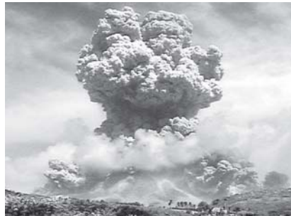
၂၀၀၇ခုနှစ် ဇန်နဝါရီက ကာရစ်ဘီယံဒေသ မောင်ဆာရက်ကျွန်းပေါ်ရှိ မီးတောင်တစ်လုံး ပေါက်ကွဲနေသည့်ကို ငွေ့ရစဉ်။ (ဓာတ်ပုံ-အင်တာနက်)

မီးတောင်တစ်လုံး မပေါက်ကွဲမီ ယင်းမီးတောင်က ကြိုတင်ထုတ်လွှတ်သော ဓာတ်ငွေ့များကို တိုင်းတာနိုင်ခြင်းဖြင့် မီးတောင်ပေါက်ကွဲမည့်အချိန်ကို ခန့်မှန်းနိုင်ရန် သိပ္ပံပညာရှင်များက ရေဒီယိုဖြင့်ထိန်းချုပ်သည့် ရဟတ်ယာဉ်ငယ် တစ်စင်းကို တီထွင်စမ်းသပ်လျက် ရှိသည်။