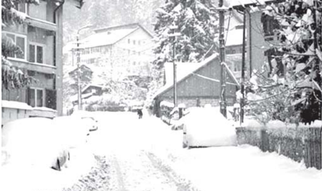
ရိုးမေးနီးယားနိုင်ငံ ဘရာဆော့ဒ်ဒေသ ပရီးမီးယားလီဂျွန် ယခုနှစ်အတွင်း ပထမဆုံးအကြိမ်အဖြစ် နှင်းများထူထပ်စွာ ကျဆင်းနေသည်ကို နိုဝင်ဘာ ၂၁ ရက်က တွေ့ရစဉ်။ (ဓာတ်ပုံ-အင်တာနက်)