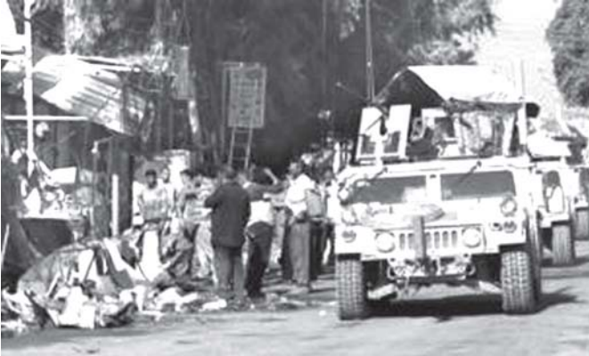
စီရင်စိုင်း ဘာကူဘာဒေသတွင် ဗုံးပေါက်ကွဲမှု ဖြစ်ပွားပြီးနောက် အပျက်အစီးများကို တွေ့ရစဉ်။