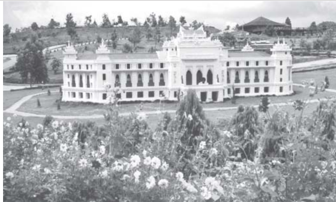
အမျိုးသားကန်တော်ကြီးဥယျာဉ်မှ ရန်ကုန်မြို့တော် ခန်းမပုံစံတူ။

ဖြစ်သကဲ့သို့တောတွင်းသစ်သားတံတားပေါ်မှသဘာဝရွှင်း၊သဘာဝပေါက်ပင်ကြီးများ၊ ကျေးဇူးတင်များနှင့် ဆေးဖက်ပင် အပင်များကို သဘာဝအတိုင်း လေ့လာတွေ့မြင်နိုင်ကြသည်။