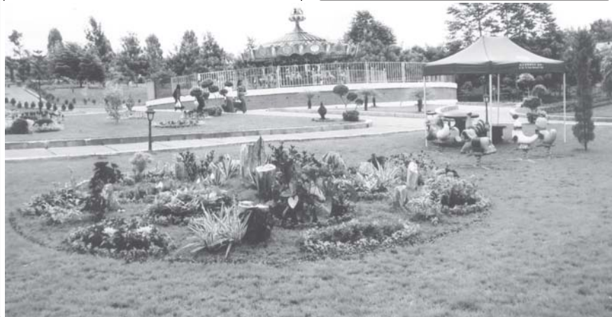
ပြင်ဦးလွင် အမျိုးသားကန်တော်ကြီး ဥယျာဉ်ရှိ ကလေးကစားကွင်းကို တွေ့ရစဉ်။

အမျိုးသားကန်တော်ကြီးဥယျာဉ်အတွင်း ကျောက်တောင်ပုံ ဥယျာဉ်အဝင်ဝတွင်ရှားပါးသောကျောက်ဖြစ်ရုပ်ကြွင်း၊အင်ကြင်းကျောက်တိုင်ကြီးနှစ်တိုင် စိုက်ထူကာ ပေအရှည် ၆၂၀ရှိလျှောက်လမ်းအတိုင်းကျောက်ကပ်ပန်းများ၊ အပင်များ၏ အလှကို ကြည့်ရှုခံစားနိုင်မည့်အပြင် ဥယျာဉ်အတွင်းသဘာဝရေတက်ရွှံ့ညွှန်တောတွင် လူသွားစက်လမ်းအတိုင်း သဘာဝပေါက်ပင်ကြီးများ၊ နွယ်ပင်များ၊ ဆေးဖက်ပင်အပင်များနှင့် ရွှံ့ညွှန်များကို တွေ့မြင်နိုင်ကြမည်။