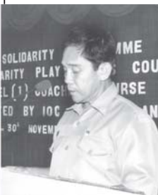
အတည်ပြုချိန် ၂၄၅