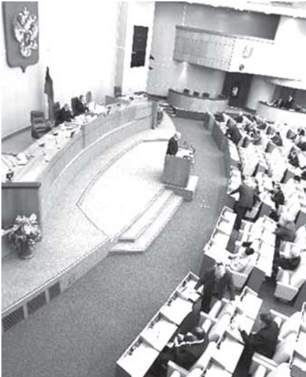
ရုရှားနိုင်ငံ၏ ဒူးမားလွတ်တော် သမ္မတသက်တမ်း တိုးမြှင့်ရန် နိုဝင်ဘာ ၂၁ ရက်က ဆုံးဖြတ်ချက် ချမှတ်နေသည်ကို တွေ့ရစဉ်။