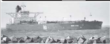
ပြန်ပေးဆွဲခံရသည့် ဆော်ဒီ ရေနံတင်သင်္ဘော ဆိုဟယ်တွင် ဆိုက်ကယ်။ (နိုင်ငံတကာသတင်း) စာမျက်နှာ-၆