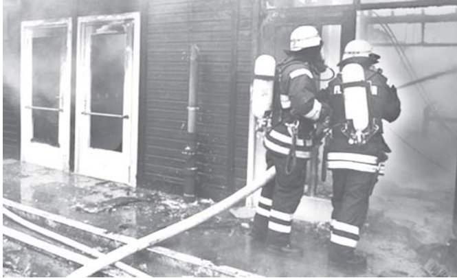
ဂျာမနီနိုင်ငံ ဘာလင်မြို့၊ တီဂါလ်လေဆိပ်တွင် စီးလောင်မှုဖြစ်ပွားရာ ဖြစ်သတ်နေသော စီးသတ်တပ်ဖွဲ့ဝင်နှစ်ဦးအား နိုင်ငံဘာ ၂၀ ရက်က တွေ့ရစဉ်။ (ဓာတ်ပုံ-အင်တာနက်)

ရှန်ဟိုင်း နိုင်ငံဘာ ၂၀ တရုတ်နိုင်ငံ ရှန်ဟိုင်းမြို့မှ ကမ္ဘောဒီးယားနိုင်ငံ ဖန္ဒမ်းပင်မြို့သို့ ပျံသန်းနေသော ခရီးသည် ၁၄၉ဦး လိုက်ပါလာသည့် ရှန်ဟိုင်းလေကြောင်းလိုင်းမှ ဘိုးရင်း-ဂျာဂျ လေယာဉ်သည် နိုင်ငံဘာ ၁၉ ရက်က တရုတ်နိုင်ငံ ဟိုင်နန်ကျွန်း၌ အရေးပေါ်ဆင်းသက်ခဲ့ရသည်။ လေယာဉ်ခရီးစဉ်အမှတ် အက်မ်အမ်-၈၃၃ သည် ပျံသန်းနေစဉ် အတွင်း နံနက်၁၁နာရီ ၂၂မိနစ်အချိန်ခန့်တွင် စက်ချွတ်ယွင်းမှု ဖြစ်ပေါ်လာသောကြောင့် ဟိုင်ကွမ်မြို့ရှိ မိလန်အပြည်ပြည်ဆိုင်ရာ လေဆိပ်တွင် အရေးပေါ် ဆင်းသက်ခဲ့ရသည်။ လေယာဉ်အတွက် ဆီပိုလွတ်ပေးသော ပန်အပိုင်းတွင် ချွတ်ယွင်းနေကြောင်း၊ လေယာဉ်မောင်းခန်းတွင် အချက်ပြမီးလင်းလာသဖြင့်လေယာဉ်အဖွဲ့သားများ နိုးနိုးကြားကြား ဖြစ်ခဲ့ရသည်ဟု ပြောနေဆဲခွင့်ရှိသူက ပြောကြားသည်။ ယခုအရေးပေါ်ဆင်းသက်ရသည့်ကိစ္စတွင် ခရီးသည်