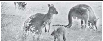
သားပိုက်ကောင်များသည် လူများနှင့် မျိုးပီချင်း နီးစပ်သည်ကိုတွေ့ရှိ။ (နိုင်ငံတကာသတင်း) စာမျက်နှာ-၅

မြန်မာတို့သည် အမျိုးကို စောင့်ရှောက်သူများဖြစ်ကြပြီး ခေတ်သမိုင်းအဆက်ဆက်တွင် ဝံသာနုရက္ခိတ တရားကို လက်ကိုင်ထားကာ ထိန်းသိမ်းမြှင့်တင်နိုင်ခဲ့ကြသူများ ဖြစ်သည်။