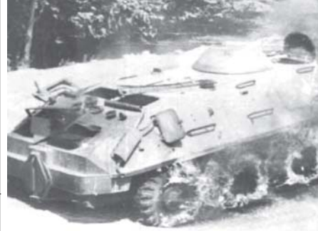
အာဖဂန်နစ္စတန်နိုင်ငံ တောင်ပိုင်းဒေသတွင် ဗုံးထိမှန်သွားသော သံချပ်ကာယာဉ်တစ်စီးကို တွေ့ရစဉ်။

လုပ်ရားနေကြောင်း စစ်ဘက်က ပြောကြားသည်။ အင်တာနက်။