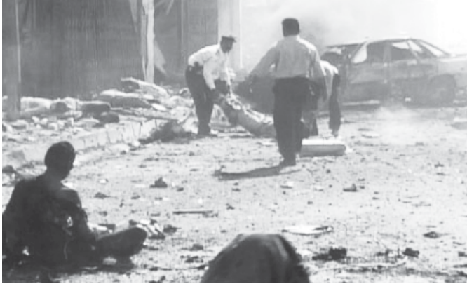
အီရတ်နိုင်ငံ နာဂုတ်မြို့တွင် ဖြိုပေါက်ကွဲသဖြင့် ဒဏ်ရာရရှိသွားသော အရပ်သားတစ်ဦးကို အီရတ်ရဲတပ်ဖွဲ့ဝင်များက ကယ်ဆယ်နေကြစဉ်