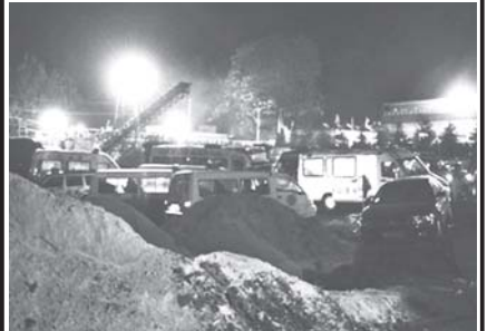
ဟိနန်ပြည်နယ် ပင်ဒင်ရှန်မြို့ရှိ ကျောက်မီးသွေးတွင်း မတော် တဆမှု ဖြစ်ပွားရာ ဂိုမန်ခေါင်မိုင်းတွင်းကို ညအချိန်၌ တွေ့ရစဉ်။

ယင်းလျှင်လှုပ်မှုကြောင့် ဂိုဏ်းတာလုံခြုံရေးနှင့် အိမ်များ၊ ကျောင်းများအပါအဝင် အဆောက်အအုံ ၈၀၀ခန့်နှင့် တံတားတစ်စင်း ပြိုကျပျက်စီးခဲ့ကြောင်း ဝန်ကြီးဌာနမှတာဝန်ရှိသူက ပြောကြားသည်။ (အပေါ်) အဆိုပါ လျှင်လှုပ်မှုသည် ညသန်းခေါင်ယံအချိန်က ဂိုဏ်းတာလုံ ခြုံ အနောက်မြောက်ဘက် ၁၃၈ကီလိုမီတာအကွာ၌ဖဟိုမြို့နယ် မြေအောက် ကီလိုမီတာ ၁၀ အကွာတွင် လှုပ်သွားကြောင်း နှိုင်းလေဝေဌာနက ပြောကြားသည်။ အင်တာနက်