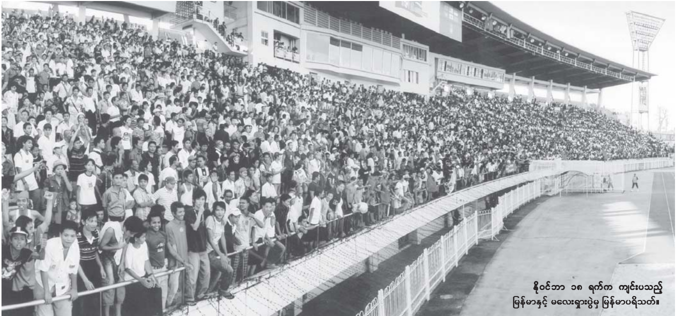
နိုင်ငံတော် ၁၈ ရက်က ကျင်းပသည့် မြန်မာနှင့် မလေးရှားပွဲမှ မြန်မာပရိသတ်။