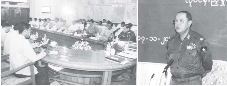
ဆက်သွယ်ရေး၊ စာတိုက်နှင့်ကြေးနန်းဝန်ကြီးဌာန ဝန်ကြီး ဗိုလ်မှူးချုပ်သိန်းဇော် ဆက်သွယ်ရေး၊ စာတိုက်နှင့် ကြေးနန်းဝန်ကြီးဌာန၏ ၂၀၀၈ ခုနှစ် လုပ်ငန်းညှိနှိုင်းအစည်းအဝေးတွင် အမှာစကားပြောကြားစဉ်။ (ဆက်သွယ်ရေး)