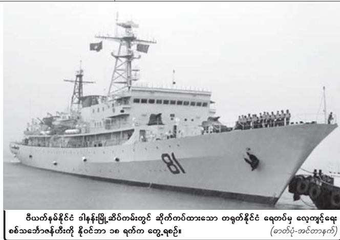
ဗီယက်နမ်နိုင်ငံ ခါနန်းမြို့ဆိပ်ကမ်းတွင် ဆိုက်ကပ်ထားသော တရုတ်နိုင်ငံ ရေတပ်မှ လေ့ကျင့်ရေး စစ်သင်္ဘောဇန်တီးတို့ နိုဝင်ဘာ ၁၈ ရက်က တွေ့ရစဉ်။

ယင်းတံတားကို အိန္ဒိယနှင့်ပါကစ္စတန်နှစ်နိုင်ငံအား ခွဲထားသည့်နယ်စပ် အနီးတွင် တည်ဆောက်နေခြင်းဖြစ်သည်။ အင်တာနက်