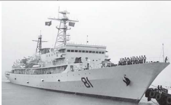
ဗီယက်နမ်နိုင်ငံ ခါနန်းမြို့ဆိပ်ကမ်းတွင် ဆိုက်ကပ်ထားသော တရုတ်နိုင်ငံ ရေတပ်မှ လေ့ကျင့်ရေး စစ်သင်္ဘောဇန်တီးတို့ နိုဝင်ဘာ ၁၈ ရက်က တွေ့ရစဉ်။