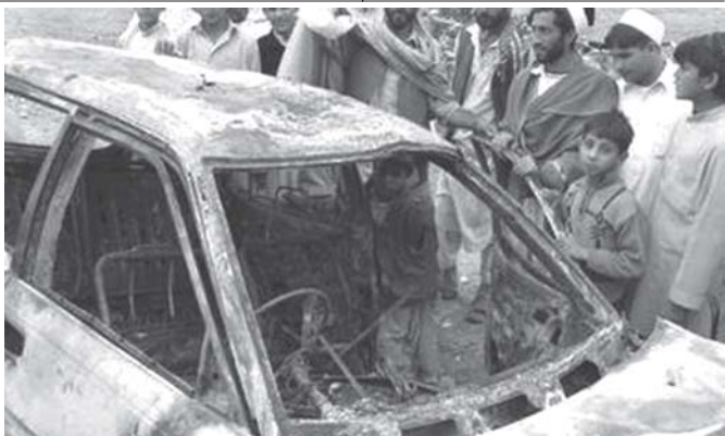
အာဖဂန်နစ္စတန် နိုင်ငံ အရှေ့ပိုင်းတွင် အသေခံဗုံးဖြင့် တိုက်ခိုက်မှုကြောင့် ပျက်စီးသွားသည့် ယာဉ်အနီး၌ အရပ်သားများ ကြည့်ရှုနေသည်ကို နိုဝင်ဘာ ၁၃ ရက်က တွေ့ရစဉ်။