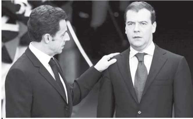
ဥရောပသမဂ္ဂနိုင်ငံများ ဆွေးနွေးပွဲမကျင်းပမီ ပြင်သစ်သမ္မတ နီတိ(၆)(၁)က ရုရှားသမ္မတ ဒီမီထရီမက်ဗီဒက်စ်အား ကြိုဆိုနှုတ်ဆက်နေသည်ကို နိုဝင်ဘာ ၁၄ ရက်က တွေ့ရစဉ်။