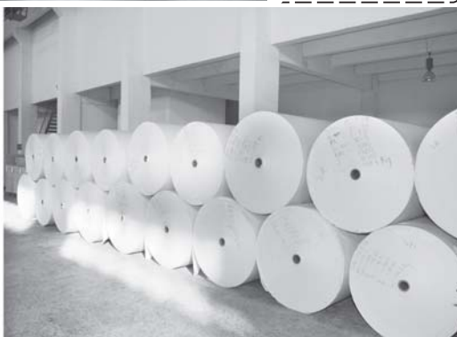
အတည်ပြုချိန် ၂၄၄

၁၃၇၀ ပြည့်နှစ်၊ တန်ဆောင်မုန်းလပြည့်ကျော်(၁၀)ရက် (၂၂-၁၁-၂၀၀၈)