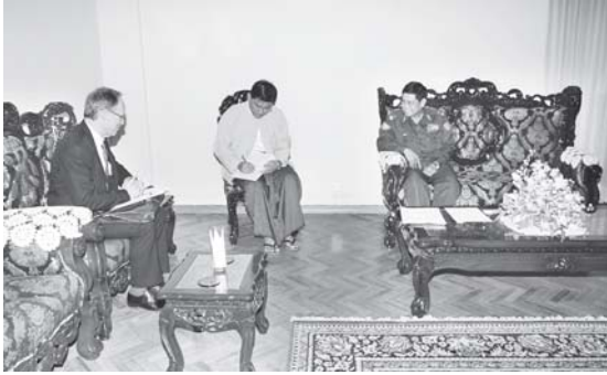
လယ်ယာ စိုက်ပျိုးရေးနှင့် ဆည်မြောင်းဝန်ကြီးဌာန ဝန်ကြီးဗိုလ်ချုပ်ဌေးဦးအား ထိုင်းနိုင်ငံ ဗန်ကောက်မြို့အခြေစိုက် ဆိုင်နိုင်ငံသံရုံးမှ သံမှူးကြီး Mr.Benet Ekman လာရောက် တွေ့ဆုံရန်။ (သတင်းစဉ်)