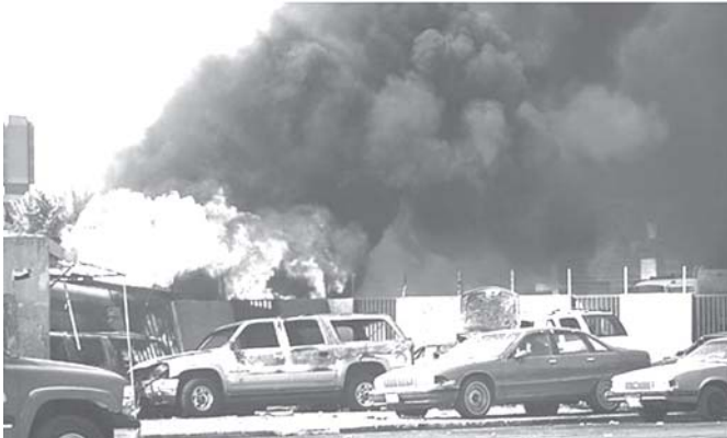
အီရတ်နိုင်ငံ ဘဂ္ဂဒတ်မြို့တွင် လောင်စာဆီယာဉ်ဖြင့် အသေခံ တိုက်ခိုက်မှုကြောင့် မီးလောင်ပျက်စီးနေသော အဆောက်အအုံနှင့် ယာဉ်များကို တွေ့ရစဉ်။ (ဓာတ်ပုံ-အင်တာနက်)

ဘဂ္ဂဒတ် နိုဝင်ဘာ ၁၅ အီရတ်နိုင်ငံ မြို့တော်အတွင်း နိုဝင်ဘာ ၁၅ရက်က ဝံ့ပေါက်ကွဲမှု