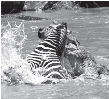
မက်ဆိုင်မာရာ သဘာဝသစ်တောကြီးတိုင်းအတွင်း မာရာမြစ်ကိုဖြတ်ကူးလာသည့် မြင်းကျောက် မိခရောင်က သတ်ပုတ်နေသည်ကို နိုဝင်ဘာ ၁၃ ရက်က တွေ့ရစဉ်။