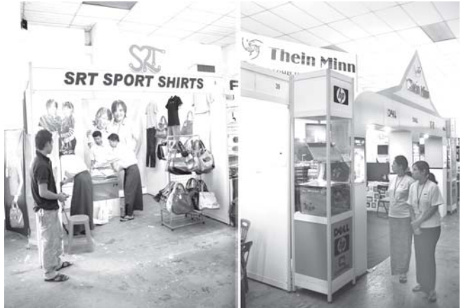
ကွန်ပျူတာသုံး ဆက်စပ်ပစ္စည်းများ၊ လူသုံးကုန်ပစ္စည်းများကိုလည်း ပြသထားသည်။

ရှိသည်။ ထိုသို့ဆောင်ရွက်ရာတွင် ယာဉ်မောင်းများ၊ ယာဉ်ပိုင်ရှင် များနှင့်ခရီးသွားပြည်သူများ ယာဉ် စည်းကမ်း၊ လမ်းစည်းကမ်းများကို သိရှိလိုက်နာနိုင်ရန် လက်တွေ့ အရေးယူဆောင်ရွက်မှုများ ရှိသလို သို့ အသိပညာပေးပြပွဲ၊ ဖြိုင်ပွဲများ အခါအားလျော်စွာကျင်းပ၍ ယာဉ် အန္တရာယ် ကင်းဝေးစေရန် အသိ ပညာပေးဆောင်ရွက်လျက်ရှိသည်။ ရန်ကုန်မြို့၊ ဦးစိစာရလမ်းရှိ တပ်မတော်ခန်းမတွင် စတုတ္ထ အကြိမ် ယာဉ်စည်းကမ်း၊ လမ်းစည်း ကမ်း၊ မြှင့်တင်ရေး အသိ ပညာပေးပြပွဲ၊ ဖြိုင်ပွဲကို နိုဝင်ဘာ ၁၀ ရက်မှစ၍ ကျင်းပလျက်ရှိရာ ယာဉ်မောင်းများ၊ ယာဉ်စီးနင်းသူ ပြည်သူများ ကျောင်းသား၊ ကျောင်းသူများအနေဖြင့် အသိ