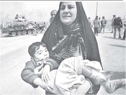
ပစ်ခတ်တိုက်ခိုက်မှုများမှ ဝေးရာသို့ ပြေးနေရသော မိခင်နှင့် ကလေးငယ်တို့ကို အီရတ်နိုင်ငံ နင်နီးဗားဒေသတွင် တွေ့ရရန် (ဓာတ်ပုံ-အင်တာနက်)