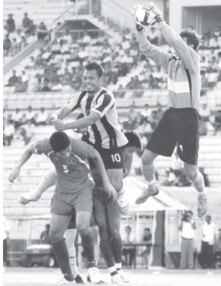
မလေးရှားအသင်း၏ ဂိုးသွင်းမှုကို ဗီယက်နမ်နောက်တန်းနှင့် ဂိုးသမားတို့ တကွတည်းစုံပုံ