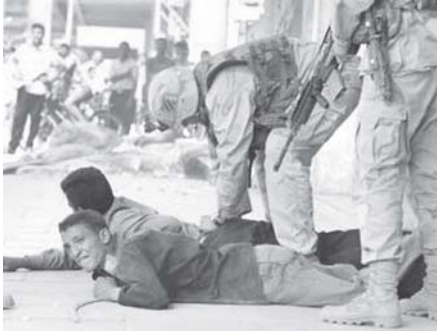
အီရတ်နိုင်ငံ မာမူတ်ဒီယာ အရပ်တွင် မသတ်ဖွယ်ရာ အရပ်သားများကို အမေရိကန် တပ်ဖွဲ့ဝင်များ ဖမ်းဆီးနေ သည်ကို တွေ့ရရန်