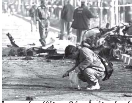
အာဖဂန်နစ္စတန်နိုင်ငံ ကဏ္ဍမြို့၌ နေထိုင်သူများ၏ ယာဉ် တန်းအား အသေခံကာလုံးဖြင့် တိုက်ခိုက်မှုဖြစ်ပွားသည့်နေရာကို အာဖဂန်တပ်ဖွဲ့များစစ်ဆေးနေစဉ်။

အုပ်စုမှအဖွဲ့ဝင်များသည် လွန်ခဲ့သော နှစ်နှစ်ခန့်က ဘက်ပြောင်းလာကြသော သူပုန်ဗဟင်းများ ဖြစ်ကြသည်။ ထိုသို့တို့၏ ဘက်ပြောင်းမှုသည် အီရတ်နိုင်ငံအတွင်း အကြမ်းဖက်မှု များ လျော့ပါးသွားရခြင်း၏အကြောင်း အရင်းများမှ အချက်တစ်ခုဖြစ်သည် ဟု ယုံကြည်ရသည်။ အင်တာနက်