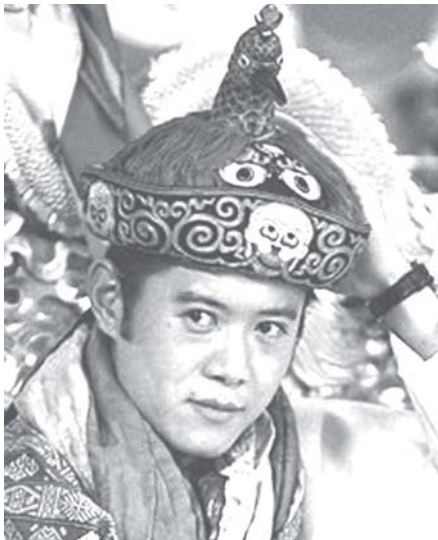
ကမ္ဘာ့အသက်အငယ်ဆုံးဖြစ်သော အသက် ၂၈ နှစ် အရွယ်၌ ဘုရင်နိုဝင်၏ ငါးဆက်မြောက်ဘုရင် ဂျင်မီကီဆာနွမ်ဝမ်ချပ်အား နိုဝင်ဘာ ၇ ရက်က တွေ့ရစဉ်။

ပထမကမ္ဘာစစ်ကြီး ပြီးဆုံးပြီးသည့်နောက် အသက်ရှင်ကျန်ရစ်ခဲ့သူ စစ်ပြန်စစ်မှုထမ်းဟောင်း ငါးဦးရှိသည့်အနက်မှ တစ်ဦးဖြစ်သူ ဆစ်ဒနီမော့ရစ် လူကပ်စ်သည် အသက်၁၀၈ နှစ်အရွယ်တွင် ကွယ်လွန်သွားခဲ့ပြီဟု သက်ဆိုင်ရာ က ကြေညာသည်။ ၎င်းကို ၁၉၀၀ ပြည့်နှစ် စက်တင်ဘာ ၂၁ ရက်တွင် လက်ဆစ်တောမြို့ ၌ မွေးဖွားသည်။ ၁၉၁၈ ခုနှစ်တွင် စစ်ထဲဝင်ခဲ့သည်။ ဒုတိယကမ္ဘာစစ်အတွင်း ကလည်း အခက်အခဲအမျိုးမျိုးကို ကျော်လွှားလွတ်မြောက်နိုင်ခဲ့သည်။ ၁၉၂၈ ခုနှစ်က ဩစတြေးလျနိုင်ငံ မဲလ်ဘုန်းမြို့သို့ ပြောင်းရွှေ့နေထိုင်ပြီး ထိုအိမ်၌ပင် နိုဝင်ဘာ ၄ ရက် အရောက်၌ ကွယ်လွန်ခဲ့ခြင်းဖြစ်သည်။ ၁၉၄၀ ပြည့်နှစ်တွင် ဩစတြေးလျစစ်တပ်သို့ အပျော်သဘောဖြင့် ဝင်ရောက်ခဲ့ပြီး စက်သေနတ်တပ်ဖွဲ့တွင် တာဝန်ထမ်းဆောင်ခဲ့သည်။ ထို့နောက် ပါလက်စတိုင်းသို့ ထွက်ခွာခဲ့သည်။ ထိုမှတစ်ဆင့် ဩစတြေးလျ တပ်ဖွဲ့ဝင်များ နှင့် ဂရိနိုင်ငံသို့ ခန့်ထွက်ရန်ပြင်ဆင်သော်လည်း အတောက်ပေါက်သဖြင့် ဂျာမနီ နှင့် အီတလီသို့လည်းမသွားနိုင်ခဲ့ပေ။ ထို့ကြောင့် ၁၉၄၁ခုနှစ်တွင်ဩစတြေးလျ သို့ပြန်လာခဲ့ရသည်။ သူ့၏ဘဝတစ်လျှောက်လုံးတွင် အရက်ကို အနည်းငယ် သာ သောက်သုံးခြင်းဖြင့် အသက်ရှည်အောင် နေထိုင်နိုင်ခဲ့သည်ဟုဆိုသည်။ အင်တာနက်၊