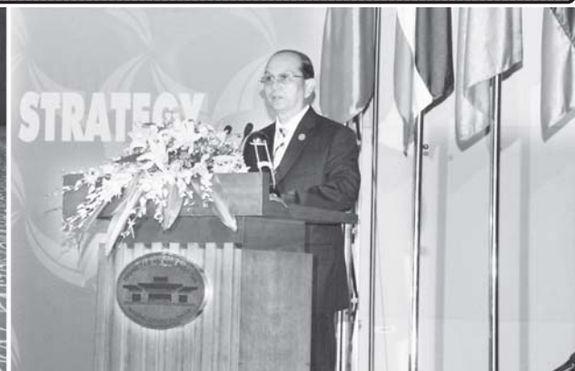
နေပြည်တော် နိုဝင်ဘာ ၉

ပြည်ထောင်စုမြန်မာနိုင်ငံတော်-နိုင်ငံတော်ဝန်ကြီးချုပ် ဗိုလ်ချုပ်ကြီး သိန်းစိန်သည် နိုဝင်ဘာ ၇ ရက် နံနက် ၉ နာရီတွင် ဗီယက်နမ်ဆိုရှယ်လစ် သမ္မတနိုင်ငံ တန်းဇီးမြို့ National Convention Centre ရှိ အခန်းအမှတ်(၂၄၁)၌ ကျင်းပသည့် တတိယအကြိမ် ဧရာဝတီ-ကျောက်မရား-မဲခေါင် စီးပွားရေးပူးပေါင်းဆောင်ရွက်မှု မဟာဗျူဟာ (ACMECS) ထိပ်သီးအစည်းအဝေး ဖွင့်ပွဲအခမ်းအနားသို့ တက်ရောက်၍ မိန့်ခွန်းပြောကြားသည်။