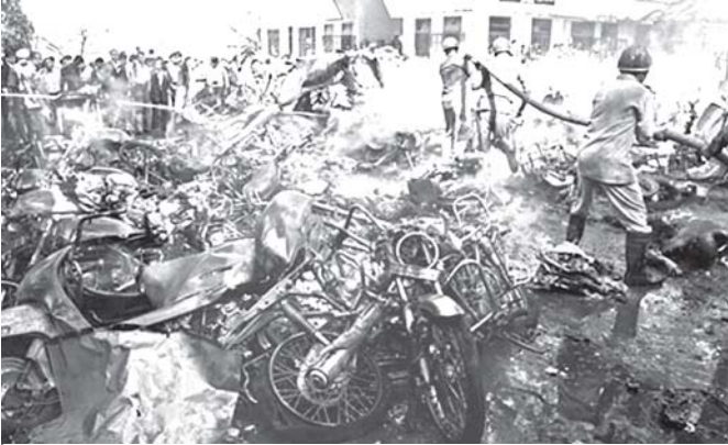
အီရတ်နိုင်ငံ ၇၀၀လက်မသေရီ လူစစ်ကားသောနေရာများတွင် ပုံပေါက်ကွဲမှုများဖြစ်ပွားခြင်းကြောင့် မီးလောင်ပျက်စီးနေသည့် ယာဉ်များအား တာဝန်ရှိသူများက မီးငြိမ်းသတ်နေစဉ်