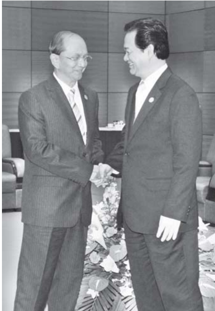
နိုင်ငံတော်ဝန်ကြီးချုပ် ဗိုလ်ချုပ်ကြီးသိန်းစိန် တတိယအကြိမ် ရောဝတီ-ကျောက်ဖရား-မဲခေါင် စီးပွားရေးပူးပေါင်းဆောင်ရွက်မှု မဟာဗျူဟာ (ACMECS) ထိပ်သီးအစည်းအဝေး ဖွင့်ပွဲအခမ်းအနားသို့ တက်ရောက်လာရာ ဗီယက်နမ်ဆိုရှယ်လစ်သမ္မတနိုင်ငံ ဝန်ကြီးချုပ် မစ္စတာငုယင်တန်ဇွန်း ကြိုဆိုနှုတ်ဆက်စဉ်။ (သတင်းစဉ်)

ထို့စဉ်က အက်မက်စ် စီးပွားရေးပူးပေါင်းဆောင်ရွက်မှု မဟာဗျူဟာတွင် နယ်ပယ်ဝါးချစ်သော ကုန်သွယ်ရေးနှင့် ရင်းနှီးမြှုပ်နှံမှု လွယ်ကူချောမွေ့စေ