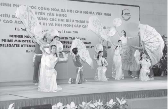
အတည်ပြုချိန် ၂၁၅