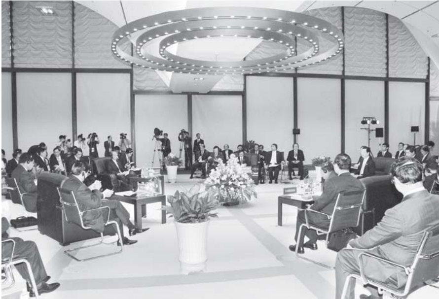
နိုင်ငံတော်ဝန်ကြီးချုပ် ပိုလ်ချုပ်ကြီးသိန်းစိန် ဗီယက်နမ်ဆိုရှယ်လစ်သမ္မတနိုင်ငံ တန့်လင်းမြို့ National Convention Centre ၏ အခန်းအမှတ်(၃၃၉)၌ ကျင်းပသည့် တတိယအကြိမ် ရောဂတ်-ကျောက်ဖရား-မဲခေါင် စီးပွားရေးပူးပေါင်းဆောင်ရွက်မှု မဟာဗျူဟာ ထိပ်သီးဆွေးနွေးပွဲသို့ တက်ရောက်စဉ်။ (သတင်းစဉ်)

ပြည်ထောင်စုမြန်မာနိုင်ငံတော်-နိုင်ငံတော်ဝန်ကြီးချုပ် ပိုလ်ချုပ်ကြီးသိန်းစိန်သည် နိုဝင်ဘာ ၇ ရက် နံနက် ၉ နာရီ ၄၅ မိနစ်တွင် ဗီယက်နမ် ဆိုရှယ်လစ်သမ္မတနိုင်ငံ တန့်လင်းမြို့ National Convention Centre ၏ အခန်းအမှတ် (၃၃၉)၌ ကျင်းပသည့် တတိယအကြိမ် ရောဂတ်-ကျောက်ဖရား-မဲခေါင် စီးပွားရေးပူးပေါင်းဆောင်ရွက်မှု မဟာဗျူဟာထိပ်သီးဆွေးနွေးပွဲသို့ တက်ရောက်သည်။