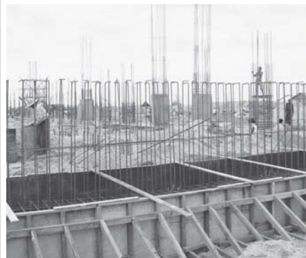
အတည်ပြုချိန် ၂.၁၅