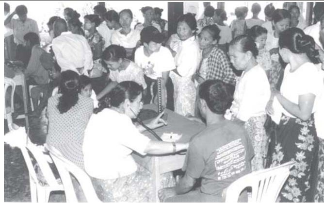
ရန်ကုန်မြို့တော် စည်ပင်သာယာရေးကော်မတီ ကျန်းမာရေးဌာန ရန်ကုန်မျက်စိ အထူးကုဆေးရုံကြီးမှ သွားဘက်ဆိုင်ရာတက္ကသိုလ်(ရန်ကုန်)တို့မှ ဆရာဝန်ကြီးများ ကွမ်းခြံကုန်းမြို့နယ်ရှိ ကျေးရွာများမှ ပြည်သူများအား အခမဲ့ ကျန်းမာရေးစောင့်ရှောက်မှုလုပ်ငန်းများ ဆောင်ရွက်ပေးစဉ်။ (မြို့တော်စည်ပင်)