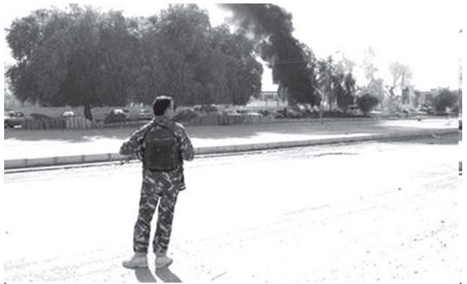
အီရတ်နိုင်ငံ အရှေ့မြောက်ပိုင်း ဘာကူးဘားဒေသတွင် တားဆီးပေါက်ကွဲရာနေရာမှ ဖမ်းဆီးလုံးများ တက်လာသည်ကို နိုင်ငံသာ ၃ ရက်က တွေ့ရရန်။

တာလီဘန် စစ်သွေးကြွတို့နှင့် တိုက်ခိုက်မှုများ တိုးပွားလာပြီး စစ်ဒဏ်ကြောင့် ပျက်စီးနေသည့် အာဖဂန်နစ္စတန်နိုင်ငံတွင် အမေရိကန်တပ်ဖွဲ့ဝင်ပေါင်း ၃၃၀၀၀ ခန့် ဖြန့်ထားကြောင်း သတင်းဌာနဖော်ပြ ထားသည်။ အစ်အင်အေဆင်ယွာ။