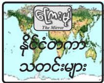
မြန်မာနိုင်ငံတကာ သတင်းများ

ပုံကွဲမှုဖြစ်စဉ်တစ်ခုတွင် ဒုတိယ ရေဒီဝန်ကြီး ဆာဟစ်ဆော်လ်မန်က အနည်းငယ် ဒဏ်ရာရရှိသွားသည်။ ပုံနှိပ်လုံးပေါက်ကွဲမှုကြောင့် ဒဏ်ရာ ရရှိသူများတွင် ရဲတပ်ဖွဲ့ဝင် ၁၀ ဦး လည်း ပါဝင်သည်။ ပုံနှိပ်လုံးမှာ လူစည်ကားသော ကာရာဒါခရိုင်တွင် ပေါက်ကွဲခဲ့ပြီး ဈေးဆိုင်အများ အပြား ပျက်စီးသွားသည်။ အခြားပုံနှိပ်လုံး မှာ အနီးကပ်ပုံနှိပ်စက် ဖွက်ထားခြင်း ဖြစ်သည်ဟု တာဝန်ရှိသူတစ်ဦးက ပြောကြားသည်။ အင်တာနက်။