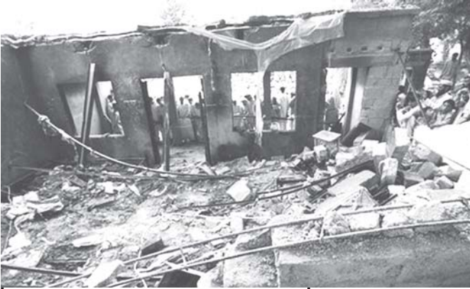
အမေရိကန်ဦးကျည်ဟု ယူဆရသော နှုံးဖြင့် ပစ်ခတ်မှု ခံရခြင်းကြောင့် ဖျက်စီးသွားရသော ပါကစ္စတန်နယ်စပ်ဒေသရှိ အဆောက်အအုံ တစ်ခုကို အောက်တိုဘာ ၃၁ ရက်က တွေ့ရစဉ်။