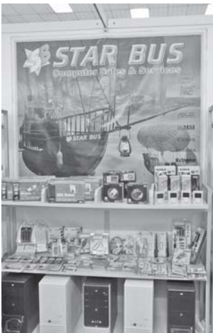
STAR BUS Computer Sales & Services ပြခန်းအတွင်း ခင်းကျင်းပြသထားသော ကွန်ပျူတာနှင့် ဆက်စပ်ပစ္စည်းများကို တွေ့ရစဉ်။

ပြောင်းလဲတိုးတက်နေသော သတင်းအချက်အလက်နှင့်ဆက်သွယ်ရေးနည်းပညာခေတ်ကြီးတွင် ခေတ်မီဆက်သွယ်ရေး ပစ္စည်းများမှတစ်ဆင့် ကမ္ဘာ့အခြေအနေ အရပ်ရပ်ကို စက္ကန့်မလပ် သိရှိနေရသဖြင့် ကမ္ဘာကြီးသည် ရွာကြီးသဖွယ်ဖြစ်လာကြောင်း သုံးသပ် ပြောဆိုလာကြသည်။ ထိုကဲ့သို့သော နည်းပညာခေတ်ကြီးတွင် နိုင်ငံတကာနှင့်အမီ ရင်ပေါင်တန်း လိုက်နိုင်ရန်အတွက် မြန်မာနိုင်ငံ ကွန်ပျူတာအသင်းချုပ်နှင့် ကွန်ပျူတာအသင်းများဖွဲ့စည်းခြင်း (၁၀)နှစ်မြောက် အထိမ်းအမှတ်အဖြစ် သတင်းအချက်အလက်နှင့် ဆက်သွယ်ရေးနည်းပညာပြပွဲ (၂၀၀၈)ကို ရန်ကုန်မြို့ ဦးစိစာရလမ်းရှိ တပ်မတော်ခန်းမ၌ အောက်တိုဘာ ၃၁ ရက်မှစ၍ခင်းကျင်းပြသလျက်ရှိရာ မြန်မာနိုင်ငံ၏ ICT နည်းပညာ ဖွံ့ဖြိုးတိုးတက်မှုများ ထင်ဟပ်ပေါ်လွင်လာပေသည်။