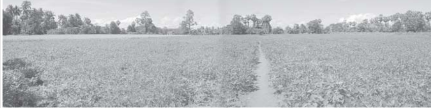
လှိုင်းဘွဲ့မြို့နယ် ရွှေဂွန်း နှင့် ပဲပုပ်စိုက်ခင်းအား တွေ့ ရစဉ်။

တည်ငြိမ်အေးချမ်း သာယာ လာသည် နှင့်အမျှ ဤဒေသ ၏ ဖွံ့ဖြိုးတိုးတက် မှုက တစ်ချိန်တည်း ပြောင်းလဲလာလျက် ရှိ မြဝတီမြို့၌လည်း အစေ့ထုတ် မြောင်း ကို အသုံးပြုသော အီသနော စက်ရုံ တည် ဆောက် ရန် စီမံ ဆောင်ရွက် လျက်ရှိ။