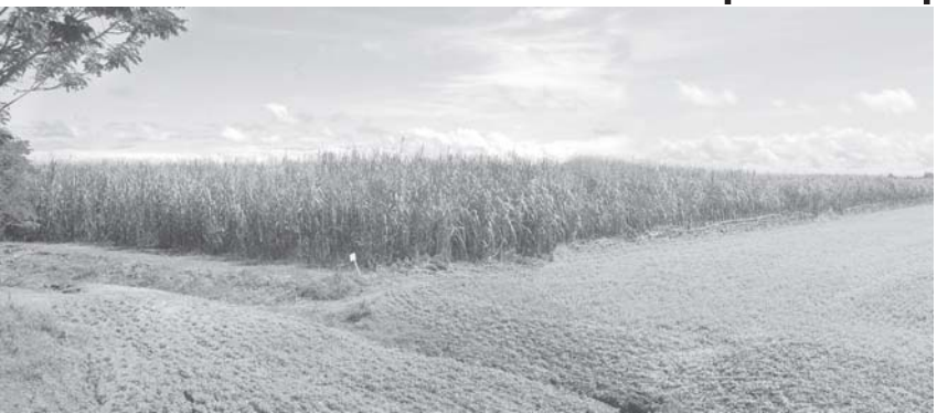
စိုက်ပျိုးနိုင်ခဲ့ပါတယ်”ဟု ရှင်းလင်း ပြောကြားသည်။ မြေပဲစိုက်ဧက ပိုမိုအောင်မြင် ဖြစ်ထွန်းလာသည်နှင့်အမျှ ယခင်က

ကြံစိုက်ခင်း လှိုင်းဘွဲ့မြို့နယ် ရွှေဂွန်း နှင့် ကြံစိုက်ခင်းအား တွေ့ ရစဉ်။