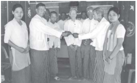
ရန်ကုန်တောင်ပိုင်းခရိုင် ဝေလျှံနယ် စစ်မှုထမ်းဟောင်းအဖွဲ့မှခန်း၌ အောက်တိုဘာ ၂၂ ရက်က အသက်(၇၅)နှစ်အထက် စစ်မှုထမ်းဟောင်း အဖွဲ့ဝင် တစ်ဦးလျှင် ငွေကုန်နှစ်သောင်းစီ ထောက်ပံ့ပေးအပ်ရာ ပြုန့်ယူ စစ်မှုထမ်းဟောင်းအဖွဲ့ဝင်တို့က အကဲခတ်ပေးသည့် အနုပညာပေးပွဲ (မြို့နယ်စာပေနှင့်စာနယ်ဇင်း)