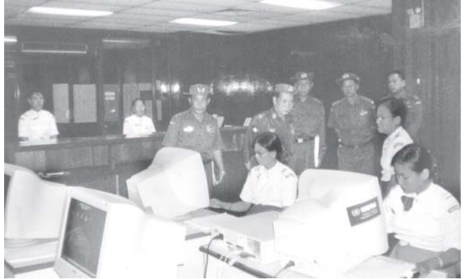
လူဝင်မှုကြီးကြပ်ရေးနှင့် ပြည်သူ့အင်အားဝန်ကြီးဌာန ဝန်ကြီး ဗိုလ်ချုပ်စောလွင် ရန်ကုန်မြို့ရှိ ပြည်သူ့အင်အား ဦးစီးဌာန၌ ကြည့်ရှုစစ်ဆေးစဉ်။ (သတင်းစဉ်)