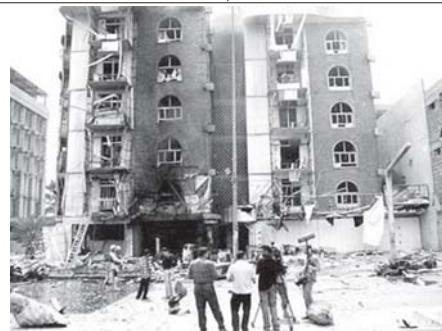
အီရတ်နိုင်ငံ ဘဂ္ဂဒတ်တွင် ဗုံးပေါက်ကွဲမှုဖြစ်ပွားသွားသောနေရာကို တွေ့ရစဉ်။

တီဟီရန် အောက်တိုဘာ ၂၇ အီရန်နိုင်ငံတောင်ပိုင်းတွင်ရစ်ချီတာ စကေး ၅ အဆင့်ရှိ ငလျင်တစ်ခု လှုပ်မှုကြောင့် ကိုးဦး ဒဏ်ရာရရှိကြောင်းအီရန်နိုင်ငံတာဝန်ရှိသူတစ်ဦးက ပြောကြားသည်။ အဆိုပါငလျင်သည် ကောင်ဆိပ်ကမ်းမြို့တွင် အောက်တိုဘာ ၂၇ ရက် ညနေပိုင်းက လှုပ်ခဲ့ကြောင်း တိုမိုဇာဂ်ပြည်နယ် အရေးခေါ်ဌာန ညွှန်ကြားရေးမှူးက ပြောကြားသည်။ ပါရန်စလယ်ကျွန်းကမ်းရိုးတန်းဒေသရှိ ကောင်မြို့သည် တီဟီရန်မြို့တောင်ဘက် မိုင် ၉၃၀ ခန့် အကွာ၌တည်ရှိပြီး လူဦးရေ ၁၅၀၀၀ ခန့် နေထိုင်သည်။ အင်တာနက်။