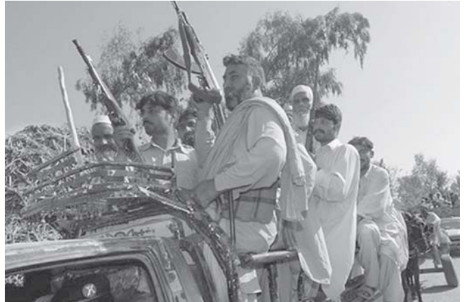
တာလီဘန်တို့အား ချွမ်းရိုးရန် ပါကစ္စတန်အစိုးရတပ်နှင့် လက်ကွဲသည်။ ဖျီနယ်စု လက်နက်ကိုင်များကို တွေ့ရစဉ်။