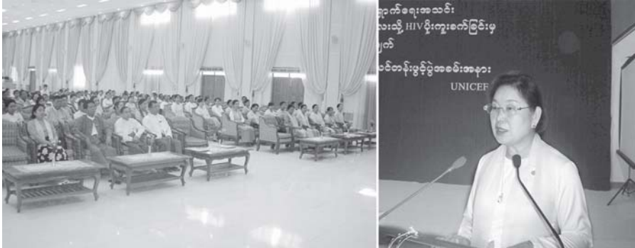
မြန်မာနိုင်ငံ မိခင်နှင့်ကလေး စောင့်ရှောက်ရေးအသင်းဥက္ကဋ္ဌ ဒေါ်ခင်စောနုက ပြည်သူလူထုအခြေပြု ကိုယ်ဝန်ဆောင်မိခင်မှ ကလေးသို့ HIV ပိုး ကူးစက်ခြင်းမှ ကာကွယ်ရေးစီမံချက် ပဏာမအဆင့် အသိပေးဆွေးနွေးခြင်းနှင့် ဆရာပြစ်သင်တန်းဖွင့်ပွဲတွင် အမှာစကားပြောကြားစဉ်။ (သတင်းစဉ်)

တို့က အသိပေးဆွေးနွေးကြကာ တက်ရောက်လာသူများ၏ သိရှိလိုသည့် မေးမြန်းချက်များကို ပြန်လည်ဖြေကြားဖြည့်ပြီး အစီအစဉ် ဒုတိယပိုင်းကို ဖွင့်လှစ်ပွင့်လင်းတွင် ရုပ်သိမ်းလိုက်သည်။ အဆိုပါသင်တန်းသို့ စီမံချက်ဝင် ပြည်နယ်နှင့်တိုင်းများမှ သင်တန်းသား သင်တန်းသူ ၄၀ တက်ရောက်ကြပြီး သင်တန်းကာလမှာ အောက်တိုဘာ ၃၁ ရက်အထိဖြစ်ကြောင်း သတင်းရရှိသည်။ (သတင်းစဉ်)