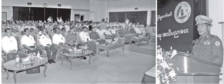
ရန်ကုန်တိုင်း အေးချမ်းသာယာရေးနှင့် ဖွံ့ဖြိုးရေးကောင်စီဥက္ကဋ္ဌ၊ ရန်ကုန်တိုင်းစစ်ဌာနချုပ် တိုင်းမှူး ဗိုလ်မှူးချုပ်ဝင်းမြင့် ရန်ကုန်တိုင်း ယာဉ်စည်းကမ်းထိန်းသိမ်းရေး ကြီးကြပ်မှုကော်မတီ၏ ဂုဏ်ထူးဆောင် ယာဉ်စည်းကမ်း၊ လမ်းစည်းကမ်းမြှင့်တင်ရေး အသိပညာပေး စာတမ်းဖတ်ပွဲ ဖွင့်ပွဲအခမ်းအနားတွင် အမှာစကား ပြောကြားစဉ်။

ရန်ကုန် အောက်တိုဘာ ၂၇ ရန်ကုန်တိုင်း ယာဉ်စည်းကမ်းထိန်းသိမ်းရေး ကြီးကြပ်မှုကော်မတီ၏ ဂုဏ်ထူးဆောင် ယာဉ်စည်းကမ်း၊ လမ်းစည်းကမ်းမြှင့်တင်ရေးအသိပညာပေးစာတမ်းဖတ်ပွဲတွင် ရန်ကုန်မြို့၊ ပြည်လမ်း၌ အပြည်ပြည်ဆိုင်ရာစီးပွားရေးလုပ်ငန်းဗဟိုဌာနနှင့်အညီ ရန်ကုန်တိုင်းအေးချမ်းသာယာရေးနှင့် ဖွံ့ဖြိုးရေးကောင်စီဥက္ကဋ္ဌ၊ ရန်ကုန်တိုင်းစစ်ဌာနချုပ် တိုင်းမှူး ဗိုလ်မှူးချုပ်ဝင်းမြင့် တက်ရောက်၍ အမှာစကား ပြောကြားပြီး စာတမ်းဖတ်ပွဲကို ဖွင့်လှစ်ပေးသည်။