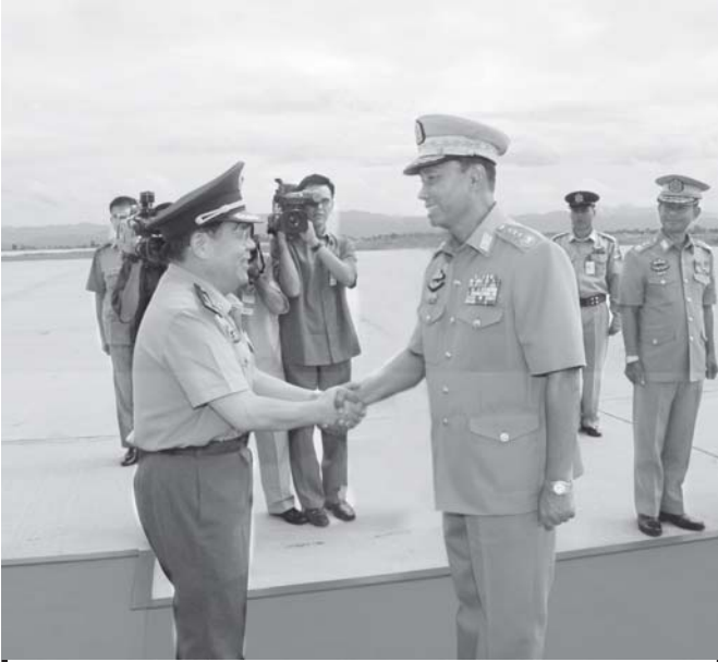
နိုင်ငံတော် အေးချမ်းသာယာရေးနှင့် ဖွံ့ဖြိုးရေးကောင်စီဝင်၊ ကာကွယ်ရေးဝန်ကြီးဌာနမှ ဗိုလ်ချုပ်ကြီးသူရရွှေမန်း တရုတ်ပြည်သူ့သမ္မတနိုင်ငံ တရုတ်ပြည်သူ့လွတ်မြောက်ရေး တပ်မတော်မှ Deputy Chief of General Staff, General, Zhang Li အား နေပြည်တော်လေဆိပ်တွင် ကြိုဆိုနှုတ်ဆက်စဉ်။ (သတင်းစဉ်)