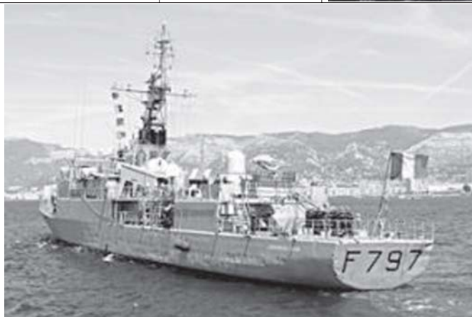
ဆိုမာလီရေပြင်တွင် ကင်းလှည့်နေသော ပြင်သစ်ရေတပ် သင်္ဘောတစ်စင်းကို တွေ့ရစဉ်။