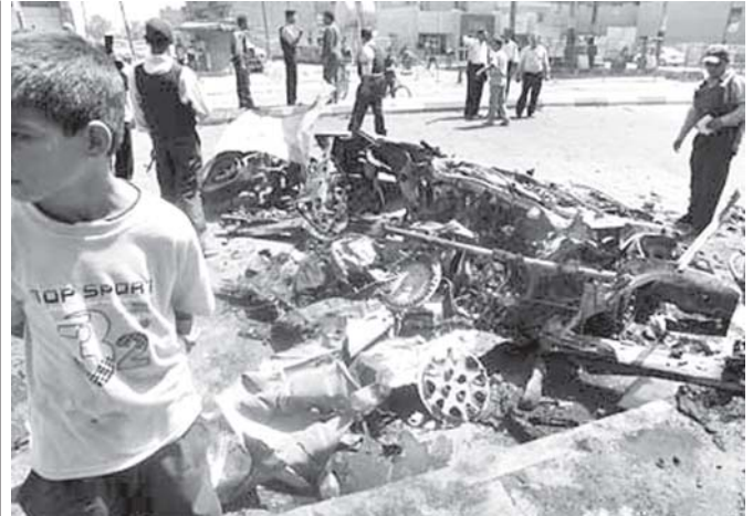
အီရတ်နိုင်ငံ ဘဂ္ဂဒတ်တွင် ကားဗုံးပေါက်ကွဲမှု ဖြစ်ပွားရာ အပျက်အစီးများကို တွေ့ရစဉ်။