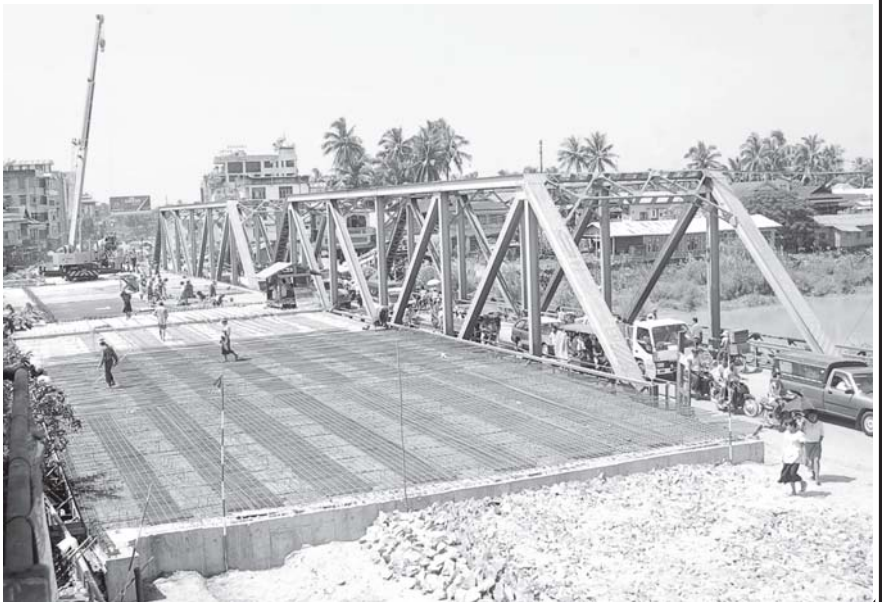
အသစ်တည်ဆောက်ပြီးစီးတော့မည့် သုံးလမ်းသွား ပဲခူးမြစ်ကူးတံတားကြီးကိုတွေ့ရစဉ်။

သတင်းအောင်းပါးနှင့်ဓာတ်ပုံ-ဉာဏှာ (သတင်းစဉ်)