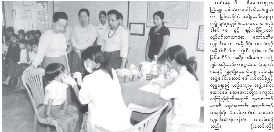
အတည်ပြုချိန် ၃း၀၀

ရန်ကုန် အောက်တိုဘာ ၂၇ မြန်မာနိုင်ငံအမျိုးသမီးရေးရာအဖွဲ့ချုပ် စီမံရေးရာဌာနကြီး၊ မြန်မာ့နေရာဌာနကြီးနှင့် လူမှုရေးနှင့် ယဉ်ကျေးမှုလုပ်ငန်းအဖွဲ့တို့ ပူးပေါင်းဆောင်ရွက်သည့် အသိပညာပေးဟောပြောပွဲကို ယနေ့နံနက်ပိုင်းတွင် ရန်ကုန်မြို့၊ မြောက်ဥက္ကလာပမြို့နယ်၊ ဧရာဝတီလမ်းရှိ အမှတ်(၄၈) အခြေခံပညာမှလတန်းလွန်ကျောင်း၌ ကျင်းပသည်။