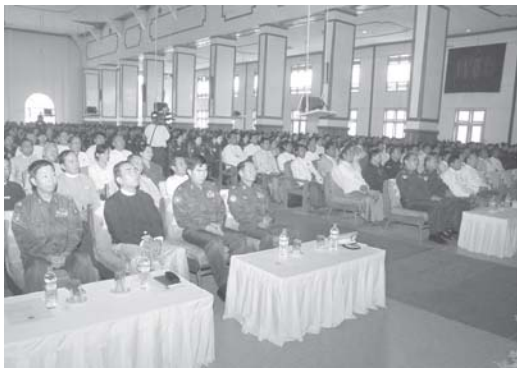
နေပြည်တော် အောက်တိုဘာ ၂၇