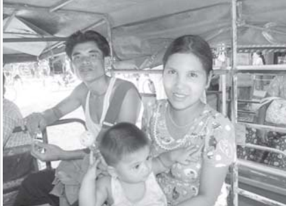
တံတားကြီး ပြီးသွားရင် သွားရေး လာရေးသာ တော့ ကျွန်တော်တို့ဈေးလဝယ်ရတာ ပိုကောင်းသွားတာပေါ့။”

ထိုတံတားကို ၂၀၀၇ ခုနှစ် မေလတွင် စတင်တည်ဆောက်ခဲ့ပြီး တံတားကြီး၏ အမျိုးအစားမှာ သံကွက်နံရံ(ဘိုးပိုင်) အမျိုးအစား ဖြစ်သည်။ ခြောက်လမ်းသွား တံတားကြီးတစ်ခုလုံး၏ အလျားအလျှားမှာ ၃၆၀ ခုရှိသည်။ ယာဉ်သွားလမ်း၏ အကျယ်မှာ ၇၂ မေ ဖြစ်သည်။ လူသွားလမ်းအကျယ်မှာ တစ်ဖက်လျှင် (၆) ပေခွင့် တံတား၏ ခွင်ပြု အလေးချိန်မှာ တန် ၆၀ ဖြစ်သည်။ ယခု တည်ဆောက်နေသော သုံးလမ်းသွား တံတားတည်ဆောက်နေမှုမှာ ခုနစ်ဆယ့်ငါး ရာခိုင်နှုန်းခန့် ပြီးစီးနေပြီဖြစ်၍ ၂၀၀၈ ခုနှစ် ဒီဇင်ဘာလ၌ အပြီးတည်ဆောက်သွား