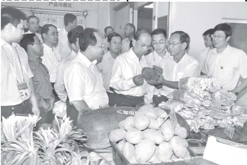
နိုင်ငံတော်ဝန်ကြီးချုပ် ဗိုလ်ချုပ်ကြီးသိန်းစိန် တရုတ်ပြည်သူ့သမ္မတနိုင်ငံ နန်းမြို့ရှိ ပါကော့စီကွမ်မင်းကျွမ်းအတွင်း မစ္စတာချန်ဒွေမင်းနှင့် ဟင်းသီးဟင်းရွက်များကို ကြည့်ရှုလေ့လာစဉ်။ (သတင်းစဉ်)