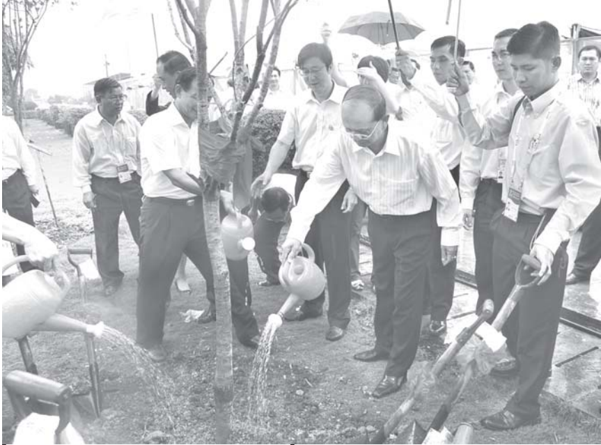
နိုင်ငံတော်ဝန်ကြီးချုပ် ဗိုလ်ချုပ်ကြီးသိန်းစိန် တရုတ်ပြည်သူ့သမ္မတနိုင်ငံ နန်းမြို့ရှိ ပါကော့စီကွမ်မင်းကျွမ်းအတွင်း ပန်းအလှပင်ကို အမှတ်တရ စိုက်ပျိုးပေးစဉ်။ (သတင်းစဉ်)

ယင်းနောက် နိုင်ငံတော်ဝန်ကြီးချုပ်နှင့် ညွှန်ကြားရေးမှူးချုပ် Mr. Zhang Ming Pei တို့သည် လက်ဆောင်ပစ္စည်းများကို အပြန်အလှန် ပေးအပ်ကြသည်။ (သတင်းစဉ်)