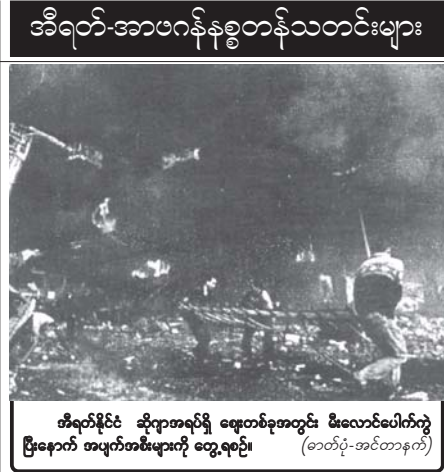
အီရတ်နိုင်ငံ ဆိုဂျာအရပ်ရှိ မြေတစ်ခုအတွင်း မီးလောင်ပေါက်ကွဲ ပြီးနောက် အပျက်အစီးများကို တွေ့ရစဉ်။

၎င်းဝန်ကြီးဌာနက ဆင်ဟွာသတင်း ဌာနသို့ ပြောကြားသည်။ ဝန်ကြီး၏ သက်တော်စောင့်သုံးဦး သေဆုံးပြီး လေးဦး ဒဏ်ရာရရှိခဲ့ ကြောင်း ယင်းဝန်ကြီးဌာနက ပြောကြားသည်။ ဗိုလ်ချုပ်မှူးကြီး ပြင်းထန်သည့် အတွက် ယာဉ်တန်းမှ ကားနှစ်စီးနှင့် ရဲကားတစ်စီး၊ အရပ်သားကား သုံးစီး တို့လည်း ပျက်စီးခဲ့ကြောင်း ယင်း ဝန်ကြီးဌာနက ပြောကြားသည်။ တိုက်ခိုက်မှုဖြစ်ပွားစဉ် ယာဉ်တန်း ၌ ဝန်ကြီးမပါရှိကြောင်း ၎င်းက ပြောကြားသည်။ အင်တာနက်