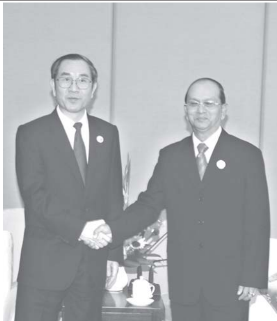
နိုင်ငံတော်ဝန်ကြီးချုပ် ဗိုလ်ချုပ်ကြီးသိန်းစိန်အား တရုတ်ပြည်သူ့သမ္မတနိုင်ငံ ကွမ်ရီးကျွန်း ကိုယ်ပိုင်အုပ်ချုပ်ရေးဒေသ အုပ်ချုပ်ရေးမှူး မစ္စတာ မာပြောင်း နန်နင်းမြို့ လီယွမ်ဟိုတယ် ဧည့်ခံရသောအမှတ်(၁၇) ဧည့်ခန်းမ၌ ရင်းရင်းနှီးနှီး နှုတ်ဆက်စဉ်။ (သတင်းစဉ်)

ထိုသို့ ဂါရုပြု တွေ့ဆုံရာတွင် နိုင်ငံတော်ဝန်ကြီးချုပ် ဗိုလ်ချုပ်ကြီးသိန်းစိန်နှင့်အတူ ကာကွယ်ရေးဝန်ကြီးဌာနမှ ဗိုလ်ချုပ်မောင်ရှိန်၊ အမျိုးသားစီမံကိန်းနှင့် စီးပွားရေးဖွံ့ဖြိုးတိုးတက်မှုဝန်ကြီးဌာန ဝန်ကြီး ဦးစိုးသာ၊ စီးပွားရေးနှင့် ကူးသန်းရောင်းဝယ်ရေးဝန်ကြီးဌာန ဝန်ကြီး ဗိုလ်မှူးချုပ်တင်နိုင်သိန်း၊ သတ္တုတွင်းဝန်ကြီးဌာန ဝန်ကြီး ဗိုလ်မှူးချုပ် အုန်းမြင့်၊ အမှတ်(၁) လျှပ်စစ်စွမ်းအားဝန်ကြီးဌာန ဝန်ကြီး ဗိုလ်မှူးကြီး ဇော်မင်း၊ စာမျက်နှာ ၈ ကော်လံ ၁ သို့