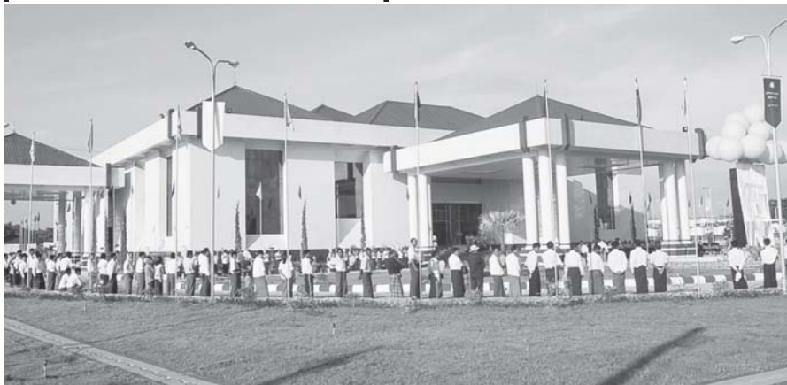
နေပြည်တော် အောက်တိုဘာ ၂၃

နိုင်ငံတော် အေးချမ်းသာယာရေးနှင့် ဖွံ့ဖြိုးရေးကောင်စီ အတွင်းရေးမှူး(၁) ဒုတိယဗိုလ်ချုပ်ကြီး သီဟသူရတင်အောင်မြင့်ဦး သည် ယနေ့ နံနက် ၈ နာရီတွင် ကျင်းပသည့် မြဝတီဘဏ် လီမိတက်(နေပြည်တော်) ဘဏ်အဆောက်အအုံသစ်နှင့် ဘဏ် ဖွင့်ပွဲအခမ်းအနားသို့ တက်ရောက်အားပေး ချီးမြှင့်သည်။