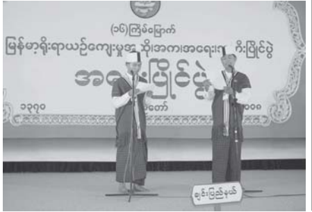
အတည်ပြုချိန် ၄၀၀၀

၂၀၀၈ခုနှစ် အကြိမ်(၄၀)မြောက် မာမေးကား မိတ်ခေါ်ဘောလုံးပြိုင်ပွဲကို ယနေ့ညပိုင်းတွင် မလေးရှားနိုင်ငံ ကွာလာလမ်ပူမြို့၌ဆက်လက်ကျင်းပသည်။ ပြိုင်ပွဲ၏ဒုတိယအကြိမ်လုပ်ငန်းစဉ် မြန်မာအသင်းနှင့် မလေးရှားအသင်း တို့ ယှဉ်ပြိုင်ကစားကြရာ မလေးရှားအသင်းက လေးဂိုး-ဝိုးမရှိဖြင့် အနိုင်ရရှိပြီး ခိုလ်လွှဲသို့တက်ရောက်သွားကြောင်း သတင်းရရှိသည်။ (သတင်းစဉ်)