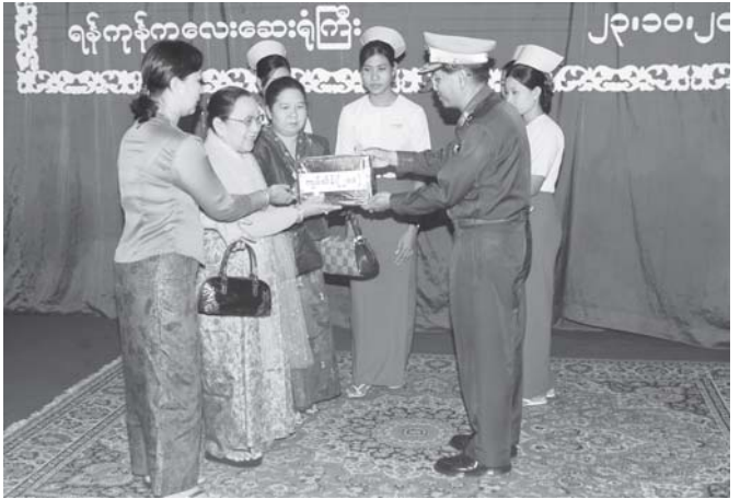
အတည်ပြုချိန် ၄၀၀၀