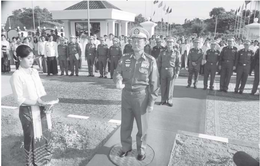
အတည်ပြုချိန် ၄၀၀