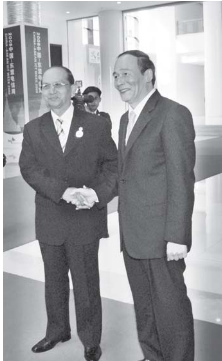
နိုင်ငံတော်ဝန်ကြီးချုပ် ဗိုလ်ချုပ်ကြီးသိန်းစိန် တရုတ်ပြည်သူ့သမ္မတ နိုင်ငံ ဒုတိယဝန်ကြီးချုပ် မစ္စတာ ဝမ်ကျိရှန်အား ကွမ်ရှီးကျွမ်းကိုယ်ပိုင် အုပ်ချုပ်ရေးဒေသ နန်နင်းမြို့ရှိ လီယွမ်ဟိုတယ် နိုင်ငံတကာကွန်ဗလင့် ဗဟိုဧည့်ခန်းမ၌ ရင်းနှီးနှီးနှုတ်ဆက်စဉ်။ (သတင်းစဉ်)