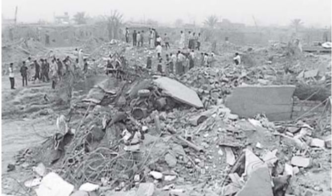
ဘဂ္ဂဒတ်မြို့၊ မြောက်ပိုင်းတွင် အသေခံခဲ့ရသူတို့ကို စုန် ဖြစ်ပြီးနောက် အပျက်အစီးများကို တွေ့ရစဉ်။ (ဓာတ်ပုံ-အင်တာနက်)

ဘဂ္ဂဒတ် အောက်တိုဘာ ၂၂ အီရန်နိုင်ငံ အနောက်တောင်ပိုင်းဒေသတွင် အောက်တိုဘာ ၂၁ ရက်က တိုက်ပွဲပြင်းထန်စွာ ဖြစ်ပွားမှုကြောင့် ၁၅ ဦး သေဆုံးပြီး ၄၀ ဒဏ်ရာရရှိကြောင်း အင်္ဂါနေ့တွင် ပြည်ထောင်စုဝန်ကြီးဌာနက ပြောကြားသည်။ ဘဂ္ဂဒတ်မြို့၊ အနောက်တောင်ဘက် ကီလီမီတာ ၆၀ ခန့်အကွာရှိ ဂျာမီအယ်လ်ဆာဟ်ဟာဒေသအနီး ဘာဘယ်ပြည်နယ်မှ လူများကို အင်ဘာပြည်နယ် အနောက်ပိုင်းရာဇာနီမြို့မှ လူများက တိုက်ခိုက်ခဲ့ရာ သေဆုံးမှုများ ဖြစ်ပွားခဲ့ကြောင်း ယင်းဝန်ကြီးဌာနက ပြောကြားသည်။ အခင်းဖြစ်ပွားမှုကြောင့် အိမ်များနှင့် အရပ်ကားအချို့ ပျက်စီးခဲ့သည်။ အဆိုပါတိုက်ခိုက်မှုအတွင်း ပြည်တွင်းလုံခြုံရေးတပ်ဖွဲ့များ ပါဝင်ခြင်း မရှိသော်လည်း သတိပေးတားမြစ်မှုများ ပြုလုပ်ခဲ့ကြောင်း သိရှိရသည်။ အစ်အင်အေဆင်ဟွာ။