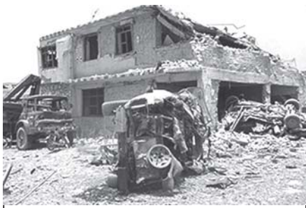
အာဖဂန်နစ္စတန်နိုင်ငံ ကန်ဒါဟာဒေသတွင် ဗုံးပေါက်ကွဲပြီးနောက် ပျက်စီးနေသော အဆောက်အအုံတစ်ခုနှင့် ကားများကို တွေ့ရစဉ်။