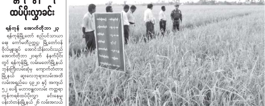
အောက်တိုဘာ ၂၁ ရက်က စွမ်းအင်ဝန်ကြီးဌာန ဝန်ကြီး ဗိုလ်မှူးချုပ်လွန်းသီ တောကျောင်း ကျေးရွာ တွင် Contract Farming စပါးစိုက်ပျိုးအောင်မြင်မြင်ထွန်းနေသော ဆင်းနွယ်ရင် စပါးမျိုးစိုက်ခင်းကို ကြည့်ရှုစစ်ဆေးစဉ်။ (သတင်း-မော်ဂျီမြို့) (စွမ်းအင်)

ရန်ကုန် အောက်တိုဘာ ၂၃ ရန်ကုန်မြို့တော် စည်ပင်သာယာ ရေး ကော်မတီဥက္ကဋ္ဌ၊ မြို့တော်ဝန် ဗိုလ်မှူးချုပ် အောင်သိန်းလင်းသည် အောက်တိုဘာ ၂၀ရက် နံနက်ပိုင်း တွင် ရန်ကုန်မြို့ လမ်းမတော်မြို့နယ် ဘုန်းကြီးလမ်းဆုံမှ ကျောက်တံတား မြို့နယ် ဆူးလေဘုရားလမ်းအထိ လမ်းအရှည်ပေ ၄၉၂၀ နှင့် အကျယ် ၅၂ ပေရှိ မဟာဗန္ဓုလလမ်း ကတ္တရာ ကွန်ကရစ်ထပ်ပိုးလွှာ ခင်းနေမှု၊ ပန်းဘဲတန်းမြို့နယ် ၂၆ လမ်းအလယ် အား ကတ္တရာကွန်ကရစ် ထပ်ပိုးလွှာ ခင်းနေမှုများကို ကြည့်ရှုစစ်ဆေးခဲ့ ကြောင်း သိရသည်။ (အောက်ပုံ) (၁၉)