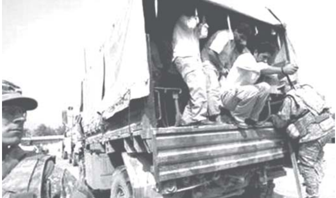
အီရန်နိုင်ငံ ဒီရာခရိုင်တွင် မသင်္ကာဖွယ်ရာ ပြည်သူများအား အမေရိကန်တပ်ဖွဲ့များက ဖမ်းဆီးထားသည်ကို အောက်တိုဘာ ၂၁ ရက်က တွေ့ရစဉ်။ (ဓာတ်ပုံ-အင်တာနက်)

အာဖဂန်နစ္စတန်နိုင်ငံ ကဘူးမြို့မှ ကီလီမီတာ ၄၀ ခန့်အကွာရှိ နိုင်ငံစုံတပ်ဖွဲ့၏ ဘက်ဂရစ်လေယာဉ်ကွင်း၌ အောက်တိုဘာ ၂၁ ရက်က အမေရိကန်ဦးဆောင်သော နိုင်ငံစုံတပ်ဖွဲ့များလိုက်ပါလာသော ရေတပ်ပိုင်း ဝိ-၃ အော်ရီအာနစ် လေယာဉ်ဆင်းသက်စဉ် မီးလောင်သဖြင့် တပ်ဖွဲ့ဝင်တစ်ဦး ဒဏ်ရာရရှိကြောင်း နိုင်ငံစုံတပ်ဖွဲ့က ပြောကြားသည်။ အဆိုပါ ဖြစ်ပွားမှုကြောင့် အမေရိကန်လေယာဉ်အမှုထမ်းတစ်ဦး ဒဏ်ရာရရှိပြီး ဆက်ခံရစ်ဆေးရုံသို့ တင်ပို့ခဲ့ရကြောင်း ထို့အပြင် ယင်းလေယာဉ်ပျက်ကျခြင်းအကြောင်းကို စုံစမ်းစစ်ဆေးလျက်ရှိကြောင်း ၎င်းတို့က ပြောကြားသည်။ အာဖဂန်နစ္စတန်နိုင်ငံအရှေ့ပိုင်း ကုန်းနှင့် ဂါဇာနီပြည်နယ်တို့တွင် အောက်တိုဘာ ၂၀ ရက်က တာလီဘန်နှင့် အယ်လ်ခိုင်ဒါစစ်သွေးကြွများကို ပစ်ခတ်သော စစ်ဆင်ရေးပြုလုပ်ရာ၌ စစ်သွေးကြွလေးဦးအား ဖမ်းဆီးရမိကြောင်း နိုင်ငံစုံတပ်ဖွဲ့က အင်္ဂါနေ့တွင် ပြောကြားသည်။