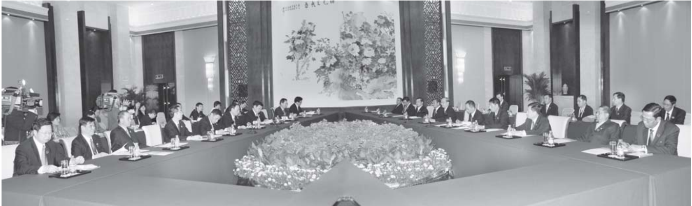
နိုင်ငံတော်ဝန်ကြီးချုပ် ဗိုလ်ချုပ်ကြီးသိန်းစိန်နှင့် တရုတ်ပြည်သူ့သမ္မတနိုင်ငံ ဒုတိယဝန်ကြီးချုပ် မစ္စတာဝမ်ကျိရှန်တို့ ကွမ်ရှီးကျွမ်းကိုယ်ပိုင်အုပ်ချုပ်ရေးဒေသ နန်နင်းမြို့ရှိ လီယွမ်ဟိုတယ် နိုင်ငံတကာ ကွန်ဗလင့် ဗဟိုဧည့်ခန်းမ၌ တွေ့ဆုံဆွေးနွေးကြစဉ်။