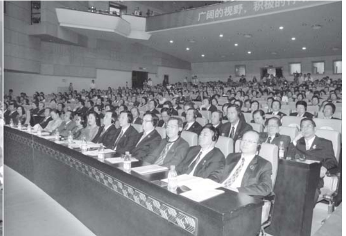
နေပြည်တော် အောက်တိုဘာ ၂၃

ပြည်ထောင်စုမြန်မာနိုင်ငံတော် နိုင်ငံတော်ဝန်ကြီးချုပ် ဗိုလ်ချုပ်ကြီးသိန်းစိန်သည် အောက်တိုဘာ ၂၂ ရက် နံနက် ၁၀ နာရီတွင် တရုတ်ပြည်သူ့သမ္မတနိုင်ငံ တွင်မြို့ကျွန်း ကိုယ်ပိုင်အုပ်ချုပ်ရေးဒေသ နန်နင်းမြို့ရှိ The People's Hall of Guangxi ၌ တွင်းပသည့် (၅)ကြိမ်မြောက် တရုတ်-အာဆီယံ စီးပွားရေးနှင့် ရင်းနှီးမြှုပ်နှံမှု ထိပ်သီးအစည်းအဝေး (The 5th China-ASEAN Business & Investment Summit) သို့ တက်ရောက်၍ မိန့်ခွန်းပြောကြားသည်။