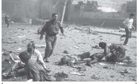
အာဖဂန်နစ္စတန်နိုင်ငံ ကဘူးမြို့တွင် ဗုံးပေါက်ကွဲပြီးနောက် အပျက်အစီးများကို တွေ့ရစဉ်။

ကဘူး အောက်တိုဘာ ၂၂ အာဖဂန်နစ္စတန်နိုင်ငံ တောင်ဘက်နှင့် အရှေ့ဘက်တွင် အမေရိကန်ဦးဆောင်သော နိုင်ငံစုံတပ်ဖွဲ့များနှင့် အာဖဂန်တပ်ဖွဲ့များ ပူးပေါင်း၍ စစ်ဆင်ရေးများ ဆက်တိုက်ပြုလုပ်ရာ တာလီဘန်စစ်သွေးကြွ ဒါဇင်ပေါင်း များစွာ သေဆုံးကြောင်း ဗွဒ္ဓဟူးနေ့တွင် တာဝန်ရှိသူများက ပြောကြားသည်။ အောက်တိုဘာ ၂၁ ရက်က ဟဲလ်မန်ပြည်နယ် နာဂါခရိုင်တွင် နိုင်ငံစုံတပ်ဖွဲ့များ၏ လေကြောင်းတိုက်ခိုက်မှုများကြောင့် တပ်ဖွဲ့ဝင်ဦး အပါအဝင် သူပုန်ဒါဇင်များစွာ သေဆုံးကြောင်း ကာကွယ်ရေးဝန်ကြီးဌာနက ပြောကြားသည်။ အင်္ဂါနေ့က ဟဲလ်မန်ပြည်နယ်တွင် စစ်ယာဉ်တစ်စီး ခိုင်းငံ့ထိမှုနဲ့မူ ကြောင့် အာဖဂန်တပ်ဖွဲ့ဝင်တစ်ဦး ဒဏ်ရာရရှိသည်။ သို့သော်လည်း အမေရိကန်ဦးဆောင်သော နိုင်ငံစုံတပ်ဖွဲ့များ ဗွဒ္ဓဟူးနေ့က ထုတ်ဖော်ပြောကြားရာ၌ စစ်သွေးကြွဒြောက်ဦး သေဆုံးပြီး ခုနှစ်ဦးဖမ်းဆီးရမိသည်ဟုဆိုသည်။ အင်တာနက်။