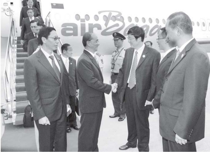
နိုင်ငံတော်ဝန်ကြီးချုပ် ဗိုလ်ချုပ်ကြီးသိန်းစိန် တရုတ်ပြည်သူ့သမ္မတနိုင်ငံ (၅)ကြိမ်မြောက် တရုတ်- အာဆီယံ စီးပွားရေးနှင့် ရင်းနှီးမြှုပ်နှံမှု ထိပ်သီး၊ အစည်းအဝေးသို့ တက်ရောက်ရန် တရုတ်ပြည်သူ့သမ္မတနိုင်ငံ နန်နင်းမြို့၊ နန်နင်းအပြည်ပြည်ဆိုင်ရာ လေဆိပ်သို့ရောက်ရှိလာရာ ကွမ်မင်းကွမ်းကိုယ်ပိုင်၊ အုပ်ချုပ်ရေးဌာနပါမိတ် အမြဲတမ်းကော်မတီဝင် မစ္စတာရင်နီပေဟိုင်နှင့် အဖွဲ့ဝင်များက ကြိုဆိုနှုတ်ဆက်ကြစဉ်။ (သတင်းစဉ်)