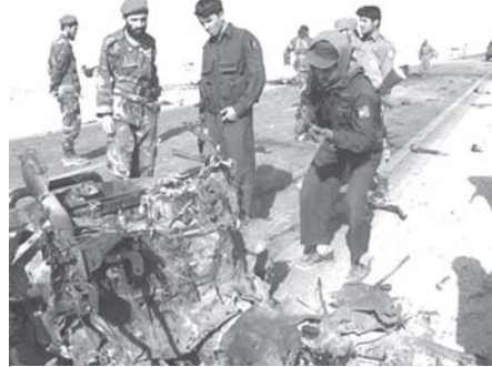
အာဖဂန်နစ္စတန်နိုင်ငံတောင်ပိုင်း ကန်ဒါဟဒေသတွင် နေတိုးတပ်ဖွဲ့ ယာဉ်တန်းအား ငုံ့ဖြိုတိုက်ခိုက်ခံရသောနေရာကို တွေ့ရပုံ။

အရပ်သား တစ်ဦးလည်း ဒဏ်ရာရရှိကြောင်း ထည့်သွင်းပြောကြားသည်။ အာဖဂန်နစ္စတန်နိုင်ငံမြောက်ပိုင်း ကွန်ဒတ်နှင့် ဘာဒက်ရှန်ပြည်နယ် ငြိမ်းချမ်းရေးအတွက် ဂျာမနီတပ်ဖွဲ့ဝင် ၃၇၀၀ခန့် တပ်မြန်ချထားသည်။ အိုင်အက်စ်အေအက်စ် မူဝါဒအရ သေကျေဒဏ်ရာရရှိသူမှာ မည်သည့် နိုင်ငံသားဖြစ်သည်ကို ထုတ်ပြန်ခြင်း မရှိကြောင်း သိရသည်။ အင်အင်အေဆင်ယူာ