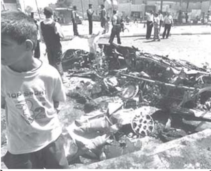
စီရင်စိုင်း တရုတ်မြို့၊ ငုံးပေါက်ကွဲမှု ဖြစ်ပွားသွားသော နေရာကို တွေ့ရပုံ။