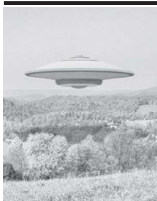
အမျိုးအမည်မသိရသော ပျံသန်းနေသည်။ အရာဝတ္ထုကို ပန်းကန်ပြားပျံဟု ခေါ်သည်။