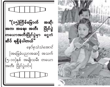
(၁၅)ကြိမ်မြောက် အဆို၊ အက၊ အရေး၊ အတီး ပြိုင်ပွဲ တယောအတီးပြိုင်ပွဲမှာ ငွေတံဆိပ် ရရှိခဲ့ပါတယ်။

စိုက်ပျိုးရေးတက္ကသိုလ် (စုဝေးခန်းမ)သို့အရောက် အဆိုပြိုင်ပွဲဝင်ရန် စောင့်ဆိုင်းနေသည့်ဦးအား မေးမြန်းကြည့်ရာ အဆင့်မြင့်ပညာ(အမျိုးသမီး)