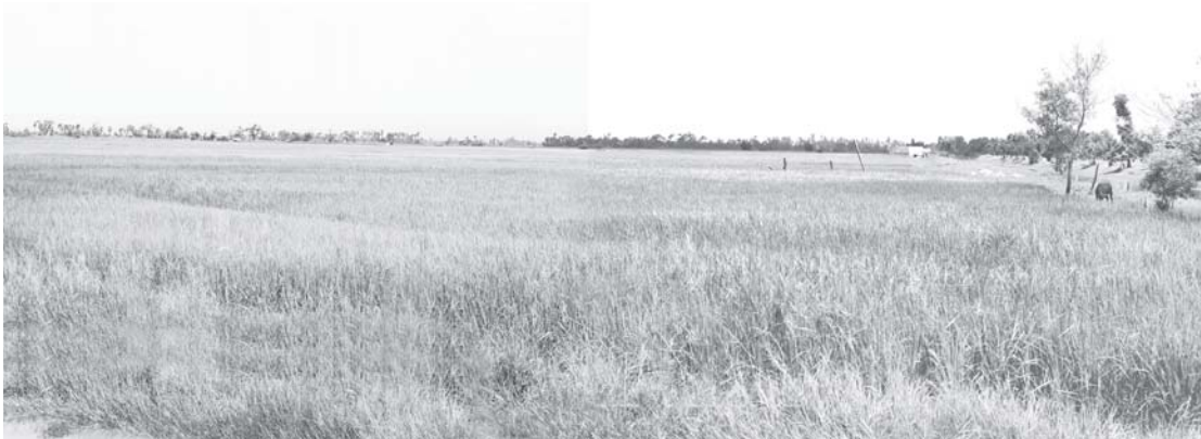
လယ်ဧကမြို့နယ် ရွှေမြစ်ကျေးရွာမှ အောင်မြင်မြစ်ထွန်းနေသော ဝါးခင်းကို တွေ့ရစဉ်။

ရေခန်းအိုးအသွယ်၊ ဖျာခင်းသွင်းဖြင့် ကျွန်တော်တို့လာမှ သူတို့စည်းစိမ်ယုတ်ရချေပြီ။ “ကဆိ... ဆရာကြီးတို့ ဘာကိုစုလဲ” ဟု မေးပြောရာ “ဦးလေးတို့ ရေလုပ်ငန်းတွေ လည်ပတ်နေမှ အခြေအနေကို ပြည်သူတွေကို တင်ပြချင်လို့ လာမေးတာပါ” ဟု ကျွန်တော်က ပြန်ဖြေလိုက်ပါ