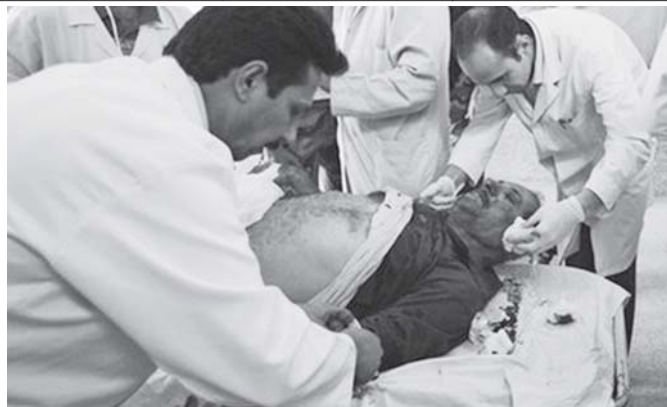
စီရင်စိုင်း တရုတ်မြို့လယ် နက်ဟေးလမ်းတွင် လမ်းဘေးမှ ပေါက်ကွဲမှုကြောင့် ဒဏ်ရာရရှိသွားသူတစ်ဦးအား ကင်ဒီဆေးရုံ၌ အောက်တိုဘာ ၂၀ရက်က တွေ့ရပုံ။

ပါရီ အောက်တိုဘာ ၂၀ စီးပွားရေးပေါင်းဆောင်ရွက်မှုနှင့် ဖွံ့ဖြိုးရေးအဖွဲ့ဝင် (အိုအီးစီဒီ) နိုင်ငံများ၏ လေးပုံသုံးပုံတွင် ချမ်းသာမှုနှင့်ဆင်းရဲမှုကွာဟမှုလွန်ခဲ့သောအနှစ် ၂၀အတွင်း ကြီးထွားလာကြောင်း အိုအီးစီဒီ၏အစီရင်ခံစာတွင် ဖော်ပြထားသည်။ ၁၉၈၀ပြည့်နှစ်များကတည်းကပြင်သစ်၊ဂရိနှင့်စပိန်နိုင်ငံတို့သည် အဆိုပါ ကွာဟချက်ကျဉ်းမြောင်းသော နိုင်ငံအနည်းငယ်မှအချို့ဖြစ်သည်ဟု ပါရီအခြေစိုက်ထားသော အိုအီးစီဒီကပြောကြားသည်။ လွန်ခဲ့သော ငါးနှစ်ကျော်ကာလအတွင်းတွင် ဝင်ငွေမညီမျှမှုနှင့်ဆင်းရဲသော လူဦးရေများပြားလာခြင်းတို့သည် အမေရိကန်ပြည်ထောင်စု၊ ကနေဒါ၊ ဂျာမနီနှင့် နော်ဝေးတို့တွင် အများဆုံးဖြစ်သည်။ ဂရိ မက္ကဆီကိုနှင့်ဗြိတိန်တို့တွင် ဝင်ငွေမညီမျှမှုသည် ကျဉ်းမြောင်းသွားသည်။ အလုပ်လက်ခံမှုများအကြားတွင်လုပ်ငန်းကျွမ်းကျင်မှုနိမ့်ပါးခြင်းနှင့်ပညာမဲ့ခြင်းတို့သည် ဝင်ငွေကွာဟချက်ကြီးမားခြင်း၏ အဓိကအကြောင်းများထဲမှ တစ်ခုဖြစ်သည်။ ပျမ်းမျှအားဖြင့် ဝင်ငွေမညီမျှမှုကို သုံးပုံတစ်ပုံခန့်လျော့ချခြင်းအားဖြင့် အစိုးရ၏အခွန်အကောက်များမှတစ်ဆင့် ဖြန့်ဖြူးခြင်းနှင့်အကျိုးကျေးဇူးများကို ဖြန့်ဝေခြင်းတို့ကို ကာမိစေသည်။ ဝင်ငွေမညီမျှမှုတိုးလာခြင်း၏ အကြီးဆုံးအပိုင်းသည် အလုပ်သမားဈေးကွက်အပြောင်းအလဲ ရှိလာခြင်းကြောင့်ဖြစ်သည်။ ယင်းကိစ္စကို အစိုးရပိုင်းက ဖေးရမည်ဖြစ်သည်ဟု အိုအီးစီဒီအတွင်းရေးမှူးချုပ် အန်ဂျယ်လီဂါနီယာက ကြေညာချက်တွင်ရေးသားထားသည်။ အလုပ်အကိုင်ရရှိမှုတိုးပွားလာခြင်းသည် ဆင်းရဲမှုကို လျော့ချရေးအတွက် အကောင်းဆုံးလမ်းဖြစ်သည်ဟု ၎င်းက ဆိုသည်။ အင်တာနက်