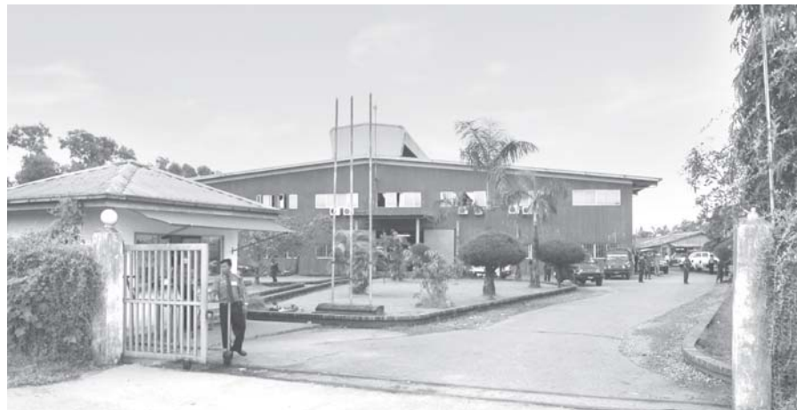
သာကေတမြို့နယ် သာကေတစက်မှုဇုန်ရှိ Jewoo Manufacturing Co.,Ltd. ၏ အထည်ချုပ်လုပ်မှုစက်ရုံကို တွေ့ရစဉ်။ (သတင်းစဉ်)