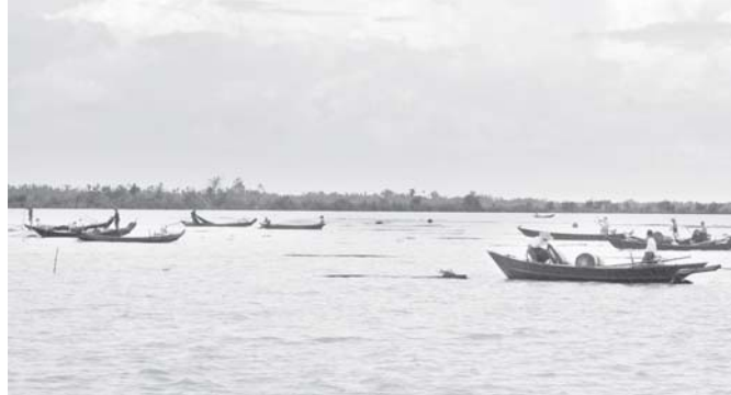
ရွေးမြစ်တစ်လျှောက် ရေလုပ်သားများ ငါးဖမ်းခြင်းကို ပုံမှန်ပြန်လည်ဆောင်ရွက်နေသည်ကို တွေ့ရစဉ်။

ညဉ့်ခင်းရောက်သော် ကျွန်တော်တို့ သည် လယ်ဧကမြို့မှ နှုတ်ဆက်ထွက်ခွာခဲ့ကြပါသည်။ သို့သော် ကျွန်တော်၏ စိတ်အလှူထွက်မှု နိုင်ငံတော် အစိုးရ ပြည်သူနှင့် တပ်မတော်တို့ ပူးပေါင်း၍ ပြန်လည်ထူထောင် တည်ဆောက်ရေးလုပ်ငန်းများကို အောင်မြင်စွာ အကောင်အထည်ဖော် ဆောင်ရွက်နိုင်ခဲ့မှုကြောင့် အဘက်ဘက်မှ ဖွံ့ဖြိုးတိုးတက်လျက်ရှိသည့် စရာဝတ်တိုင်း လေးဘေးသင့် ဒေသများ၏ပုံရိပ်များကိုပြန်လည် မြင်ယောင်လျက်ရှိနေပါတော့သည်။ ။