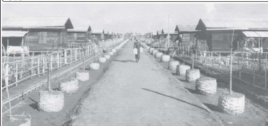
ကြက်လျှာစံပြကျေးရွာ၏ လမ်းများမှာ စနစ်ကျ၍ ရှင်းသန့်လျက်ရှိသည်ကို ဤသို့တွေ့မြင်ရသည်။

အထူးသဖြင့် ကြက်လျှာစံပြကျေးရွာအတွက် အရေးကြီးဆုံးမှာ ရေဖြစ်သည်။ စည်ပင်သာယာရေးဦးစီးဌာနက ရေအတွက် ပူပင်စရာမလိုအောင် ခေတ်မီဆိုလာပြားအသုံးပြုသော လေးလက်မအစီစီစက်ရေတွင်းတူးဖော်၍ စီစဉ်ပေးထားသည်။ ယင်းမှထွက်ရှိသော ရေကို WEG ကုမ္ပဏီမှ လျှပ်မီးထားသော ရေသန့်စက်ဖြင့် သန့်ရှင်းသောသောက်ရေကို ရရှိနေပြီဖြစ်ရာ ကြက်လျှာ ကျေးရွာသူကျေးရွာသားများ စိတ်ချမ်းမြေ့ရွာအလုံအလောက် ခပ်ယုသုံးစွဲနေကြသည်ကိုလည်း တွေ့မြင်ခဲ့ရသည်။ ဤဒေသတွင် သန့်ရှင်းသောသောက်သုံးရေအတွက် ပူပင်စရာမလိုအောင် ဖြည့်ဆည်းနိုင်ခြင်းသည်ပင်လျှင် ဝမ်းသာစရာ မော်လာသတင်း ဖြစ်ပါသည်။