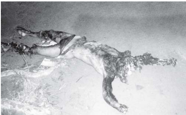
သူများမကောင်းကြံသဖြင့် ကိုယ့်ဘေးဒဏ်ထိခဲ့ရသူ သက်ဦးဝင်း (ခ) ကတိုး၏ ရုပ်အလောင်းအား တွေ့ရစဉ်။