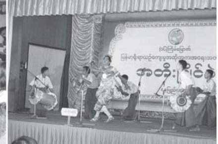
အခြေခံပညာအသက် ၁၅ နှစ်မှ ၂၀ အမျိုးသားဒီပတ် အဖွဲ့လိုက် ပြိုင်ပွဲတွင် စစ်ကိုင်းမှ ဒီပတ်အဖွဲ့ကြွေစွာဖြင့် ယှဉ်ပြိုင်သည်ကို ပရိသတ် များတစ်ခုံနက် လာရောက်အားပေးကြစဉ်။

အသက် (၂၁)နှစ် အောက် တပ်မတော် (ကြည်း၊ ရေ၊ လေ) ဘောလုံးပြိုင်ပွဲ ဆက်လက်ကျင်းပ