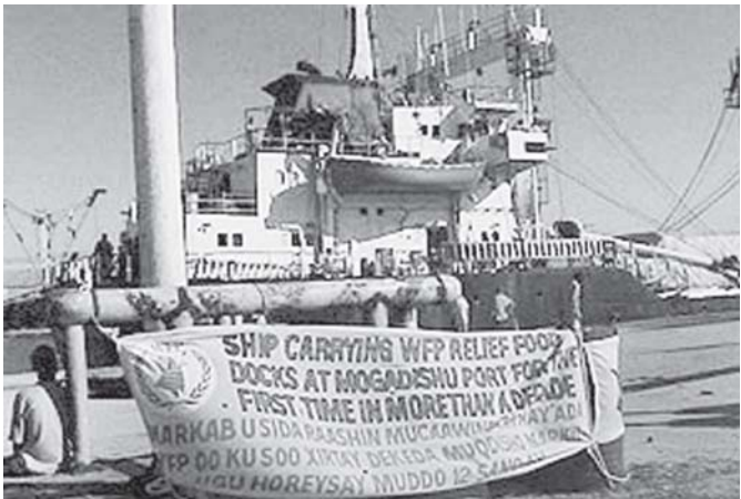
ဆိုမာလီနိုင်ငံသို့ ဝေလူ့အက်စ်ပီမှ စားနပ်ရိက္ခာများ သယ်ယူပို့ဆောင်ပေးသောသင်္ဘောအား မိုဂါဒစ်ရှူး ဆိပ်ကမ်း၌ ဆိုက်ကပ်ထားသည်ကို တွေ့ရပုံ။