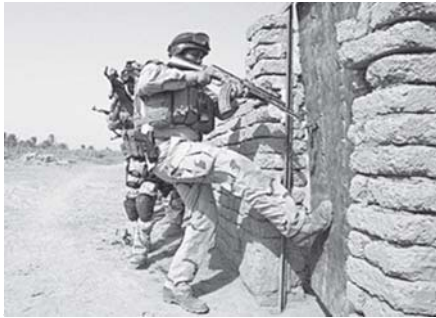
ဘဂ္ဂဒတ်မှ ကီလီမီတာ ၁၅၀ ဝေးသော အယ်လ်တာလီယာ ကျေးရွာတွင် လက်နက်ပုန်းများ ရှာဖွေနေကြသော အီရတ်တပ်ဖွဲ့ဝင် များ အရပ်သား အိမ်တစ်လုံးအတွင်းသို့ အဓမ္မဝင်ရောက်ရန် ကြိုးပမ်း နေကြပုံ။