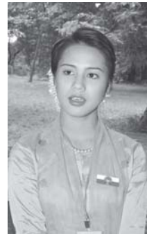
သမီးကအဆိုဝါသနာပါတယ် ဒီနှစ်တော့ ကြိုးစားပြီး ပြိုင်ပွဲဝင် တာအားရလို့ ရွှေတံဆိပ်မှန်းထား ပါတယ်။

အားရလို့ ရွှေတံဆိပ်မှန်းထားပါတယ်။ သမီး ဇာတိက စစ်တွေကပါ။ နောင်နှစ်တွေလည်းဆက်ပြိုင်မှာပါ။"