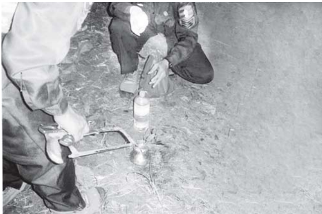
ချိန်ကိုက်ဗုံးလုပ်ထားသည့် အချင်းလေးလက်မခန့်ရှိပြီး အမြင့်ငါးလက်မခန့်ရှိသော ကြေးပန်းအိုးကို တာဝန်ရှိသူများ သက်မဲ့ပြုလုပ်နေကြစဉ်။