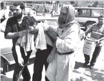
အီရတ်နိုင်ငံ ချူရာခရိုင် ဈေးအနီး ဝေးပေါက်ကွဲမှု ဖြစ်ပွားပြီး နောက် မြင်တွေ့ရပုံ။

အဆိုပါ သဘောတူညီချက်အရ အမေရိကန်တပ်ဖွဲ့ဝင်များသည် ၂၀၁၁ ခုနှစ်အထိ နေထိုင်နိုင်ပြီး အီရတ်အာဏာပိုင်များကလည်း အမေရိကန် တပ်ဖွဲ့ဝင်များကို တရားစွဲဆိုပိုင်ခွင့် ရရှိမည်ဖြစ်သည်။ အင်တာနက်။