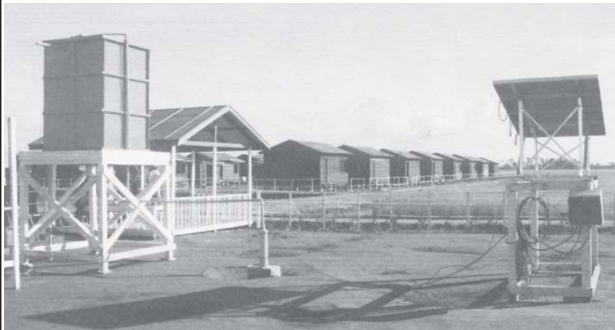
ကြက်လျှာစံပြကျေးရွာတွင် ရေအတွက် ပူပင်စရာမလိုအောင် ခေတ်မီဆိုလာပြားအသုံးပြု၍ ရေပေးစေရေး စီစဉ်ဆောင်ရွက်ထားမှုကို တွေ့ရစဉ်။

ကျေးရွာတစ်ရွာလုံးကို လျှပ်စစ်မီးပေးစော့မည်ဖြစ်သည်။ ထို့ပြင် ကြက်လျှာစံပြကျေးရွာ မူလတန်းကျောင်းကို အလျားပေ ၆၀၊ အနံပေ ၃၀ ကွန်ကရစ်အာစီအမီးဖြင့် တည်ဆောက်နေပြီဖြစ်ရာ အကယ်၍ သဘာဝဘေး ကျရောက်လာပါက မူလတန်း ကျောင်းသို့ ကျောင်းသားတို့သည် ကွန်ကရစ်အာစီအမီးပေါ် တက်ရောက် ခိုလှုံနေထိုင်နိုင်ကြမည်ဖြစ်သည်။ စာရေးသူမှာ မြင်ကွင်းစုံကို တွေ့မြင်လိုသဖြင့် ကျေးရွာအရှေ့ဘက်သို့ လျှောက်လှမ်းခဲ့ရာ ကြက်လျှာဘုန်းတော်ကြီးကျောင်းကို အခိုင်အမာ အုတ်တစ်ထပ်ကျောင်းအဖြစ် တည်ဆောက်နေသည်ကိုလည်း တွေ့မြင်ခဲ့ရသည်။ ကြက်လျှာကျေးရွာကို ဘက်စုံထောင့်စုံပင် တည်ဆောက်လျက်ရှိနေပေသည်။