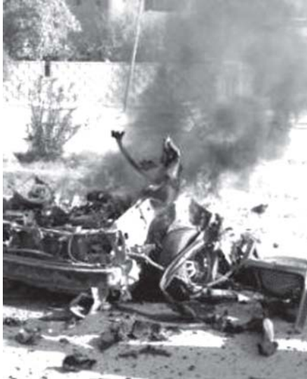
အီရတ်နိုင်ငံ တောင်ပိုင်း၌ လမ်းဘေးမှ ပေါက်ကွဲမှုကြောင့် ဖျက်စီးနေသည့် ယာဉ်ကို တွေ့ရစဉ်။ (ဓာတ်ပုံ-အင်တာနက်)

အာဖဂန်နစ္စတန်နှင့်ပါကစ္စတန်နယ်စပ်အနီး တာဒ်ဟင်ဒ ဒေသ၌ ဗုဒ္ဓပေါက်ကွဲမှု ဖြစ်ပွားရာ ဖျက်စီးနေသော ယာဉ်များနှင့် ကလေးငယ်များကို တွေ့ရစဉ်။ (ဓာတ်ပုံ-အင်တာနက်)