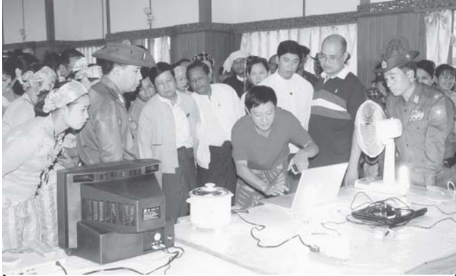
ရှမ်းပြည်နယ် အေးချမ်းသာယာရေးနှင့် ဖွံ့ဖြိုးရေးကောင်စီ (မြောက်ပိုင်း)ဥက္ကဋ္ဌ၊ အရှေ့မြောက်တိုင်း စစ်ဌာနချုပ် တိုင်းမှူး ဗိုလ်ချုပ်အောင်သန်းထွဋ် နေရောင်ခြည်ဖြင့် လျှပ်စစ်ဓာတ်အား ထုတ်ယူသုံးစွဲခြင်း သရုပ်ပြပွဲကို တက်ရောက်အားပေးစဉ်။ (သတင်းစဉ်)