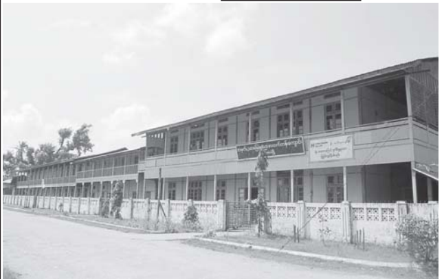
ဘိုကလေးမြို့ အမှတ် (၂) အခြေခံပညာ အထက်တန်း ကျောင်းကို တွေ့ရစဉ်။

ယခင် တစ်ဧက တင်း ၅၀ နှုန်းထွက်ခဲ့ရာက ယခု နိုင်ငံတော်က အသီးအားပေးသည့် ဓာတ်မြေဩဇာများ ထောက်ပံ့ပေးမှုကြောင့် တစ် ဧက တင်း ၈၀ ခန့် ထွက်ရှိလာမည့် ဘိုကလေးမြို့နယ် ဘုရားကျောင်း ကျေးရွာမှ စပါးခင်းကို တွေ့ရစဉ်။