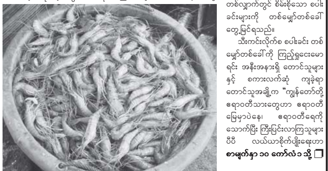
ရေလုပ်ငန်းများ ပုံမှန်လည် ပတ်နိုင်ခဲ့၍ ပုစွန်များအား ဖမ်း ဆီးရမိထားသည်ကို တွေ့ရစဉ်။

နိုင်ငံတော်၊ သစ်တောရေးရာ ဝန်ကြီးဌာနနဲ့ တိုင်းရင်းသား လုပ်ငန်းရှင်အဖွဲ့တွေက မြို့ပြနယ်လည် တည်ဆောက်ရေးအတွက် လိုအပ် ချက်တွေကို ဖြည့်ဆည်းပေးတဲ့ အတွက် မြို့အင်္ဂါရပ်နဲ့အညီ ပြန် လည် ဖွံ့ဖြိုးလာပါပြီ။ စာသင် မြောင်းတွေလည်း အမြန်ဆုံးပြုပြင် မွမ်းမံ တည်ဆောက်နိုင်ခဲ့လို့ ပညာသင်နှစ်အဆီ ကျောင်းတွေ