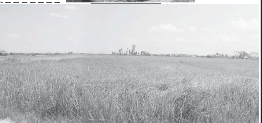
အတည်ပြုချိန် - ၃:၃၀

ယခင် တစ်ဧက တင်း ၅၀ နှုန်းထွက်ခဲ့ရာက ယခု နိုင်ငံတော်က အသီးအားပေးသည့် ဓာတ်မြေဩဇာများ ထောက်ပံ့ပေးမှုကြောင့် တစ် ဧက တင်း ၈၀ ခန့် ထွက်ရှိလာမည့် ဘိုကလေးမြို့နယ် ဘုရားကျောင်း ကျေးရွာမှ စပါးခင်းကို တွေ့ရစဉ်။