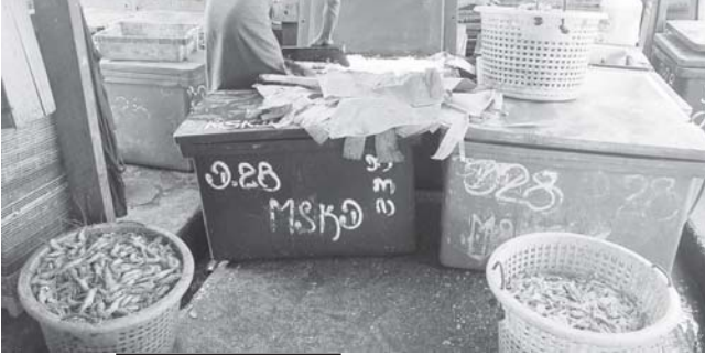
ရေလုပ်ငန်းများ ပုံမှန်လည် ပတ်နိုင်ခဲ့၍ ပုစွန်များအား ဖမ်း ဆီးရမိထားသည်ကို တွေ့ရစဉ်။

ဖမ်းဆီးရမိထားသော ငါး၊ ပုစွန်များအား အဝယ်ခိုင်များက ဝယ်ယူပြီး ပြန်လည်တင်ပို့ရောင်းချရန် စနစ်တကျ ပြင်ဆင်နေ ကြသည်ကို တွေ့ရစဉ်။