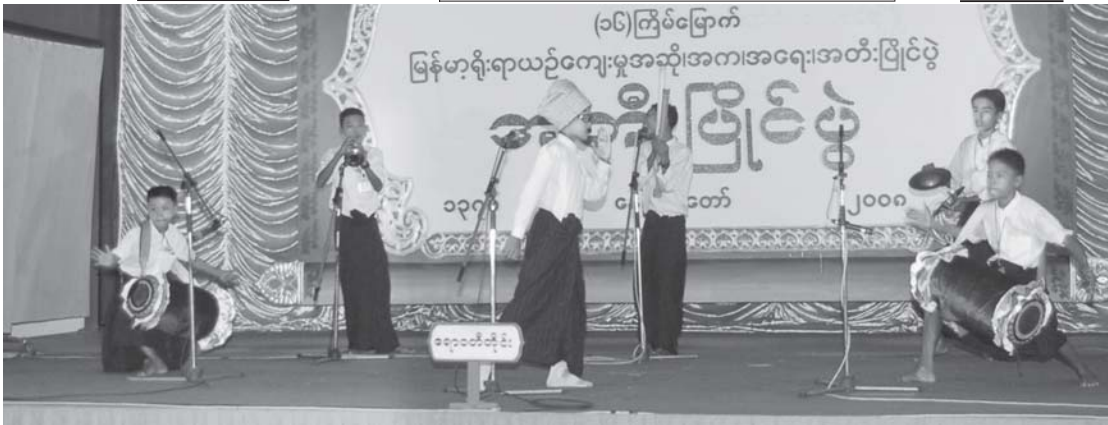
(၁၆)ကြိမ်မြောက်

မြန်မာ့ရိုးရာယဉ်ကျေးမှုအဆိုအက၊အရေးအတီးပြိုင်ပွဲ