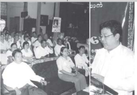
အတည်ပြုချိန် - ၃း၃၀

ရန်ကုန်မြို့နယ် အားမာန် အထွေထွေ စီးပွားရေးလုပ်ငန်း သမဝါယမအသင်း လီမိတက်၏ နှစ်ပတ်လည် အစည်းအဝေးကို အောက်တိုဘာ ၁၈ ရက်က ရန်ကုန်မြို့နယ် မိုးကောင်းလမ်း ရှိ အသင်းရုံးခန်းမ၌ ကျင်းပရာ ရန်ကုန်တိုင်း သမဝါယမဦးစီး ဌာန ဒုတိယညွှန်ကြားရေးမှူး ဦးသောင်းနိုင် အမှာစကား ပြောကြားစဉ်။