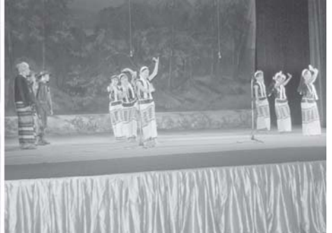
(၁၆)ကြိမ်မြောက် မြန်မာ့ရိုးရာယဉ်ကျေးမှု အဆို၊ အက၊ အရေး၊ အတီးပြိုင်ပွဲ၏ ပြဇာတ်ပြိုင်ပွဲတွင် လူငယ်အားမာန်ဗိုလ်ဆီသို့ခေါင်းစဉ် ဖြင့် ကရင်ပြည်နယ်တိုယ်စားပြု ပြဇာတ်အဖွဲ့ ပါဝင်ယှဉ်ပြိုင်စဉ်။