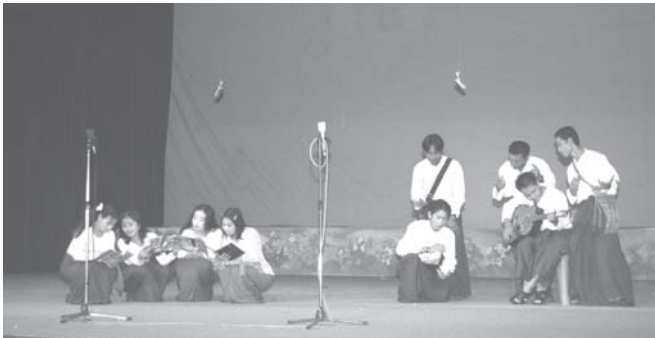
ယခုနှစ် ကျင်းပလျက်ရှိသော (၁၆)ကြိမ်မြောက် မြန်မာ့ရိုးရာယဉ်ကျေးမှု အဆို၊ အက၊ အရေး၊ အတီးဖြင့်ပွဲကြီး ပြဇာတ်ဖြင့်ပွဲတွင် လူငယ်အားမာန်နိယံဆီသိုခေါင်းစဉ်ဖြင့် အောက်တိုဘာ ၁၇ရက်က တနင်္သာရီတိုင်း ကိုယ်စားပြု ပြဇာတ်အဖွဲ့ ပါဝင်ယဉ်ပြိုင်ကြစဉ်။

လူသုံးဦးနှင့်ကသော ဇာတ်ပွဲမှာ မြေပိုင်းဇာတ်ဖြစ်သည်။ ဇာတ်မင်းသား၊ ဇာတ်မင်းသမီးနှင့် ဇာတ်ပိုးအက အမျိုးသားတစ်ဦး၊ တွရိယာ လေးငါးဦးနှင့် သလင်းပြောင်နေရာ၌ ညဉ့်အချိန် မီးတက်တိုင်ကြီးများ အလင်းရောင်အောက် ကပြသောဇာတ်ဖြစ်သည်။ ပွဲကြည့်သူတို့ မြေပြင်တွင် ဝိုင်းထိုင်ကြည့်ကြသည်။ ဤသုံးဦးနှင့် ဇာတ်နိပါတ်၊ ပုံပြင်၊ ရာဇဝင်၊ သိုက်သမိုင်းတို့ကို ဝိုင်းနိုင်စွာ ကပြခဲ့ရာ ကိုလိုနီခေတ်ဦးလောက်တွင် ပျောက်ကွယ်သွားသည်။