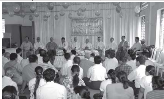
အတည်ပြုချိန် ၁၂၀