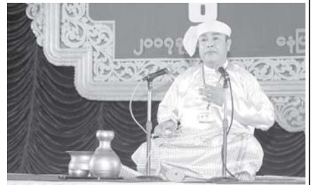
၂၀၀၇ခုနှစ် (၁၅)ကြိမ်မြောက် မြန်မာ့ရိုးရာယဉ်ကျေးမှု အဆို၊ အက၊ အရေး၊ အတီးဖြင့်ပွဲ ဝါသနာရှင်အဆင့်(ပထမတန်း) (အမျိုးသား) ကွက်စိပ်ဖြင့်ပွဲတွင် ဖြိုင်ပွဲဝင်တစ်ဦး ဟောပြောယဉ်ပြိုင်ခဲ့စဉ်။

ဒုတိယကမ္ဘာစစ်အတွင်း ဂျပန်ခေတ်က ခေတ်သစ်ပြဇာတ် ပေါ်ထွန်းလာပါသည်။ လျှပ်စစ်မီးမရှိ၊ ဗုံးကြဲမည်စိုး၍ ညဦး မထွန်းရ၊ ရုပ်ရှင်မပြရပါ။ နေ့ခင်းပြဇာတ်များ ပေါ်လာသည်။ ရန်ကုန် ကန်တော်ကြီး မြေကွက်လပ်တွင် ကပ်နီးကပ်ကာ ပြဇာတ်ရုံကြီး ဖြင့်ရုပ်ပွဲလားပြီး ရုပ်ရှင် အစားထိုးပြဇာတ်များ ကပြရသည်။ ရုပ်ရှင် ဒါရိုက်တာများ၏ ရုပ်ရှင်ဇာတ်ထုတ်ကို ကပြသည်။ ဟာသရသ၊ ကရုဏာ ရသ၊ အချစ် အလွမ်း အဆွေး စုပေါင်းဇာတ်များ ဖြစ်သည်။ သုံးနာရီထက်မကော့သော ဇာတ်များဖြစ်သည်။ ငယ်ကျွမ်းဆွေ၊ ဂုဏ်ရည်မတူ၊ ဗြိတိသျှ၊ တစ်ပါးကျွတ်ပေါ သက်စေရယ် စသော ဇာတ်များအပြင် သိုက်သမိုင်းများကိုလည်း ရုပ်ရှင်ဆန်ဆန် တင်ဆက်သေးသည်။ စစ်ပြီးခေတ်တွင် မော်ဒန်ပလေး ဝီရီပြိုင်ပြိုင် ပေါ်ထွန်းလာသည်။ ရန်ကုန်မြို့တွင် ကာဌေးရုံနှင့် ဝင်းဝင်းရုံဟူသော ပြဇာတ်ရုံနှစ်ရုံ၌ ခေတ်ပြဇာတ် အမြဲကသည်။ နယ်နှင့် အခြားနေရာများတွင်မူ ရုပ်ရှင်ရုံကို ပြဇာတ်ရုံအဖြစ် ပြောင်းကသည်။ နှစ်နာရီထက်မကော့သော ပြဇာတ်များ ဖြစ်ပြီး ဇာတ်ထုတ်ကို ရုပ်ရှင်ဒါရိုက်တာများက ရေးကာ ညွှန်ကြားပေးသည်။ ပြဇာတ် ဇာတ်ခုံကို အထူးပြုပြင်ရသည်။ ဆုံလည်၊ ရွှေလျား၊ ဆွဲချ၊ ခေါက်တင်၊ ဆက်တင် အမျိုးမျိုးတင်ဆင်ထားသည်။ ခေတ်ဂီတ ဝိုင်းသာသုံးပြီး ဇာတ်ဝင်သီချင်းများ သီးခြားရေးစပ် သီဆိုရသည်။ မီးနှင့်အသံပါ