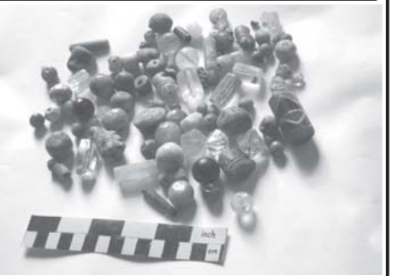
မိုင်းမောမြို့ဟောင်း ကုန်းအမှတ်(၁၃)မှ တွေ့ရှိရသော မြေတုံးငယ်အတွင်းမှ ပျူပုလင်းစေ့များ

ဟန်လင်းမြို့ဟောင်း ကုန်းအမှတ်(၂၇)သည် ဟန်လင်းမြို့ဟောင်းမြောက်ဘက်မြို့နယ်၏တောင်ဘက် ကိုက် ၁၅၀ ခန့်အကွာ တွင်တည်ရှိပြီး တူးဖော်သုတေသနပြုရာတွင် ပေါ်ထွက်လာသော အုတ်အဆောက်အအုံသည် အရှေ့ဘက်တွင် ဦးမာထင်၏ ယာကွက်၊ အနောက်ဘက်တွင် ဦးဘချီ၏ကြိုင်ခင်းယာကွက်အတွင်းတွင် တည်ရှိပါသည်။ ယင်းနေရာအား တူးဖော်သုတေသနပြုရာ တောင်မြောက်တန်းလျက် အုတ်နွဲ့တန်းတစ်ခုကို တောင်တွေ့ရှိရပြီး ယင်းအုတ်နွဲ့တန်းမှာ ပေ ၂၀၀ ခန့်ရှည်ပြီး အကျယ်