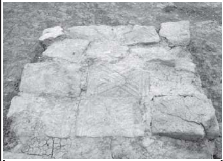
မိုင်းမောမြို့ဟောင်း ကုန်းအမှတ်(၁၂)မှ လက်စမ်းရာပါ ပျူခေတ်အုတ်ချပ်ကြီးများကို တွေ့မြင်ရပုံ

ဟန်လင်းမြို့ဟောင်းသည် ရွှေဘိုခရိုင် ဝက်လက်မြို့နယ်အတွင်း မြောက်လတ္တီကျု ၂၂ ဒီဂရီ ၂၀ မိနစ်နှင့် အရှေ့လောင်ဂျီကျု ၉၅ ဒီဂရီ ၄၉ မိနစ်အကြား ဟန်လင်းရွာတွင်ရှိပြီး မန္တလေး-ရွှေဘို မော်တော်ကား လမ်းပေါ်ရှိ စိုင်းခိုင်ကျေးမှ အရှေ့ဘက် ၁၁ မိုင်ခန့်၊ ရွှေဘိုမြို့မှ အရှေ့တောင်ဘက် ၁၀ မိုင် ငါးမာလုံအကွာတွင် တည်ရှိပါသည်။ ဟန်လင်းမြို့ဟောင်း၏ မြို့နယ်မှာ စတုရန်းပုံဖြစ်၍ တောင်မြောက်အလျား ပေ ၉၆၀၀ နှင့် အရှေ့အနောက်အနံ ပေ ၅၈၀၀ ခန့်ရှိပါသည်။