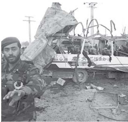
အာဖဂန်နီနီနီနီနီနီနီ ကတူးမြို့တွင် ကားပုံးခွဲ တိုက်ခိုက်မှု ကြောင့် အပျက်အစီးများကို တွေ့ရစဉ်။