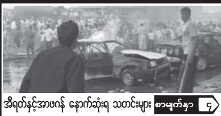
အီရတ်နှင့်အာဖဂန် နောက်ဆုံးရ သတင်းများ စာမျက်နှာ ၄

ယ နေ့ မြေမုန် နို င် င် တ က ဝ သ တ င် : မျ ဝ : အ ညွ န် :