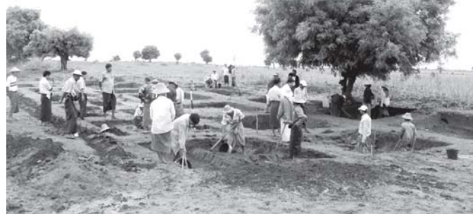
ဟန်လင်းမြို့ဟောင်း ကုန်းအမှတ်(၂၈)ကို တူးဖော် သုတေသနပြုနေပုံ

နှင့် ဟန်လင်းမြို့ဟောင်းတို့ကို မြန်မာ့လည်၍ သုတေသနပြု တူးဖော်လျက်ရှိပါသည်။ မြန်မာတို့၏ မြို့ပြယဉ်ကျေးမှု စတင်ထွန်းကားခဲ့ရာ ပျူယဉ်ကျေးမှု ဒေသများဖြစ်သော ဗီသနီး၊ တကောင်း၊ ဟန်လင်း၊ သရေ၊ ခေတ္တရာ၊ မိုင်းမောမြို့များကို တူးဖော်သုတေသနပြုပြီး ခိုင်မာသောသုတေသန တွေ့ရှိချက်များကို ဖော်ထုတ်နိုင်ခဲ့ပြီးဖြစ်ပါသည်။ ၂၀၀၈ ခုနှစ်ဇွန်လတွင် ရှေးဟောင်းသုတေသန၊ အမျိုးသားမြေတိုက်နှင့် စာကြည့်တိုက်ဦးစီးဌာန (မြောက်ပိုင်း) မန္တလေးဌာနခွဲမှ ပျူမြို့ဟောင်းများဖြစ်သော မိုင်းမောမြို့ဟောင်းနှင့် ဟန်လင်းမြို့ဟောင်းကို တူးဖော်သုတေသနပြုခဲ့ပါသည်။