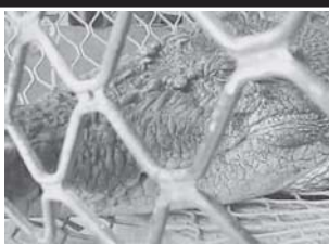
စိတ်ဝင်စားဖွယ် အင်တာနက် သတင်းများ စာမျက်နှာ ၁၀