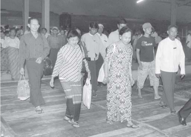
(၁၆)ကြိမ်မြောက် မြန်မာ့ဒီမိုကရေစီအဆင့်မြှင့်တင်ရေး အစီအစဉ်အရ အကယ်၍ အစိုးရအဖွဲ့သည် ပဏာမဆုံးဖြတ်ချက်ချမှတ်ပြီးနောက် အစိုးရအဖွဲ့၏ အမိန့်အတိုင်း အကောင်အထည်ဖော်ဆောင်ရွက်ရမည်။ (သတင်းစဉ်)

၂၀၁၀ ဘဏ္ဍာရေးနှစ်တွင် ပရောပန်ပွဲစဉ်များကို ကျင်းပလာတာ ယခုဆိုလျှင် ပွဲစဉ်(၄)သိပ်ပဲ ရောက်ရှိလာခဲ့ပြီ ဖြစ်ပါသည်။ ပရောပန်မှာ အုပ်စု(၉)အုပ်စုပါဝင်ပြီး လက်ရှိအဆိုရှိသူ ဒီနိုမတ်၊ ဝါနို၊ ပိုလန်၊ ဂျာနို၊ ဝီဂို၊ (၁)အုပ်စု၊ ဆာဒီးယား၊ အီတလီ၊ နိုနိုသာယာနိုတို့မှာ အုပ်စုစဉ်များအဖြစ် အသီးသီးရပ်တည်လျက် ရှိနေကြပါသည်။