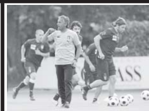
၂၀၁၀ ကမ္ဘာ့ ဖလား ခြေစစ်ပွဲ ဥရောပရန် ပွဲစဉ် များ စာမျက်နှာ ၁၁