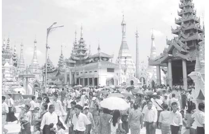
ရွှေတိဂုံစေတီတော်ရပ်ကွက်၌ သီတင်းကျွတ်လပြည့် (အဘိဓမ္မာအခါတော်နေ့)တွင် ဘုရားများဖြင့် စည်ကားလှက်ရှိသည်ကို တွေ့ရသည်။ (သတင်းစဉ်)

ဆူးလေစေတီတော်မြတ်ကြီး၏ သီတင်းကျွတ်ပွဲတော် အဘိဓမ္မာအခါတော်နေ့ကို မွန်းလွဲ ၁ နာရီတွင် ကျင်းပရာ တရားအဖွဲ့များက ပဌာန်းပါဠိဒေသနာတော်များကို ရွတ်ပွားသရဇ္ဈာယ်ပူဇော်