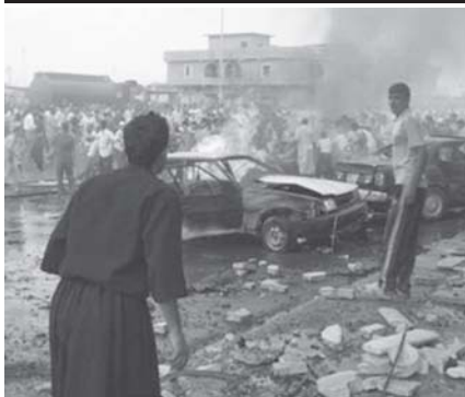
အီရတ်နိုင်ငံ ကီတူတမြို့တွင် ငွေဖြင့်တိုက်ခိုက်မှုဖြစ်ပွားပြီးနောက် အပျက်အစီးများကို တွေ့ရစဉ်။