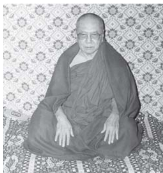
ဩဝါဒါစရိယ ဆရာတော်အဖြစ် ဆောင်ရွက်တော်မူခဲ့သည်။

ဆရာတော်သည် ညောင်တုန်းမြို့၊ ရွှေဟင်္သာတောရပိဋကတ္တသိပ္ပံကျောင်းတိုက်၌ ပထမပြန်စာမေးပွဲနှင့် မြှောစရိယတန်းဆိုင်ရာ စာဝါများကို (၂၈)နှစ်တိုင် သင်ကြားပို့ချတော်မူခဲ့ပြီး ပဌာန်းကျမ်းကို (၂၆)နှစ်တိုင် နှစ်စဉ် သင်ကြားပို့ချတော်မူခဲ့ပါသည်။ ဆရာတော်သည် ဆဌသဟိုတာရကအဖြစ်လည်းကောင်း၊ ပါဠိပိသောဓက အသိပညာနှင့် ဘာဏက အဖြစ်လည်းကောင်း ဆောင်ရွက်ခြင်း၊ ပထမအကြိမ် ဂိုဏ်းပေါင်းစုံ သံယုအဖွဲ့၌ စစ်ကိုင်းတိုင်းသံယုနာယကအဖွဲ့ဥက္ကဋ္ဌ(ရွှေကျင်)၊ တတိယအကြိမ် သံယုအဖွဲ့အစည်း၌ ရွှေကျင်နိကာယ၊ တိုင်းဩဝါဒါစရိယ၊ ပဉ္စမအကြိမ်မှစ၍ နိုင်ငံတော်