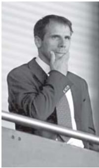
ဝက်ဟမ်းအသင်းပြသရာ များပြင် ရင်ဆိုင်နေရချိန်တွင် နည်းပြသစ်လီယာမာလည်း မိအား များပြင် ရင်ဆိုင်နေရချ

ယခုတလော ထွက်ပေါ်နေသည့် သတင်းများအရ ဝက်ဟမ်းဘက် အဖွဲ့အနေဖြင့် နောက်တစ်လအတွင်း ငွေကြေးခိုင်မာသည့် ပိုင်ရှင်တစ်ဦးဦး ထံသို့ လွှဲပြောင်းရောင်းချရမည်ဖြစ်ကြောင်း၊ ထိုသို့မရောင်းချနိုင်ပါက ဝက်ဟမ်းအသင်းအား ပြည်သူပိုင် သိမ်းပိုက်ရမည်ဖြစ်ကြောင်း သတင်းများက ဖော်ပြထားသည်။