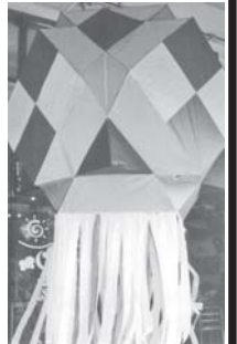
ကြိုးမားသော ဘီလူးမ မျက်တွင်း မီးပုံးကြီး

ဝါလကင်းလွတ် သီတင်း ကျွတ်ပြီဆိုလျှင် ငယ်ရွယ်သူ မြန်မာ ကလေးငယ်များနှင့် အရွယ်ရောက်ပြီးသူ မြန်မာ လူကြီးများ၏ ဘဝတို့တွင် မြန်မာရိုးရာ ယဉ်ကျေးမှု ထုံးတမ်းစဉ်လာ မြန်မာမှု လက်ရာများကို တွင်ကျယ်စွာ အသုံးပြုလာကြသည်ကိုတွေ့ရ သည်။ ထိုကာလတွင် မြန်မာ တို့၏ထုံးတမ်းစဉ်လာ ဓလေ့ ထုံးစံများကို ကြိုတင်ပြင်ဆင် ဆောင်ရွက်ကြသည်။