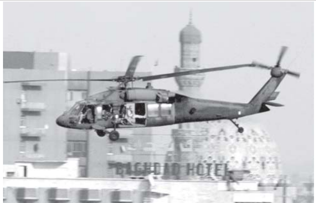
ဘဂ္ဂဒတ်ကောင်းကင်ယံမှ အမေရိကန် စစ်ရဟတ်ယာဉ်

“ဒါ ကျုပ်တို့ရှိ သူတို့ယူလာတာမို့လို့ လွတ်လပ်မှု ဆိုတာလား”ဟု အမေရိကန်များကိုရည်ရွယ်ကာ ဒေါသတကြီး အော်ဟစ်မေးခွန်းထုတ်သည်။ ထိုပြင် လူမျိုးတူ၊ ဘာသာတူချင်း ငွေခွဲတိုက်ခိုက် သတ်ဖြတ်သူများကိုလည်း ရေရွတ်ကျိန်ဆဲနေသည်။