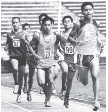
အမျိုးသား မီတာ ၈၀၀ အပြေးပြိုင်ပွဲ၌ ဖြိုင်ပွဲဝင်များ အကြိတ်အနယ်ယှဉ်ပြိုင်စဉ်။