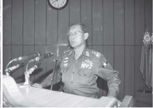
နေပြည်တော် အောက်တိုဘာ ၁၂

မြန်မာနိုင်ငံ ပညာရေးကော်မတီဥက္ကဋ္ဌ နိုင်ငံတော် အေးချမ်းသာယာရေးနှင့် ဖွံ့ဖြိုးရေးကောင်စီ အတွင်းရေးမှူး(၁) ခုတိယဗိုလ်ချုပ်ကြီး သီဟသူရတင်အောင်မြင်ဦးသည် ယနေ့နံနက်၈နာရီတွင် နေပြည်တော်ရှိ အမှတ်(၇) တည်းခိုဓနခန်းခန်းမဆောင်၌ ကျင်းပသော ပညာရေးဝန်ကြီးဌာန မြို့နယ်ပညာရေးမှူးများ ကျောင်းအုပ်ချုပ်မှု သင်တန်းဖွင့်ပွဲ အခမ်းအနားသို့ တက်ရောက်၍ အမှာစကား ပြောကြားသည်။ အဆိုပါ သင်တန်းဖွင့်ပွဲအခမ်းအနားသို့ လယ်ယာစိုက်ပျိုးရေးနှင့်ဆည်မြောင်းဝန်ကြီးဌာန ဝန်ကြီး ဗိုလ်ချုပ်ဌေးဦး၊ နယ်စပ်ဒေသနှင့် တိုင်းရင်းသားလူမျိုးများ ဖွံ့ဖြိုးတိုးတက်ရေးနှင့် စည်ပင်သာယာရေးဝန်ကြီးဌာန ဝန်ကြီး ဗိုလ်မှူးကြီးသိန်းညွန့်၊ ပညာရေးဝန်ကြီးဌာန ဝန်ကြီးဒေါက်တာချမ်းငြိမ်း၊ ယဉ်ကျေးမှုဝန်ကြီးဌာန ဝန်ကြီး ဗိုလ်ချုပ်ခင်အောင်မြင်၊ ခုတိယဝန်ကြီးများဖြစ်ကြသော ဗိုလ်မှူးချုပ် အောင်မျိုးမင်း၊ ဦးမျိုးညွန့်နှင့် သူရဦးသောင်းလွင်၊