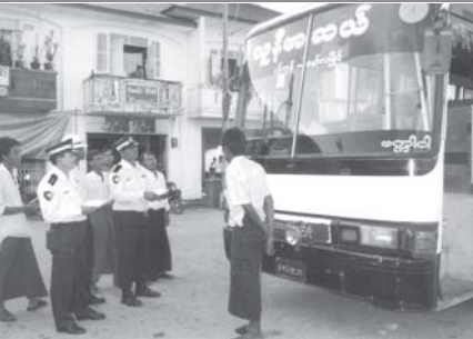
ယာဉ်ပတ်တစ်ဆူ လျော့နည်းပျောက်နေရောင်တောင်စစ်ဆေးမော်လမြိုင် အောက်တိုဘာ ၁၂

သီးနှံစိုက်ပျိုးထုတ်လုပ်သူများနှင့် ကုန်သွယ်ရောင်းဝယ် တင်ပို့ကြသူများအနေဖြင့် အချိန်အခါ ရာသီအလိုက် ခေတ်မီနည်းပညာများ အသုံးပြုစိုက်ပျိုးခြင်း၊ ပိုးမွှားကာကွယ်ခြင်း၊ ပုံမှန်ပေါင်းသင်ခြင်း၊ ကောက်ပဲသီးနှံများ စနစ်တကျ ရိုက်သိမ်းသိုလှောင်တင်ပို့ခြင်း၊ မှီအဆိပ်ထုတ်လုပ်သော မှီမျှင်များ မပေါက်ပွားရေး သတိပြုကာကွယ်လုပ်ဆောင်ကြခြင်းတို့ဖြင့် ကောက်ပဲသီးနှံများ အရည်အသွေးပိုမိုတိုးတက် ကောင်းမွန်လာမည်အပြင် စားသုံးသူများလည်း သဘာဝမှီအဆိပ်အန္တရာယ်မှ ကင်းဝေးနိုင်ကြမည် ဖြစ်ပါသည်။