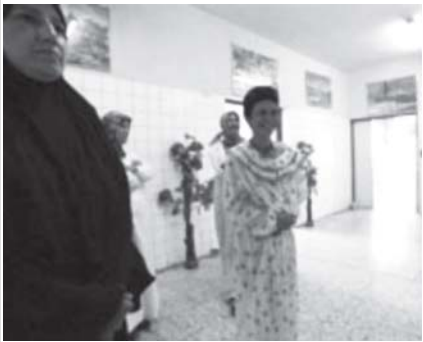
ဘဂ္ဂဒတ်မြို့၊ စိတ္တဝေဒနာရုံရှိ လူနာများကို ကြည့်ရှုနေသူများ (အင်တာနက်)