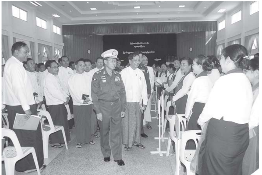
မြန်မာနိုင်ငံ ပညာရေးကော်မတီဥက္ကဋ္ဌ နိုင်ငံတော် အေးချမ်းသာယာရေးနှင့် ဖွံ့ဖြိုးရေးကောင်စီမှူး ဒုတိယဗိုလ်ချုပ်ကြီး သီဟသူရတင်အောင်မြင်ဦး၊ ပညာရေးဝန်ကြီးဌာန မြို့နယ်ပညာရေးမှူးများ ကျောင်းအုပ်ချုပ်မှု သင်တန်းဖွင့်ပွဲ အခမ်းအနားတွင် သင်တန်းသား၊ သင်တန်းသူ မြို့နယ်ပညာရေးမှူးများအား ရင်းရင်းနှီးနှီး နှုတ်ဆက်စဉ်။ (သတင်းစဉ်)

အထူးသဖြင့် နိုင်ငံတော်အကြီးအကဲအနေဖြင့် အခြေခံပညာကျောင်းများ၏ ပညာရေးအရည်အသွေး မြှင့်တင်ရေးတွင် ဘာသာရပ်အလိုက်