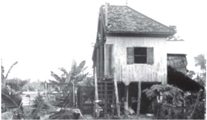
ကမ္ဘောဒီးယားနိုင်ငံ ပရိမန်ပြည်နယ်တွင် လင်မယားကွဲသဖြင့် နေအိမ်ကိုလွှဲပြောင်းထက်ခြင်းခွဲ၍ ယူသွားပြီးနောက် ကျန်ရစ်သော အိမ်ကို အောက်တိုဘာ ၁၀ ရက်က တွေ့ရ၏။