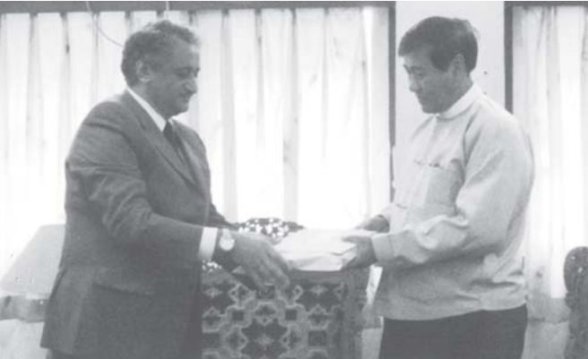
သုံးပွင့်ဆိုင် ဗဟိုအဖွဲ့ဥက္ကဋ္ဌ၊ နိုင်ငံခြားရေးဝန်ကြီးဌာန ဒုတိယဝန်ကြီး ဦးကျော်သူထံ ပြည်ထောင်စု မြန်မာနိုင်ငံတော်ဆိုင်ရာ ပါကစ္စတန်အစွလာမူစ် သမ္မတနိုင်ငံ သံအမတ်ကြီး မစ္စတာ ကာဒီအမ်ခါလီလူလား မုန်တိုင်းသင့်ဒေသများ၌ လူနေအိမ်ရာများ တည်ဆောက်ရေးအတွက် အလှူငွေများပေးအပ်စဉ်။(နိုင်ငံခြားရေး)

အာဆီယံ-မြန်မာ-ကုလသမဂ္ဂ သုံးပွင့်ဆိုင်ဗဟိုအဖွဲ့ဥက္ကဋ္ဌ၊ နိုင်ငံခြားရေးဝန်ကြီးဌာန ဒုတိယဝန်ကြီး ဦးကျော်သူ အား ရန်ကုန်မြို့၌ ပြည်ထောင်စု မြန်မာနိုင်ငံတော်ဆိုင်ရာ ပါကစ္စတန်အစွလာမူစ် သမ္မတနိုင်ငံ သံအမတ်ကြီး မစ္စတာ ကာဒီအမ်ခါလီလူလားသည် ယနေ့နံနက် ၁၁ နာရီတွင် ရန်ကုန်မြို့၌ နိုင်ငံခြားရေးဝန်ကြီးဌာန ဒုတိယ ဝန်ကြီး၏ ဧည့်ခန်းသို့ လာရောက်တွေ့ဆုံကာ မုန်တိုင်းသင့်ဒေသများ၌ လူနေအိမ်ရာများ တည်ဆောက်ရေးအတွက် အလှူငွေများပေးအပ်ကြောင်း သတင်းရရှိသည်။ (သတင်းစဉ်)