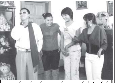
အချစ်ကလန်းတယ် ဟာသဇာတ်ကားမှ ဇာတ်ဝင်ခန်းတစ်ခန်းကို တွေ့ရစဉ်။

အောက်တိုဘာ၇ရက်ကရုပ်ရှင်ပြသမည် ဒါရိုက်တာမိုက်တီး၏ လက်ရာဖြစ်သည့် "အချစ်ကလန်းတယ် အလိုမလိုက်ဘူး" မြန်မာဇာတ်ကားသစ် အောက်တိုဘာ၇ရက်တွင် မြို့နယ်ရုံများ၌ ရုံတင်ပြသတော့မည်ဖြစ်သည်။ ၎င်းဇာတ်ကားတွင် လွင်မိုး၊ ရာဇာနေဝင်း၊ ခန့်စည်သူ၊ မြေတီဦး၊ လင်းဇာနည်ဇော်၊ ဒိုင်သင်းကြည်တို့ ခေါင်းဆောင် ပါဝင်ထားကြသည်။ (ကြေးမုံ)