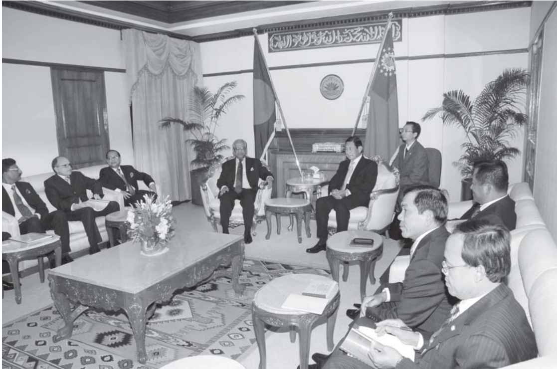
နေပြည်တော် အောက်တိုဘာ ၉