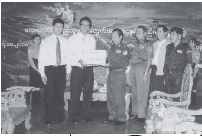
ခန့်အပ်၊ ဒဏ်ခံ၊ ဇွန်၊ ပန်းကန် စုစုပေါင်းငွေကျပ် ၁၀၀၇၇ သိန်းကို ပေးအပ်လှူဒါန်းပြီးဖြစ်သည်။

i Love Myanmar အဖွဲ့သည် လေဘေးသင့်ဒေသပြည်သူများအတွက် မှန်တိုင်းသင့် ဒေသဆောက်အုံများနှင့် စာသင်ကျောင်းများကို ဆက်လက် ဆောက်လုပ် လှူဒါန်းသွားမည်ဖြစ်ကြောင်း သတင်းရရှိသည်။ (သတင်းစဉ်)