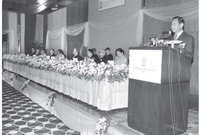
နိုင်ငံတော်အေးချမ်းသာယာရေးနှင့်ဖွံ့ဖြိုးရေးကောင်စီဥတိယဥက္ကဋ္ဌ ခုတိယဗိုလ်ချုပ်မှူးကြီးမောင်အေး စာတင်ပြောချက် ပြောကြားစဉ်။