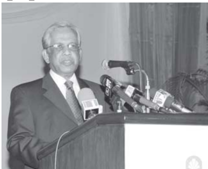
ဘက်လားဒေ့ရှ်ပြည်သူ့သမ္မတနိုင်ငံ အိမ်စောင့်အစိုးရအဖွဲ့ အကြံပေးအရာရှိချုပ် ဒေါက်တာ ဟန်ရဒင်အမက် ခါကာမြို့ရှိ Pan Pacific Sonargaon Hotel ၌ ကျင်းပသည့် ဂုဏ်ပြုညစာ စားပွဲတွင် နှုတ်ဆက်မိန့်ခွန်းပြောကြားစဉ်။ (သတင်းစဉ်)

နှင့် အရှေ့တောင်အာရှအကြား ပေါင်းကူးတက်ကြွပါကြောင်း၊ ဤသို့ဖြင့် မိမိတို့နှစ်နိုင်ငံသည် ဒေသဆိုင်ရာအဖွဲ့အစည်းများဖြစ်သည့် ARF၊ BIMSTEC နှင့် ACD တို့၌ အတူတကွပူးပေါင်းပါဝင်လျက်ရှိကြပါကြောင်း၊ ယနေ့ ဒုတိယဗိုလ်ချုပ်မှူးကြီးမောင်အေး၏ ခရီးစဉ်သည် နှစ်နိုင်ငံ ဆက်ဆံရေးကို အရှိန်အဟုန် မြှင့်တင်နိုင်မည့်အခွင့်အလမ်းဖြစ်သည်ဟု နိုင်ငံခေါင်းများ ယုံကြည်ပါကြောင်းဖြင့် ပြောကြားသည်။ ဆက်လက်၍ ဒုတိယဗိုလ်ချုပ်မှူးကြီးမောင်အေးက ပြန်လည် မိန့်ခွန်း ပြောကြားရာတွင် အဆွေတော်တို့ နိုင်ငံသို့ ပထမဦးဆုံးအကြိမ်အဖြစ်