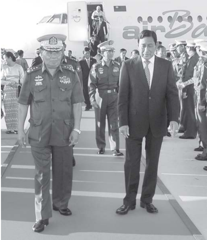
နိုင်ငံတော် အေးချမ်းသာယာရေးနှင့် ဖွံ့ဖြိုးရေးကောင်စီဥက္ကဋ္ဌ၊ တပ်မတော် ကာကွယ်ရေးဦးစီးချုပ် ဗိုလ်ချုပ်မှူးကြီးသန်းရွှေ ဘင်္ဂလားဒေ့ရှ်ပြည်သူ့သမ္မတနိုင်ငံ ချစ်ကြည်ရေးခရီးမှ ပြန်လည်ရောက်ရှိလာသည့် နိုင်ငံတော် အေးချမ်းသာယာရေးနှင့် ဖွံ့ဖြိုးရေးကောင်စီ ဒုတိယ ဘက်မတော်ကာကွယ်ရေး ဦးစီးချုပ်၊ ကာကွယ်ရေးဦးစီးချုပ်ကြီး(ကြည်း) ဒုတိယဗိုလ်ချုပ်မှူးကြီးမောင်အေးနှင့် ဇနီး ဒေါ်မြမြစန်းတို့အား နေပြည်တော်လေဆိပ်၌ ကြိုဆိုနှုတ်ဆက်စဉ်။

ဗိုလ်ချုပ်ကြီးသူရဓမ္မန်း၊ နိုင်ငံတော်ဝန်ကြီးချုပ် ဗိုလ်ချုပ်ကြီးသိန်းစိန်နှင့် ဇနီး ဒေါ်ခင်ခင်ဝင်း၊ ကာကွယ်ရေးဝန်ကြီးဌာနမှ ဒုတိယဗိုလ်ချုပ်ကြီးမြင့်လှိုင်၊ ဗိုလ်ချုပ်မောင်ရွှိန်၊ ဗိုလ်ချုပ်အုန်းမြင့်၊ ဗိုလ်ချုပ်မင်းအောင်လှိုင်၊ ဗိုလ်ချုပ်ကိုကို၊ ဗိုလ်ချုပ်သာအေး၊ စစ်ရေးချုပ် ဗိုလ်ချုပ်သူရမြင့်အောင်နှင့် ကာကွယ်ရေးဝန်ကြီးဌာနမှ ဗိုလ်ချုပ်လှထွန်းဝင်း၊ နေပြည်တော်တိုင်းစစ်ဌာနချုပ် တိုင်းမှူး ဗိုလ်ချုပ်ဝေလွင်နှင့် ၎င်းတို့၏ဇနီးများ၊ ပို့ဆောင်ရေးဝန်ကြီးဌာန ဝန်ကြီး ဗိုလ်ချုပ်သိန်းအောင်၊ တပ်မတော်အရာရှိကြီးများ၊ အစိုးရအဖွဲ့မှ ညွှန်ကြားရေးမှူးချုပ် ဗိုလ်မှူးကြီးသန့်ရှင်းနှင့် ဌာနဆိုင်ရာ အကြီးအကဲများ၊ ပြည်ထောင်စု မြန်မာနိုင်ငံတော်ဆိုင်ရာ ဘင်္ဂလားဒေ့ရှ်ပြည်သူ့သမ္မတနိုင်ငံသံရုံးမှ သံရုံးယာယီတာဝန်ခံ Mr. Golam Mostafa နှင့် ဇနီး၊ စစ်သံမှူး Brig-Gen ANM Shawkat Jamal နှင့် ဇနီးနှင့် တာဝန်ရှိသူများက နေပြည်တော်လေဆိပ်တွင် ကြိုဆိုနှုတ်ဆက်ကြသည်။