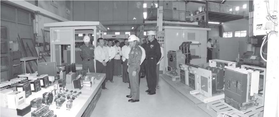
စားသောက်ကုန်၊ အဝတ်အထည်၊ ကုန်ကြမ်းပစ္စည်း၊ ဓာတ်သတ္တုပစ္စည်း၊ လူသုံးကုန်ပစ္စည်း၊ အိမ်သုံးပစ္စည်း၊ စိုက်ပျိုးရေး ကိရိယာထုတ်ပစ္စည်း၊

မြောက်ဥက္ကလာပ စက်မှုဇုန်သည် ယခင်က စက်မှုလက်မှုရပ်ကွက် တစ်ခုသာဖြစ်ပြီး ၁၉၉၈ ခုနှစ်တွင် စက်မှုဇုန်အဖြစ် အဆင့်မြှင့်တင်နိုင်ခဲ့ကာ လည်ပတ်စက်ရုံ ၉၅ နှ့် လုပ်သားအင်အား ၄၂၄၅ ဦးတို့ဖြင့်