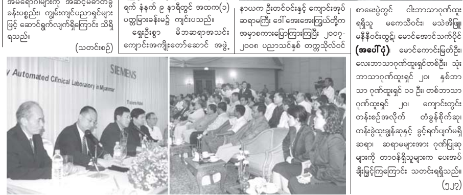
အတည်ပြုချိန် ၁၁၀၀

ရန်ကုန် အောက်တိုဘာ ၉ ရန်ကုန်တောင်ပိုင်းခရိုင် သန်လျင် မြို့ အမှတ်(၁) အခြေခံပညာအထက် တန်းကျောင်း မိဘဆရာအသင်း ကျောင်းအကျိုးတော်ဆောင် အဖွဲ့ နှစ်ပတ်လည်အစည်းအဝေးနှင့် ပညာ ရည်ချွန်ဆုပေးပွဲကို အောက်တိုဘာ ၅ ရက် နံနက် ၉ နာရီတွင် အထက(၁) ပညာပြားခန်းမ၌ ကျင်းပသည်။ ရွှေဦးစွာ မိဘဆရာအသင်း ကျောင်းအကျိုးတော်ဆောင် အဖွဲ့