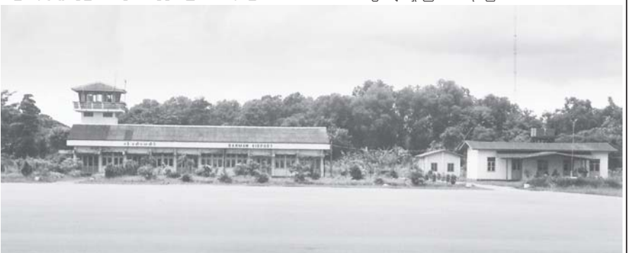
ပန်းမော်လေဆိပ် အဆောက်အအုံနှင့် လေယာဉ်ပြေးလမ်းတို့ကို တွေ့ရစဉ်။

တိုးချဲ့ခြင်းနှင့်လေယာဉ်ရပ်နားရာနေရာ ပေ၃၀၀×၂၀၀အား နိုင်ငံလွန်ကတ္တရာဖြင့် ထပ်ပိုးလွှာတင်ခြင်းလုပ်ငန်းဆောင်ရွက်ရန် လျာထားချမှတ်ဆောင်ရွက်ခဲ့သည်။ ယခုအခါတွင် တည်ဆောက်မှုလုပ်ငန်းများ အားလုံးပြီးစီး၍ လေယာဉ်ပြေးလမ်း ဇီးတပ်ဆင်မှုလုပ်ငန်းသာကျန်ရှိနေရာ ပြေးလမ်းဇီးတပ်ဆင်မှုမှာလည်း ရာခိုင်နှုန်းပြည့်နီးပါး ပြီးစီးနေပြီဖြစ်ကြောင်း သိရသည်။