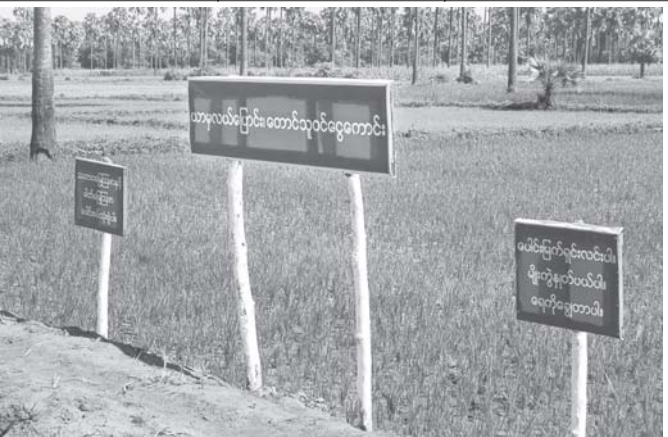
ဆားလင်းကြီးမြို့နယ် ဖောင်းကတောကျေးရွာတွင် ထပ်ဆင့်မြစ်ရေတင်စနစ်ဖြင့် ယာယုလင်းမြို့နယ်ရှိ စိုက်ပျိုးရေးသော စပါးစိုက်ခင်းများကို တွေ့ရစဉ်။ (သတင်း-ဖော်ပြခြင်း) (သတင်းစဉ်)

အမတ်ကလေးရွာ၌ အိမ်အလုံး ၅၀၊ အိုင်မရွာ၌ အိမ်အလုံး ၈၀၊ သာယာကုန်းရွာ၌ အိမ်အလုံး ၅၀ စုစုပေါင်း လူနေအိမ် ၂၃၀ အတွက် FEC ၁၃၈၀၀၀တက်ယအကြိမ်တွင်လပွတ္တာမြို့နယ် ဆားချက်အုပ်စုသိပ္ပံကုန်းကြီးကျေးရွာ၌ အိမ် ၈၀လုံး၊ ပိတောက်ကုန်းကျေးရွာ၌ အိမ် ၄၆လုံး၊ သာလှူမတောကျေးရွာ၌ အိမ်အလုံး ၁၅၀၊ ဆားချက်ကျေးရွာ၌ အိမ်အလုံး ၁၈၀၊ ကကရီကျေးရွာ၌ အိမ် ၁၆ လုံး စုစုပေါင်း လူနေအိမ်အလုံး ၅၂၀ အတွက် ငွေ