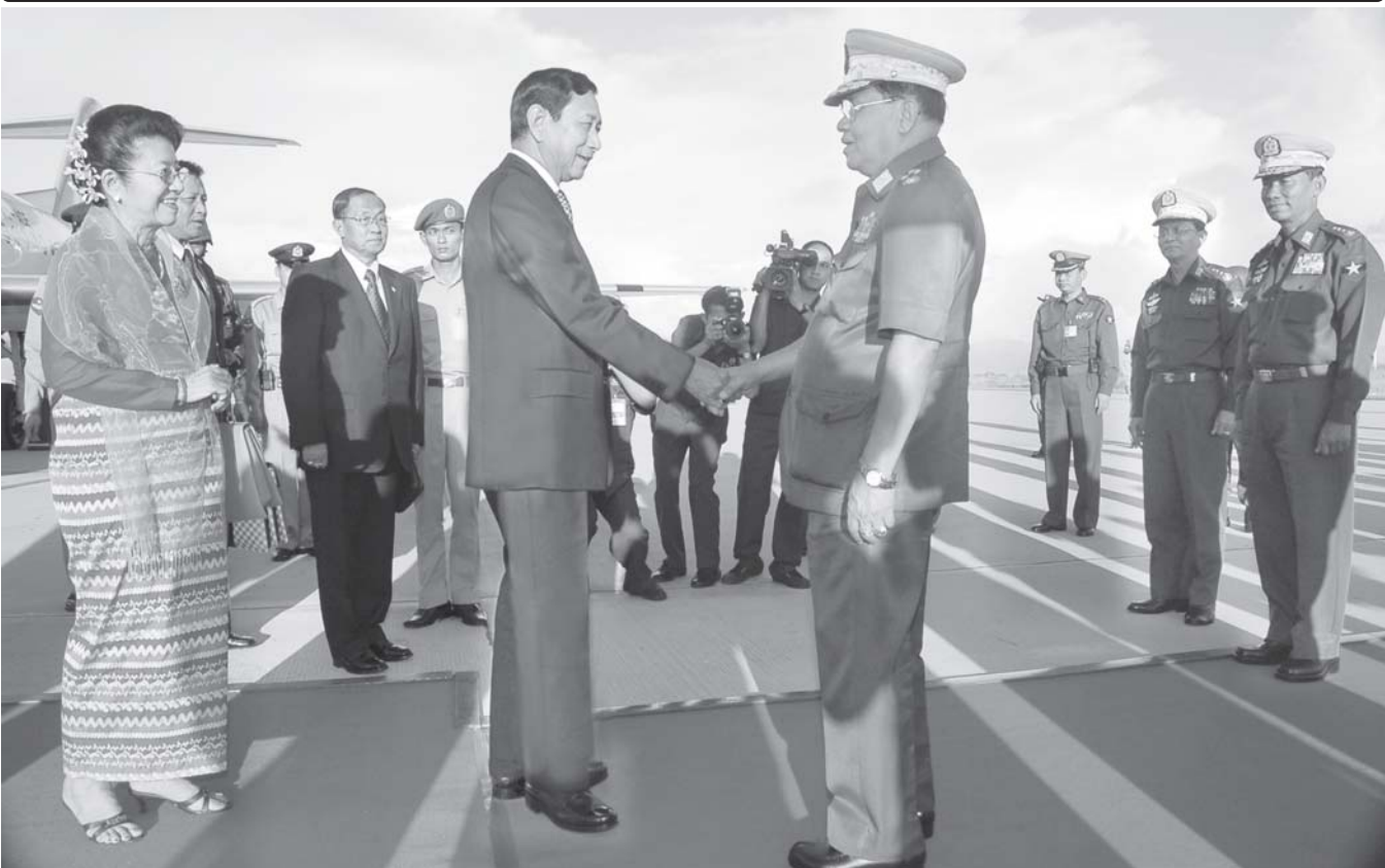
နေပြည်တော် အောက်တိုဘာ ၉

နိုင်ငံတော် အေးချမ်းသာယာရေးနှင့် ဖွံ့ဖြိုးရေးကောင်စီ ဒုတိယဥက္ကဋ္ဌ ဒုတိယဗိုလ်ချုပ်မှူးကြီးမောင်အေးနှင့် ဇနီး ဒေါ်မြမြစန်းတို့အား ကြိုဆိုနှုတ်ဆက်