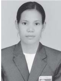
(၅)တိုက်တန်း ဂွဗ္ဘဆန်းဆို၊ အမျိုးသမီးပြိုင်ပွဲတွင် ရွှေတံဆိပ်၊ ဆွတ်ခူးရရှိခဲ့သည့် မြန်မာ ဂွဗ္ဘအားကစားအဖွဲ့မှ စီမံခန့်ခွဲမှု

အင်းလေးကန်သည် မြန်မာနိုင်ငံ၏ ထူးခြားသော တောင်ပေါ်ပင်လယ်ဟု ခေါ်ဆိုကြသည်။ ပြည်ပလေ့လာရေးခရီးသည်များနှင့် နိုင်ငံတော်အတွင်း