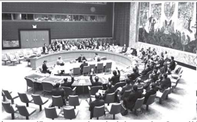
နယူးယောက်မြို့၊ ကုလသမဂ္ဂအဆောက်အအုံတွင် စက်တင်ဘာ ၂၇ ရက်က လုံခြုံရေးကောင်စီ အစည်းအဝေး ကျင်းပနေစဉ်။

၂၀၀၇ခုနှစ်နျူကလီးယားသဘောတူ စာချုပ်အရ မြောက်ကိုရီးယားသည် သံတမန်ရေးရာ လိုက်လျောမှု၊ စွမ်းအင်ထောက်ပံ့မှုတို့နှင့် အလံအလွယ်အဖြစ် နျူကလီးယားအစီအစဉ်ဆက်လက်မဆောင်ရွက်ဘဲ နောက်ဆုံး ဖျက်သိမ်းသည်အထိ ဆောင်ရွက်ရမည်ဖြစ်သည်။ သို့သော်