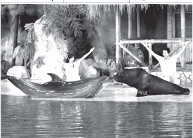
တရုတ်နိုင်ငံ ပေကျင်းမြို့ရှိ ရေသတ္တဝါပြတိုက်တွင် လင်းပိုင်နှင့် ပင်လယ်ဖျံတို့ လေ့ကျင့်ပေးသူများ စေခိုင်းချက်ကို လိုက်နာကာ နမ်းနေကြသည်ကို စက်တင်ဘာ ၂၆ ရက်က တွေ့ရစဉ်။