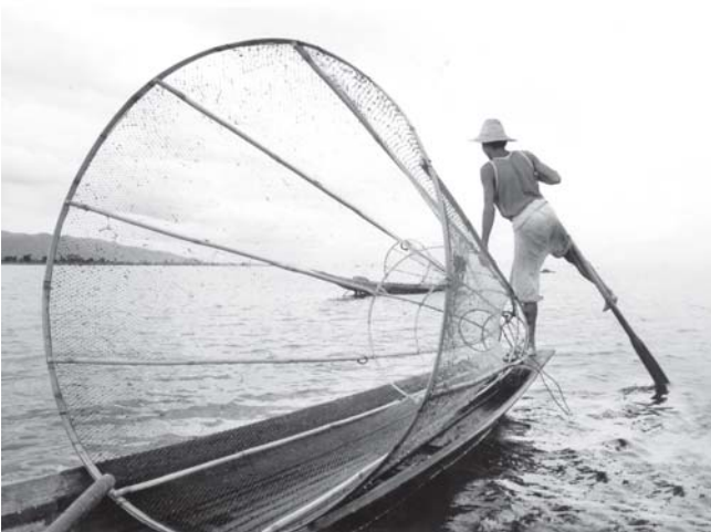
အင်းလေးကန်တွင် ရေလုပ်ငန်းအသက်မွေးဝမ်းကျောင်းပြု အင်းသားတစ်ဦး။

သတင်းဆောင်းပါး-ခင်မောင်သန်း(စက်မှု)၊ စာတိုပုံ-စိုးညွန့်(ကြေးမုံ)