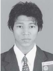
စားမောက်ပြိုင်ပွဲတွင် ရွှေတံဆိပ်ဆွတ်ခူးရရှိခဲ့သည့် မြန်မာ ဂွဗ္ဘအားကစားအဖွဲ့မှ အောင်စည်သူ။