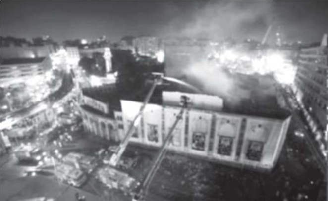
အီဂျစ်နိုင်ငံ ကိုင်နိုမြို့ရှိ အမျိုးသား ကဇာတ်ရုံ မီးလောင်နေသည်ကို စက်တင်ဘာ ၂၇ ရက်က မီးသတ်တပ်ဖွဲ့များ ငြိမ်းသတ်နေစဉ်။