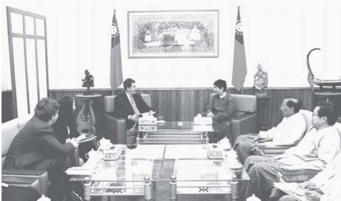
ကျန်းမာရေးဝန်ကြီးဌာန ဝန်ကြီး ဒေါက်တာကျော်မြင့်အား 3.D Fund Board ဥက္ကဋ္ဌ ပြည်ထောင်စု မြန်မာနိုင်ငံတော်ဆိုင်ရာ ယူနိုက်တက်ကင်းဒမ်းနိုင်ငံ သံအမတ်ကြီး Mr. Mark Canning နှင့် အဖွဲ့ လာရောက်တွေ့ဆုံပွဲ

နေပြည်တော် စက်တင်ဘာ ၂၇ ကမ္ဘာ့စာပေတိုက်နေ့ (World Post Day) အထိမ်းအမှတ်အဖြစ် အသက် (၁၅)နှစ်နှင့်အောက် နိုင်ငံတကာ လူငယ်များ ပေးစာရေးပြိုင်ပွဲကို ကုလသမဂ္ဂပညာ သိပ္ပံနှင့်ယဉ်ကျေးမှု အဖွဲ့ (UNESCO)နှင့် ကမ္ဘာ့စာပေတိုက်သမဂ္ဂ (UPU)တို့၏ အစီအစဉ်ဖြင့် ဆက်သွယ်ရေး စာတိုက်နှင့် ကြေးမုံနန်းဝန်ကြီးဌာန ဆက်သွယ်ရေး ညွှန်ကြားမှုဦးစီးဌာနနှင့် ပညာရေး ဝန်ကြီးဌာန ပညာရေးစီမံကိန်းနှင့် လေ့ကျင့်ရေးဦးစီးဌာနတို့က နှစ်စဉ် ပူးပေါင်းညှိနှိုင်း ကျင်းပလာခဲ့ရာ ၂၀၁၈ခုနှစ် (၃၇)ကြိမ်မြောက် ပေးစာရေးပြိုင်ပွဲကို "Write a letter to someone to tell them why the world need tolerance" ခေါင်းစဉ်ဖြင့် ၂၀၀၈ခုနှစ် ဇန်နဝါရီ ၁၃ ရက်တွင် မြို့နယ်များအလိုက် အခြေခံ