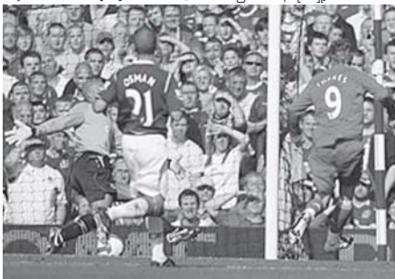
လီဗာပူးအတွက် ဦးဆောင်ဂိုးကို ဗာနန်ဒိုတောရက်စ်က ဤကဲ့သို့ သွင်းယူပေးခဲ့ပုံ။

လီဗာပူးကို နှစ်ဂိုးပေးလိုက်ရပေမယ့် အိမ်ရှင်အဗာတန်တို့ဟာ စိတ်ဓာတ်ကျမသွားဘဲ လူစားလဲမှုတွေပြုလုပ်ပြီး ချေပွဲပြန်ရရှိနေအောင်တိုက်ကြိုးစားလာတာကို တွေ့ရပါတယ်။ ဒါကြောင့် ပွဲဟာအနည်းပယ်ပြိုင်ဆိုင်မှု ပြင်းထန်လာတာကို တွေ့ရပါတယ်။ ပွဲချိန် ၇၈မိနစ် အရောက်မှာတော့ အဗာတန်ကစားသမားတင်ကာပေးလ် အနီကတ်ပြုပြီး အထုတ်ခံခဲ့ရပါတယ်။ နောက်ပိုင်းမှာ အဗာတန်က ချေပွဲဂိုးရနေကြပြီးသေးသလို လီဗာပူးတို့ကလဲ ဂိုးထပ်မံရရှိနေကြပြီးစားကြရင်း ပွဲအပြီးမှာ လီဗာပူးက အဗာတန်ကို နှစ်ဂိုး-ဂိုးမရှိနဲ့ အနိုင်ရရှိခဲ့ပါတယ်။ ယခုတွေ့တဲ့ အဗာတန်မှာ ဖယ်လိုင်နီ၊ ယာကူဘူ၊ ဖိလစ်နီဇီလ်တို့ အပါကတင်