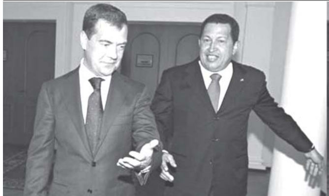
ရုရှားသမ္မတ ဒီမီထရီမက်ဗီဒေဝ်နှင့် ငင်နီဇွီးယားသမ္မတ ဟိုဂို ချာပတ်တို့အား စက်တင်ဘာ ၂၆ ရက်က တွေ့ရစဉ်။