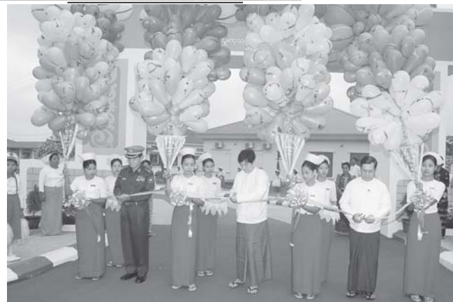
ပြည်ထောင်စုကြံ့ခိုင်ရေးနှင့် ဖွံ့ဖြိုးရေးအသင်း ဗဟိုအလုပ်အမှုဆောင် ဦးဆောင်ရေးဝန်ကြီးဌာန ဝန်ကြီး ဗိုလ်ချုပ်သိန်းဆွေ၊ နယ်စပ်ဒေသနှင့် တိုင်းရင်းသားလူမျိုးများ ဖွံ့ဖြိုးတိုးတက်ရေးနှင့် စည်ပင်သာယာရေးဝန်ကြီးဌာန ဝန်ကြီး ဗိုလ်မှူးကြီးသိန်းညွန့်နှင့် ကျန်းမာရေးဝန်ကြီးဌာန ဝန်ကြီး ဒေါက်တာကျော်မြင့်တို့ နေပြည်တော်ပြည်သူ့ဆေးရုံကြီး (ဒုတိယ-၁၀၀၀) အထူးကုသမှုဌာနများ ဖွင့်ပွဲအထိမ်းအမှတ် မုခ်ဦးကို ဖဲကြီးဖြတ်၍ ဖွင့်လှစ်ပေးကြစဉ်။

ရန်ပုံငွေဖြင့် အဆင့်မြင့် ဆေးရုံသုံး ပစ္စည်းကိရိယာ အမျိုးပေါင်း ၁၅၂ မျိုးကို နိုင်ငံခြားငွေ အမေရိကန်ဒေါ်လာ ၃ ဒသမ ၂ သန်းဖြင့် ဝယ်ယူ ဖြည့်ဆည်းထားပြီးဖြစ်သည်။ တိုးချဲ့သည့် အထူးကုဌာနများမှာ နှလုံးသေးကုသခန်း၊ နှလုံးခွဲစိတ်ကုသခန်း၊ ရင်ခေါင်းဆေးကုသခန်း၊ ရင်ခေါင်း ခွဲစိတ်ကုသခန်း၊ ကျောက်ကပ်ဆေးကုသခန်း၊ ကျောက်ကပ်ခွဲစိတ်ကုသခန်း၊ ဦးနှောက်နှင့် အာရုံကြောဆေးကုသခန်း၊ ဦးနှောက်နှင့် အာရုံကြော ခွဲစိတ်ကုသခန်း၊ အစာအိမ်နှင့် အူလမ်းကြောင်း ဆေးကုသခန်းနှင့် အသားရောဂါ အထူးကုဌာနတို့ ဖြစ်သည်။ အထူးကုဌာနများအပြင် နှလုံးသွေးကြောရောဂါ စိမ်းသစ်ကုသခန်း၊ အဆင့်မြင့်ခွဲစိတ်ခန်း၊ လေးခန်းပါ ခွဲစိတ်ခန်းနှင့် ဒုတိယရပ်လုံးပါ အလုပ်အလျောက် ဗဟိုထိန်းချုပ် စနစ်ပါသော အဆင့်မြင့်အထူးကြပ်မတ် ကုသဌာနများကိုလည်း တပ်မလမ်းညွှန်နိုင်ပြီဖြစ်သည်။ ယနေ့ စတင်ဖွင့်လှစ်ဆောင်ရွက်သည့် နှလုံးသွေးကြောရောဂါ စိမ်းသစ်ကုသခန်း၊ နှလုံးရောဂါ အထူးကြပ်မတ် ကုသဌာနနှင့် အထူးကုဌာန ၁၀ ခုအတွက် နိုင်ငံတော်အကြီးအကဲ၏ လမ်းညွှန်ချက်အရ ကျန်းမာရေးဝန်ကြီးဌာန အနေဖြင့်