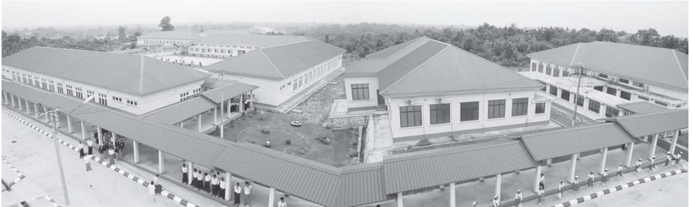
နေပြည်တော် စက်တင်ဘာ ၂၇

နေပြည်တော်ပြည်သူ့ဆေးရုံကြီး (ခုတင်-၁၀၀၀) အထူးကုသမှုဌာနများ ဖွင့်ပွဲအခမ်းအနားကို ယနေ့နံနက် ၈ နာရီတွင် နေပြည်တော်ရှိ အဆိုပါ ပြည်သူ့ဆေးရုံကြီး၌ ကျင်းပရာ နေပြည်တော်တိုင်းစစ်ဌာနချုပ် တိုင်းမှူး၊ ဗိုလ်ချုပ်ဝေလွင် တက်ရောက်ချီးမြှင့်၍ ဖွင့်ပွဲအထိမ်းအမှတ် ကမ္ဘာ့ဆေးကုသမှုများကို စိတ်ချမ်းမြေ့စွာ ခံယူနိုင်မည်ဖြစ်သည်။