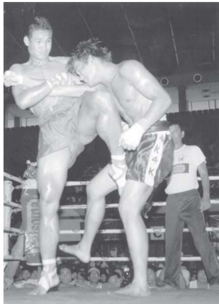
စောပဂရေမှူး (K.L.N)က ဖိုးကေ (မန္တလေး)ကို ခူးဖြင့် တိုက်နေစဉ်။