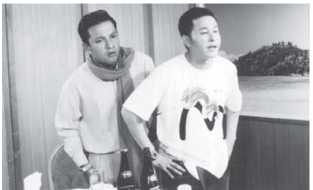
‘အချစ်ကလန်းတယ်’ ဟာသဇာတ်ကားမှ ခန့်စည်သူနှင့် မင်းမော်ကွန်းတို့၏ သရုပ်ဆောင်ဟန်။