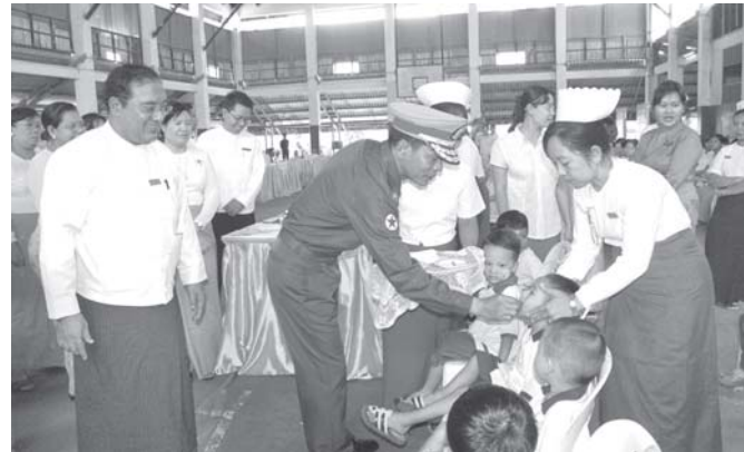
အခမ်းအနားအပြီးတွင် တိုင်းမှူး နှင့်တာဝန်ရှိသူများသည် ကလေးငယ် များအား စိတာမင်အေ ဆေးလုံးတိုက် ကျွေးခြင်း၊ ကိုယ်ဝန်ဆောင် မိခင်များ အား သံဓာတ်အားဆေးနှင့် စိတာမင် B1 ဆေးများ ဝေငှခြင်းနှင့် အိမ်သုံး ဆေးတွင် အိုင်အိုဒိုင်းဓာတ်ပါဝင်မှု ရှိ မရှိ စစ်ဆေးကြကြောင်း သတင်းရရှိ သည်။ (သတင်းစဉ်)

ရန်ကုန် စက်တင်ဘာ ၂၇ ရန်ကုန်တိုင်း ကျန်းမာရေးကော်မတီက ကြီးမားကျယ်ပဝသော ရန်ကုန်တိုင်း ၂၀၁၈ ခုနှစ် အာဟာရဖွံ့ဖြိုးရေး ရက်သတ္တပတ် ဖွင့်ပွဲအခမ်းအနားကို ယမန်နေ့ ဗွန်းလွဲ ၁ နာရီတွင် ဒဂုံမြို့နယ် အမှတ်(၁) အခြေခံပညာ အထက်တန်းကျောင်း၊ ဒဂုံသီရိခရီးမ၌ ကျင်းပရာ ရန်ကုန်တိုင်း အေးချမ်းသာယာရေးနှင့် ဖွံ့ဖြိုးရေးကောင်စီ ဥက္ကဋ္ဌ၊ ရန်ကုန်တိုင်းစစ်ဌာနချုပ် တိုင်းမှူး ဗိုလ်မှူးချုပ်ဝင်းမြင့် တက်ရောက်၍ အမှာစကားပြောကြားပြီး မုကြို အရွယ်ကလေးငယ်များအတွက် အာဟာရပြည့်ဝသော အစားအစာ အချက်အပြုတ်ဖြင့်ပွဲတွင် ပထမဆုံး သန့်လျင်မြို့နယ်၊ ခုတ်ယူဆုရ ကြည့်မြင်တိုင်မြို့နယ်နှင့် တတိယဆုရ ပုဇွန်တောင်မြို့နယ်တို့မှ အာဟာရ ချက်ပြုတ်ရေးအဖွဲ့ များအား ဆုများအပ်ချီးမြှင့်သည်။ ထို့နောက် ရန်ကုန်တိုင်း ကျန်းမာ ရေးကော်မတီ ဥက္ကဋ္ဌ၊ ရန်ကုန်တိုင်း အေးချမ်းသာယာရေးနှင့် ဖွံ့ဖြိုးရေး ကောင်စီ အတွင်းရေးမှူး ဦးလှစိုးနှင့် အမှတ်(၄)အခြေခံပညာဦးစီးဌာန၊ ခုတ်ယူ ညွှန်ကြားရေးမှူးချုပ် ဦးမျိုးမြင့်တို့က တိုင်းအဆင့် အာဟာရဖွံ့ဖြိုးရေး ရက်သတ္တပတ် အထိမ်းအမှတ် စာစီ စာကုံးပြိုင်ပွဲ အခြေခံပညာ အထက် တန်း၊ အလယ်တန်းနှင့် မူလတန်း အဆင့်ဖြင့်ပွဲများတွင် ပထမ၊ ဒုတိယ နှင့် တတိယရရှိသော ကျောင်းသား၊ ကျောင်းသူများအား ဆုများပေးအပ် ချီးမြှင့်ကြသည်။ ယင်းနောက် ရန်ကုန်တိုင်းကျန်းမာ ရေးကော်မတီ အတွင်းရေးမှူး တိုင်း ကျန်းမာရေးဦးစီးဌာနမှူး ဒေါက်တာ လှမြင့်က အာဟာရဖွံ့ဖြိုးရေး ရက်သတ္တပတ်လုပ်ငန်းများ ဆောင် ရွက်ခြင်းနှင့် စပ်လျဉ်း၍ ရှင်းလင်း တင်ပြသည်။