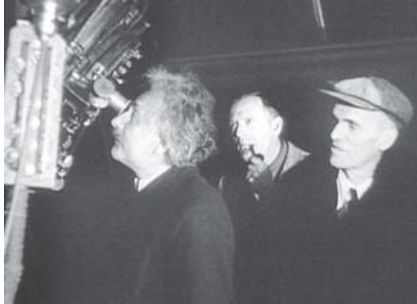
သိပ္ပံပညာရှင် အိုင်းစတိုင်းနှင့် ၎င်းအသုံးပြုခဲ့သည့် မှန်ပြောင်းတို့ကို တွေ့ရစဉ်။

နိုင်ငံတကာ ပင်လယ်ရေကြောင်းအဖွဲ့ချုပ်သည် သဘာဝပတ်ဝန်းကျင် ထိန်းသိမ်းရေးနှင့် ကမ္ဘာကြီး ပူနွေးမှုတိုက်ဖျက်ရေး နိုင်ငံတကာ လုပ်ငန်းများတွင်လည်း ပါဝင်လှုပ်ရှားလျက်ရှိကြောင်း လေ့လာစေ့ငုတင်ပြလိုက်ရပေသည်။