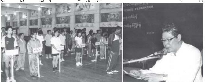
အတည်ပြုချိန် ၃၁၅

ပြိုင်ပွဲကို စက်တင်ဘာ ၂၈ ရက်အထိ အဆိုပါ ခန်းမ၌ နေ့စဉ် နံနက် ၉ နာရီမှ စတင်ကျင်းပမည်ဖြစ်ပြီး ပြိုင်ပွဲသို့ ဝန်ကြီးဌာနများမှ ပြိုင်ပွဲဝင်အသင်း ဆယ်သင်း ပါဝင်ယှဉ်ပြိုင်ကြကာ စုစုပေါင်းပြိုင်ပွဲ ကိုးရက် ကျင်းပသွား မည်ဖြစ်ကြောင်း သတင်းရရှိသည်။ (သတင်းစဉ်)