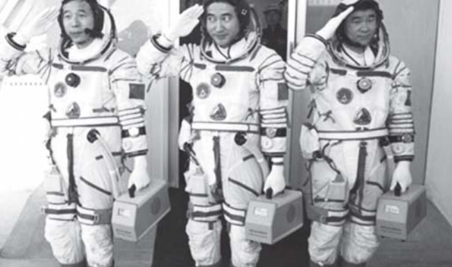
အတည်ပြုချိန် ၃၁၅