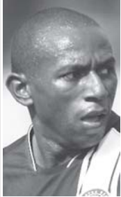
ချယ်လ်ဆီးသို့ ရောက်ရှိလာသည့်ဘရာဇီးကွင်းလယ်ကစားသမား မီနိုလ်ရိုး