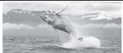
သဘာဝသတ္တလောက သတင်းဆောင်းပါး စာမျက်နှာ-၁၀