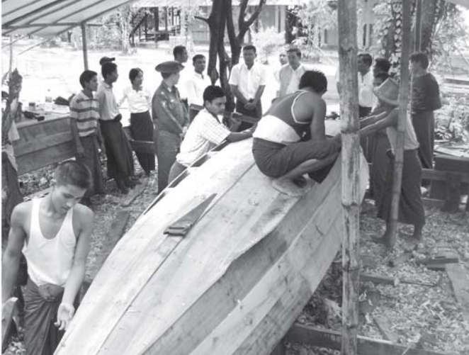
ရွှမ်းအင်ဝန်ကြီးဌာန ဝန်ကြီး ဗိုလ်မှူးချုပ်လွန်းသီ တော်ခရမ်းကျေးရွာအုပ်စုအတွင်းရှိ ကျေးရွာများအတွက် သုံးပွင့်ဆိုင် ဗဟိုအဖွဲ့မှ လှူဒါန်းသည့်လှေများ တည်ဆောက်နေမှုအခြေအနေကို ကြည့်ရှုစစ်ဆေးစဉ်။ (သတင်းစဉ်)