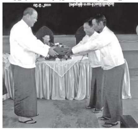
ပြည်ထောင်စုကြံ့ခိုင်ရေးနှင့် ဖွံ့ဖြိုးရေးအသင်း ဗဟိုအတွင်းရေးမှူး ဆက်သွယ်ရေး၊ စာတိုက်နှင့်ကြေးနန်းဝန်ကြီးဌာန ဝန်ကြီး ဗိုလ်မှူးချုပ်သိန်းဇော်၊ မြစ်ကြီးနားမြို့နယ် နောင်နန်းကျေးရွာ၌ ပြည်ထောင်စုကြံ့ခိုင်ရေးနှင့် ဖွံ့ဖြိုးရေးအသင်း ဝတ်စုံများနှင့် ထောက်ပံ့ငွေများ ပေးအပ်စဉ်။ (သတင်းစဉ်)

ဆက်လက်၍ တိုင်းမှူးနှင့် ဗဟိုအတွင်းရေးမှူး ဝန်ကြီးတို့သည် နောင်နန်းကျေးရွာ ပြည်ထောင်စုကြံ့ခိုင်ရေးနှင့် ဖွံ့ဖြိုးရေးအသင်းက ဖွင့်လှစ်ထားသည့် ကျေးရွာအခမဲ့ ဆေးခန်းသို့ ဝင်ရောက်ကြည့်ရှုအားပေးကြပြီး ဆေးခန်း၌ အသုံးပြုရန် ထောက်ပံ့ငွေများကို ပေးအပ်ခဲ့ကြောင်း သတင်းရရှိသည်။ (သတင်းစဉ်)