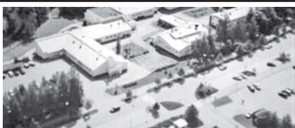
အင်တာနက် မူခင်းသတင်း စာမျက်နှာ-၅

ကလေးတွေ အားရှိအောင် သန်မာထူးကျွမ်းအောင် နို့မှုန့်တွေ ဖိတိုက်ကြရာက မမွှေလင့်တဲရလဒ် ပေါ်လာတဲ့အတွက် မိဘတွေ သာမက နို့မှုန့်ထုတ်လုပ်သူတွေက ဌာနဆိုင်ရာတွေက အလုပ် ရှုပ်ကုန်ကြတယ်။