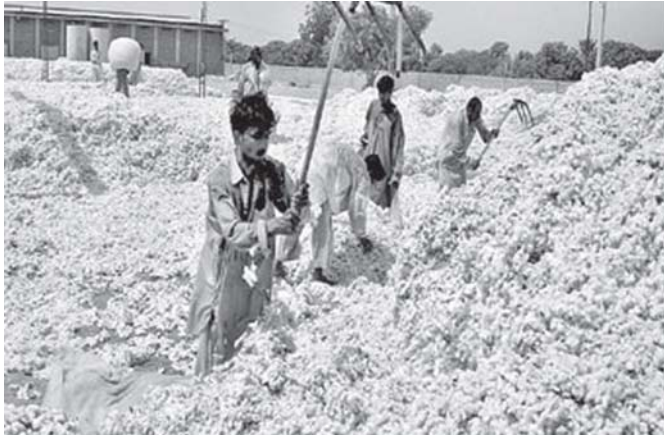
ပါကစ္စတန်နိုင်ငံအလယ်ပိုင်းရှိ ဝါအဝယ်နိုင်ငံတစ်ခုတွင် လုပ်ငန်း ခွင်ဝင်နေကြသည့် ဝါလုပ်သားများကို စက်တင်ဘာ ၂၂ ရက်က တွေ့ရစဉ်။